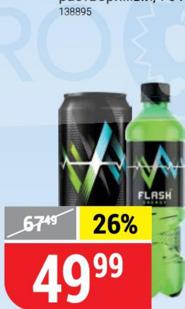
НАПИТОК FLASH UP энергетический, кофеин- таурин, 0,45-0,5 л 148347/119956