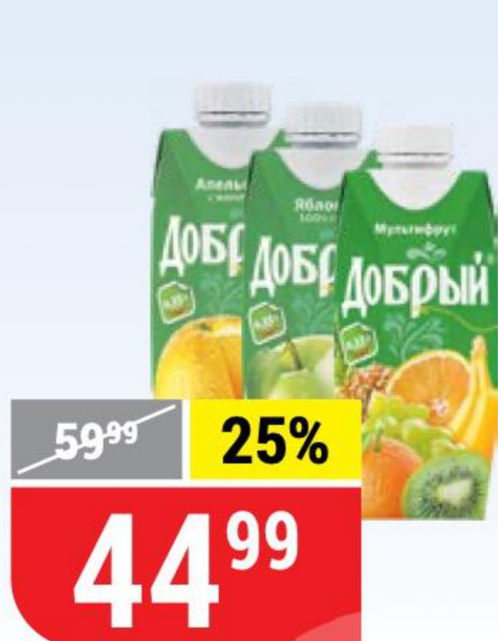
НЕКТАР И СОК ДОБРЫЙ в ассортименте, 0,33 л 118970/118971/118972/154488