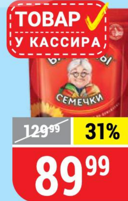
СЕМЕЧКИ БАБКИНЫ жареные, 300 г 107388