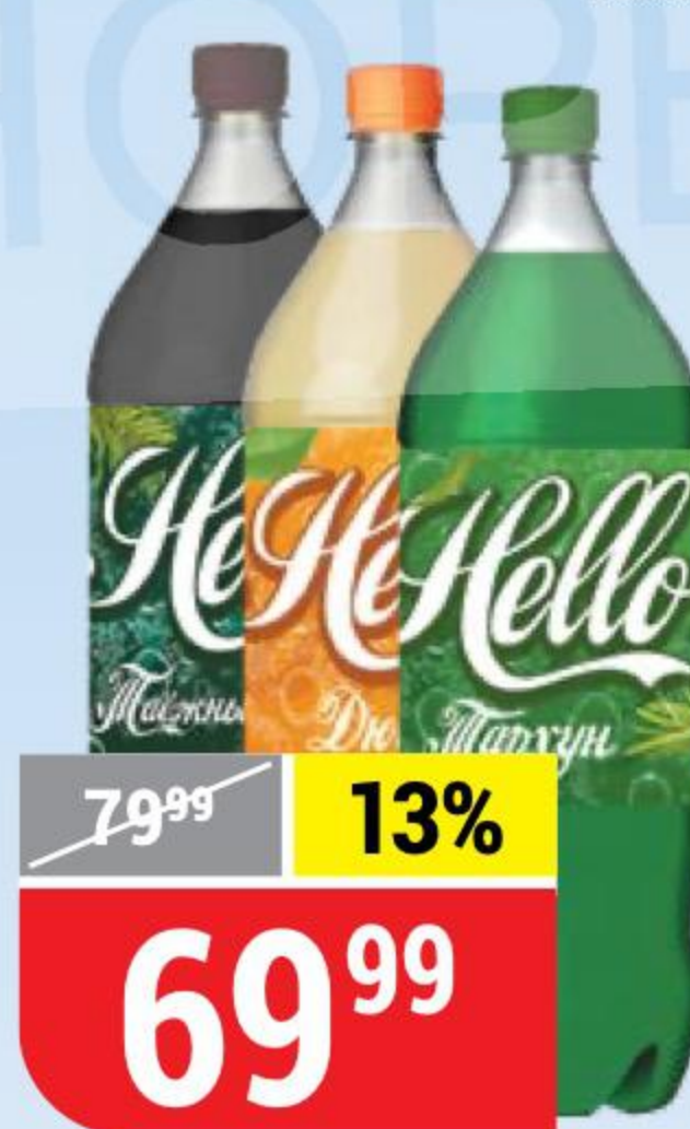
НАПИТОК HELLO в ассортименте, 2 л 151337/151356/151360