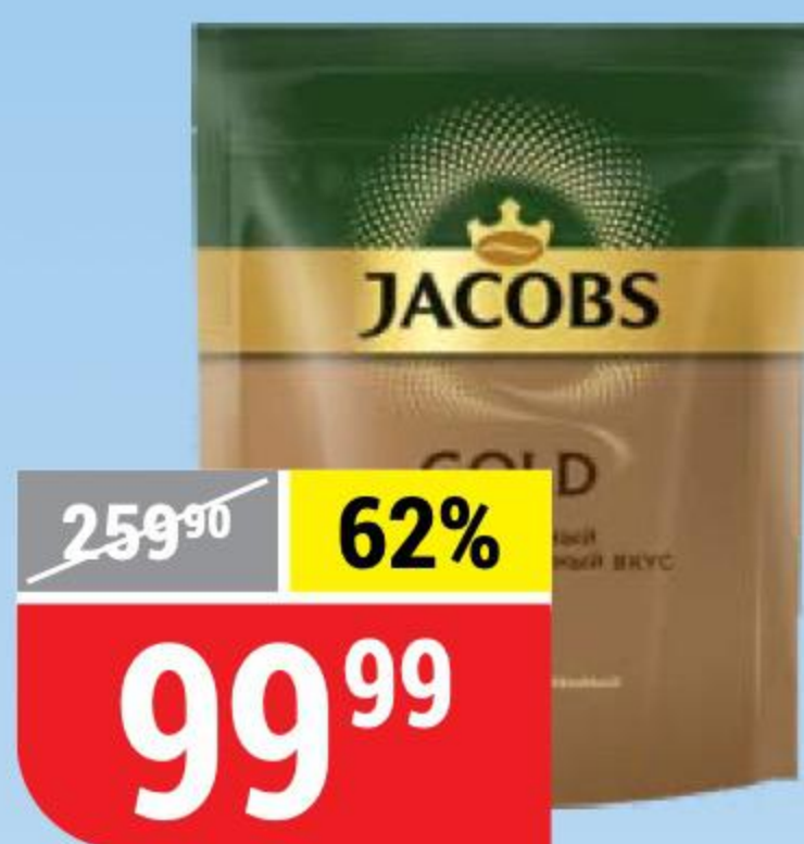
КОФЕ JACOBS gold, натуральный, растворимый, 70 г 138895