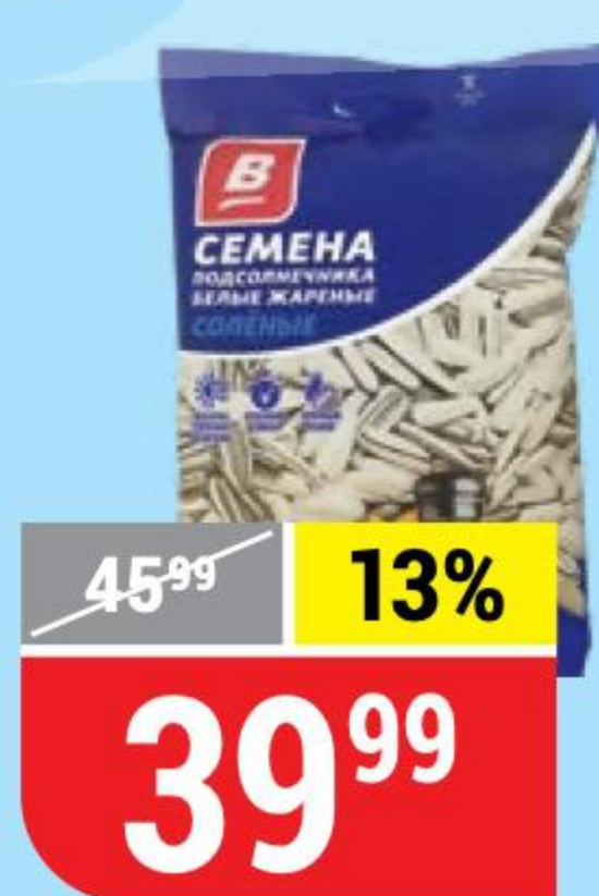
СЕМЕЧКИ ПОДСОЛНЕЧНИКА белые, 100 г 141995