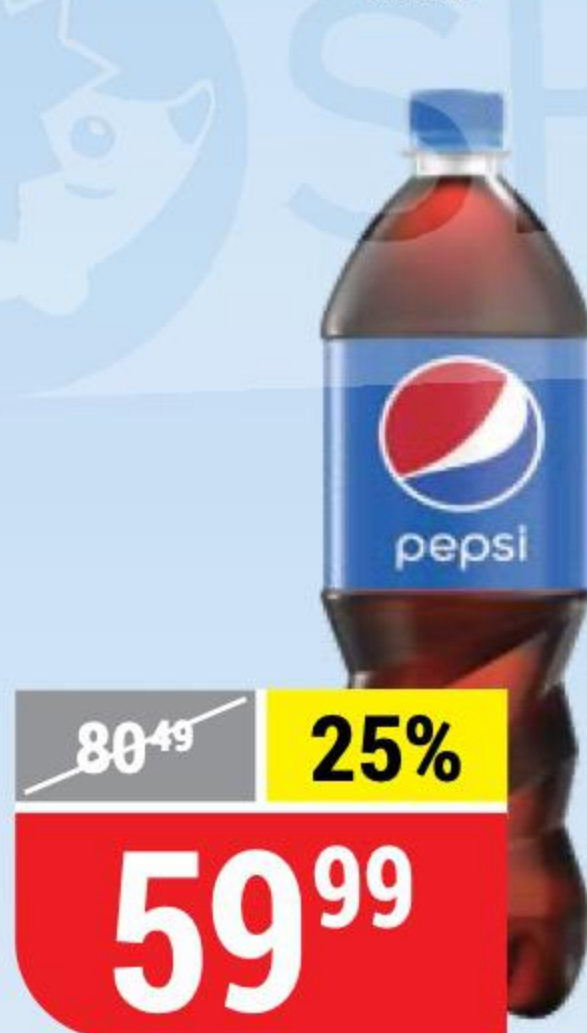
НАПИТОК PEPSI 1 л 133671