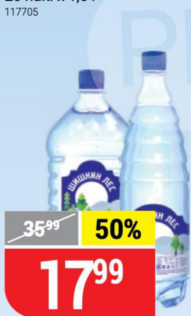
ВОДА ШИШКИН ЛЕС питьевая, газированная; негазированная, 1 л 102478/102476