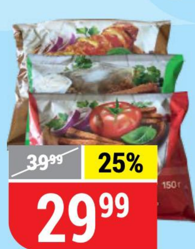
СУХАРИКИ % в ассортименте, 150 г 139854/139855/139853