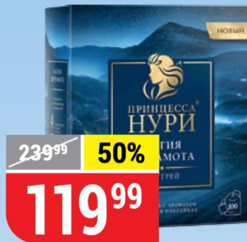
ЧАЙ ПРИНЦЕССА НУРИ магия бергамота, 100 пак. x 2 г 138220