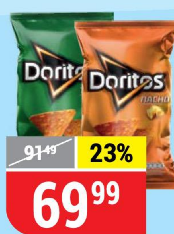
ЧИПСЫ КУКУРУЗНЫЕ DORITOS в ассортименте, 100 г 144646/144647