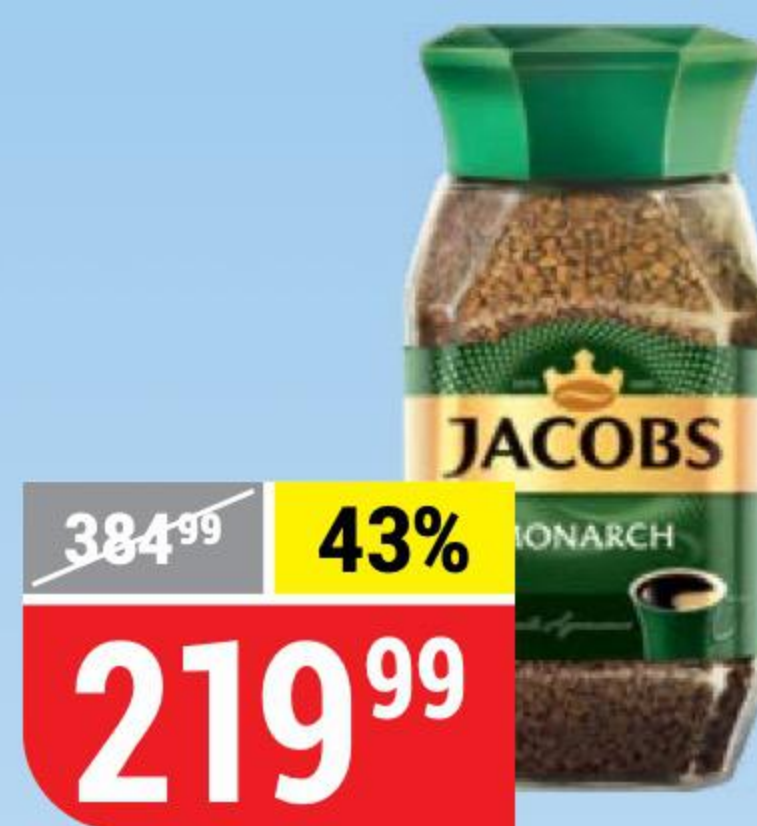
КОФЕ JACOBS MONARCH растворимый, 95 г 100875