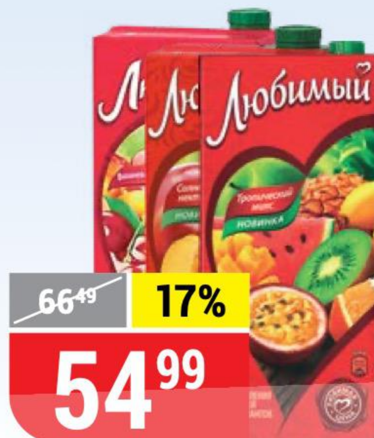
НАПИТОК И НЕКТАР ЛЮБИМЫЙ в ассортименте, 0,95 л 102670/118263/127260/127263/137178