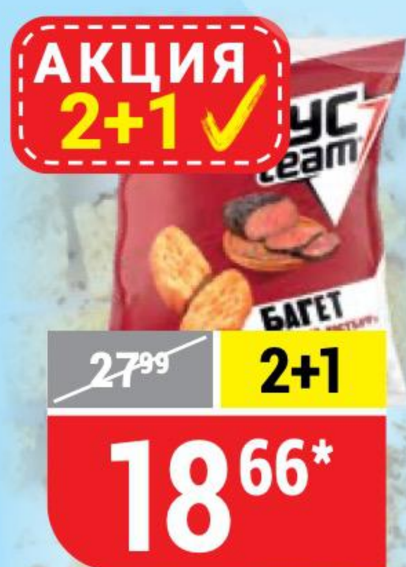
СУХАРИКИ ХРУСТЕАМ багет, пикантный ростбиф, 45 г 146729