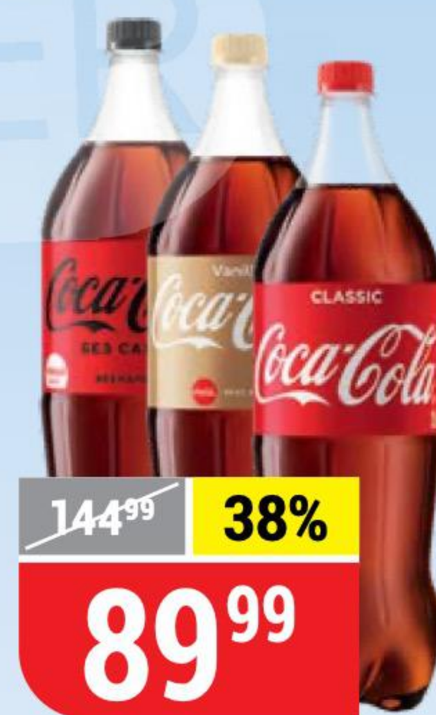
НАПИТОК СОСА-COLA в ассортименте, 2 л 101789/157134/157136