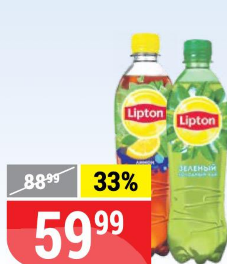
ХОЛОДНЫЙ ЧАЙ LIPTON в ассортименте, 0,5 л 121846/121847