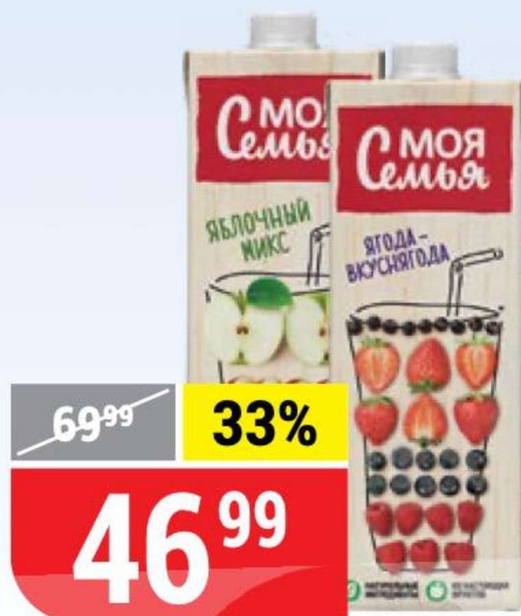
НЕКТАР МОЯ СЕМЬЯ в ассортименте, 0,95 л 136401/136403