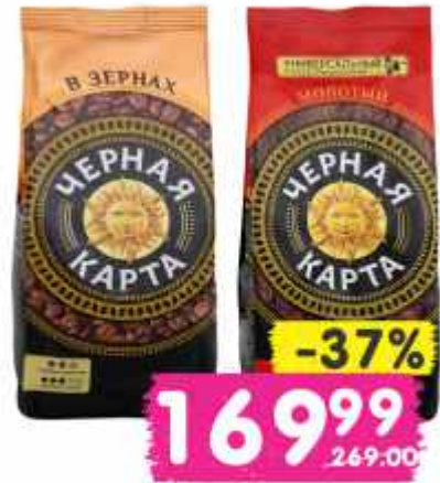
Кофе "Черная Карта", в зернах, молотый, 250 г