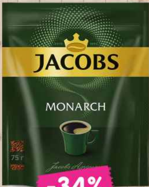
Кофе "Якобс Монарх", 75 г