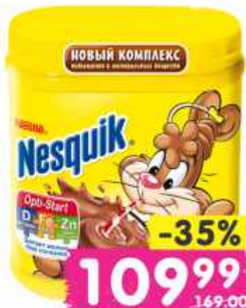
Какао "Несквик", 250 г