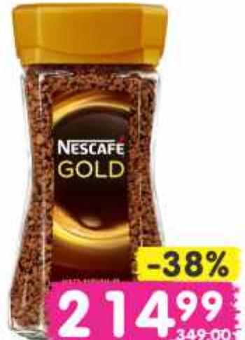
Кофе "Нескафе Голд", 95 г