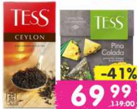
Чай "Тесс", пина колада, мохито, флирт зеленый, цейлон, 20-25 пак.