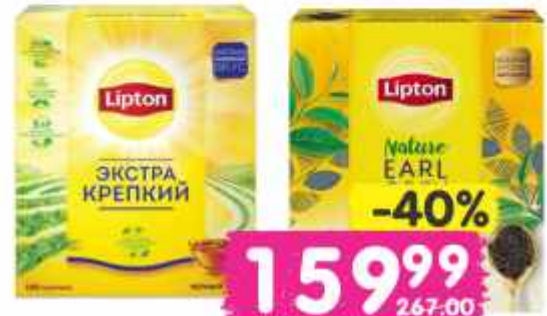
Чай "Липтон", английский завтрак, экстра крепкий, эрл грей, 100 пак.