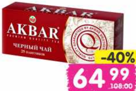
Чай "Акбар", классический, золотой черный цейлонский, 25 пак.