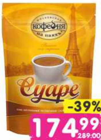
Кофе "Московская Кофейня на Пяях", коломбо, суаре, 75 г