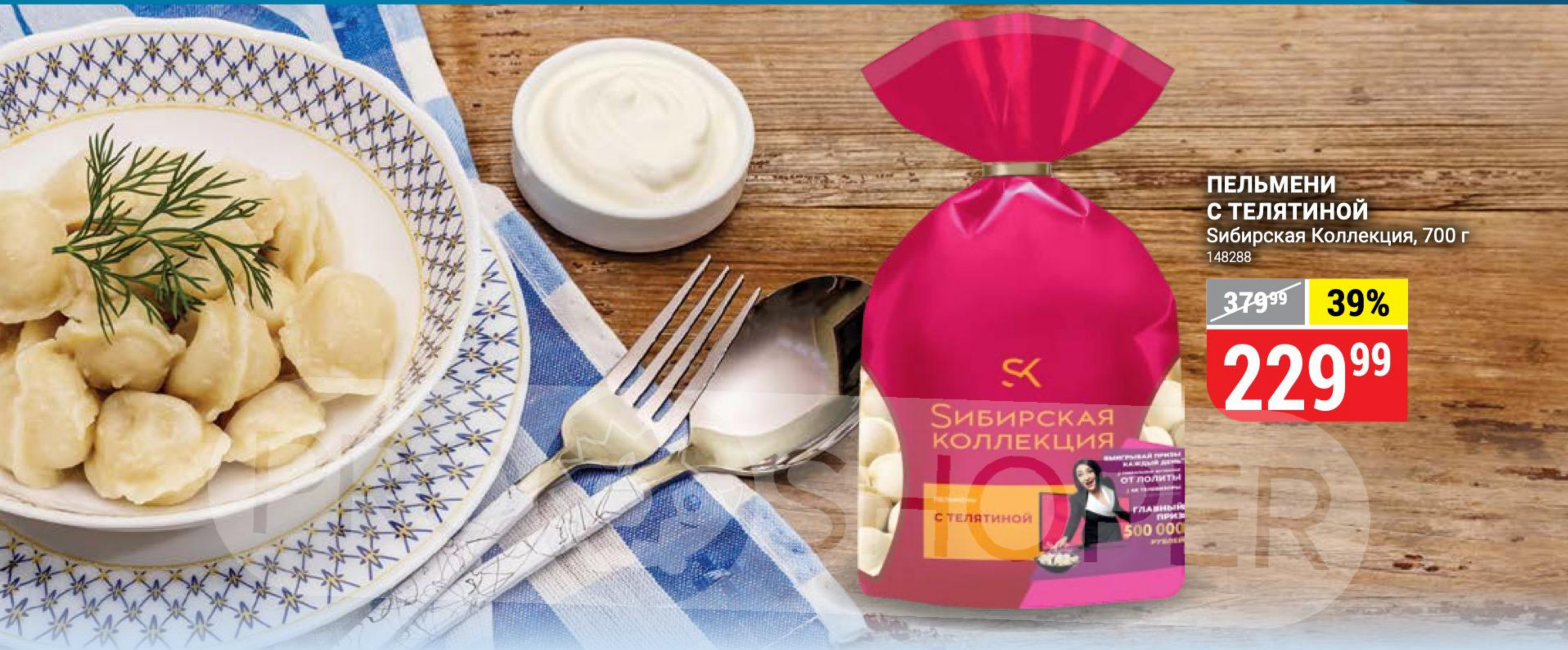
ПЕЛЬМЕНИ С ТЕЛЯТИНОЙ Сибирская Коллекция, 700 г 148288