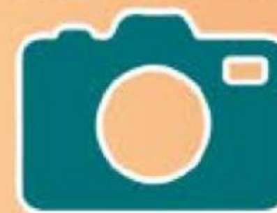
ФОТО ВАШЕГО ПИТОМЦА НА УПАКОВКЕ