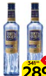
Водка ПЯТЬ ОЗЕР, премиум, 40%, 0,5 л