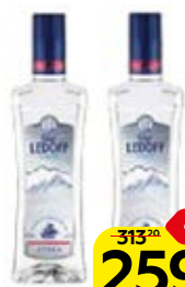
Водка ГРАФ ЛЕДОФФ Лайт, 40%, 0,5 л