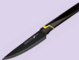
Нож АПОЛЛО , Дженио Вертекс, универсальный, 12,5см, 1 шт.