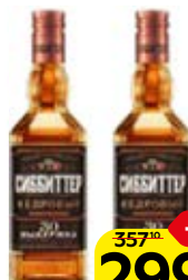
Настойка горькая СИББИТТЕР, Кедровая, выдержанная, 38%, 0,5 л