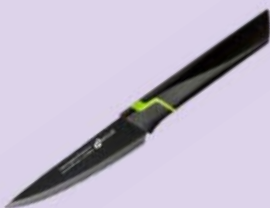
Нож АПОЛЛО , Дженио, Вертекс, для овощей, 10см, 1 шт.