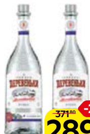
Водка ЗИМНЯЯ ДЕРЕВЕНЬКА, можжевельниковая, 40%, 0,5 л