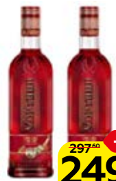
Настойка горькая ХОРТИЦА клюквенная с мятой, 30%, 0,5 л