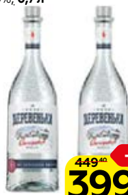
Водка ЗИМНЯЯ ДЕРЕВЕНЬКА Солодовая 40%, 0,7 л