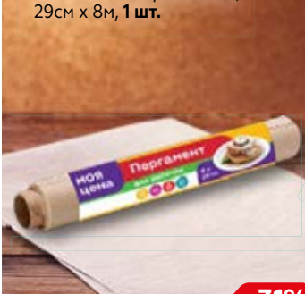
Пергамент МОЯ ЦЕНА , несиликонизированный, 29см x 8м, 1 шт.