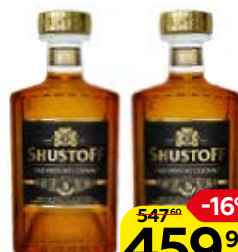
Коньяк SHUSTOFF® Олд Хистори, 5-летний 40%, 0,5 л