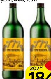
Напиток алкогольный ТРИ ТОПОРА плодовой полусладкий, 1,5 л