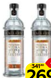
Водка ГЭЛЛЕРИ МОДЕРН, 0,5 л