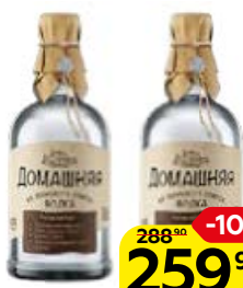
Водка ДОМАШНЯЯ, 40% (Питейный дом), 0,5 л