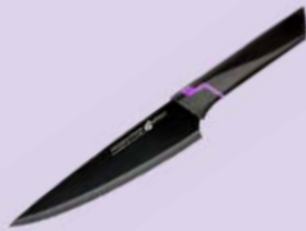
Нож АПОЛЛО Дженио Вертекс кухонный, 18,5см, 1 шт.