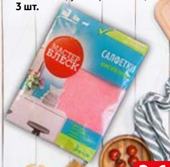
Салфетки МАСТЕР БЛЕСК , вискозные, универсальные, 3 шт.