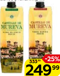
Вино КАСТИЛЬО ДЕ МУРЕВА , Сухое: Белое/ Красное (Испания), 1 л