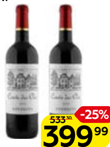
Вино КОН ДЕ КЛО Бордо, красное сухое (Франция), 0,75 л