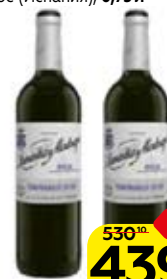
Вино АРМЕНТИЯ И МАДРАСО , Риоха Темпранильо, красное сухое (Испания), 0,75 л