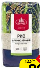
Рис АГРО-АЛЬЯНС , Экстра, длиннозерный, 900 г