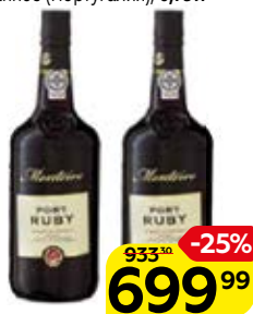
Вино ликерное МОНТЕЙРО , Портвейн Руби, красное выдержанное (Португалия), 0,75 л