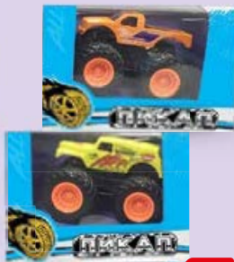
ПИКАП, 8 см