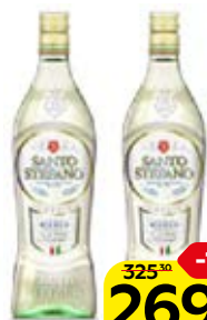
Напиток САНТО СТЕФАНО Бьянко, белый сладкий, 1 л