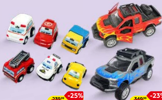
НАБОР АВТОМОБИЛЕЙ инерционных