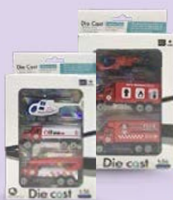
НАБОР 3 грузовика МХ0090159