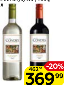
Вино ЛАС КОНДЕС Совиньон Блан белое сухое/ Карменер красное полусухое (Чили), 0,75 л