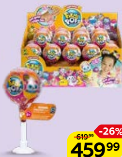
Коллекционная фигурка ПИКМИ ПОП