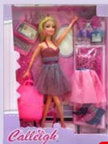
МОДНАЯ КУКЛА, 66197, 29 см