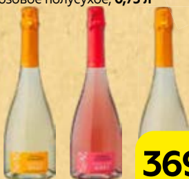
Вино игристое ШАТО ТАМАНЬ , Молодое: Мускатное, белое, полусухое/ Рислинг, белое брют/ Красностоп, розовое полусухое, 0,75 л