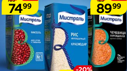
Рис МИСТРАЛЬ, Краснодар, круглозерный, 800 г