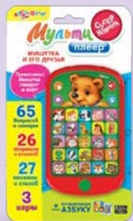
Игрушка МУЛЬТИПЛЕЕР в ассортименте*