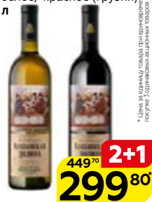
Вино АЛАЗАНСКАЯ ДОЛИНА Болеро, полусладкое: белое/ красное (Грузия), 0,75 л