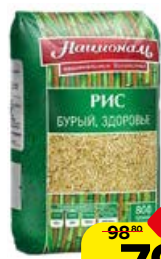
Рис НАЦИОНАЛЬ , Бурый, Здоровье, 800 г