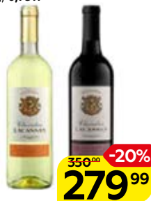
Вино ШЕВАЛЬЕ ЛАКАССАН в ассортименте*** (Франция), 0,75 л