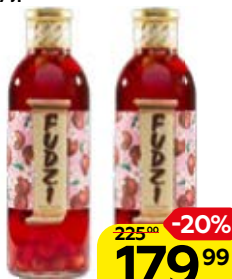
Вино фруктовое ФУДЗИ , Вишня, красное сладкое, 0,7 л