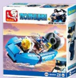
Конструктор ПОЛИЦИЯ ШБ микс