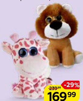
ПЛЮШЕВЫЕ ЖИВОТНЫЕ с блестящими глазами, в ассортименте*, 17 см