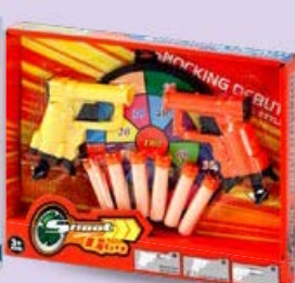
НАБОР ПИСТОЛЕТОВ с патронами