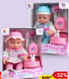
ПУПС с аксессуарами, 31 см