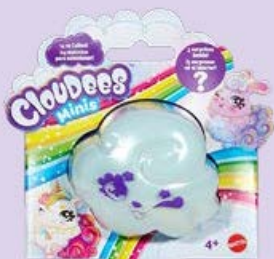
Зверушка COULDEES®, мини-набор в ассортименте*