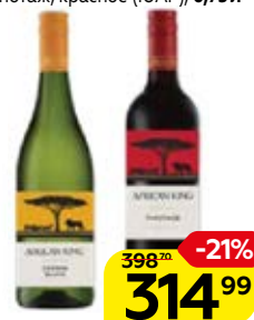
Вино АФРИКАН КИНГ Полу-сухое: Шенен Блан, белое/ Пинотаж, красное (ЮАР), 0,75 л