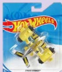
Базовые модели самолетов ХОТ ВИЛС