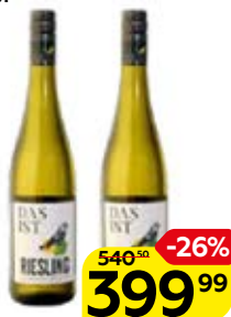
Вино ДАС ИСТ , Рислинг, белое полусухое (Германия), 0,75 л