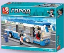
Конструктор АВТОБУС с панорамными окнами