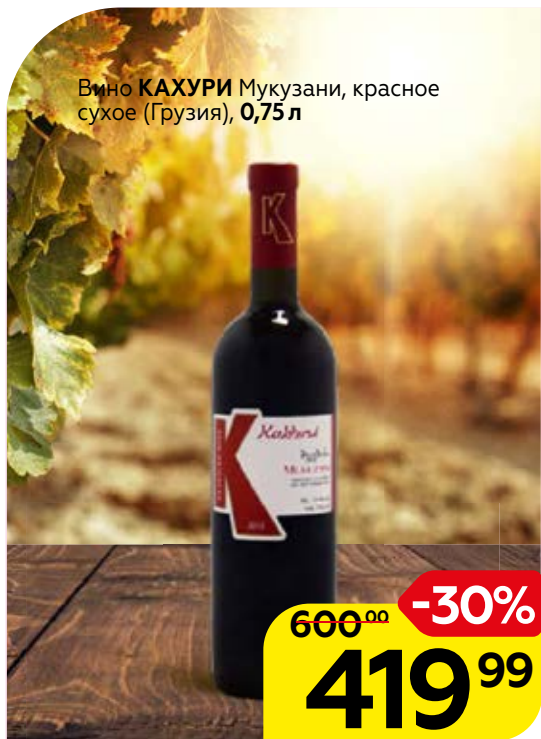
Вино КАХУРИ Мукузани, красное сухое (Грузия), 0,75 л