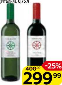
Вино КАНТИНА ДЕЛЛА ТОРРЕ , Инзолия Пино Грджико, белое сухое/ Санджовезе, красное полусухое (Италия), 0,75 л