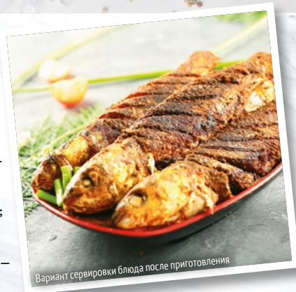
Вариант сервировки блюда после приготовления

Рыбу очистить от чешуи и внутренностей, обрезать плавники, удалить жабры. Хорошо промыть и обсушить бумажными полотенцами.