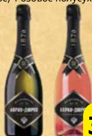
Вино игристое АБРАУ-ДЮРСО , Красное полусладкое/ Белое полусухое/ Розовое полусухое, 0,75 л