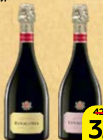
Вино игристое ФАНАГОРИЯ , Полусладкое: Розовое/ Белое, 0,75 л