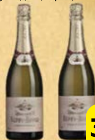
Шампанское АБРАУ-ДЮРСО , Российское, Классическое, белое, выдержанное: Полусладкое/ Брют/ Полусухое, 0,75 л