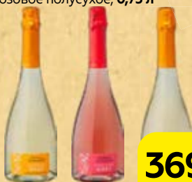
Вино игристое ШАТО ТАМАНЬ , Молодое: Мускатное, белое, полусухое/ Рислинг, белое брют/ Красностоп, розовое полусухое, 0,75 л