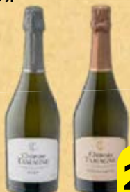
Вино игристое ШАТО ТАМАНЬ , Белое: Брют/ Полусладкое, 0,75 л