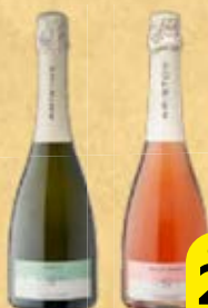
Вино игристое АРИСТОВ , Брют: Белое/ Розовое, 0,75 л