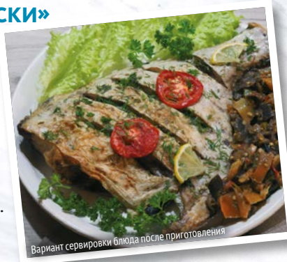
Вариант сервировки блюда после приготовления

Промыть палтус прохладной водой и обсушить, вытерев бумажным полотенцем.