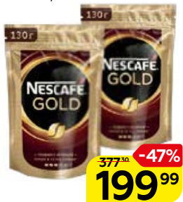
Кофе NESCAFÉ® Голд, растворимый сублимированный, 130 г