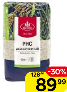
Рис АГРО-АЛЬЯНС , Экстра, длиннозерный, 900 г