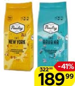
Кофе молотый PAULIG® , Кафе: Гавана/ Нью-Йорк, 200 г