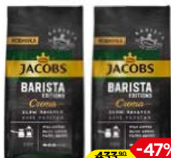
Кофе ЯКОБС , Бариста Идишн Крема, молотый, 230 г