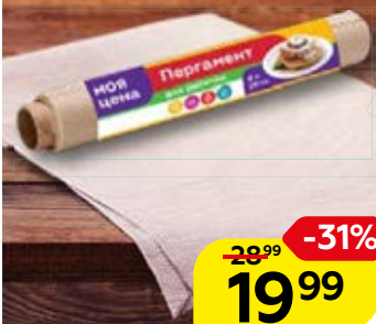
Пергамент МОЯ ЦЕНА , несиликонизированный, 29см x 8м, 1 шт.