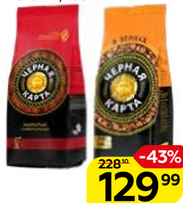
Кофе ЧЕРНАЯ КАРТА , Жареный: В зернах/ Молотый, 250 г