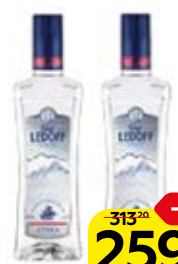
Водка ГРАФ ЛЕДОФ Лайт, 40%, 0,5 л