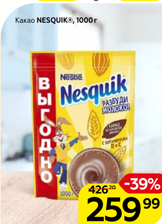
Какао NESQUIK® , 1000 г