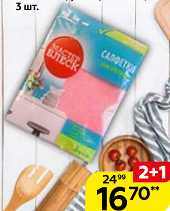
Салфетки МАСТЕР БЛЕСК , вискозные, универсальные, 3 шт.