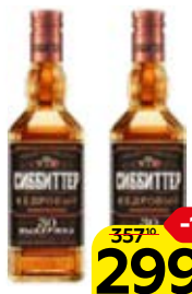
Настойка горькая СИББИТЕР , Кедровая, выдержанная, 38%, 0,5 л