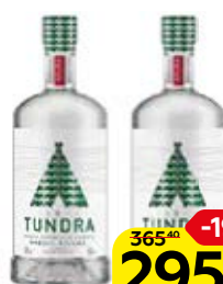
Водка ТУНДРА Нордик нэйче 40%, 0,5 л