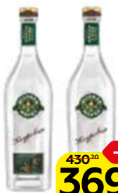
Водка ЗЕЛЕНАЯ МАРКА , Кедровая, 40%, 0,7 л