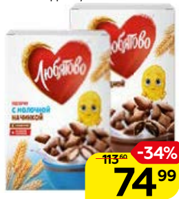
Подушечки ЛЮБЯТОВО с начинкой: молочной/шоколадной, 250 г