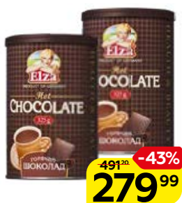
Шоколад горячий ЭЛЬЗА , 325 г