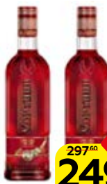
Настойка горькая ХОРТИЦА клюквенная с мятой, 30%, 0,5 л