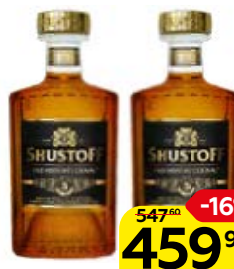
Коньяк SHUSTOFF® Олд Хистори, 5-летний 40%, 0,5 л