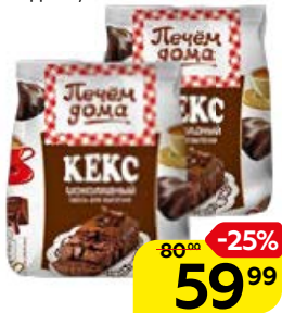
Смесь для выпечки ПЕЧЕМ ДОМА Кекс шоколадный, 300 г