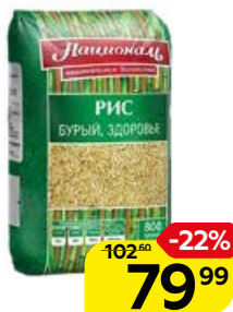
Рис НАЦИОНАЛЬ , Бурый, Здоровье, 800 г