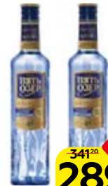
Водка ПЯТЬ ОЗЕР , премиум, 40%, 0,5 л