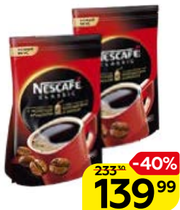
Кофе NESCAFÉ® Классик, растворимый, 130 г