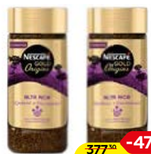
Кофе NESCAFÉ® Голд ориджин, Алта Рика, 85 г