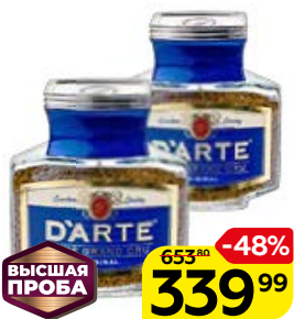
Кофе Д'АРТЭ , оригинал, растворимый, 100 г