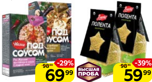
Полента БРАВОЛЛИ! , кукурузная, 300 г