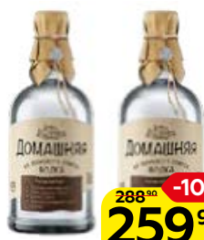
Водка ДОМАШНЯЯ , 40% (Питейный дом), 0,5 л