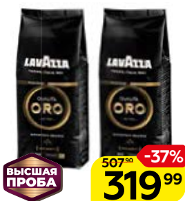
Кофе LAVAZZA® Оро в зернах, 250 г