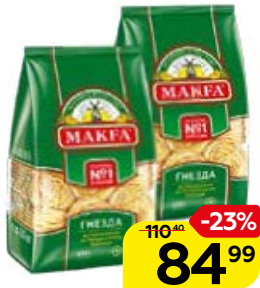
Лапша длинная МАКФА ®, Тольятелле, Гнезда, 450 г