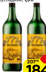
Напиток алкогольный ТРИ ТОПОРА плодовой полусладкий, 1,5 л