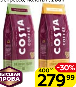
Кофе КОСТА КОФИ Брайт Бленд, в зернах/ Колумбия Эспрессо, молотый, 200 г