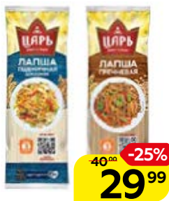
Лапша ЦАРЬ Домашняя, 450 г / Гречневая, 400 г