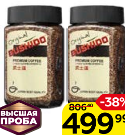
Кофе БУШИДО , Ориджинал, растворимый, 100 г