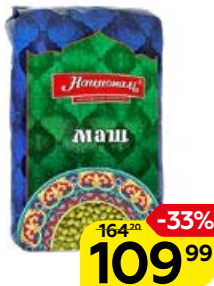
Фасоль НАЦИОНАЛЬ Маш, зеленая, 450 г