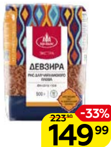
Рис АГРО-АЛЬЯНС Девзира, для плова, 500 г