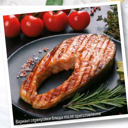
Вариант сервировки блюда после приготовления

Стейки хорошо промыть под струей холодной воды, затем удалить влагу с помощью бумажного полотенца.