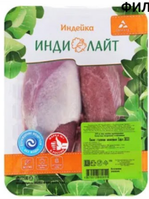
ФИЛЕ ГОЛЕНИ ИНДЕЙКИ «ИндиЛайт» 600гр