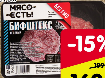
БИФСТЕКС «Мясо есть» телячий 240гр