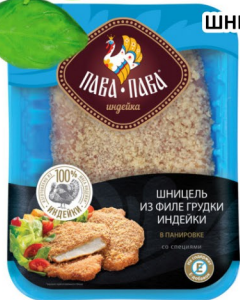
ШНИЦЕЛЬ ИЗ ИНДЕЙКИ «Пава-Пава» охлажденный 450гр