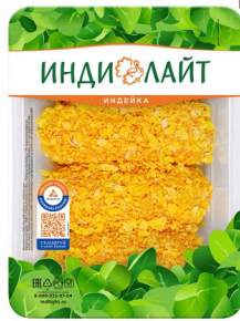
ШНИЦЕЛЬ ИЗ ИНДЕЙКИ «ИндиЛайт» Аппетитный 450гр