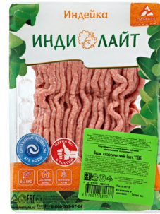
ФАРШ ИЗ ИНДЕЙКИ «ИндиЛайт» Классический 450гр