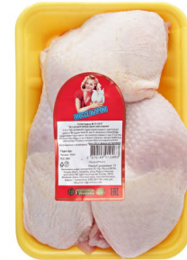
ОКОРОЧОК ЦЫПЛЕНКА «Моссельпром» охлажденный 1кг