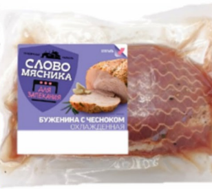
БУЖЕНИНА «Слово Мясника» с чесноком 1кг