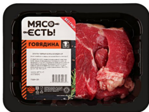
ЛОПАТКА ГОВЯЖЬЯ «Мясо есть» Халяль 400гр