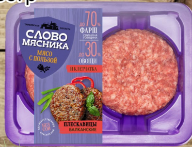
ПЛЕСКОВИЦА «Слово Мясника» 180гр