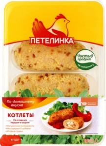
КОТЛЕТЫ КУРИНЫЕ «По-петелински» перец и сыр 500гр