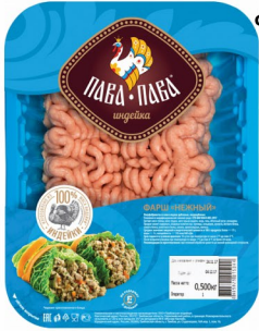
ФАРШ ИЗ ИНДЕЙКИ «Пава-Пава» Нежный 500гр