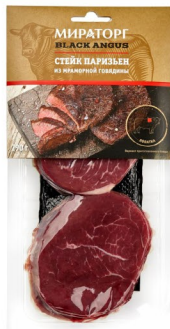
СТЕЙК ГОВЯЖИЙ «Мираторг» Паризьен из мраморной говядины 290гр