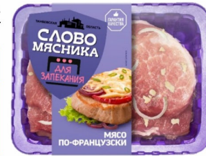
МЯСО «Слово Мясника» По-французски 400гр