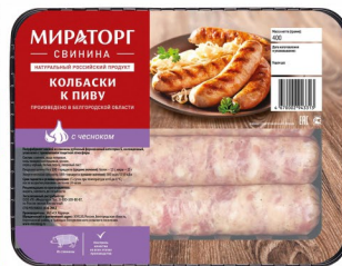
КОЛБАСКИ «Мираторг» к пиву 400гр