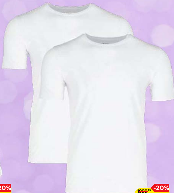
Футболка мужская МЕХХ®, 2 шт.