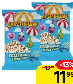
Рис воздушный СКРЕПЫШИ, 30 г