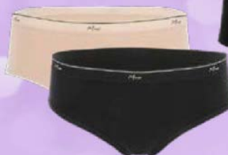
Трусы женские МЕХХ® слипы 3 шт. в упаковке