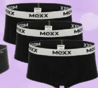
Трусы женские МЕХХ® хипстеры 3 шт.