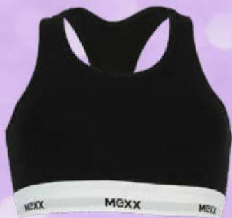
Топ женский МЕХХ® бралетт