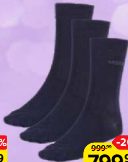
Носки мужские МЕХХ® 3 пары