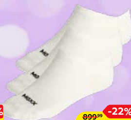
Носки мужские МЕХХ® укороченные, 3 пары