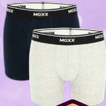
Трусы мужские МЕХХ® боксеры 2 шт.