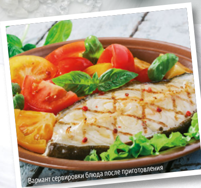
Вариант сервировки блюда после приготовления

Рыбу хорошо промыть под проточной водой, осторожно отсоединить от костей и нарезать не очень мелкими кусками, чтобы получились стейки. Затем обсушить бумажными полотенцами.