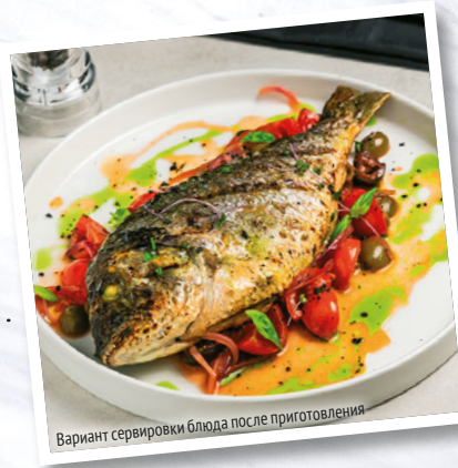
Вариант сервировки блюда после приготовления

В первую очередь необходимо хорошо промыть и почистить рыбу, вынуть жабры и внутренности. Затем выложить на бумажное полотенце, чтобы подсушить, после чего посолить, поперчить и уложить в удобную для выпекания форму.