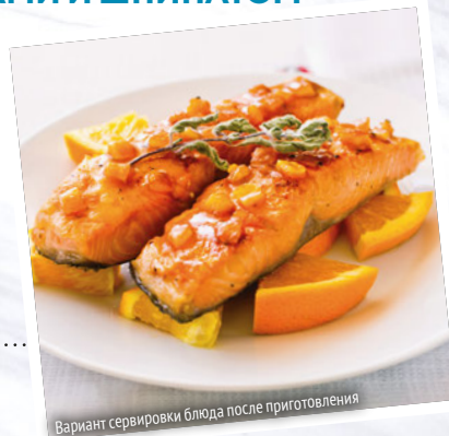
Вариант сервировки блюда после приготовления

Горбушу промыть, высушить, очистить от всех костей и разрезать на удобные кусочки.