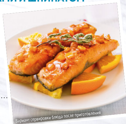
Вариант сервировки блюда после приготовления

Горбушу промыть, высушить, очистить от всех костей и разрезать на удобные кусочки.