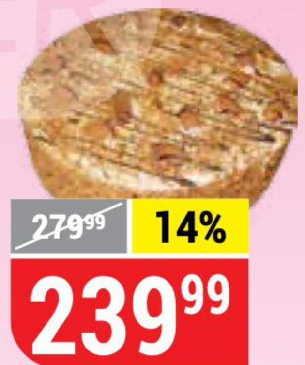
ТОРТ МЕДОВЫЙ со сметанным кремом, Тортугалия, 600 г 153140

Выгодное предложение: шоколадный батончик Snickers 50g + Orbit 13,6g в ассортименте по специальной цене.