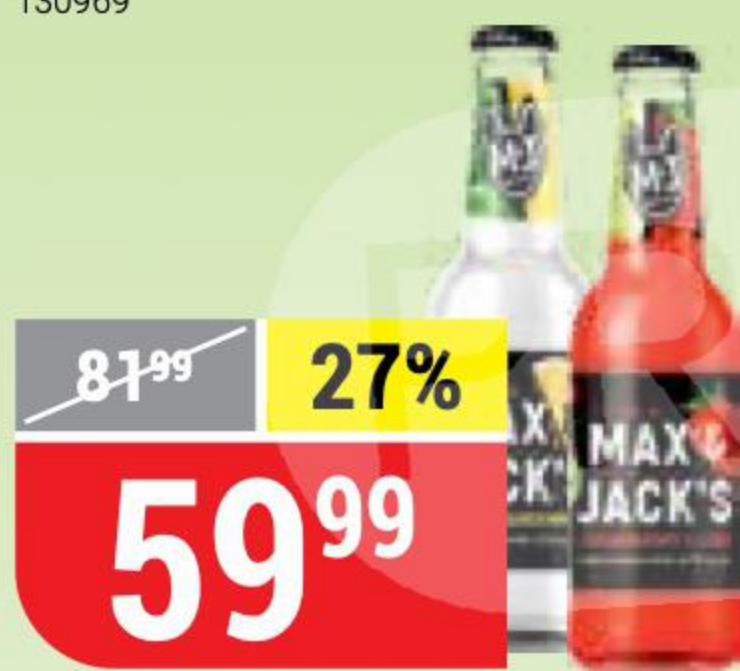
ПИВНОЙ НАПИТОК MAX&JACK'S strawberry-lime; lemon-gardenmint, нефильтрованный, 4,7%, 0,45 л 151783/151785