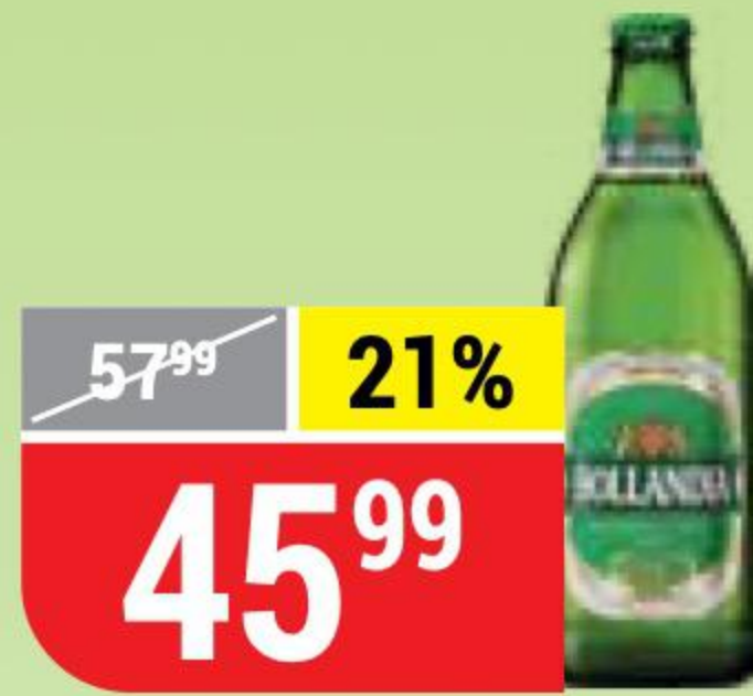
ПИВО HOLLANDIA 4,8%, 0,45 л 130819