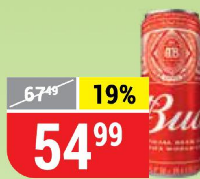
ПИВО BUD светлое, 5%, 0,45 л 130715