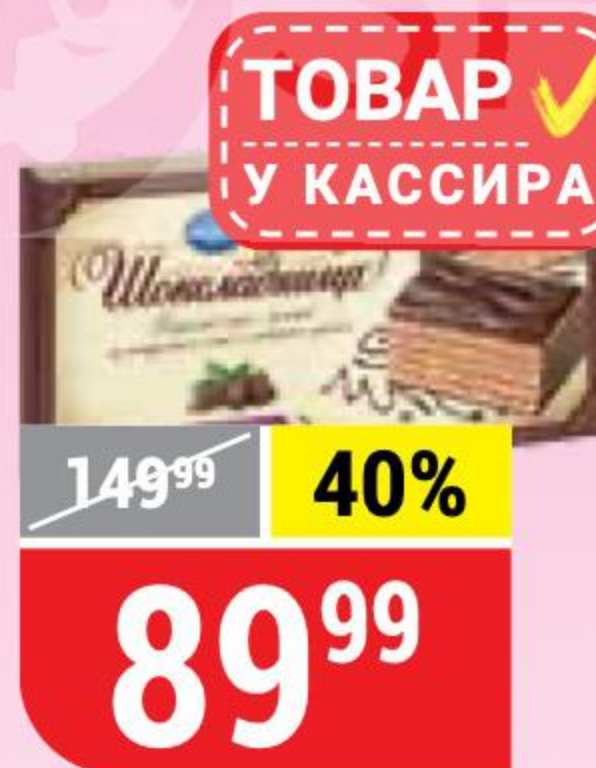
ТОРТ ВАФЕЛЬНЫЙ ШОКОЛАДНИЦА классическая, Коломенское, 240 г 137141