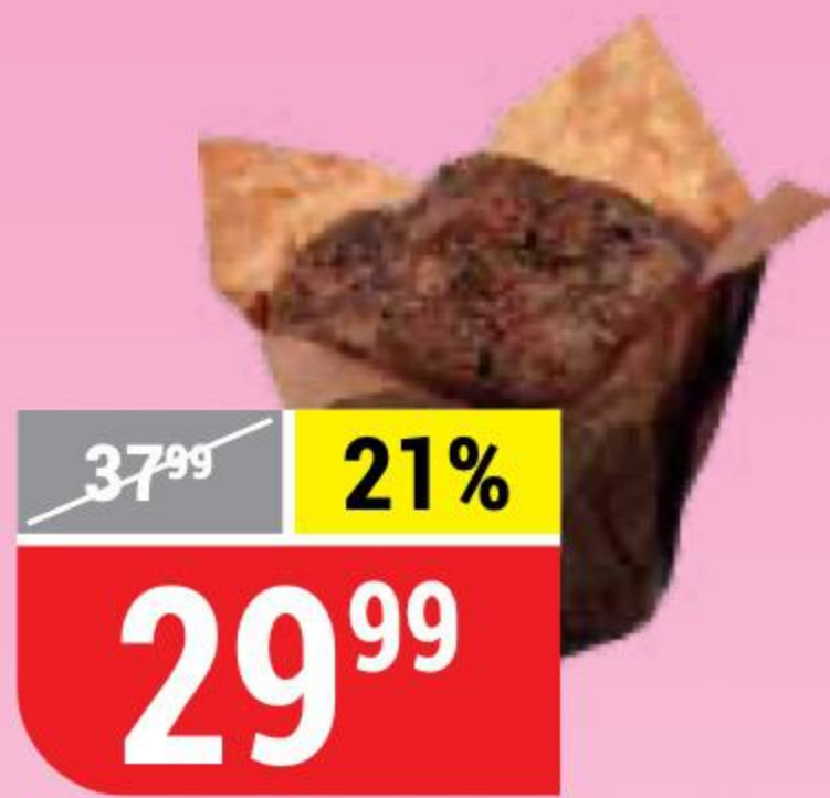
МАФФИН с шоколадом, 80 г 144853