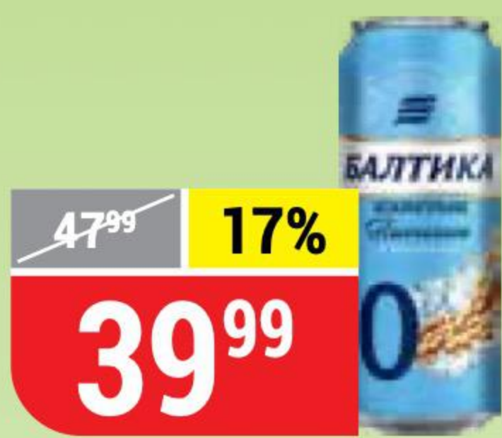
ПИВО БАЛТИКА №0 пшеничное, безалкогольное, 0,5%, 0,45 л 130969