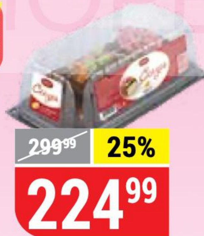
ТОРТ СКАЗКА Mirel, 440 г 140580