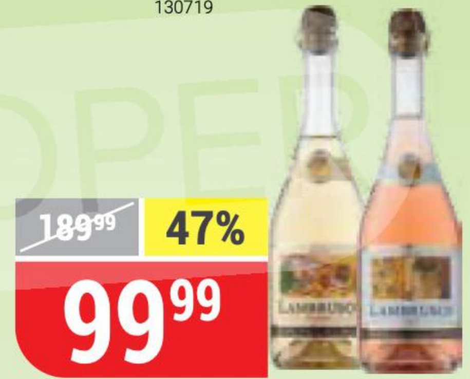
НАПИТОК МЕДОВЫЙ LAMBRUSCO serenada, белый; assol, розовый, полусладкий, 6%, 0,75 л 158090/158096

ЧРЕЗМЕРНОЕ УПОТРЕБЛЕНИЕ АЛКОГОЛЯ ВРЕДИТ ВАШЕМУ ЗДОРОВЬЮ