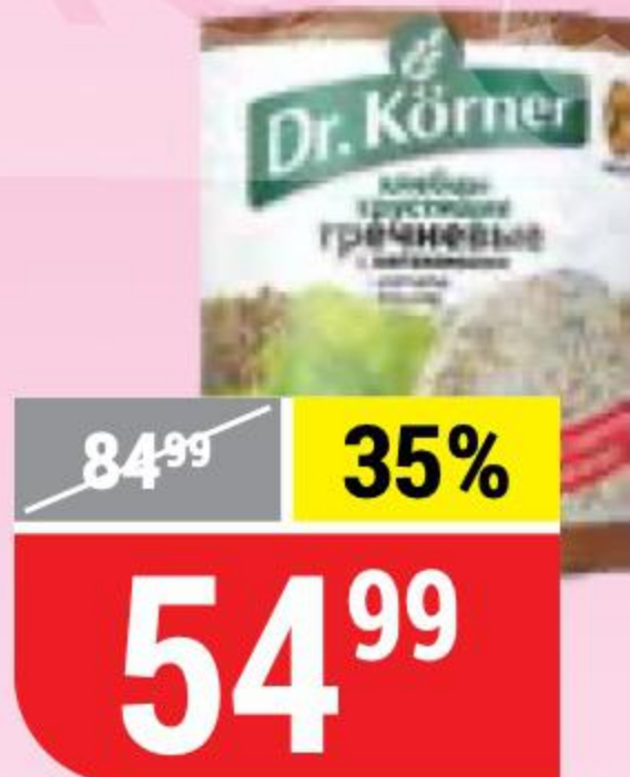
ХЛЕБЦЫ ГРЕЧНЕВЫЕ с витаминами, Dr.Korner, 100 г 102961