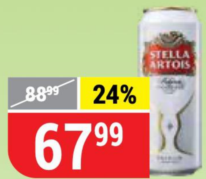
ПИВО STELLA ARTOIS светлое, 5%, 0,45 л 130719