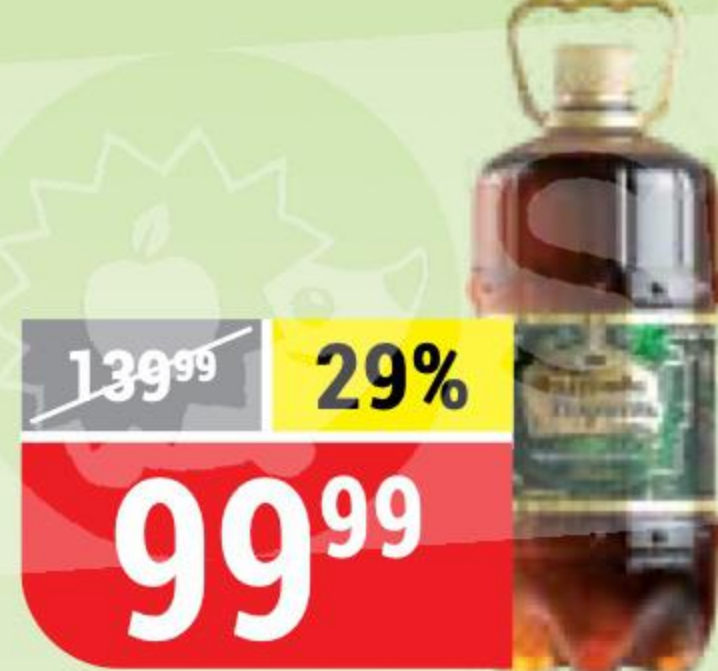
ПИВО ИСКУССТВО ВАРИТЬ чешское, барное, 4,9%, 1,5 л 123821