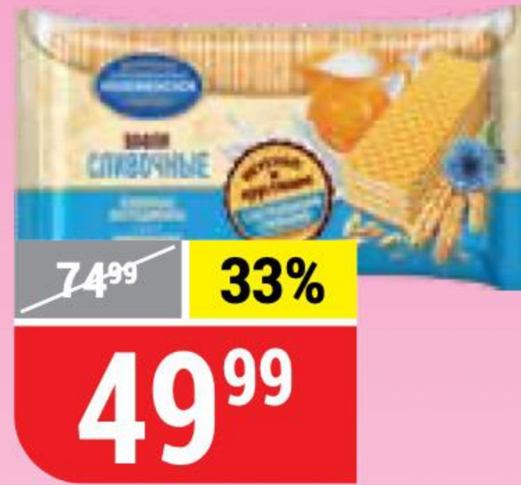
ВАФЛИ СЛИВОЧНЫЕ традиционные, Коломенское, 220 г 102691