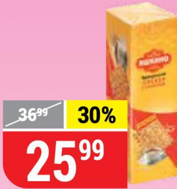
КРЕКЕР ФРАНЦУЗСКИЙ Яшкино, 185 г 100621