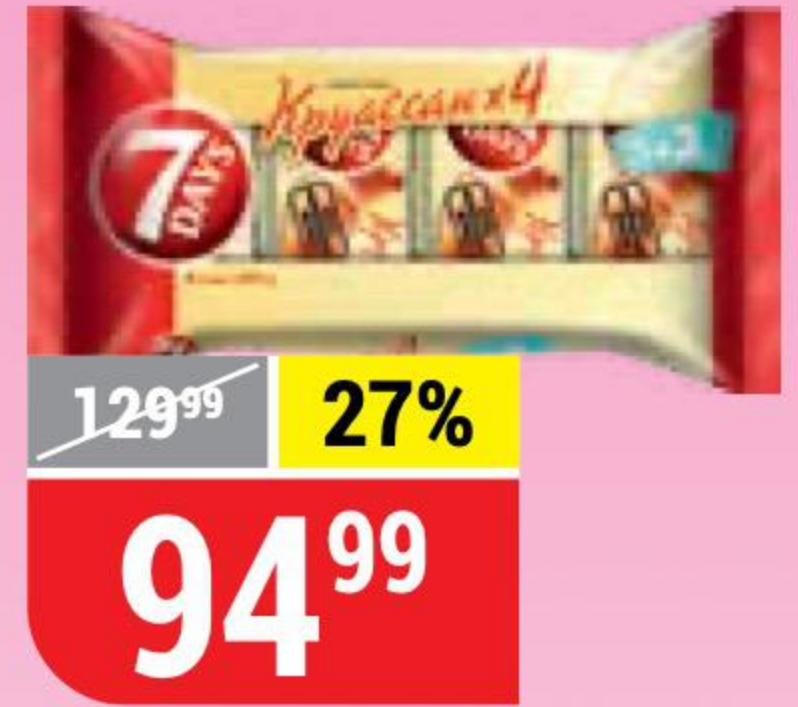
КРУАССАНЫ 7 DAYS сингл, какао, 4 шт. x 65 г 125183