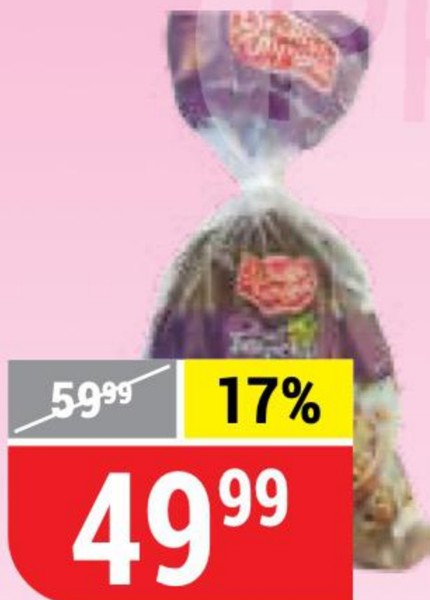
ХЛЕБ БОЯРСКИЙ с изюмом, нарезка, Хлебная Страна, 350 г 126797