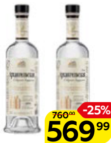
Водка АРХАНГЕЛЬСКАЯ Северная выдержка 40%, 1 л