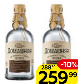
Водка ДОМАШНЯЯ, 40% (Питейный дом), 0,5 л