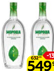
Водка МОРОША, На минеральной воде Карелии, 1 л