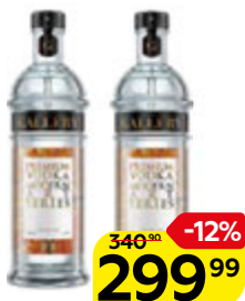
Водка ГАЛЕРЕЯ МОДЕРН, 0,5 л