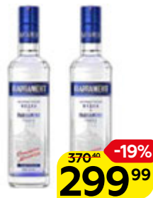
Водка ПАРЛАМЕНТ, 40%, 0,5 л