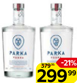
Водка ПАРКА 40%, 0,5 л