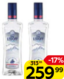
Водка ГРАФ ЛЕДОФФ Лайт, 40%, 0,5 л