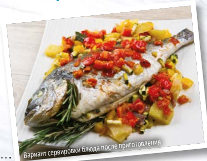
Вариант сервировки блюда после приготовления

Рыбу хорошо промыть под проточной водой, снять чешую, очистить от внутренностей и обязательно удалить жабры. Затем сделать пару надрезов, посолить и поперчить по вкусу. Перед отправкой в духовку хвостик рыбы обернуть фольгой, чтобы не пригорел.