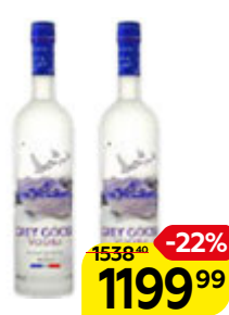
Водка ГРЕЙ ГУЗ , 40%, 0,5 л