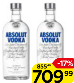
Водка АБСОЛЮТ , 40% (Швеция), 0,5 л