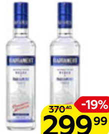
Водка ПАРЛАМЕНТ , 40%, 0,5 л