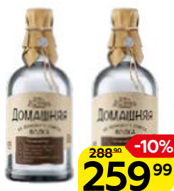
Водка ДОМАШНЯЯ , 40% (Питейный дом), 0,5 л