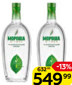
Водка МОРОША , На минеральной воде Карелии, 1 л