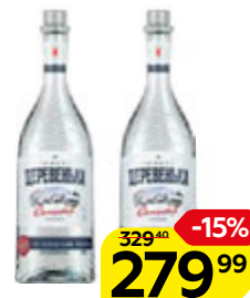
Водка ЗИМНЯЯ ДЕРЕВЕНЬКА , солодовая, 40%, 0,5 л