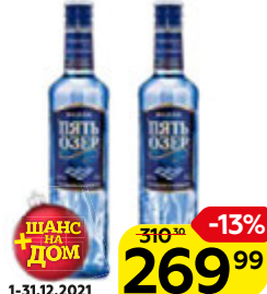
Водка ПЯТЬ ОЗЕР , 40%, 0,5 л

ШАНС В ДОМ 1-31.12.2021 310 20 -13% 269 99