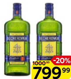
Ликер БЕХЕРОВКА , 38% (Чехия), 0,5 л

ШАНС В ДОМ 1-31.12.2021 310 20 -13% 269 99