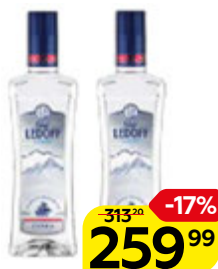
Водка ГРАФ ЛЕДОФФ Лайт, 40%, 0,5 л