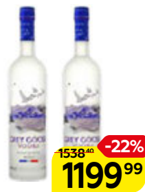
Водка ГРЕЙ ГУЗ, 40%, 0,5 л