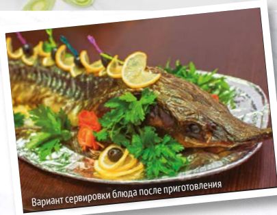
Вариант сервировки блюда после приготовления

Промойте стерлядь, просушите бумажным полотенцем, снимите с рыбы чешую, вымойте и выпотрошите.