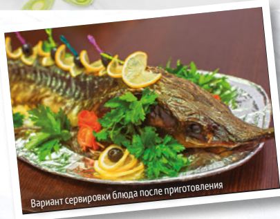
Вариант сервировки блюда после приготовления

Промойте стерлядь, просушите бумажным полотенцем, снимите с рыбы чешую, вымойте и выпотрошите.