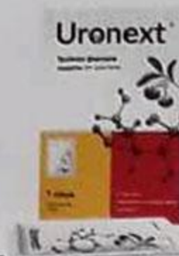
ТАБЛ. 700 МГ, №30 RU.77.99.11.003.E.003863.09.18