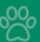
КОРМ ДЛЯ СОБАК PEDIGREE для малых пород, говядина, 600 г 116750