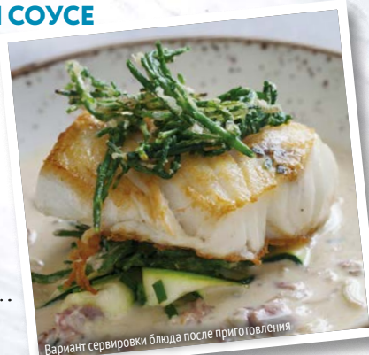
Вариант сервировки блюда после приготовления

Такая рыба будет хорошо сочетаться практически с любым гарниром — от простых макарон до изысканных овощей на гриле. Приятного аппетита!