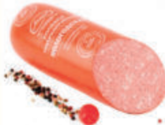
КОЛБАСА "ВОЛОГОДСКАЯ" П/К "АНКОМ", 1 КГ