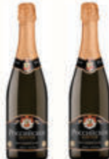
ВИНО ИГРИСТОЕ "РОССИЙСКОЕ ЗОЛОТО" В АССОРТИМЕНТЕ, РОССИЯ, 0,75 Л