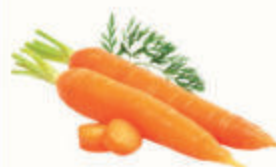
МОРКОВЬ, 1 КГ