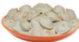
ПЕЛЬМЕНИ "ВЛАДИМИРСКИЕ" ЗАМ., 1 КГ

ИНТЕРНЕТ-МАГАЗИН НАРОДНЫЙ №1 ЗАКАЖИ ТОВАРЫ НЕ ВЫХОДЯ ИЗ ДОМА!