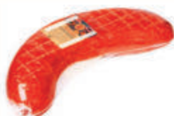
СЕРВЕЛАТ "ЛИТОВСКИЙ" В/К БАРАНЬЯ СИНЮГА ТД "ИНЕЙ", 1 КГ Продажа только на Косыгина, 21