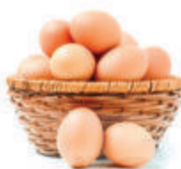
ЯЙЦО, 1 ДЕС.