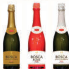
НАПИТОК ВИННЫЙ "БОСКА" 7,5% В АССОРТИМЕНТЕ РОССИЯ, 0,75 Л