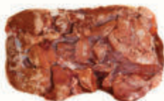
ПЕЧЕНЬ КУРИНАЯ ЗАМ., 1 КГ