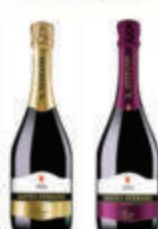
НАПИТОК ФРУКТОВЫЙ "САНТО СТЕФАНО" 8% В АССОРТИМЕНТЕ РОССИЯ, 0,75 Л