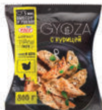
ГИОЗА "ВИЧИ" С КУРИЦЕЙ ЗАМ., 800 ГР