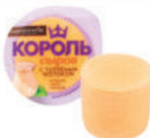
БЗМЖ СЫР "КОРОЛЬ СЫРОВ" С ТОПЛЕННЫМ МОЛОКОМ 45%, 375 ГР