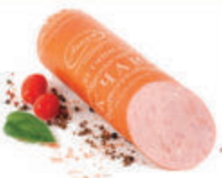
ВЕТЧИНА "К ЧАЮ" ВАР. "АНКОМ", 1 КГ