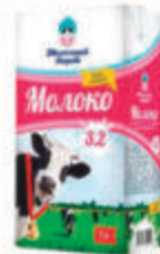
БЗМЖ МОЛОКО "МОЛОЧНЫМ ТЕРЕМ" УЛЬТРАПАСТЕРИЗОВАННОЕ 3.20 %, 1 Л