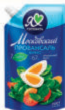
МАЙОНЕЗ "МОСКОВСКИЙ ПРОВАНСАЛЬ" КЛАССИЧЕСКИЙ 67%, 576 ГР