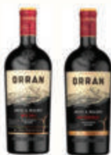
ВИНО "ОРРАН АРЕНИ МАЛЬБЕК" КРАСНОЕ В АССОРТИМЕНТЕ 12% АРМЕНИЯ, 0,75 л