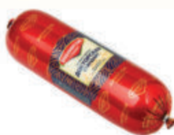
КОЛБАСА "ДОКТОРСКАЯ" ВАР. "ВЛАДИМИРСКИЙ СТАНДАРТ", 1 КГ