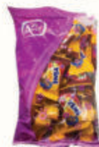
КОНФЕТЫ ВАФЕЛЬНЫЕ "ТИМИ" КЛУБНИКА-СЛИВКИ, 500 ГР