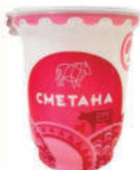
БЗМЖ СМЕТАНА 20%, 330 ГР