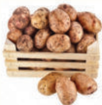
КАРТОФЕЛЬ, 1 КГ