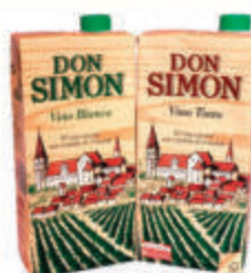
ВИНО "ДОН СИМОН" 11% В АССОРТИМЕНТЕ ИСПАНИЯ, 1 л