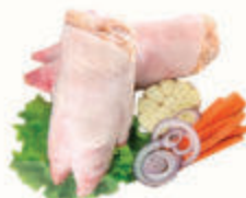
НОГИ СВИНЫЕ С/М, 1 КГ