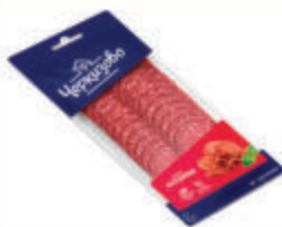
САЛЯМИ "АСТОРИЯ" С/К "ЧЕРКИЗОВСКИЙ" МК, 85 ГР