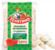
ПЕЛЬМЕНИ "ТЕЛЯТИНО" "СОБСТВЕННАЯ ФЕРМА" ИЗ ВЫРЕЗКИ ЗАМ., 430 ГР