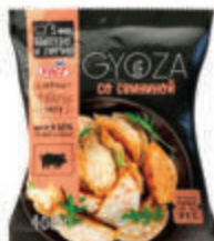
ГИОЗА СО СВИНИНОЙ "ВИЧИ" ЗАМ., 800 ГР