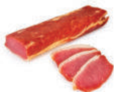
БАЛЫК СВИНОЙ "ТРАДИЦИОННЫЙ" С/К ФК "ЛАДОГА", 1 КГ