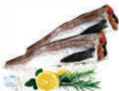
МИНТАЙ Б/Г С/М, 1 КГ