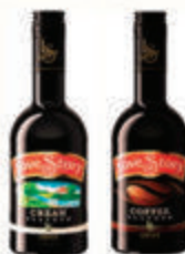
ЛИКЕР "ИСТОРИЯ ЛЮБВИ" В АССОРТИМЕНТЕ 18% РОССИЯ, 0,5 Л