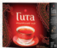
ЧАЙ "ПРИНЦЕССА ГИТА" ИНДИЙСКИЙ ЧЕРНЫЙ БАЙХОВЫЙ, 100 ПАК. Б/Я