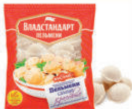
ПЕЛЬМЕНИ "САМЫЕ КРАСИВЫЕ" ЗАМ., 430 ГР