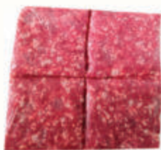
КОСТНЫЙ ОСТАТОК КУРИНЫЙ ЗАМ., 1 КГ