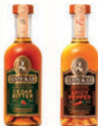
НАСТОЙКА "ЦАРСКАЯ" 35-38% В АССОРТИМЕНТЕ РОССИЯ, 0,5 Л