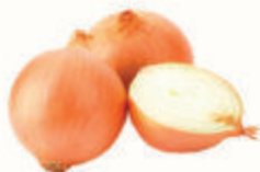
ЛУК РЕПЧАТЫЙ, 1 КГ