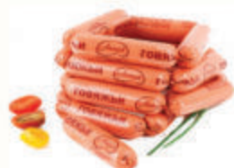
СОСИСКИ "ГОВЯЖЬИ" ОХЛ. "АНКОМ", 1 КГ