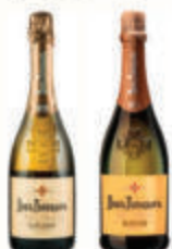
ШАМПАНСКОЕ "ЛЕВ ГОЛИЦЫН", 13% В АССОРТИМЕНТЕ, РОССИЯ, 0,75 Л