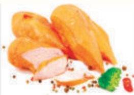
ГРУДКИ КУРИНЫЕ К/В "АНКОМ", 1 КГ