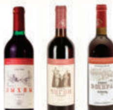
ВИНО АБХАЗИИ 10% В АССОРТИМЕНТЕ РОССИЯ, 0,75 Л