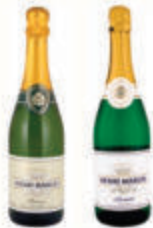
ВИНО ИГРИСТОЕ "АНРИ МАРСЕЛЬ" 10,5% ФРАНЦИЯ В АССОРТИМЕНТЕ, 0,75 Л