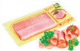
ОКОРОК "ЮБИЛЕЙНЫЙ" К/В ТД "ИНЕЙ", 100 ГР