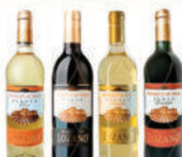
ВИНО "ЛОЗАНО" В АССОРТИМЕНТЕ ИСПАНИЯ, 0,75 Л