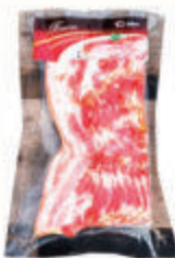
БЕКОН СВИНОЙ С/К ФК "ЛАДОГА", 500 ГР