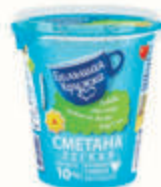
БЗМЖ СМЕТАНА ЛЕГКАЯ "БОЛЬШАЯ КРУЖКА" 10%, 315 ГР