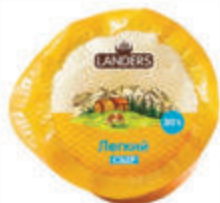
БЗМЖ СЫР ЛЕГКИЙ "ЛАНДЭСР" 30%, 230 ГР