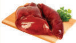
ПЕЧЕНЬ СВИНАЯ С/М, 1 КГ