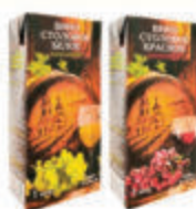
ВИНО СТОЛОВОЕ "КРАСНЫЕ ЦВЕТЫ", "БЕЛЫЕ ЦВЕТЫ", ПОЛУСЛАДКОЕ 10% 12% РОССИЯ, 1 л