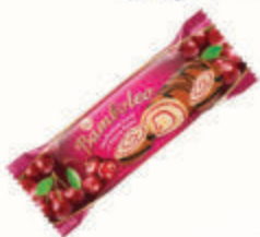
РУЛЕТ БИСКВИТНЫЙ "БАМБОЛЕО" СО ВКУСОМ ВИШНИ, 145 ГР