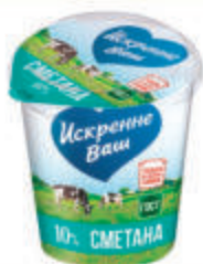
СМЕТАНА "ИСКРЕННЕ ВАШ" 10%, 315 ГР