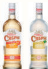
НАСТОЙКА ГОРЬКАЯ "СЯБРЫ" 38% В АССОРТИМЕНТЕ РОССИЯ, 0,5 Л