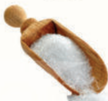
САХАРНЫЙ ПЕСОК, 1 КГ