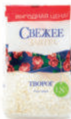
БЗМЖ ТВОРОГ "СВЕЖЕЕ ЗАВТРА" ОБЕЗЖИРЕННЫЙ 1,8%, 400 ГР