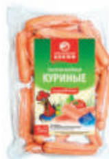
СОСИСКИ "КУРИНЫЕ" ОХЛ. ВНИМД, 1 КГ