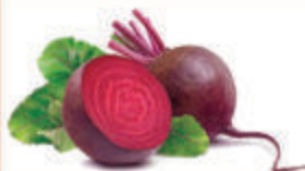
СВЕКЛА, 1 КГ