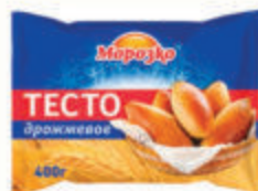
ТЕСТО ДРОЖЖЕВОЕ "МОРОЗКО" ЗАМ., 400 ГР