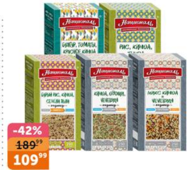
Рис «Националь» для плова 900 г