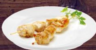
Филе куриное в сырном кляре 100 г