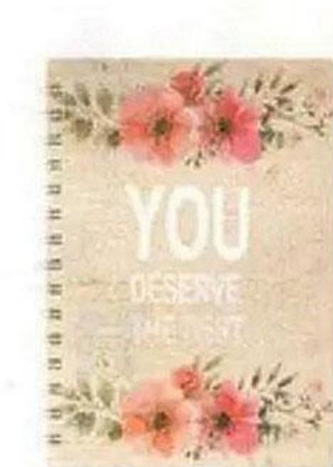
Блокнот, 120 листов, 15,1x21,2 см