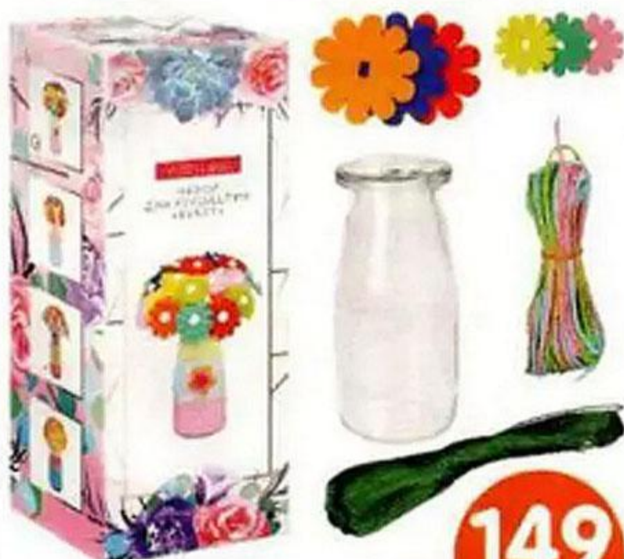
НАБОР ДЛЯ РУКОДЕЛИЯ «БУКЕТ», в АССОРТИМЕНТЕ