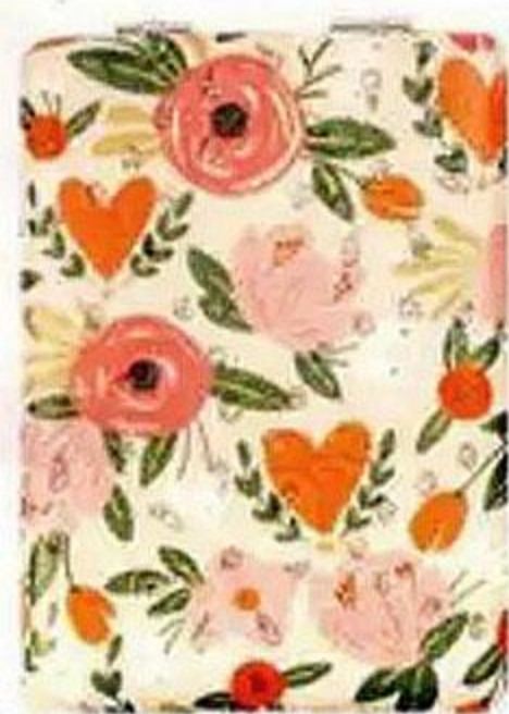
Зеркало, 6x9 см, в ассортименте