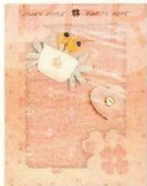
Блокнот в подарочной коробке, 120 листов, в ассортименте