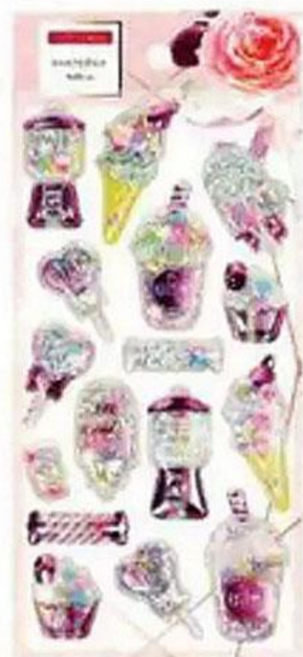
НАКЛЕЙКА, 9x20 см, в АССОРТИМЕНТЕ