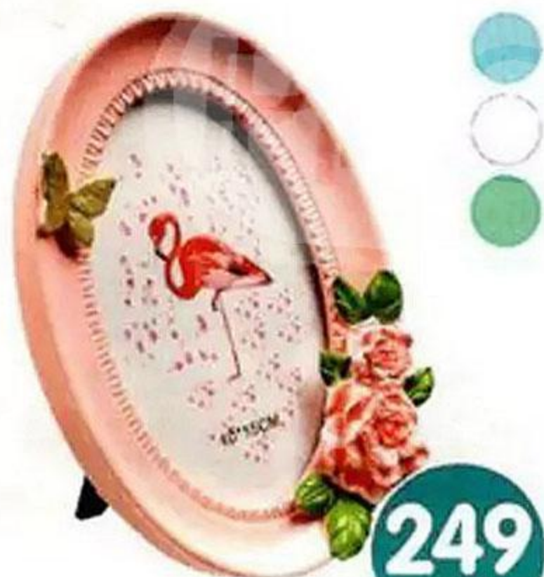
ФОТОРАМКА, 20x15 см