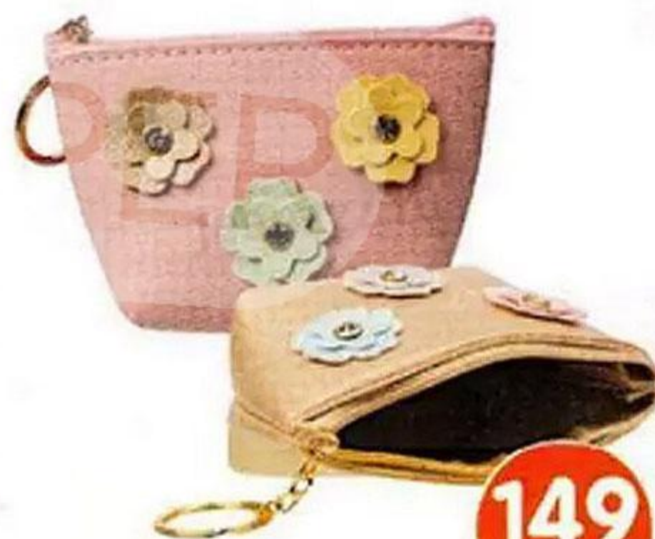
КОШЕЛЁК ДЛЯ МОНЕТ