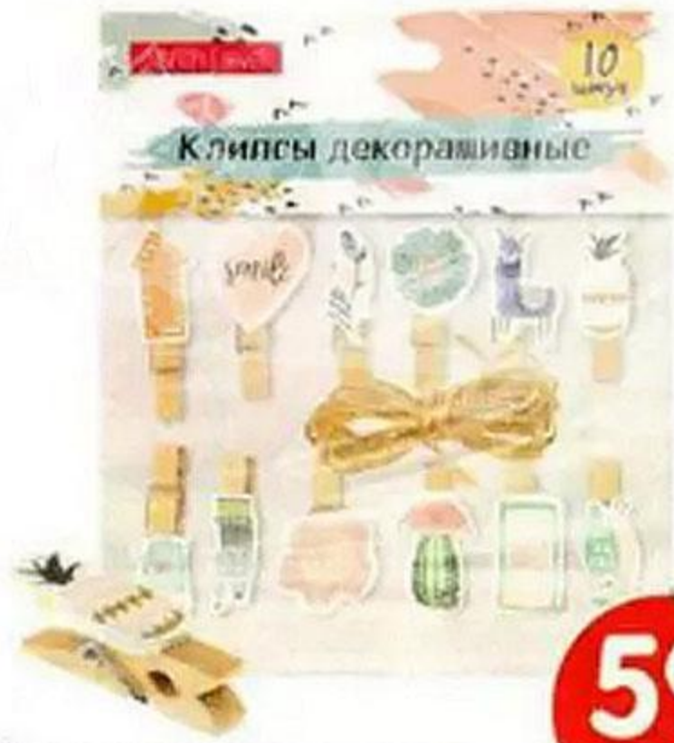
КЛИПСЫ ДЕКОРАТИВНЫЕ, 10 шт., в АССОРТИМЕНТЕ