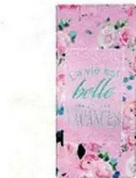
Чехол для посадочного талона и паспортов, багажная бирка, в ассортименте