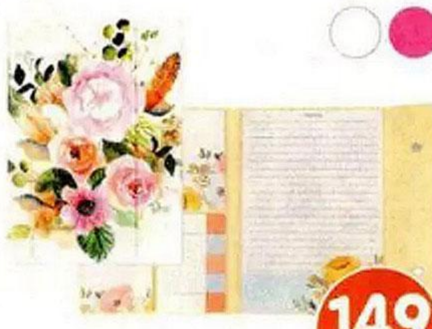
Органайзер для записей с клейкими листами