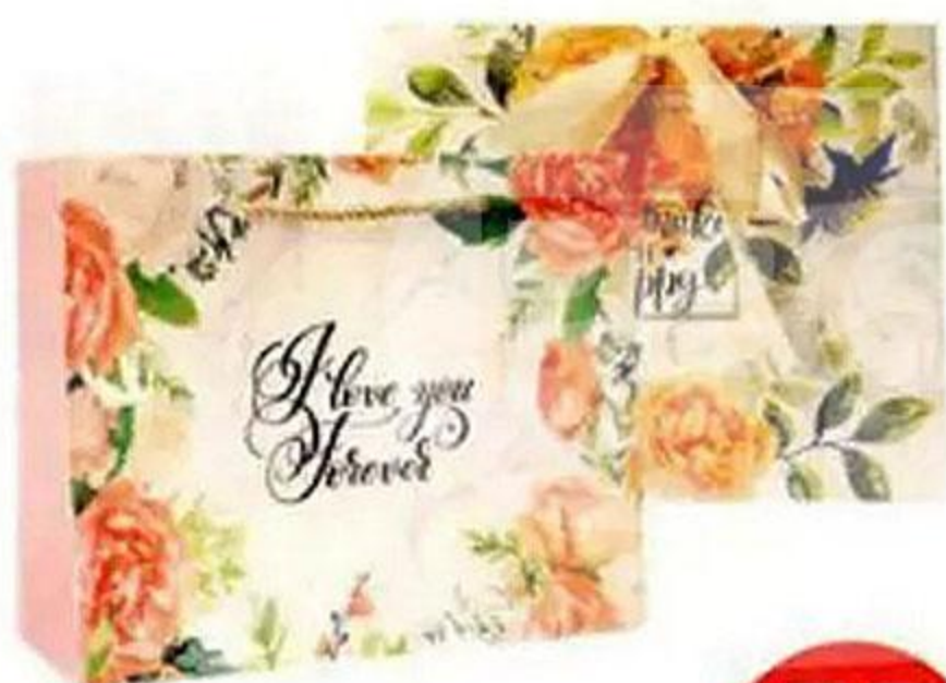
ПАКЕТ ПОДАРОЧНЫЙ, 24,5x19,5x9,5 см

ПОДАРИТЕ ЕЙ ВНИМАНИЕ И ЧТО-ТО ИЗ FIX PRICE!