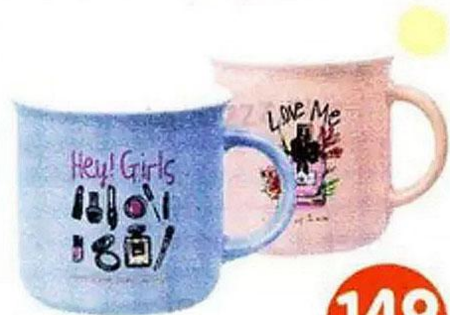
Кружка, 400 мл