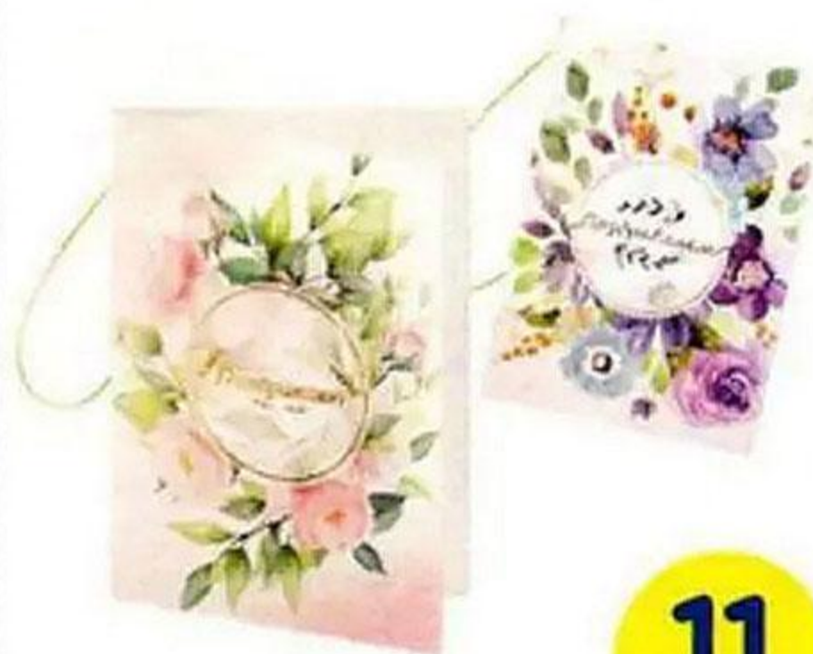
ОТКРЫТКА «8 МАРТА», 8x11 см