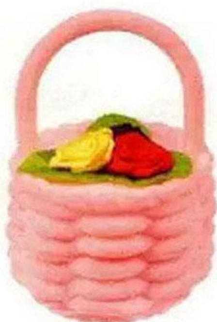
Футляр для украшений