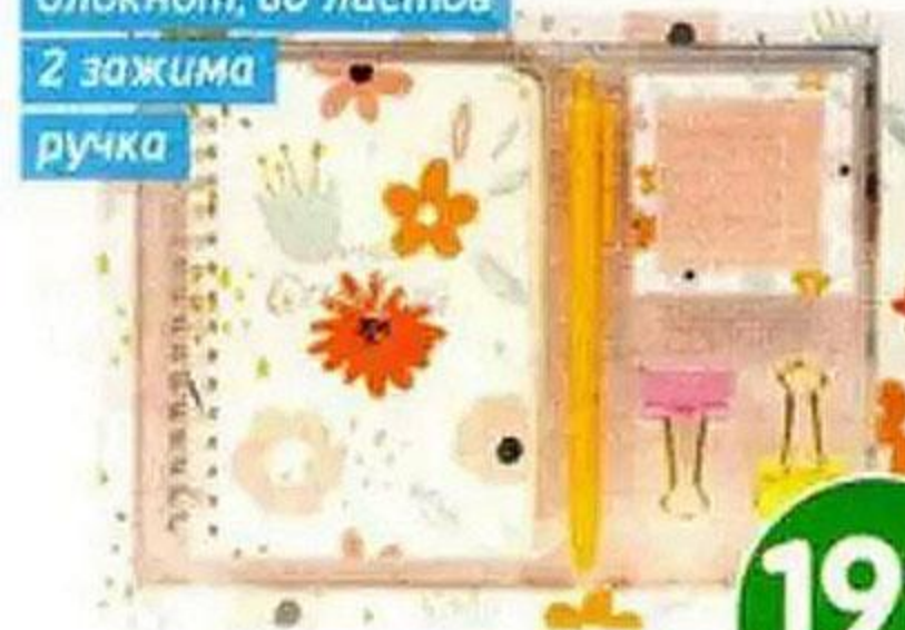
Набор подарочный, в ассортименте

клеящие листы, 60 шт. блокнот, 80 листов 2 зажима ручка