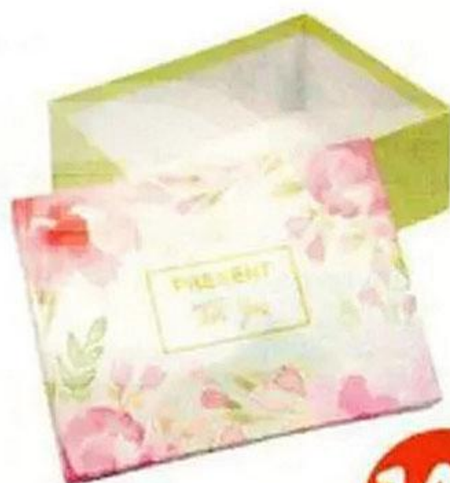
КОРОБКА ПОДАРОЧНАЯ, 20x15x8 см, в АССОРТИМЕНТЕ