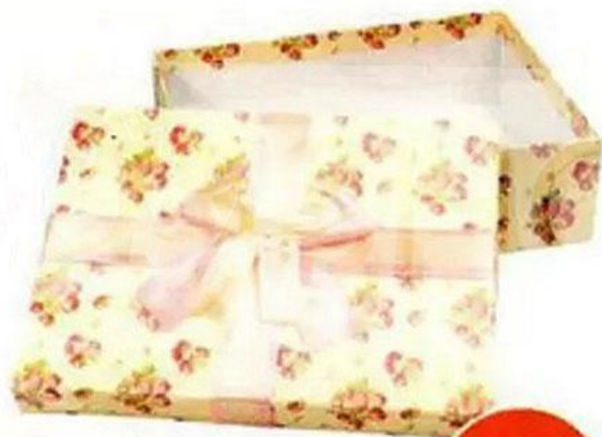
КОРОБКА ПОДАРОЧНАЯ, 20x15x6 см, в АССОРТИМЕНТЕ