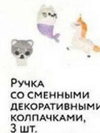
Ручка со сменными декоративными колпачками, 3 шт.