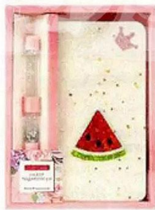
Набор подарочный, в ассортименте