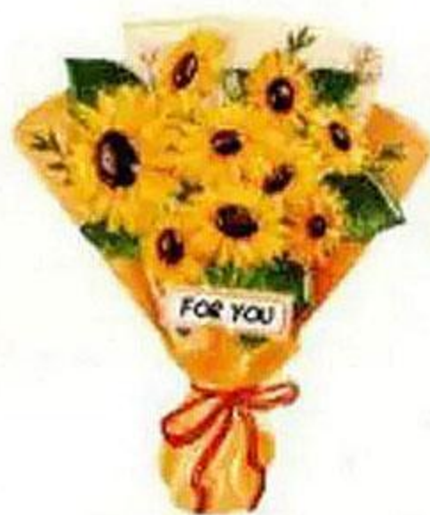
Магнит на холодильник, в ассортименте