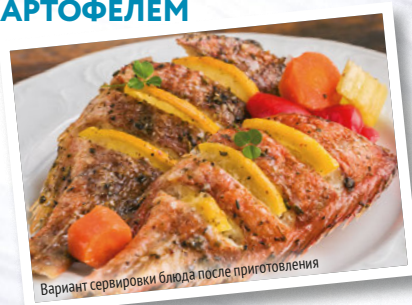
Вариант сервировки блюда после приготовления