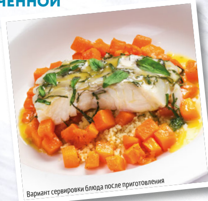
Вариант сервировки блюда после приготовления

Тыкву очистить и порезать на небольшие кусочки. Сливочное масло растопить и смешать с 3 ст. л. оливкового масла. Влить в тыкву, добавить сахар, посолить и перемешать. Разогреть духовку до 180 °С и запекать примерно 15 минут до готовности.