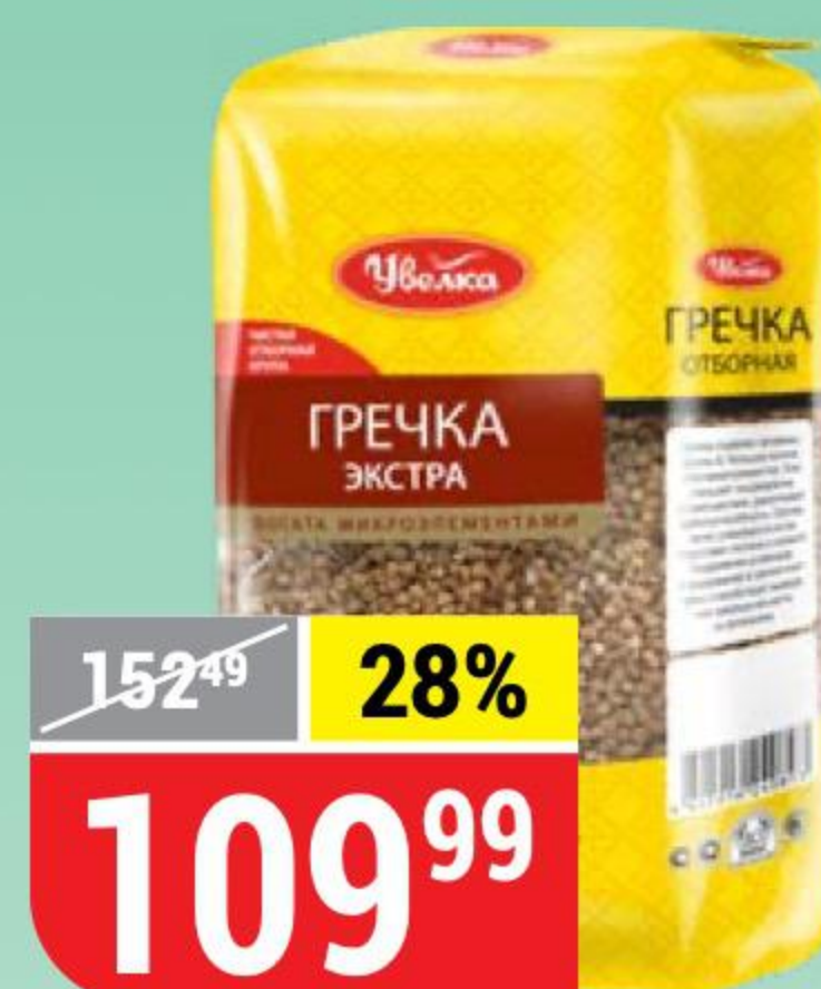
ГРЕЧКА ЭКСТРА отборная, Увелка, 800 г 131385