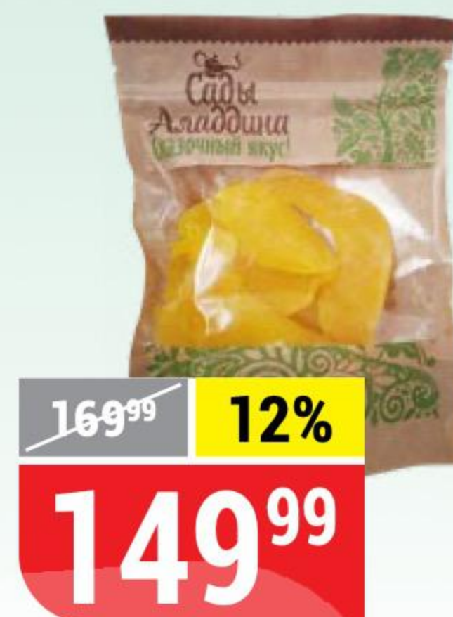
МАНГО сушеное, Сады Аладдина, 100 г 154265