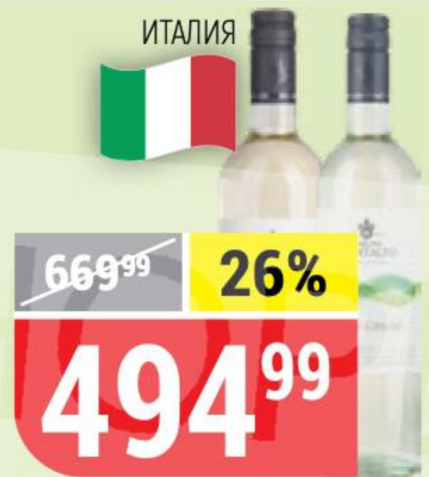
ВИНО BARONE MONTALTO pinot grigio; bianco, белое, полусухое, 12%, 0,75 л 141186/141196