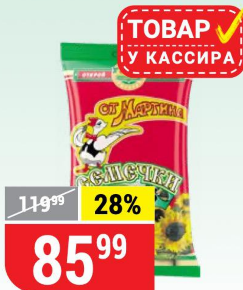
СЕМЕЧКИ ОТ МАРТИНА отборные, 200 г 125769