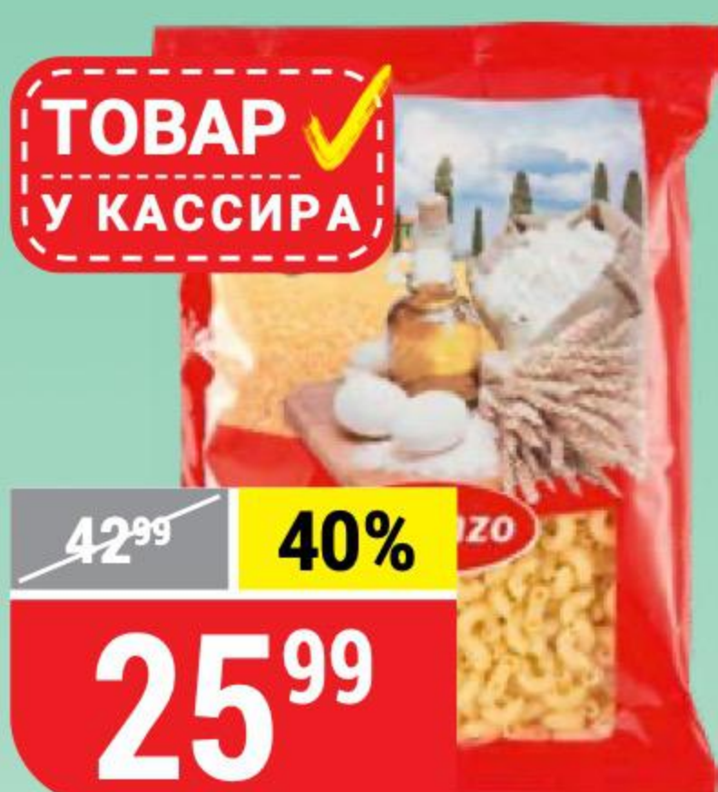
МАКАРОНЫ LORENZO рожки, 400 г 151960