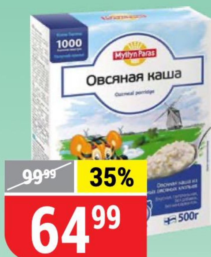
КАША ОВСЯНАЯ Myllyn Paras, 500 г 118694