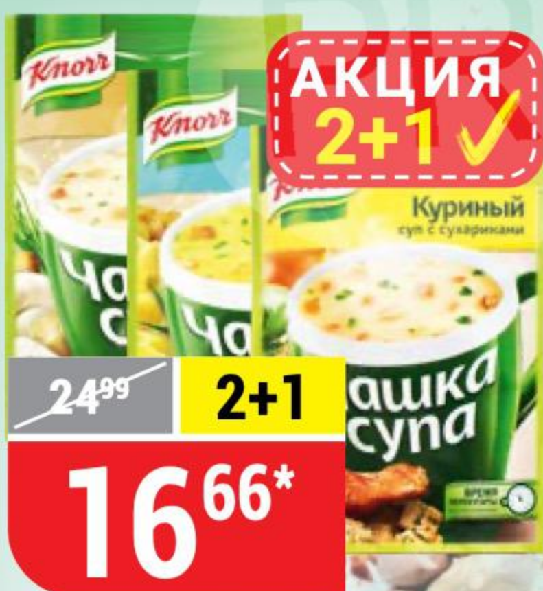
СУП KNORR в ассортименте, 14,8-16 г 103782/103783/109169/130452

* Цена указана за 1 шт. при покупке 3 шт. одновременно