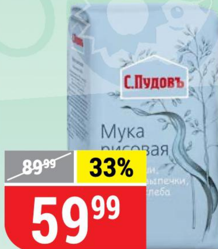
МУКА РИСОВАЯ С.Пудов', 500 г 144323

* Цена указана за 1 шт. при покупке 3 шт. одновременно