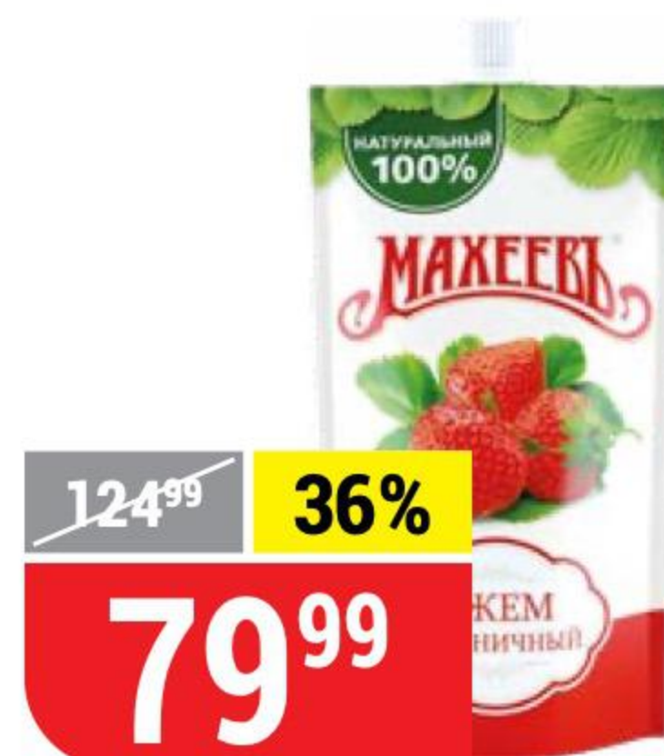
ДЖЕМ КЛУБНИЧНЫЙ Махеев, 300 г 127559