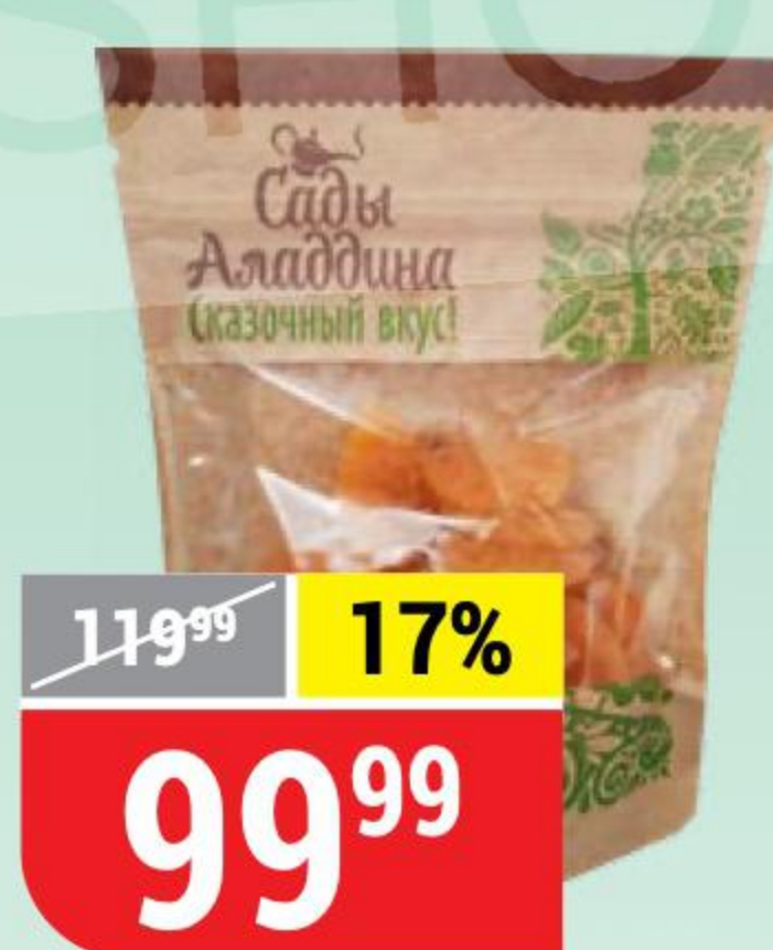
КУРАГА Сады Аладдина, 100 г 154267