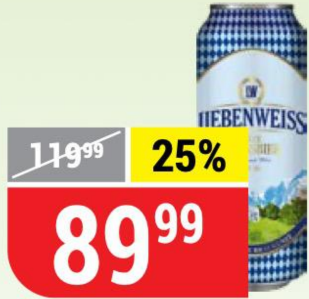
ПИВО LIEBENWEISS hefe-weissbier, светлое, 5,1%, 0,5 л 162336