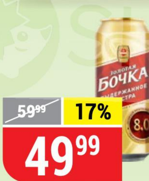
ПИВО ЗОЛОТАЯ БОЧКА экстра, темное, 8%, 0,45 л 134743