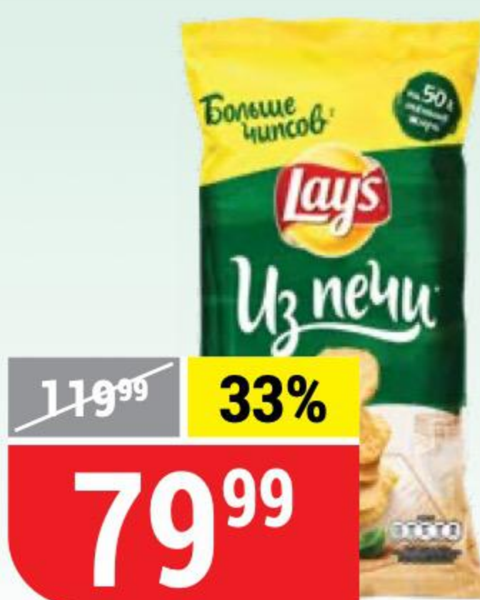
ЧИПСЫ LAY'S ИЗ ПЕЧИ сметана и ароматные травы, 120 г 143168