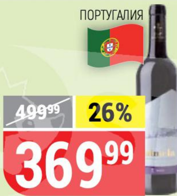
ВИНО PALMELA красное, полусухое, 14%, 0,75 л 160990