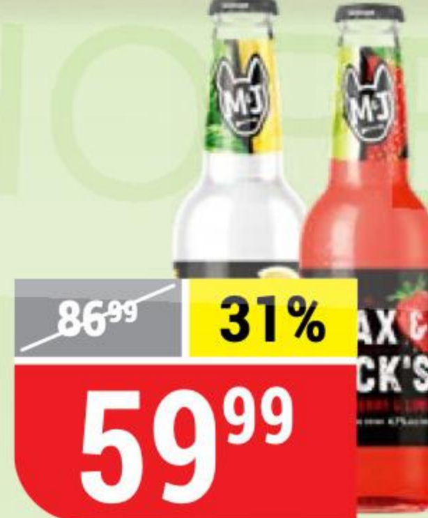
ПИВНОЙ НАПИТОК MAX&JACK'S strawberry-lime; lemon-gardenmint, нефильтрованный, 4,7%, 0,45 л 151783/151785