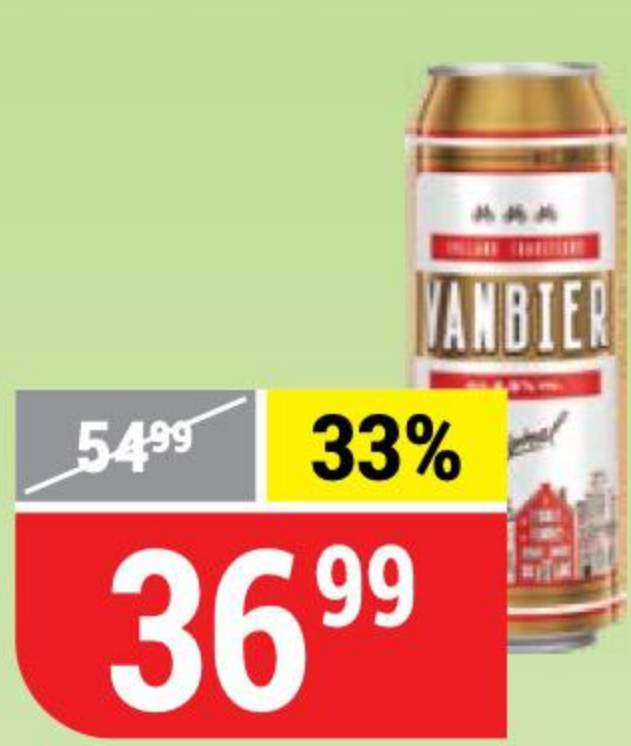
ПИВО VANBIER светлое, 4,5%, 0,45 л 154835