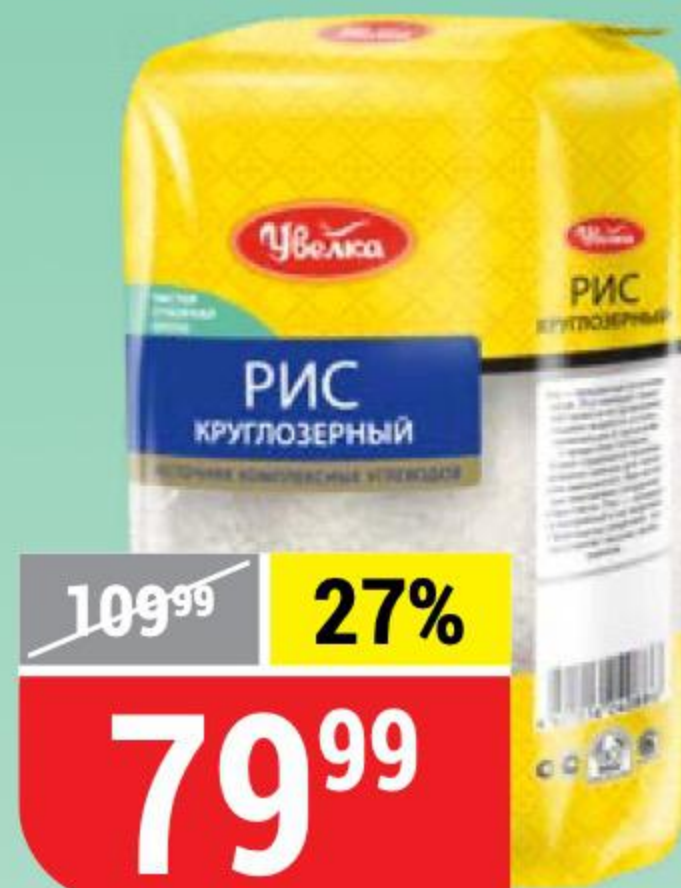
РИС КРУГЛОЗЕРНЫЙ Увелка, 800 г 131383