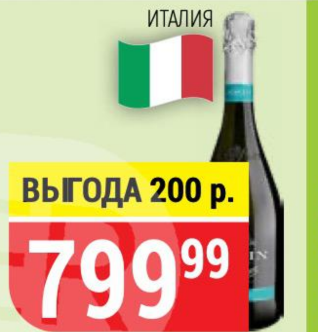
ВИНО ИГРИСТОЕ ZONIN prosecco, белое, брют, 11%, 0,75 л 155482