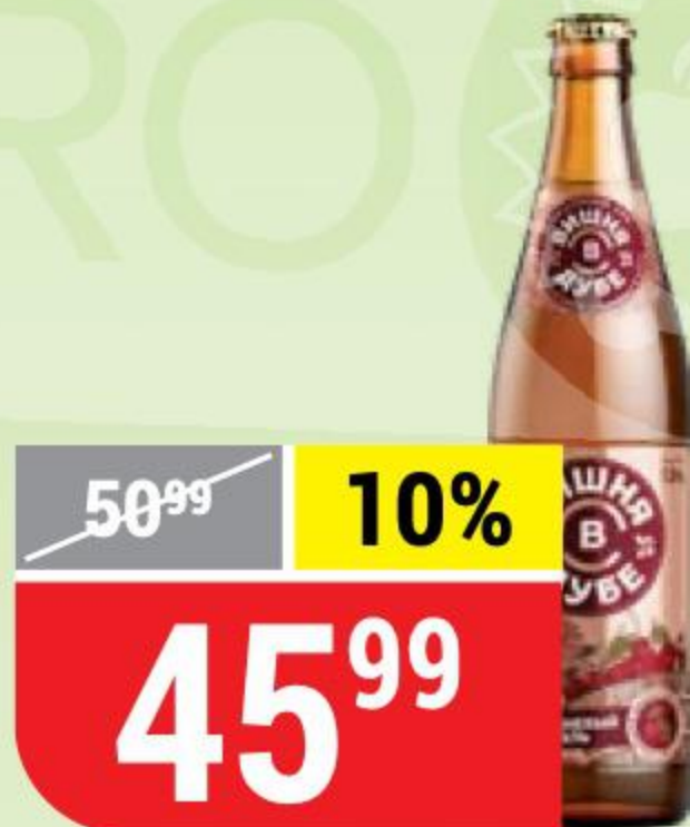
ПИВНОЙ НАПИТОК ВИШНЯ В ДУБЕ 5%, 0,45 л 144886