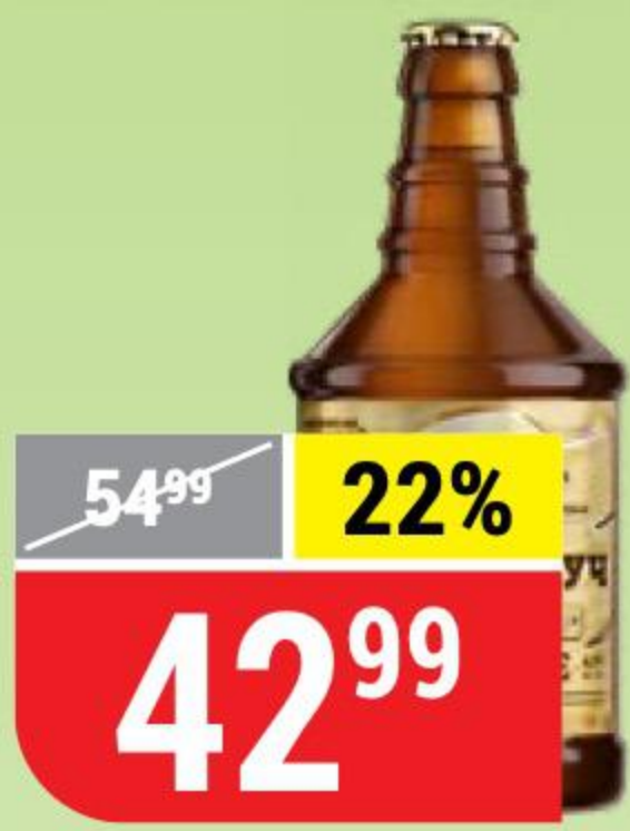
ПИВО ДУБ И ОБРУЧ бочковое, светлое, 4,9%, 0,45 л 154719