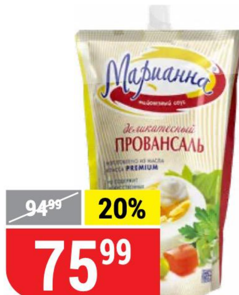
СОУС МАЙОНЕЗНЫЙ МАРИАННА деликатесный провансаль, 750 г 116334