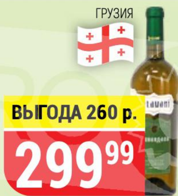
ВИНО KETAVANI цинандали, белое, сухое, 12%, 0,75 л 157212