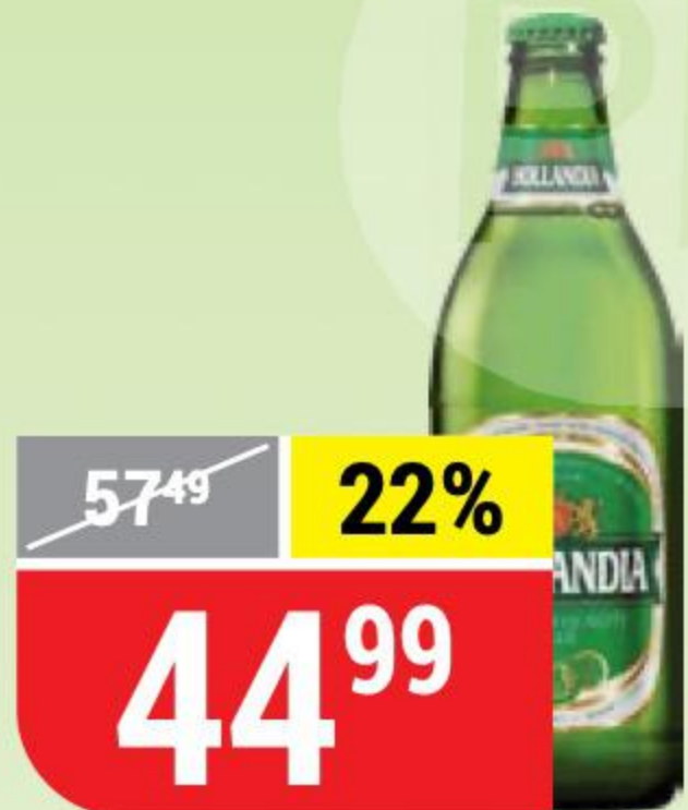
ПИВО HOLLANDIA 4,8%, 0,45 л 130819