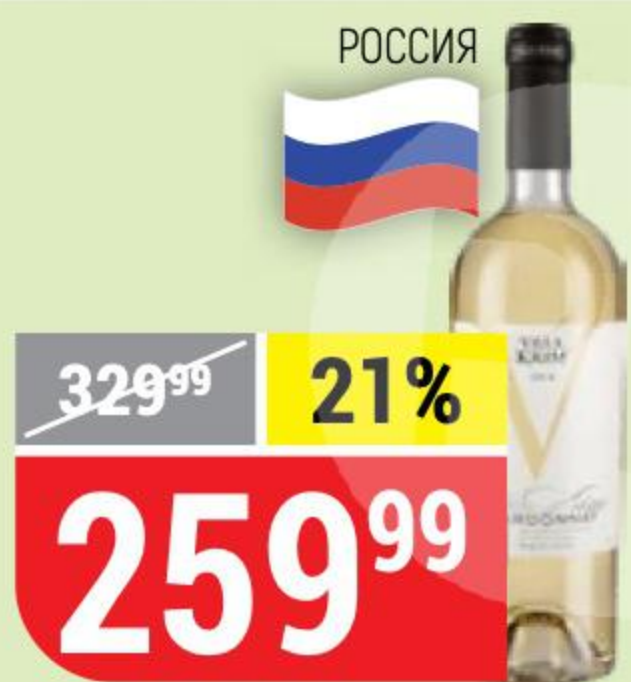
ВИНО VILLA KRIM chardonnay, белое, сухое, 13%, 0,75 л 127665