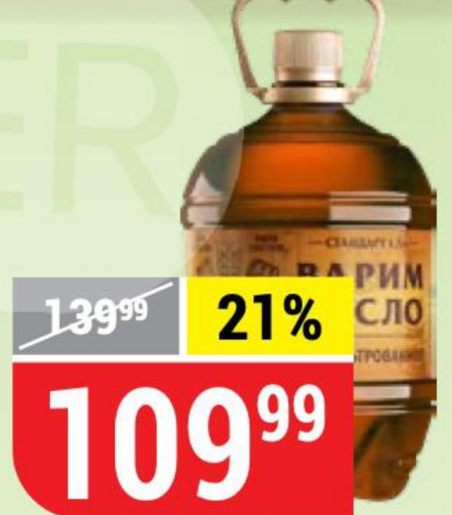
ПИВО ВАРИМ СУСЛО светлое, 4,9%, 1,5 л 162228