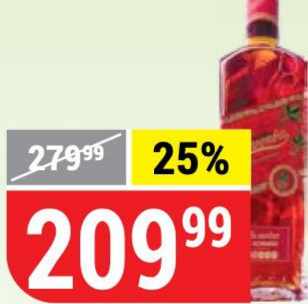
НАСТОЙКА КЛЮКВА НА КОНЬЯКЕ сормовская, сладкая, 21%, 0,5 л 135798