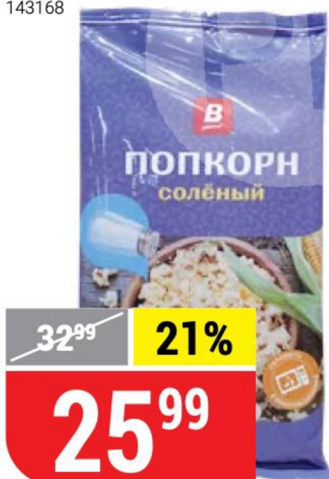
ПОПКОРН В с солью, 80 г 147160