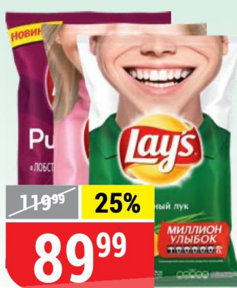
ЧИПСЫ LAY'S в ассортименте, 150 г 101876/124615/124616/127207/132452