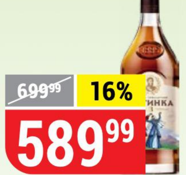
КОНЬЯК ЛЕЗГИНКА 3 года, 40%, Российский ККЗ, 0,5 л 142366