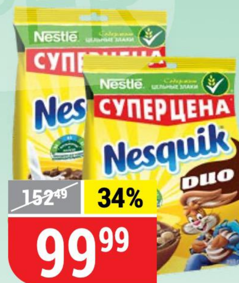
ГОТОВЫЙ ЗАВТРАК NESQUIK; NESQUIK DUO Nestle, 250 г 130164/130166