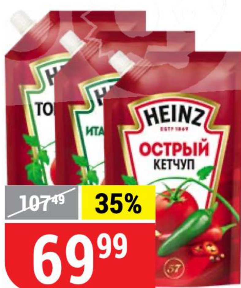
КЕТЧУП HEINZ в ассортименте, 320 г 157569/157571/157573/157643