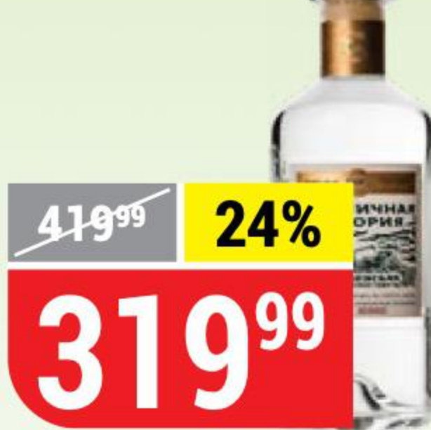
ВОДКА ПШЕНИЧНАЯ ИСТОРИЯ деревенская, 40%, 0,5 л 162396