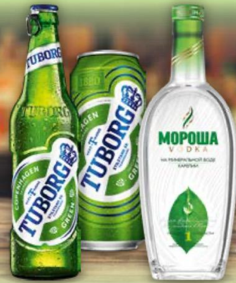
ПИВО TUBORG GREEN светлое, 4,6%, 0,45-0,48 л 123525/123826