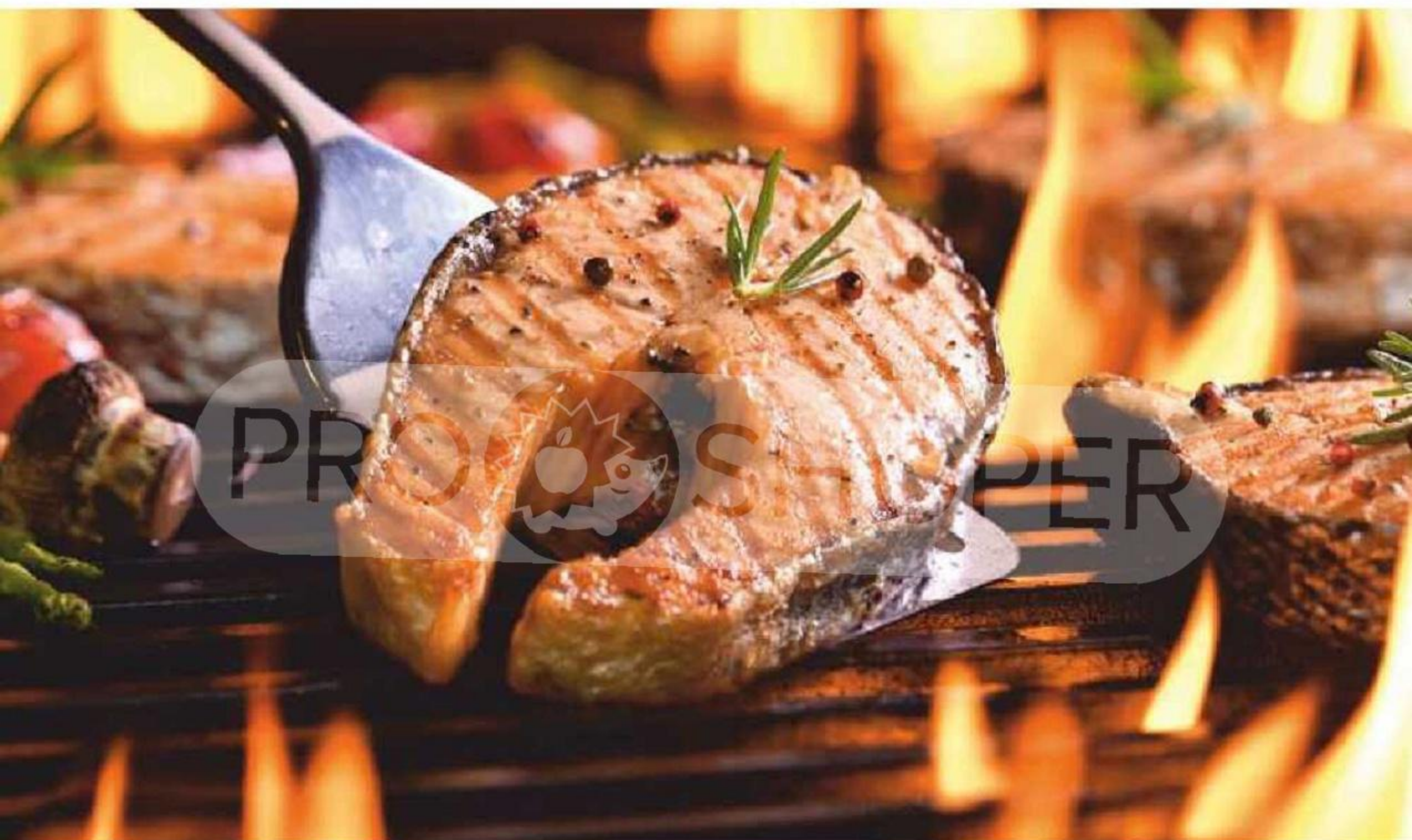
Икра Путина 120г Лососевая зернистая