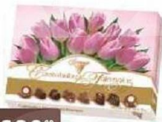
Набор конфет Байнд 110г Золотая; Красная; Коричневая подарочная упаковка