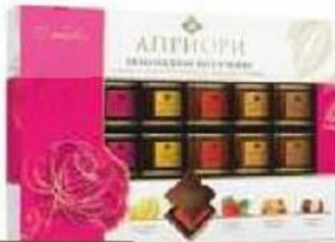
Набор конфет Солидарность 238г Шоколадные секреты Розы/Тюльпаны Польша