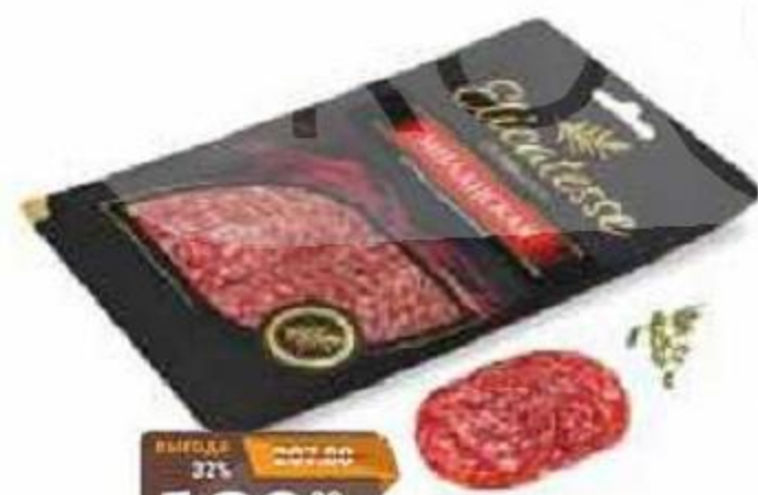
Колбаса Эликатессе 200г Фуэт сыровяленая