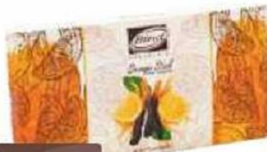
Конфеты Антон Берг 220г С марципаном Малина в апельсиновом лимере