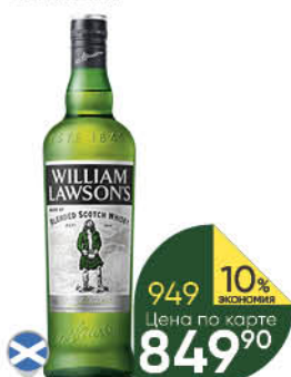
Виски WILLIAM LAWSON'S 40%, 0,7 л (Шотландия)