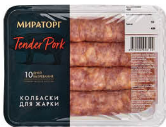
Колбаски свиные МИРАТОРГ для жарки охлажденные, 400 г

164 90 15% ЭКОНОМИЯ Цена по карте 139 90