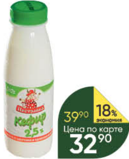
Кефир ПЕСТРАВКА 2,5%, 310 г