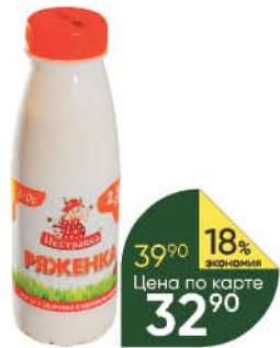
Ряженка ПЕСТРАВКА 2,5%, 310 г