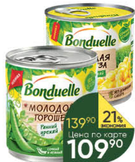
Консервы овощные BONDUELLE горошек зелёный молодой, 400 г; кукуруза молодая сладкая, 425 мл

139 90 21% ЭКОНОМИЯ Цена по карте 109 90