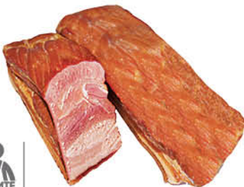
Грудинка ГАРИБАЛЬДИ Домашняя варено-копченая, 100 г