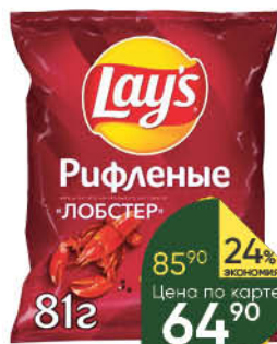
Чипсы LAY'S из натурального картофеля вассортименте, 81 г