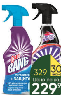
Чистящее средство CILLIT BANG в ассортименте, 750 мл