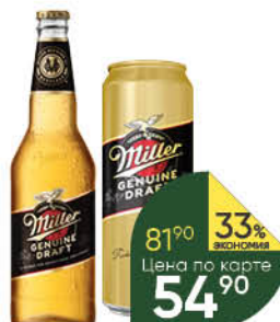
Напиток пивной MILLER Genuine Draft светлый 4,7%, 0,43-0,47 л (Россия)