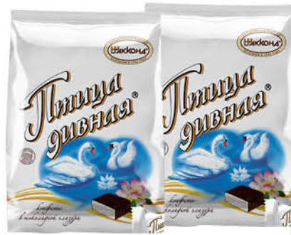
Конфеты шоколадные АККОНД Птица дивная, 300 г