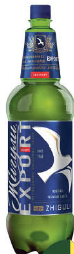
Пиво ЖИГУЛИ Барное Экспорт светлое 4,8%, 1,3 л (Россия)