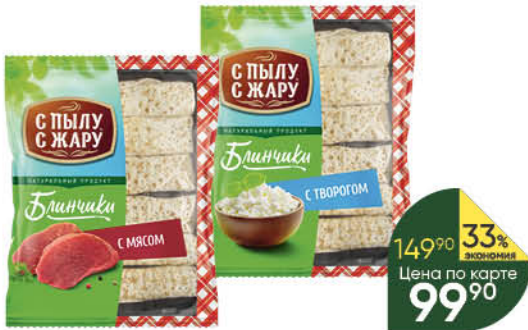
Блинчики С ПЫЛУ С ЖАРУ с мясом; с творогом, 360 г