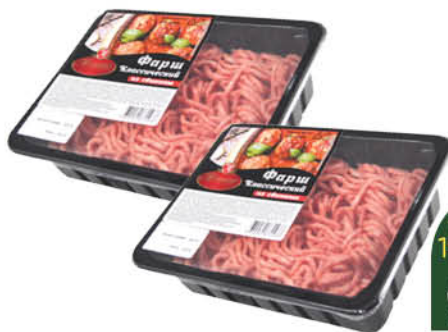
Фарш свиной АТЯШЕВО Классический охлажденный, 400 г