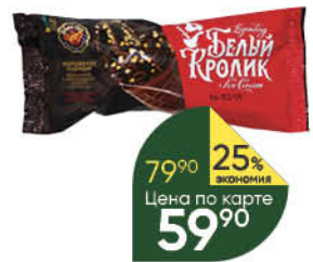
Мороженое САМ-ПО Белый кролик 15%, 70 г только для Самарской обл; г.Оренбург

164 90 21% экономия Цена по карте 129 90