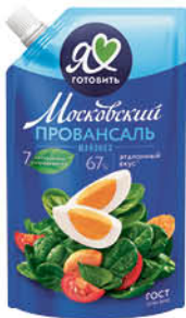
Майонез МОСКОВСКИЙ ПРОВАНСАЛЬ Классический 67%, 390 мл