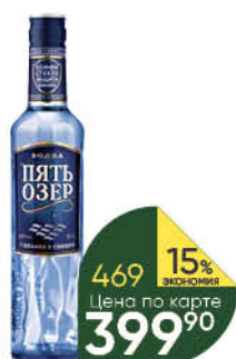
Водка ПЯТЬ ОЗЁР 40%, 0,7 л (Россия)

329 90 12% ЭКОНОМИЯ Цена по карте 289 90