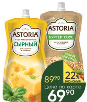
Соус майонезный ASTORIA в ассортименте 20–42%, 200–233 г