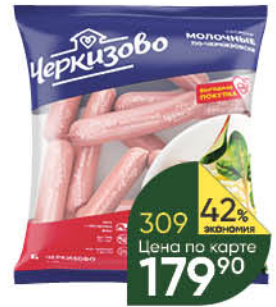
Сосиски ЧЕРКИЗОВО по-Черкизовски, 650 г