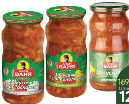
Консервы овощные ДЯДЯ ВАНЯ Закусочка Мелитопольская; По-тоскански; Венгерская, 460 г

169 90 24% ЭКОНОМИЯ Цена по карте 129 90