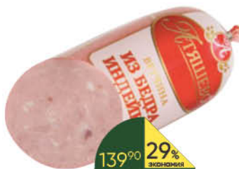
Ветчина АТЯШЕВО из бедра индейки, 500 г