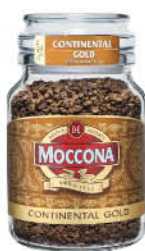
Кофе МОККОНА Continental Gold растворимый, 95 г