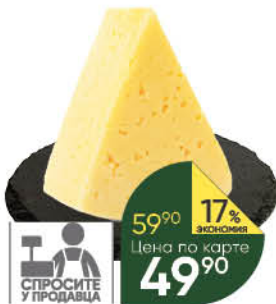
Сыр Российский 45%, 100 г