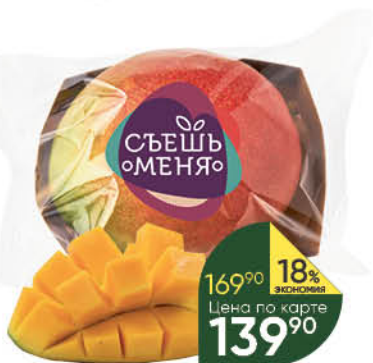
Манго спелый плод, 1 шт.

199 90 15% ЭКОНОМИЯ Цена по карте 169 90