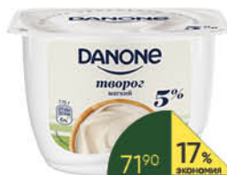
Творог DANONE мягкий 5%, 170 г