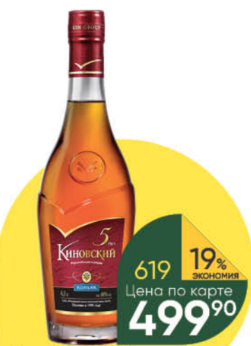
Коньяк КИНОВСКИЙ 5 лет 40%, 0,5 л (Россия)