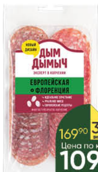
Набор колбас ДЫМ ДЫМЫЧ Европейская, Флоренция сыровяленая, 100 г

169 90 35% экономия Цена по карте 109 90