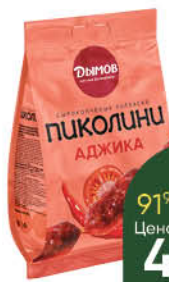
Колбаски ДЫМОВ Пиколлини-аджика сырокопченые, 50 г

189 90 21% экономия Цена по карте 149 90