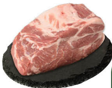
Шейка свиная без кости охлаждённая, 1 кг

164 90 15% ЭКОНОМИЯ Цена по карте 139 90