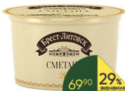
Сметана БРЕСТ-ЛИТОВСК 20%, 180 г