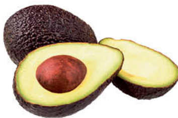
Авокадо READY TO EAT Hass, 1 уп.

169 90 18% ЭКОНОМИЯ Цена по карте 139 90