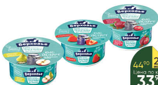
Биоюгурт ВЕРХОВЬЕ в ассортименте 2,9-3,5%, 150 г