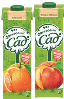
Сок; Нектар; Морс ФРУКТОВЫЙ САД в ассортименте, 0,95 л

при покупке 1 шт. цена 129 80 2 по цене 1 64 90 *