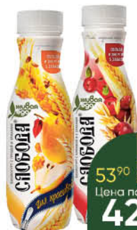
Биоюгурт СЛОБОДА в ассортименте 2%, 260 г