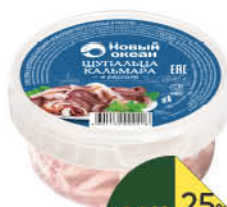
Щупальца кальмара НОВЫЙ ОКЕАН в рассоле, 180 г