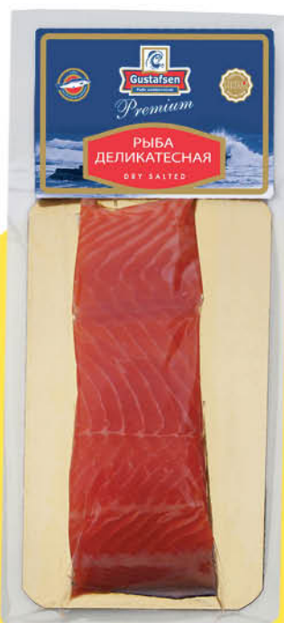
Форель GUSTAFSEN слабосоленая филе-кусоч, 180 г