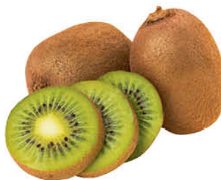
Киви, 1 кг

199 90 15% ЭКОНОМИЯ Цена по карте 169 90