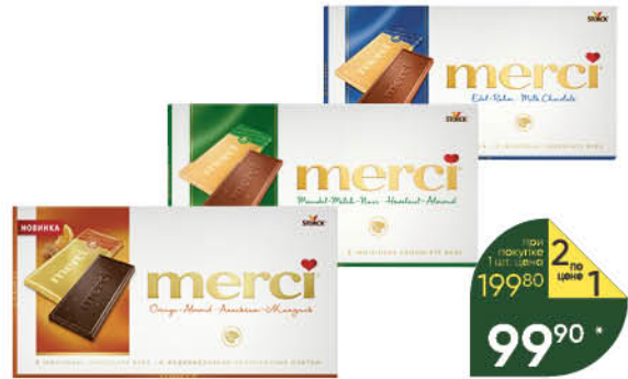
Шоколад MERCI в ассортименте, 100-112 г