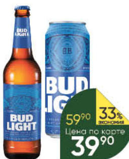
Пиво BUD Light светлое пастеризованное 4,1%, 0,44-0,45 л (Россия)