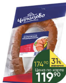
Колбаса ЧЕРКИЗОВО Варшавская традиционная полукопченая, 350 г

179 90 22% экономия Цена по карте 139 90