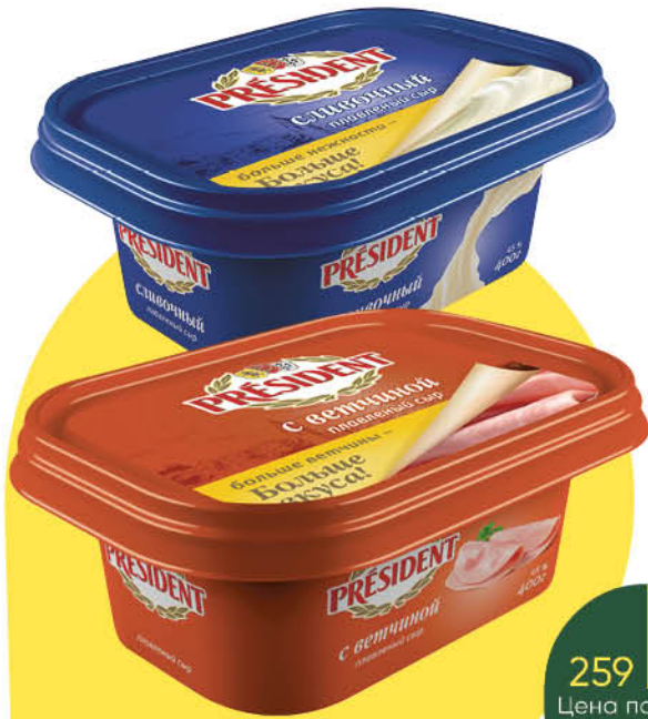
Сыр плавленый PRESIDENT с ветчиной; с грибами; сливочный 45%, 400 г