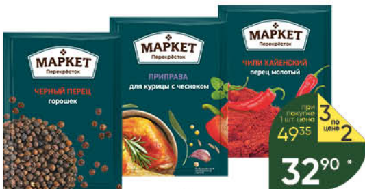
Приправы; Специи МАРКЕТ ПЕРЕКРЕСТОК в ассортименте, 5–28 г

174 90 26% ЭКОНОМИЯ Цена по карте 129 90