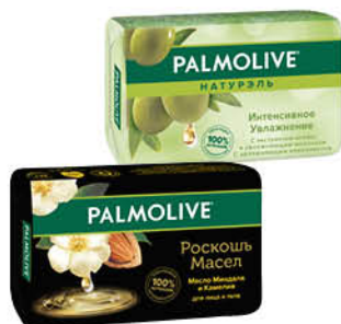
Мыло PALMOLIVE туалетное твёрдое в ассортименте, 90 г