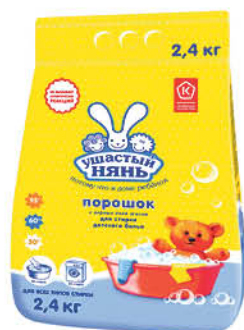
2,4 кг Стиральный порошок УШАСТЫЙ НЯНЬ для детского белья, 2,4 кг

359 90 25% экономия Цена по карте 269 90