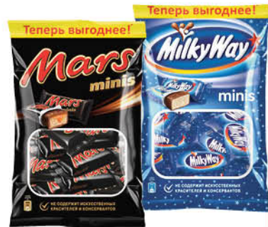
Шоколадный батончик SNICKERS; MARS; TWIX; MILKY WAY minis, 176-184 г

154 90 23% ЭКОНОМИЯ Цена по карте 119 90