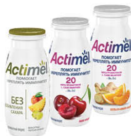
Напиток кисломолочный DANONE Actimel в ассортименте 2,2-2,5%, 95-100 г