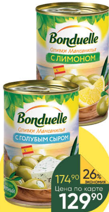
Маслины; Оливки BONDUELLE в ассортименте, 300 г

174 90 26% ЭКОНОМИЯ Цена по карте 129 90