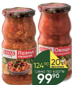
Консервы овощные ЕКО в ассортименте, 480–500 г

139 90 21% ЭКОНОМИЯ Цена по карте 109 90