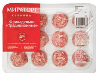
Фрикадельки МИРАТОРГ Традиционные охлажденные, 240 г