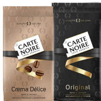
Кофе CARTE NOIRE Original; Crema Delice в зёрнах, 800 г