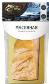
Рыба Масляная СИТИ-ФУД холодного копчения кусок, 200 г