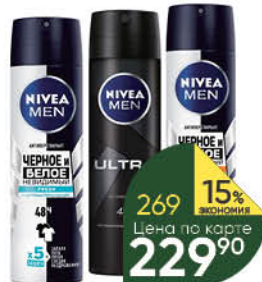
Антиперспирант NIVEA в ассортименте спрей, 150 мл