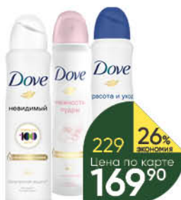
Антиперспирант DOVE в ассортименте, 150 мл