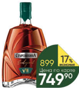
Коньяк СТАРЕЙШИНА Ecological KV 7 лет выдержанный 40%, 0,5 л (Россия)