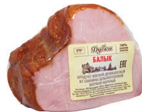
Балык свиной ДУБКИ копчено-вареный, 100 г