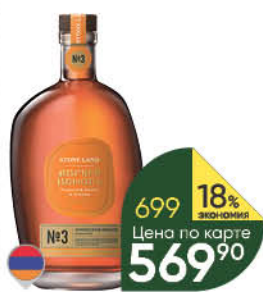
Коньяк STONE LAND Armenian №3 3 года 40%, 0,5 л (Армения)