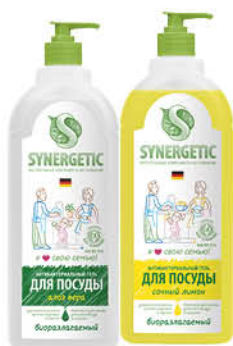
Средство для мытья посуды SYNERGETIC алоэ, лимон биоразлагаемое, 1 л