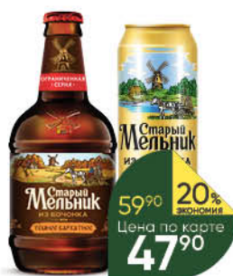
Пиво СТАРЫЙ МЕЛЬНИК Из Бочонка в ассортименте 4,2-5%, 0,45 л (Россия)