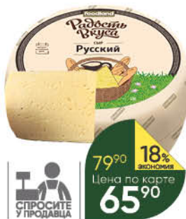
Сыр РАДОЖЬ ВКУСА Русский 45%, 100 г