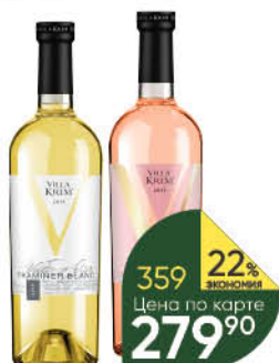
Вино VILLA KRIM в ассортименте 11-12%, 0,75 л (Россия)