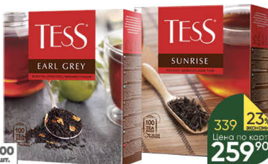
Чай TESS в ассортименте, 100 x 1,5-1,8 г

159 90 19% экономия Цена по карте 129 90