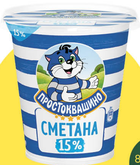
Сметана ПРОСТОКВАШИНО 15%, 300 г