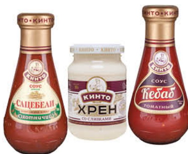
Соус; Хрен КИНТО в ассортименте, 180–310 г

169 90 24% ЭКОНОМИЯ Цена по карте 129 90