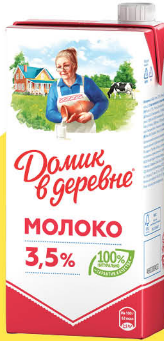
Молоко ДОМИК В ДЕРЕВНЕ 3,5%, 950 г