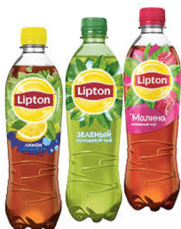
Холодный чай LIPTON в ассортименте, 0,5 л