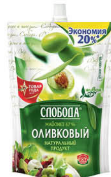
800 мл Майонез СЛОБОДА Оливковый, 800 мл

199.90 30% ЭКОНОМИЯ Цена по карте 139.90