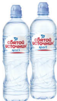
Вода СВЯТОЙ ИСТОЧНИК Sport питьевая негазированная, 0,75 л

при покупке 1 шт. цена 149 80 2 по цене 1 74 90 *