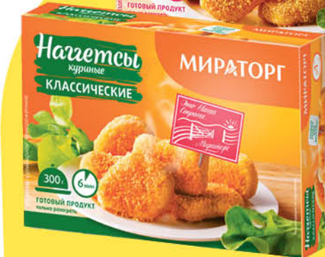
Наггетсы куриные МИРАТОРГ классические; с ветчиной, 300 г

169 90 29% экономия Цена по карте 119 90