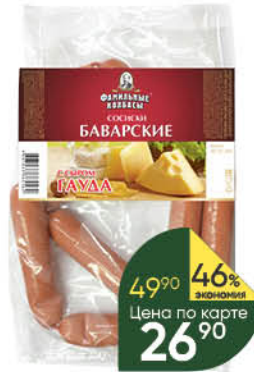
Сосиски ФАМИЛЬНЫЕ КОЛБАСЫ Баварские с сыром, 100 г