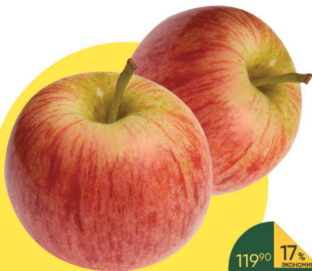
Яблоки Гала, 1 кг