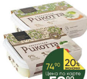
Сыр творожный СЕРНУРСКИЙ С3 Сернурская рикотта 30%, 200 г