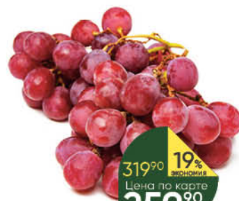
Виноград красный Ред Глоб, 1 кг

239 90 21% ЭКОНОМИЯ Цена по карте 189 90