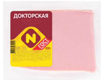
Колбаса ОСТАНКИНО Докторская ГОСТ вареная, 350 г