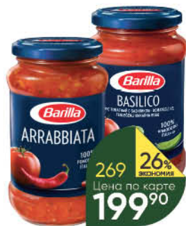
Соус томатный BARILLA Basilico с базиликом; Arrabbiata с перцем чили; Napoletana с овощами, 400 г