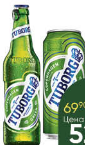
Пиво TUBORG Green светлое 4,6%, 0,45-0,48 л (Россия)