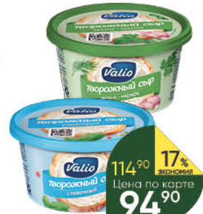
Сыр творожный VALIO с оливками-розмарином; с укропом-чесноком- петрушкой; сливочный 66-70%, 150 г