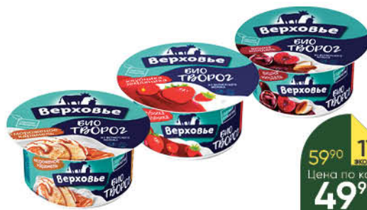
Биотворог ВЕРХОВЬЕ в ассортименте 4,2%, 140 г