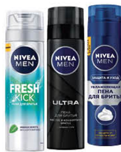
Пена для бритья NIVEA Men в ассортименте, 200 мл