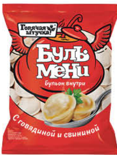
Пельмени ГОРЯЧАЯ ШТУЧКА Бульмени свинина-говядина, 900 г

179 90 39% экономия Цена по карте 109 90