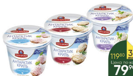
Крем-паста САНТА БРЕМОР Антарктик Криль классический; подкопчённый; сливочно-чесночный, 150 г