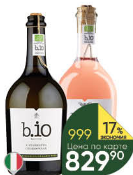
Вино B.I.O. в ассортименте 12,5-13,5%, 0,75 л (Италия)