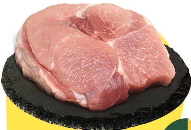
Свинина духовая без кости охлаждённая, 1 кг