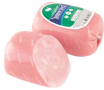
Ветчина ЧЕРКИЗОВО из индейки, 400 г