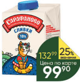
Сливки САРАФАНОВО ультрапастеризованные 10%, 480 мл