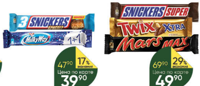
Шоколадный батончик SNICKERS; MILKY WAY, 52-60 г

189 90 32% ЭКОНОМИЯ Цена по карте 129 90