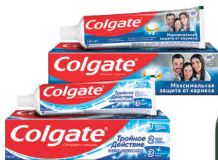
Зубная паста COLGATE в ассортименте, 100 мл