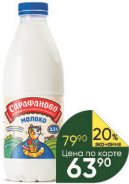
Молоко САРАФАНОВО пастеризованное 2,5%, 930 мл