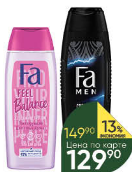
Гель для душа FA в ассортименте, 250 мл

149 90 13% экономия Цена по карте 129 90