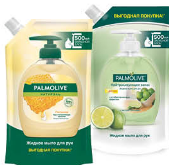
Мыло жидкое для рук PALMOLIVE Натураль питание; интенсивное увлажнение; нейтрализующее запах, 500 мл