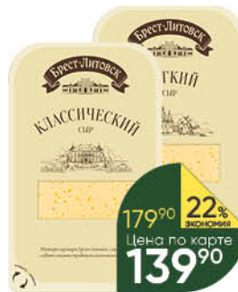
Сыр БРЕСТ-ЛИТОВСК Лёгкий 35%; Классический 45%, 150 г

179 90 22% ЭКОНОМИЯ Цена по карте 139 90