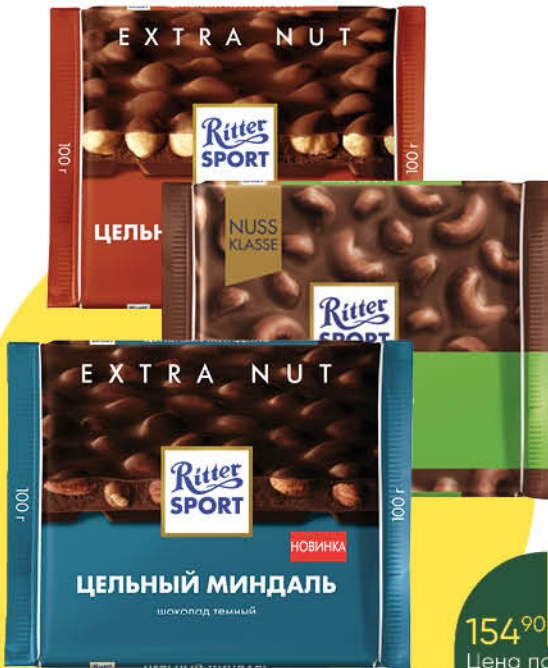
Шоколад RITTER SPORT в ассортименте, 100 г

154 90 23% ЭКОНОМИЯ Цена по карте 119 90