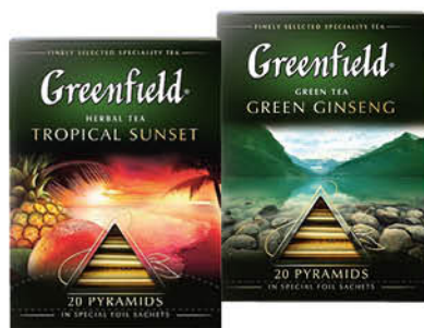
Чай GREENFIELD в ассортименте, 20 x 1,8-2 г

при покупке 1 шт. Цена 159 80 2 по цене 1 79 90 *