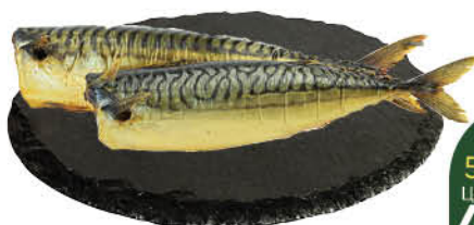
Скумбрия холодного копчения без головы, 1 кг