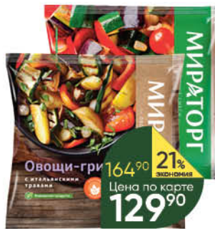
Смесь МИРАТОРГ Рататуй; Овощи-гриль с итальянскими травами, 400 г

164 90 21% экономия Цена по карте 129 90