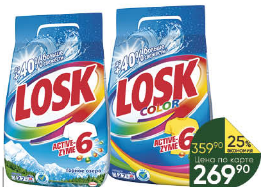
2,7 кг Средство для стирки LOSK Ароматерапия; Горное озеро; Color порошок, 2,7 кг

359 90 25% экономия Цена по карте 269 90