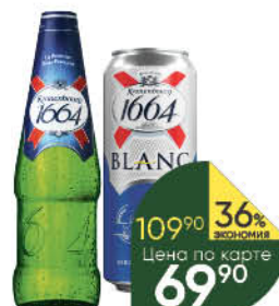
Пиво; Напиток пивной KRONENBOURG 1664 Classic; Blanc светлое 4,5%, 0,45-0,46 л (Россия)