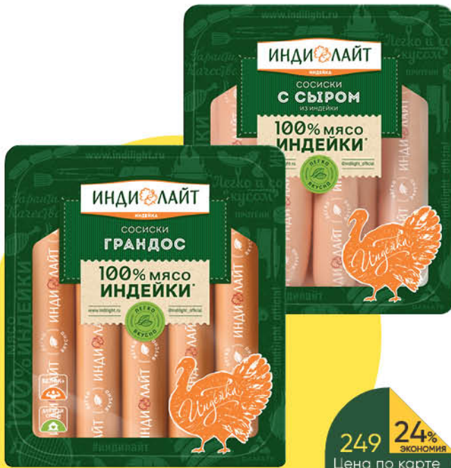
Сосиски ИНДИЛАЙТ Грандос; С сыром из индейки варёные, 440 г