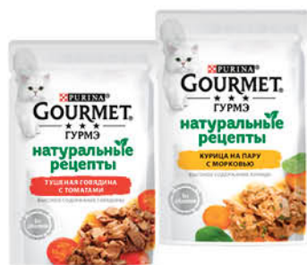
Корм для кошек PURINA Gourmet консервы в ассортименте, 75 г