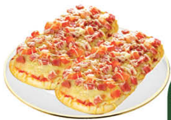
Пицца ПИЦЦЭРИКА Пиццетта пикантная, 100 г

174 90 31% экономия Цена по карте 119 90