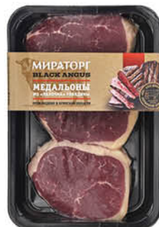
Медальоны МИРАТОРГ из яблочка говядины охлажденные, 490 г