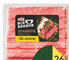
Крабовые палочки VICI Снежный краб, 200 г