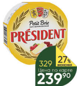
Сыр PRESIDENT Petit Brie мягкий с белой плесенью 60%, 125 г

159 90 19% ЭКОНОМИЯ Цена по карте 129 90