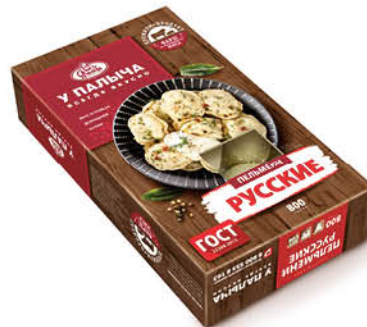
Пельмени У ПАЛЫЧА Русские, 800 г

269 90 22% экономия Цена по карте 209 90