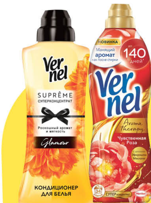
Кондиционер-ополаскиватель для белья VERNEL в ассортименте, 600-910 мл