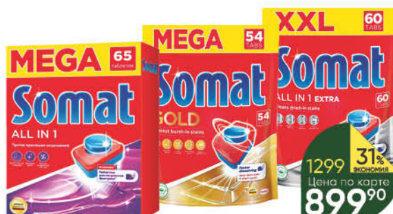
Таблетки для посудомоечной машины SOMAT Gold; All in 1 Extra; All in 1, 54-65 шт.

139 90 14% экономия Цена по карте 119 90