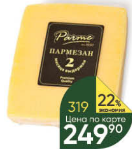
Сыр PARME Пармезан 43%, 200 г

179 90 22% ЭКОНОМИЯ Цена по карте 139 90