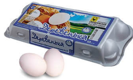
Яйцо куриное ДЕРЕВЕНЬКА С1, 10 шт.