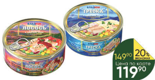
Консервы рыбные с овощами ВЛАДКОН Треска по-норвежски в сливочном соусе; Тунец по-гавайски; Лосось по-итальянски в томатном соусе, 240 г

139 90 21% ЭКОНОМИЯ Цена по карте 109 90