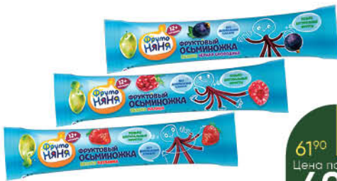
Фруктовые кусочки ФРУТОНЯНЯ яблоко-клубника; яблоко-малина; яблоко-чёрная смородина, 16 г

199.90 30% ЭКОНОМИЯ Цена по карте 139.90