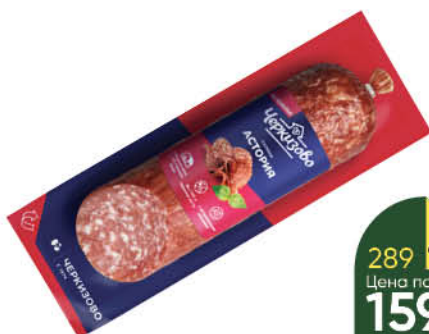
Салями ЧЕРКИЗОВО Астория сырокопченая, 225 г