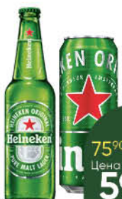
Пиво HEINEKEN светлое 4,8%, 0,43-0,47 л (Россия)