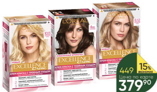
Крем-краска для волос L'OREAL PARIS Excellence Creme в ассортименте, 1 уп.