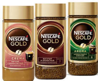
Кофе NESCAFÉ Gold Aroma Intenso растворимый с молотым; Gold Crema нежная пенка; Gold растворимый, 85-95 г