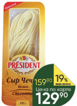
Сыр PRESIDENT Чечил белый спагетти 35%, 100 г

159 90 19% ЭКОНОМИЯ Цена по карте 129 90