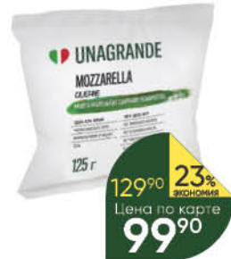
Сыр UNAGRANDE Mozzarella Ciligine 50%, 225 г