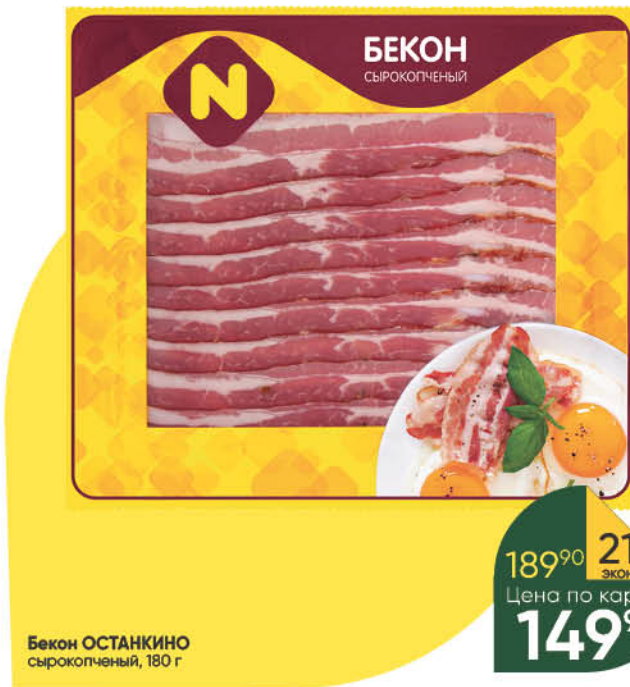
Бекон ОСТАНКИНО сырокопченый, 180 г

189 90 21% экономия Цена по карте 149 90