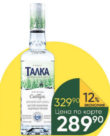
Водка ТАЛКА Сибирский кедр особая 40%, 0,5 л (Россия)

329 90 12% ЭКОНОМИЯ Цена по карте 289 90