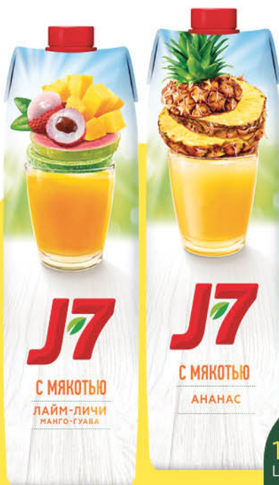
Сок; Нектар; Напиток J-7 в ассортименте, 0,97 л

при покупке 1 шт. цена 129 80 2 по цене 1 64 90 *