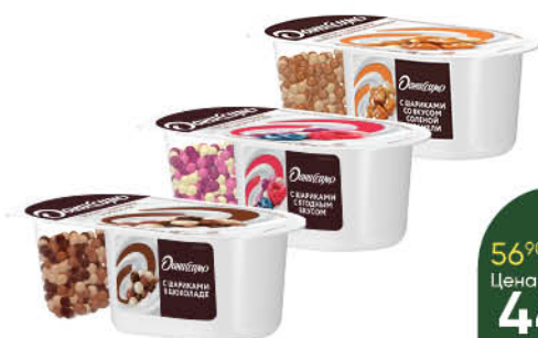
Йогурт ДАНИССИМО Фантазия с хрустящими шариками в ассортименте 6,9%, 105 г