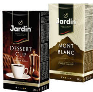
Кофе JARDIN в ассортименте молотый, 250 г