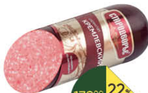
Сервелат СТАРОДВОРЬЕ Кремлевский варено-копченый, 350 г

169 90 35% экономия Цена по карте 109 90