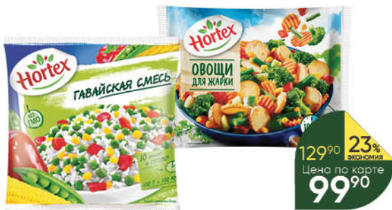
Смесь овощная HORTEX Гавайская; Овощи для жарки с картофелем обжаренным, 400 г