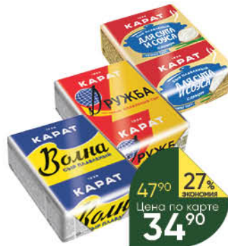
Сыр плавленый KARAT Волна; Дружба; С луком для супа 45%, 90 г