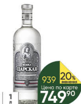
Водка ЛАДОГА Царская 40%, 1 л (Россия)