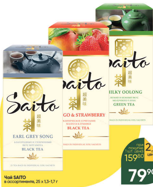
Чай SAITO в ассортименте, 25 x 1,3-1,7 г

при покупке 1 шт. Цена 159 80 2 по цене 1 79 90 *