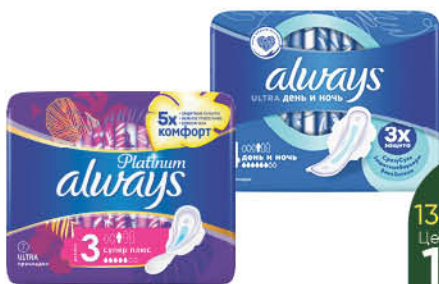
Прокладки гигиенические ALWAYS в ассортименте, 5-10 шт.

139 90 14% экономия Цена по карте 119 90