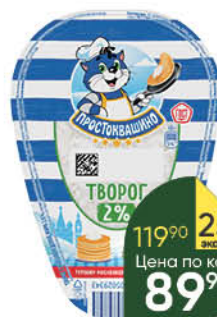
Творог ПРОСТОКВАШИНО 2%, 200 г