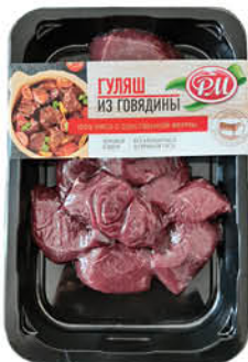
Гуляш из говядины РМ АГРО охлажденный, 400 г