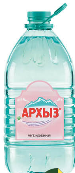
Вода АРХЫЗ горная природная питьевая негазированная, 5 л