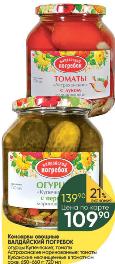
Консервы овощные ВАЛДАЙСКИЙ ПОГРЕБОК огурцы Купеческие; томаты Астраханские маринованные; томаты Кубанские неочищенные в томатном соке, 650–660 г; 720 мл

139 90 21% ЭКОНОМИЯ Цена по карте 109 90