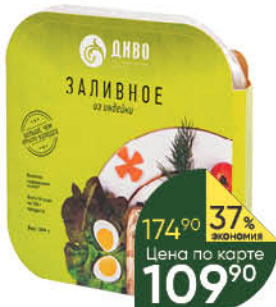
Заливное ДИВО из индейки, 300 г