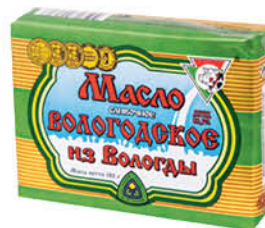
Масло сливочное ИЗ ВОЛОГДЫ Вологодское 82,5%, 180 г