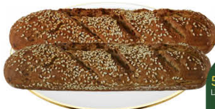
Багет BONAPE Фитнес, 210 г