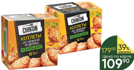
Котлеты СНИКОН куриные; из индейки, 300 г

169 90 29% экономия Цена по карте 119 90