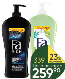
Гель; Гель-пена для душа FA в ассортименте, 750 мл

149 90 13% экономия Цена по карте 129 90