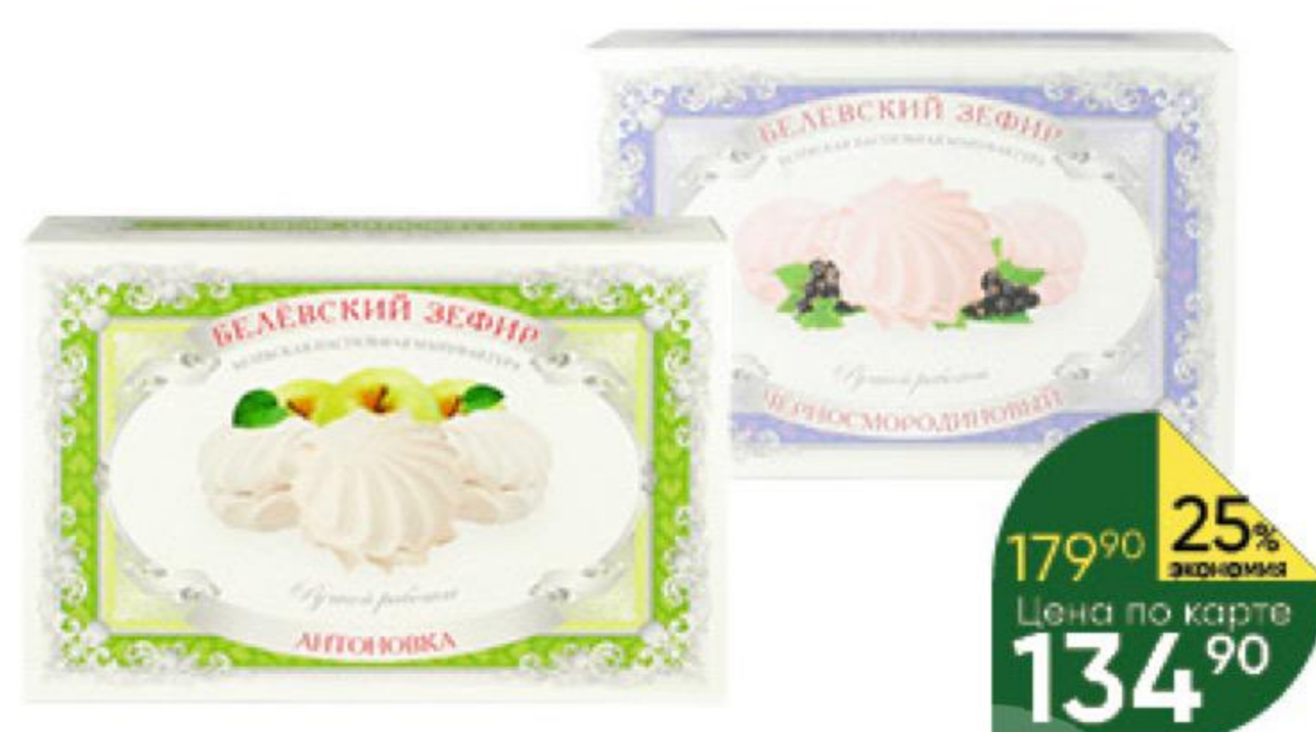
Зефир БЕЛЁВСКАЯ ПАСТИЛЬНАЯ МАНУФАКТУРА Антоновка; Зефирное детство; Чёрносмородиновый, 250 г

179 90 25% ЭКОНОМИЯ Цена по карте 134 90