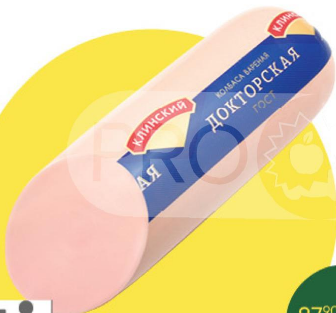
Колбаса КЛИНСКИЙ Докторская варёная, 100 г