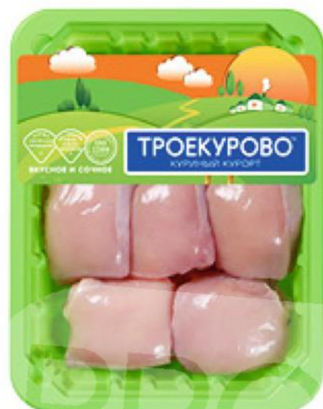
Филе бедра цыпленка-бройлера ТРОЕКУРОВО охлажденное, 750 г