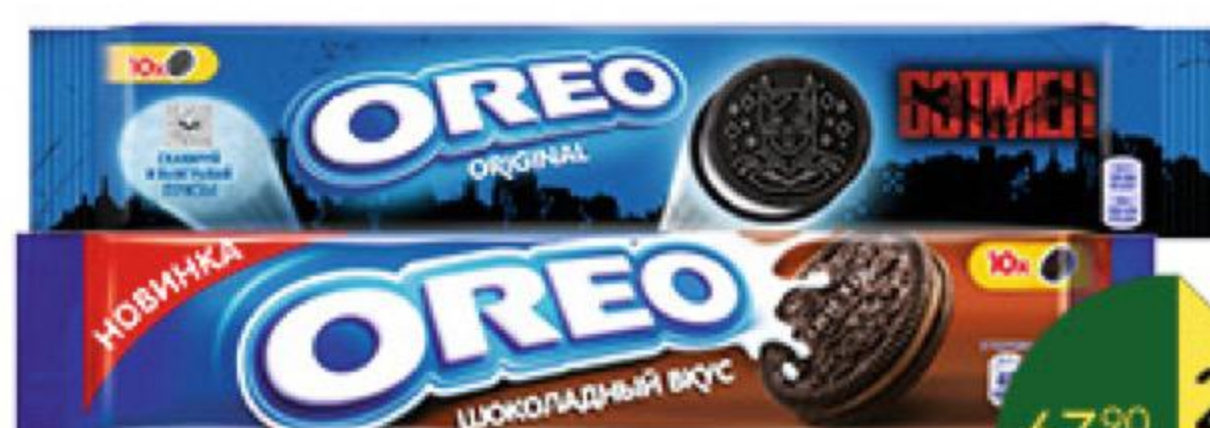
Печенье OREO с какао и начинкой с ванильным; клубничным; шоколадным вкусом, 95 г