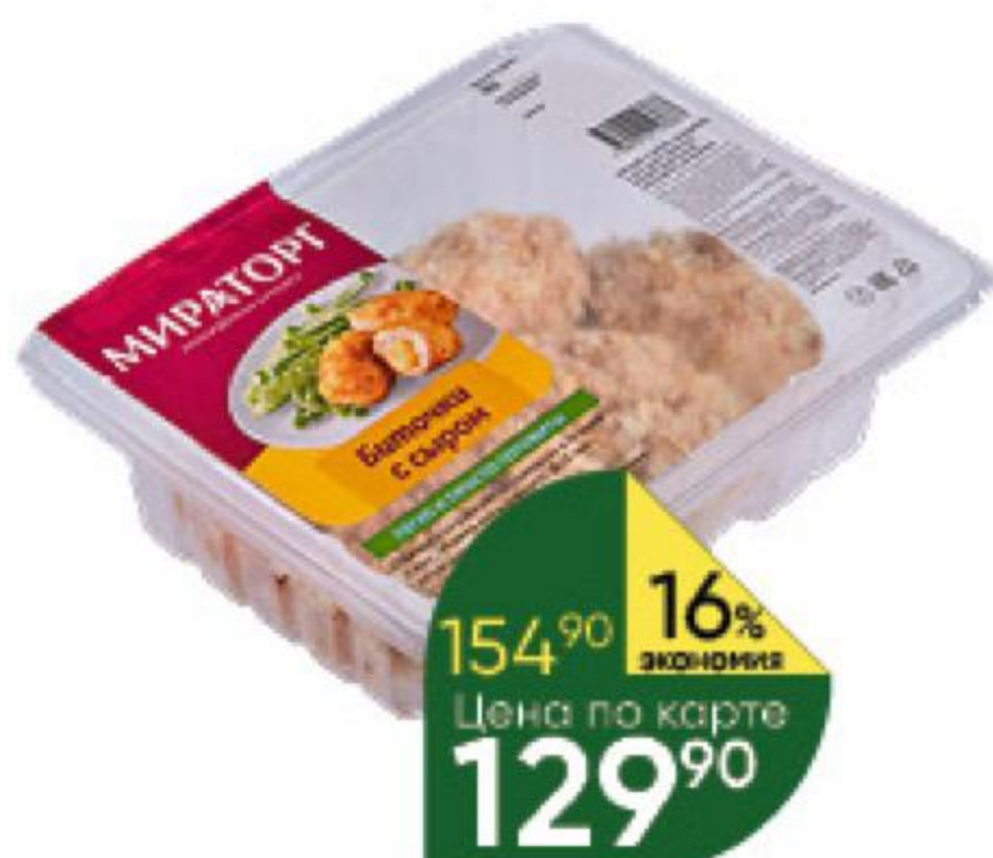
Биточки МИРАТОРГ С сыром из мяса цыпленка-бройлера охлажденные, 380 г

при покупке 1 шт. цена 149 80 74 90 * 2 по цене 1