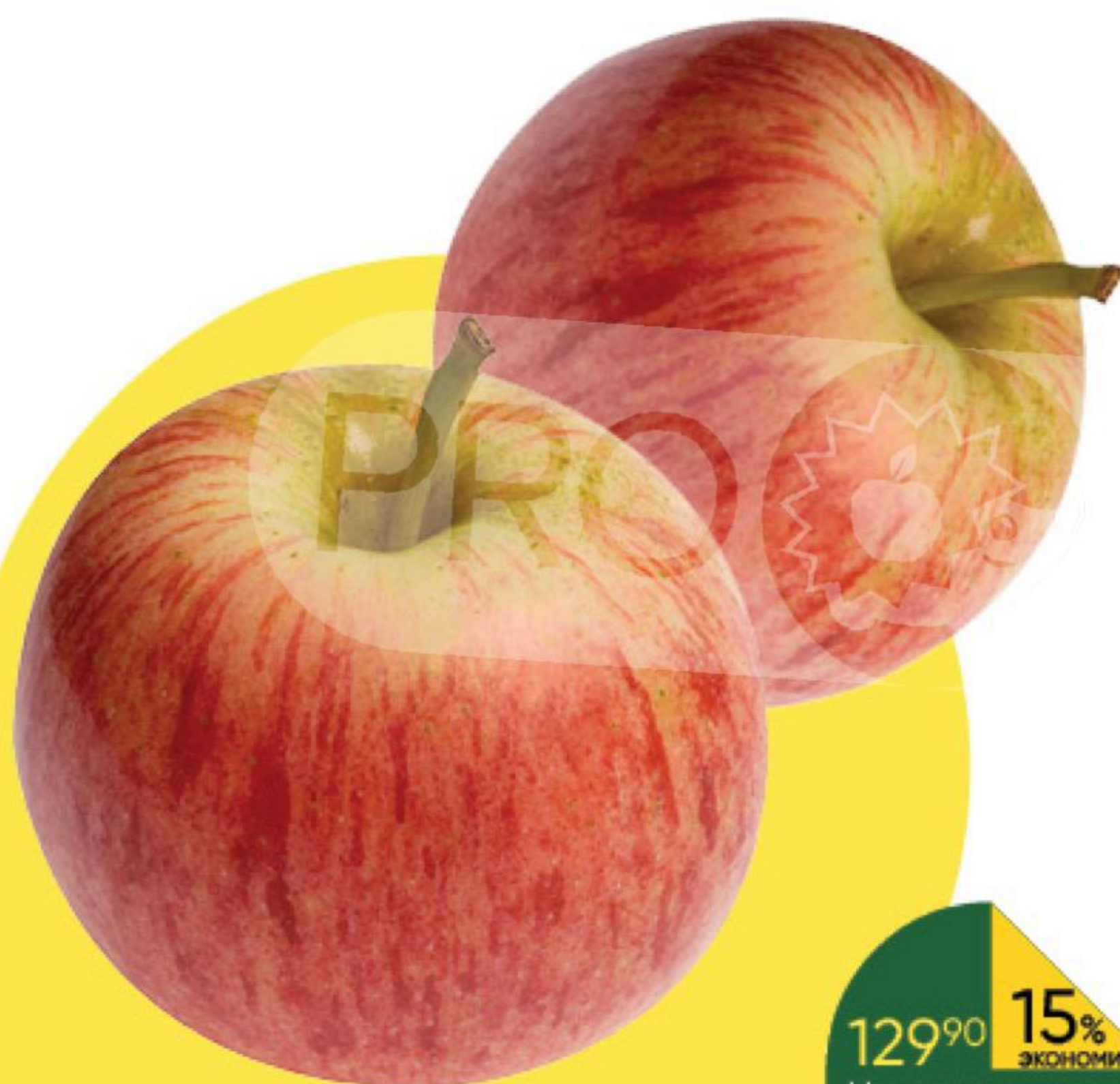
Яблоки Гала, 1 кг

129 90 15% ЭКОНОМИЯ Цена по карте 109 90