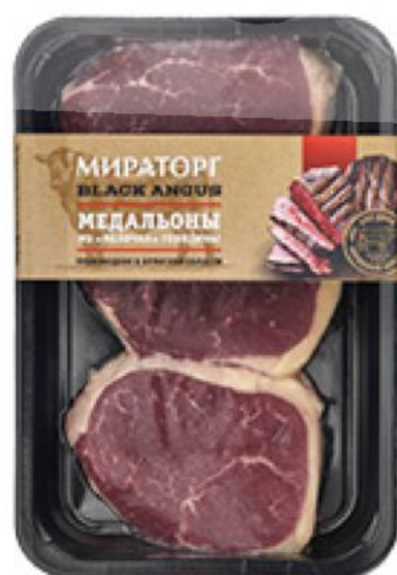
Медальоны МИРАТОРГ из яблочка говядины охлаждённые, 490 г