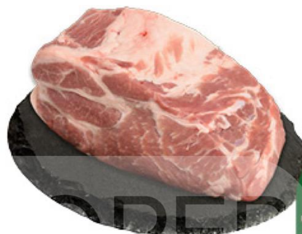
Шейка свиная без кости охлаждённая, 1 кг