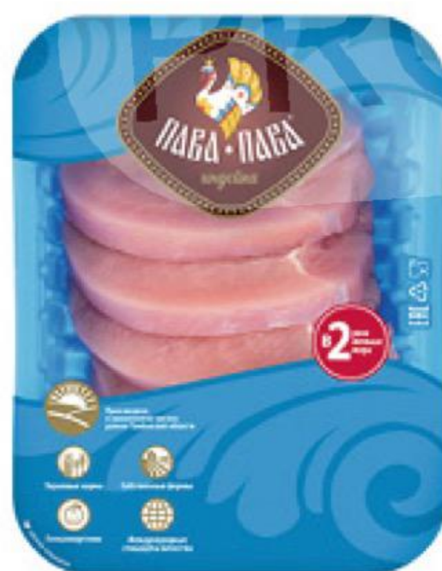
Эскалоп ПАВА-ПАВА из филе грудки индейки охлажденный, 600 г