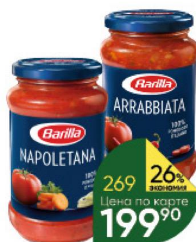
Соус томатный BARILLA Basilico с базиликом; Arrabbiata с перцем чили; Napolitana с овощами, 400 г