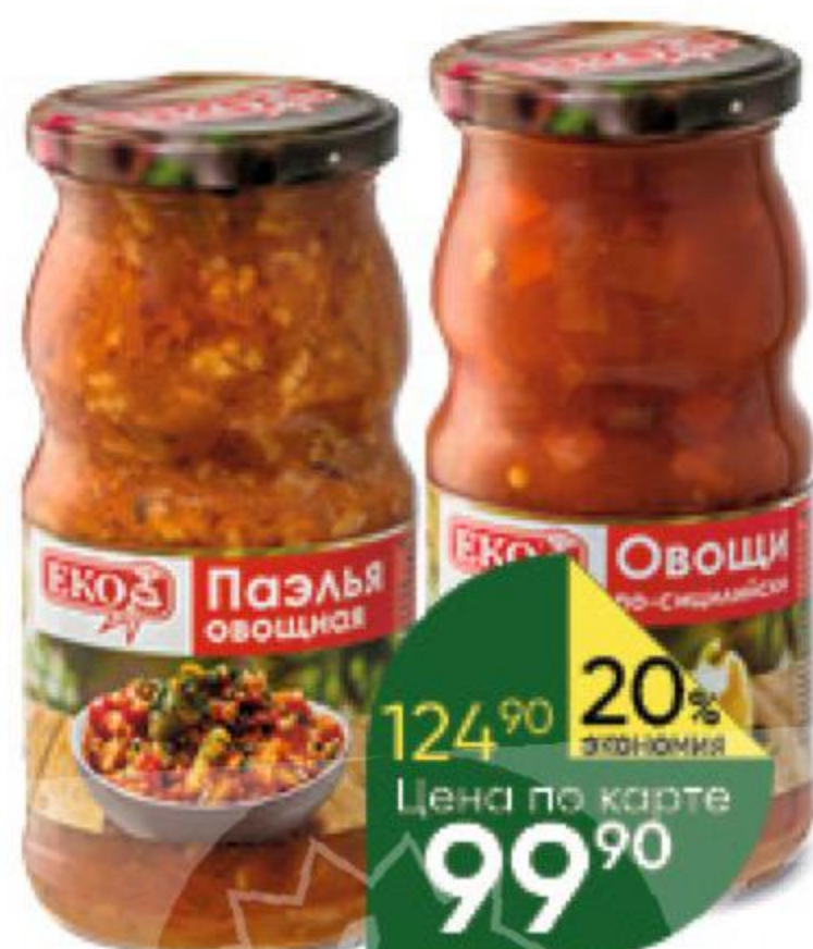
Консервы овощные ЕКО в ассортименте, 480-500 г

139 90 21% ЭКОНОМИЯ Цена по карте 109 90