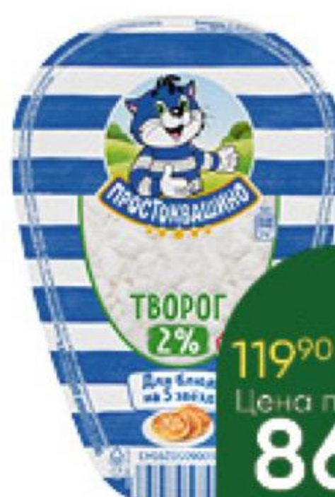
Творог ПРОСТОКВАШИНО 2%, 200 г