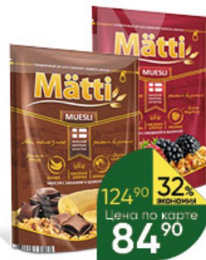
Мюсли МАТТИ с бананом и шоколадом; с ежевикой и малиной; с орехом и яблоком, 250 г