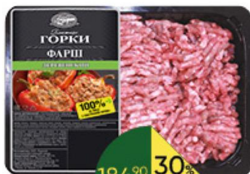
Фарш БЛИЖНИЕ ГОРКИ Деревенский охлаждённый, 400 г

189 90 Цена по карте 139 90 26% ЭКОНОМИЯ