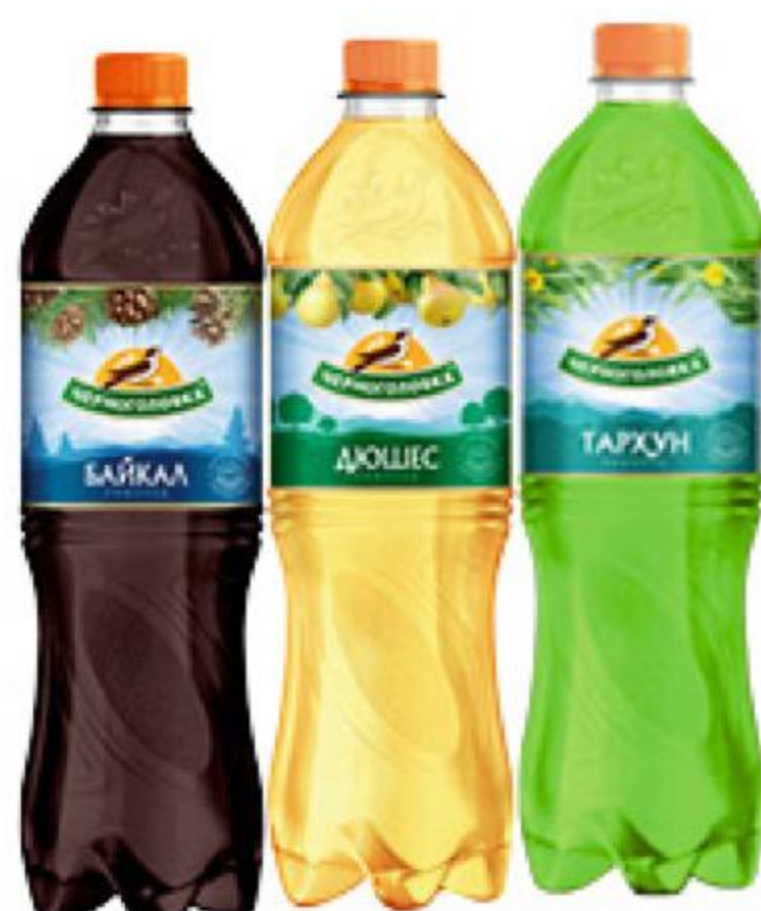
Напиток ЧЕРНОГОЛОВКА безалкогольный сильногазированный в ассортименте, 1,25 л