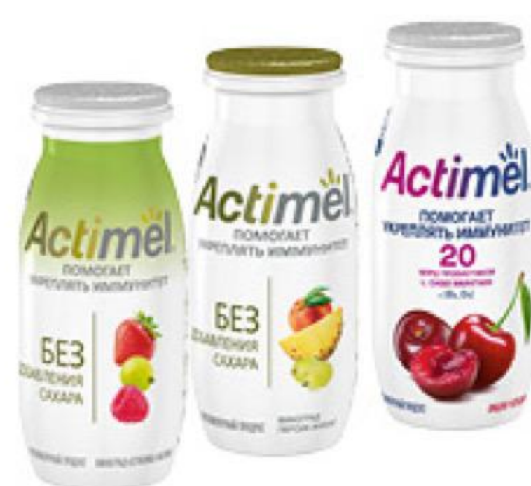
Напиток кисломолочный DANONE Actimel в ассортименте 2,2-2,5%, 95-100 г