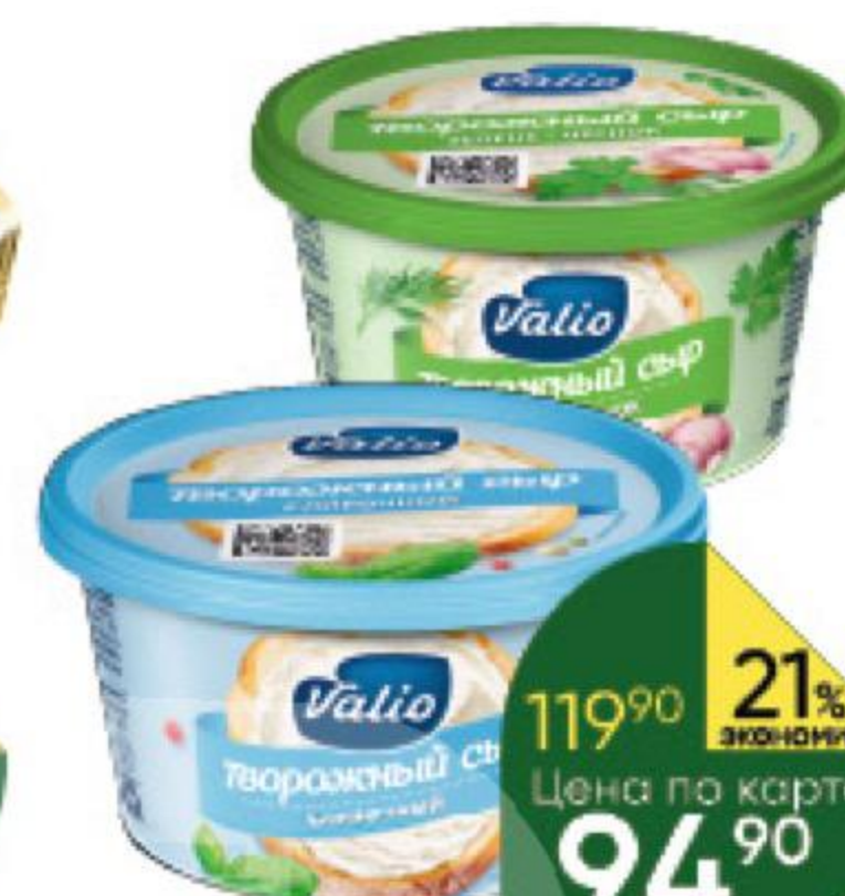
Сыр творожный VALIO с оливками-розмарином; с укропом-чесноком- петрушкой; сливочный 66-70%, 150 г