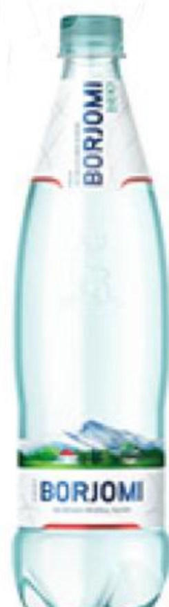
Вода минеральная BORJOMI природная лечебно-столовая газированная, 0,75 л