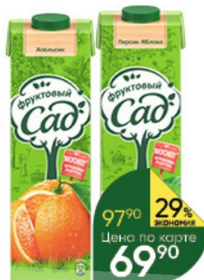
Сок; Нектар; Морс ФРУКТОВЫЙ САД в ассортименте, 0,95 л