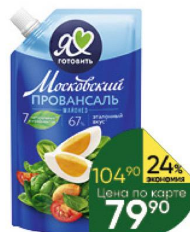
Майонез МОСКОВСКИЙ ПРОВАНСАЛЬ классический 67%, 390 мл