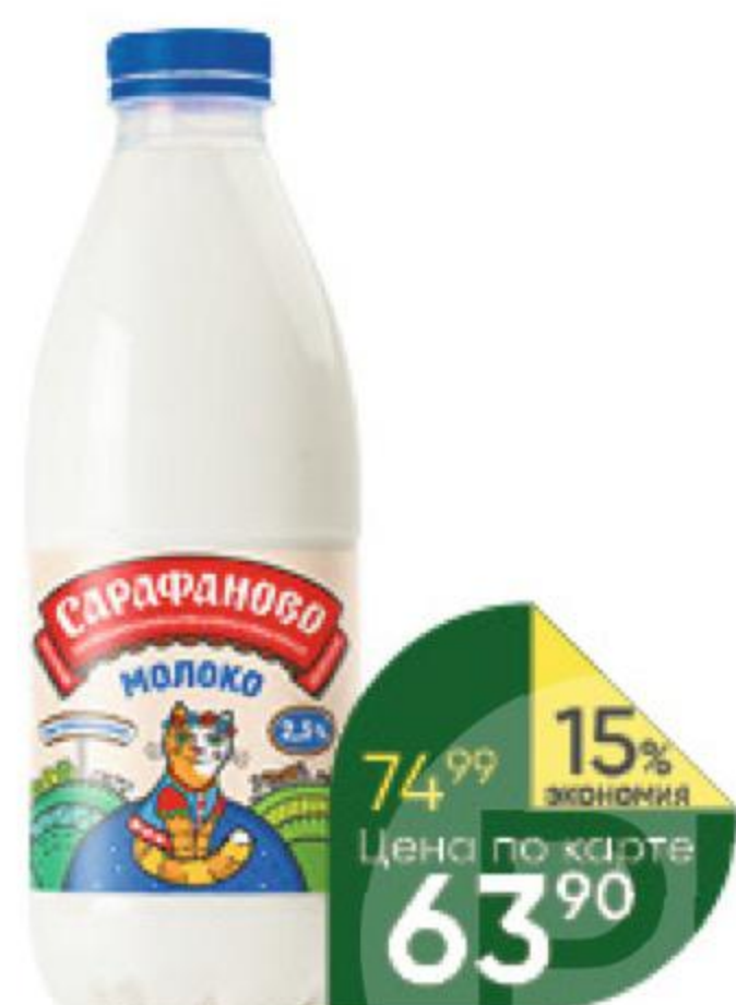
Молоко САРАФАНОВО пастеризованное 2,5%, 930 мл