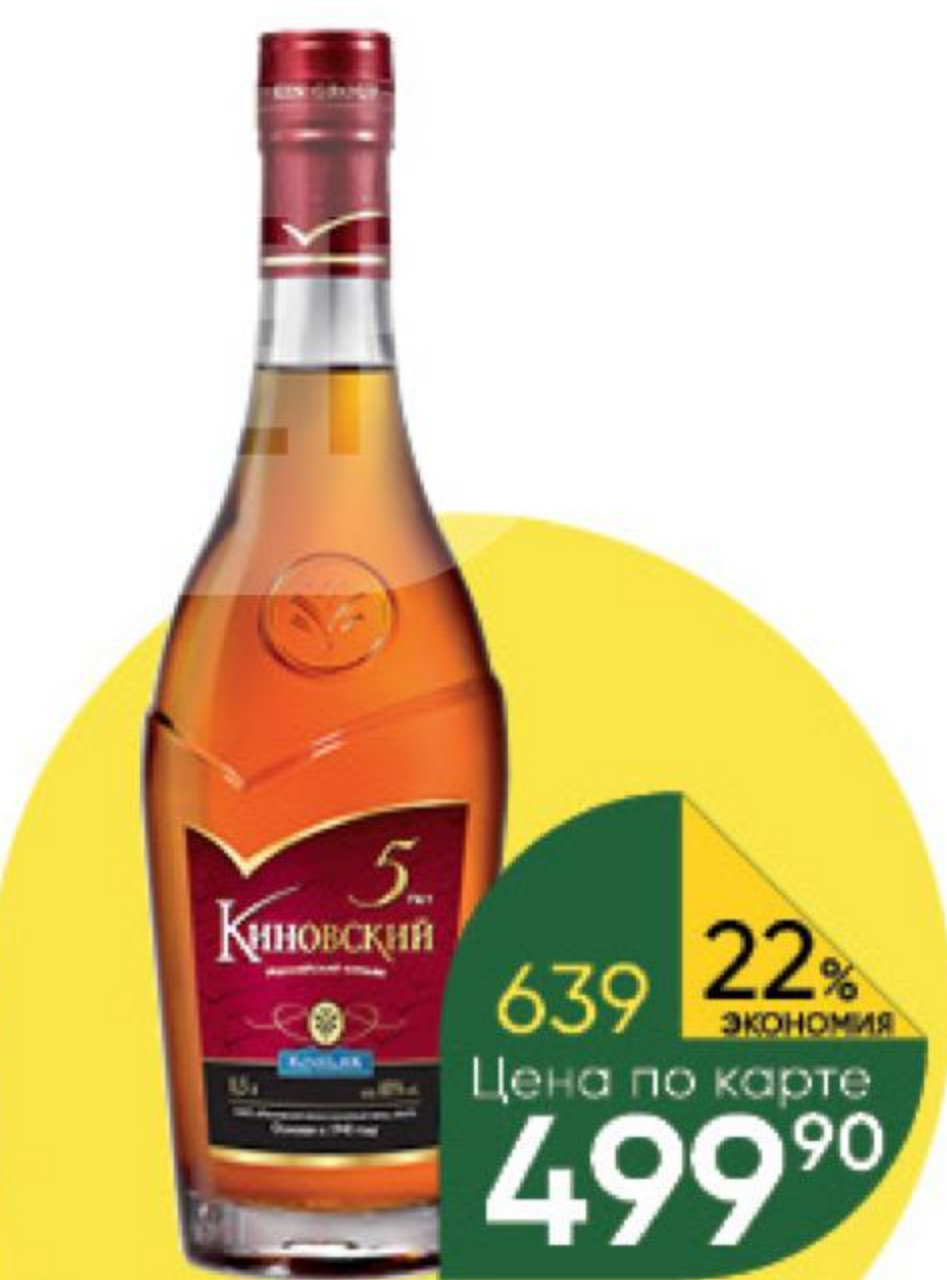
Коньяк КИНОВСКИЙ 5 лет 40%, 0,5 л (Россия)