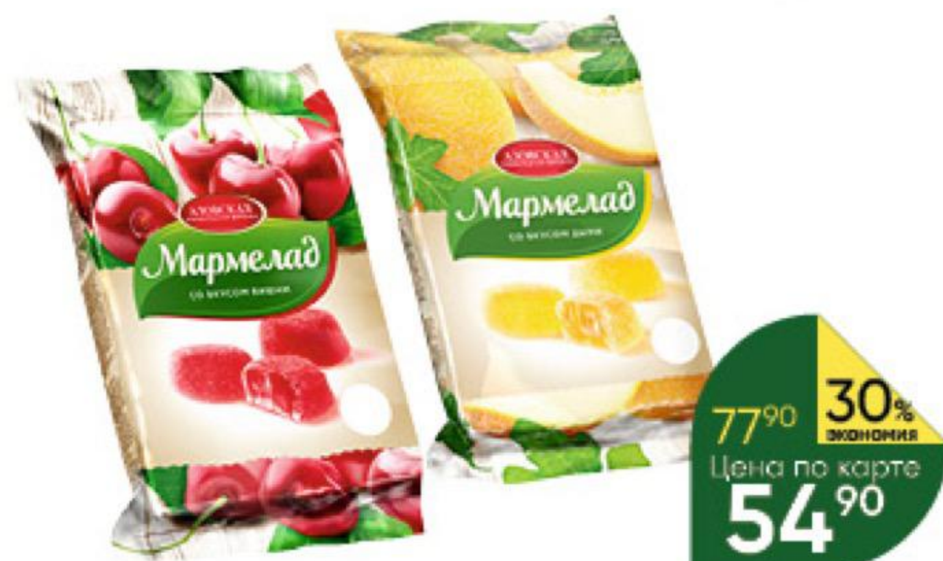
Мармелад АЗОВСКАЯ в ассортименте, 300 г