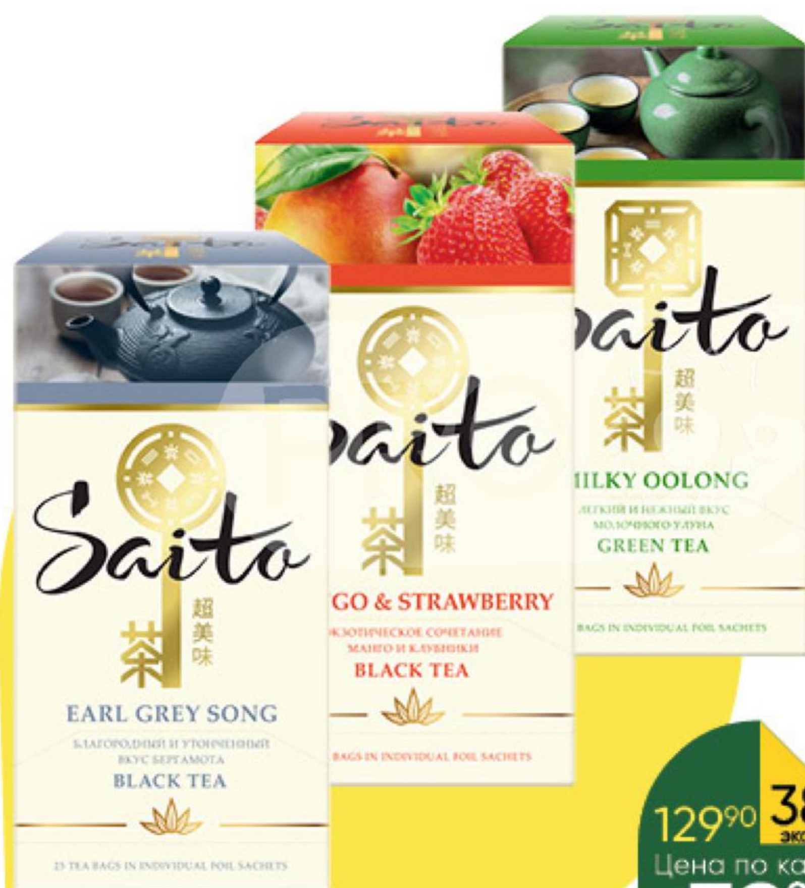
Чай SAITO в ассортименте, 25 x 1,3-1,7 г