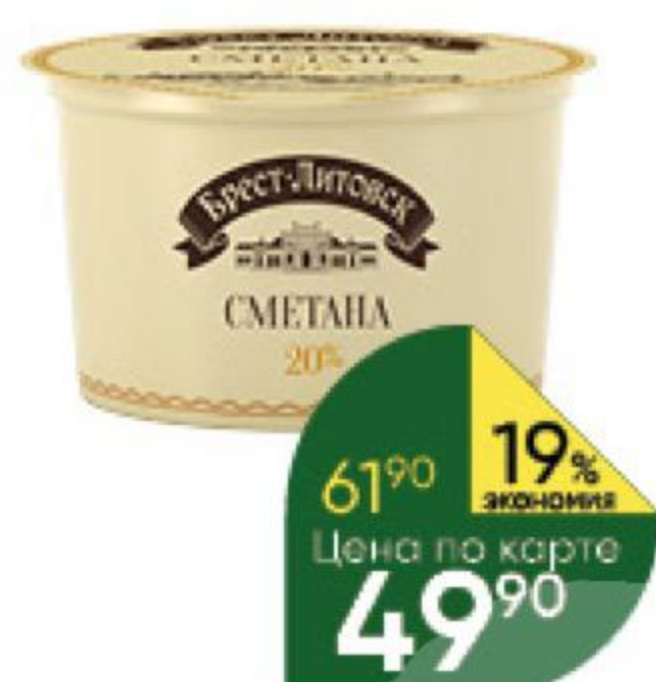
Сметана БРЕСТ-ЛИТОВСК 20%, 180 г