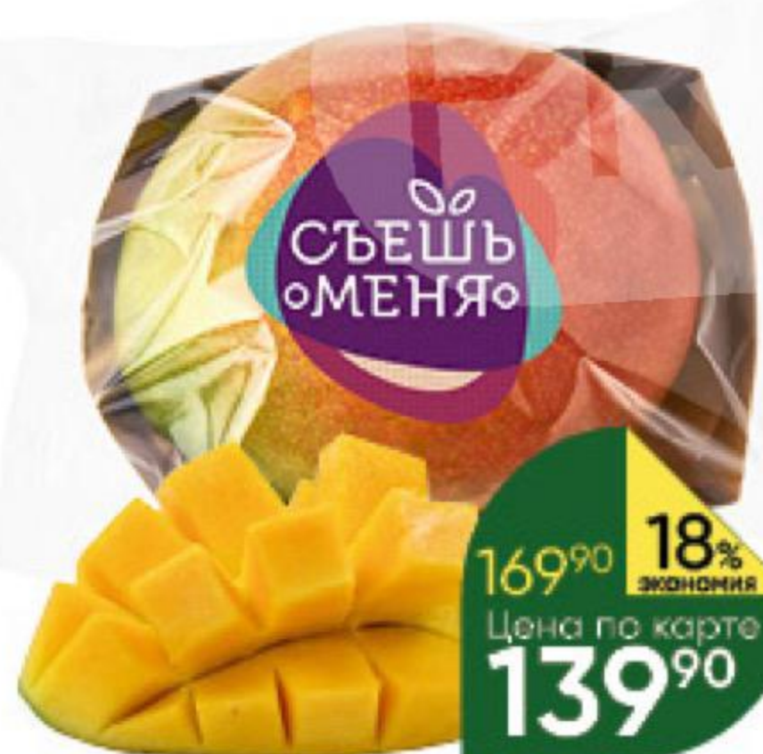
Манго спелый плод, 1 шт.

189 90 11% ЭКОНОМИЯ Цена по карте 169 90