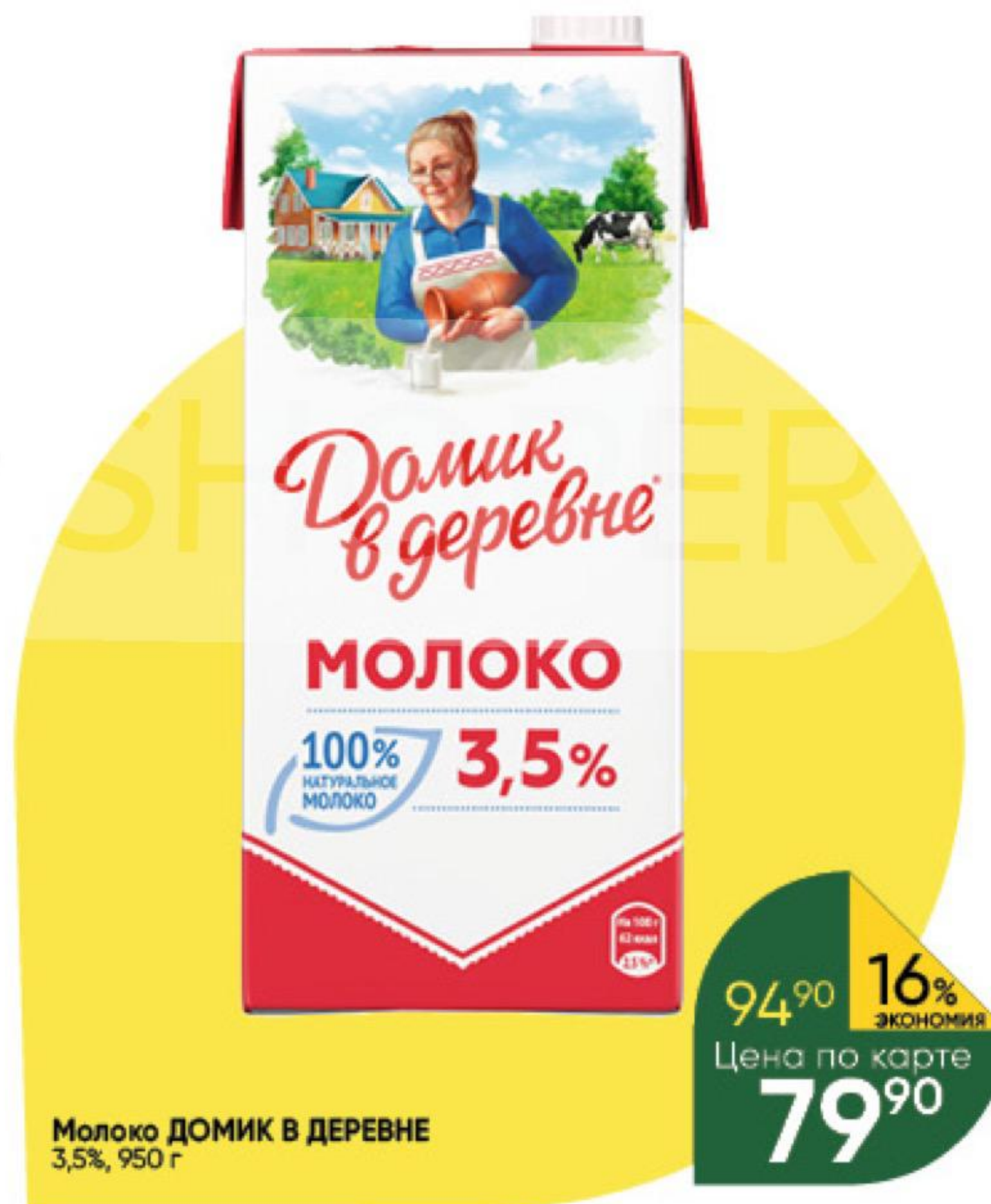
Молоко ДОМИК В ДЕРЕВНЕ 3,5%, 950 г