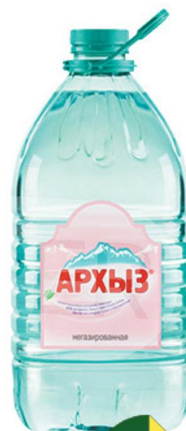
Вода АРХЫЗ горная природная питьевая негазированная, 5 л