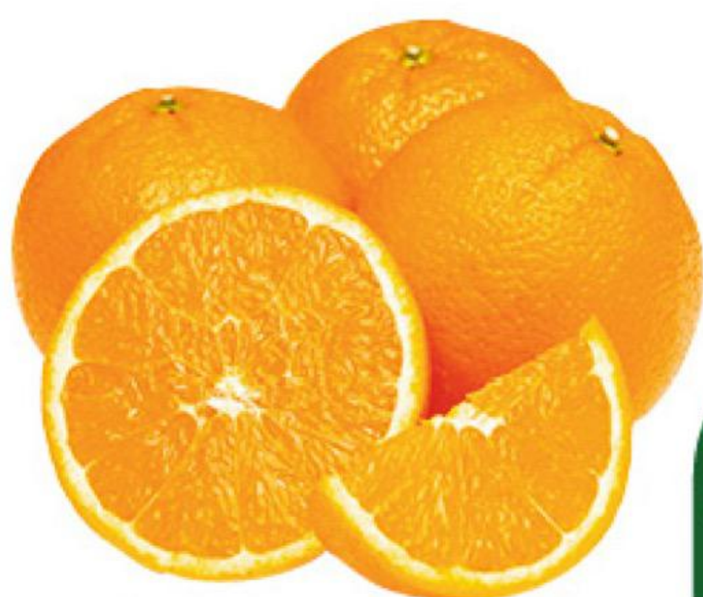
Апельсины Навелин, 1 кг

139 90 14% ЭКОНОМИЯ Цена по карте 119 90