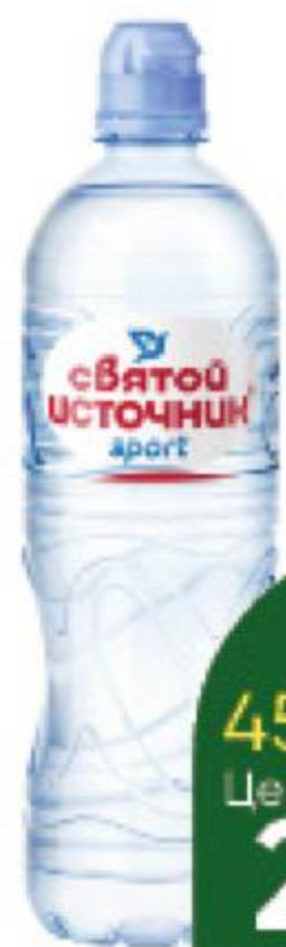
Вода СВЯТОЙ ИСТОЧНИК Sport питьевая негазированная, 0,75 л