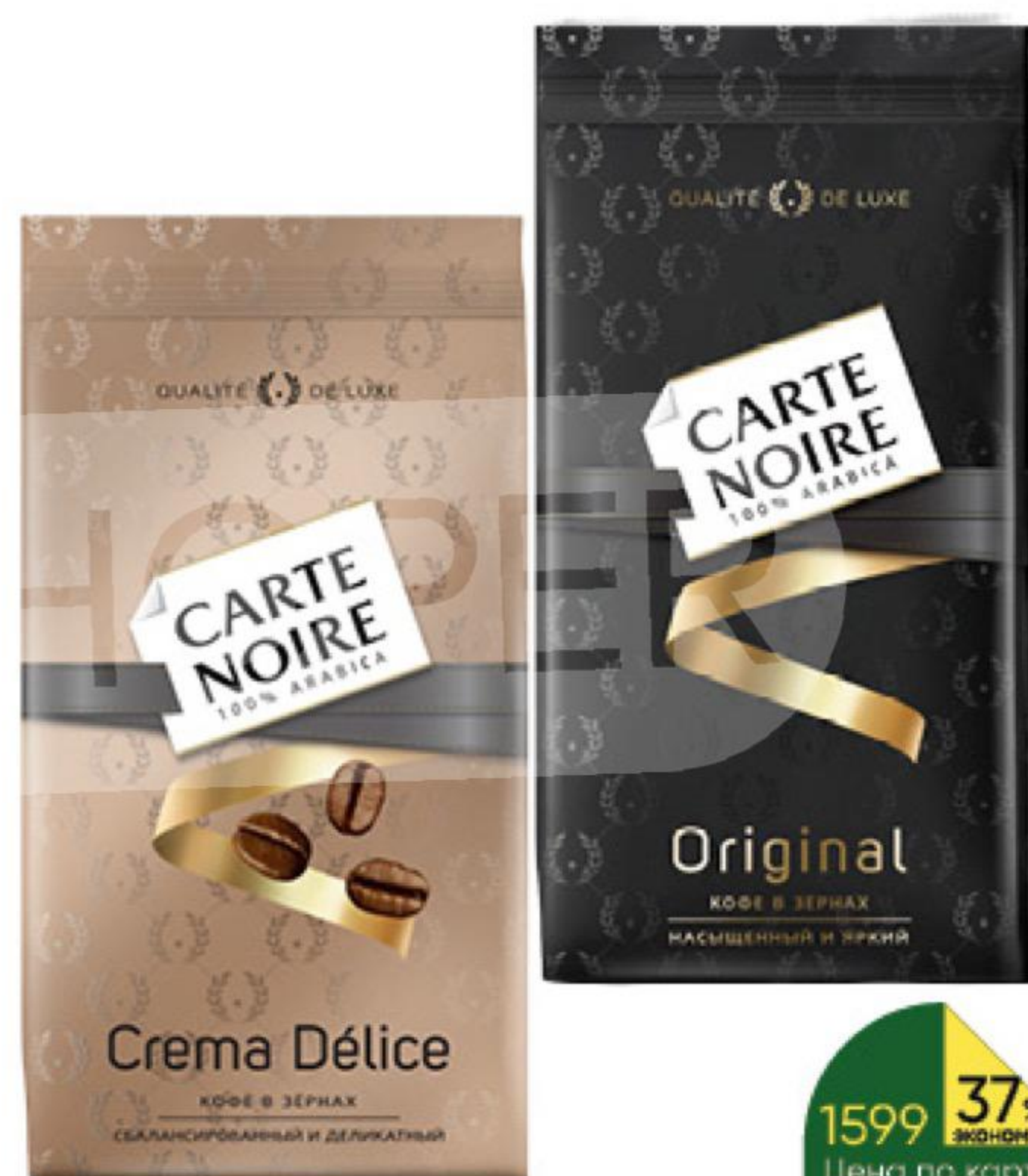
Кофе CARTE NOIRE Original; Crema Délice в зёрнах, 800 г