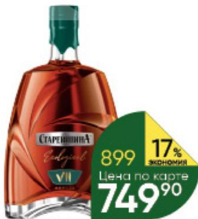
Коньяк СТАРЕЙШИНА Ecological KV 7 лет выдержанный 40%, 0,5 л (Россия)