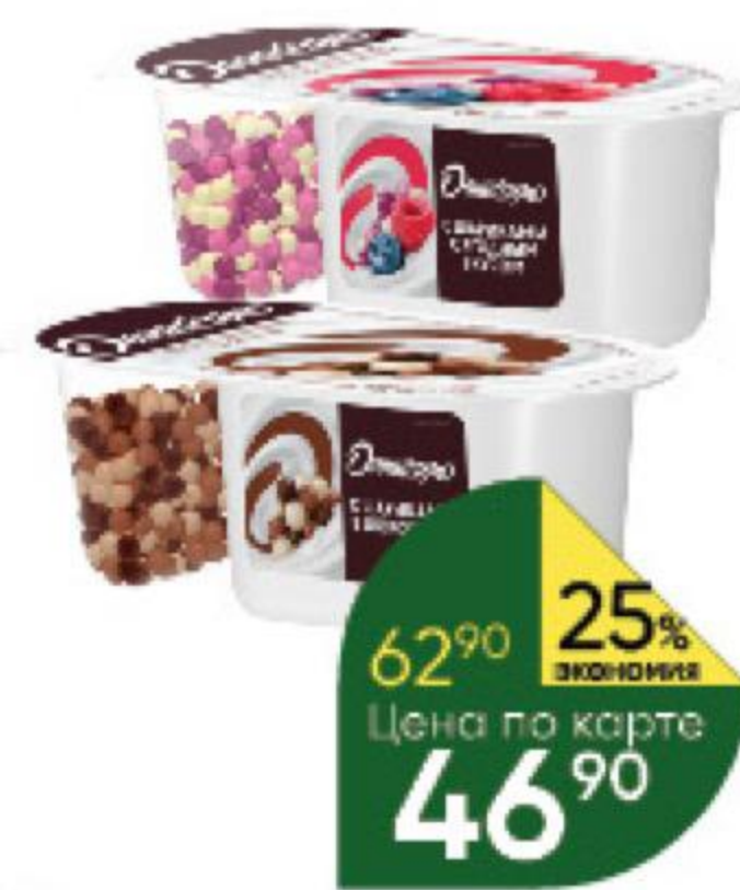
Йогурт ДАНИССИМО Фантазия с хрустящими шариками в ассортименте 6,9%, 105 г