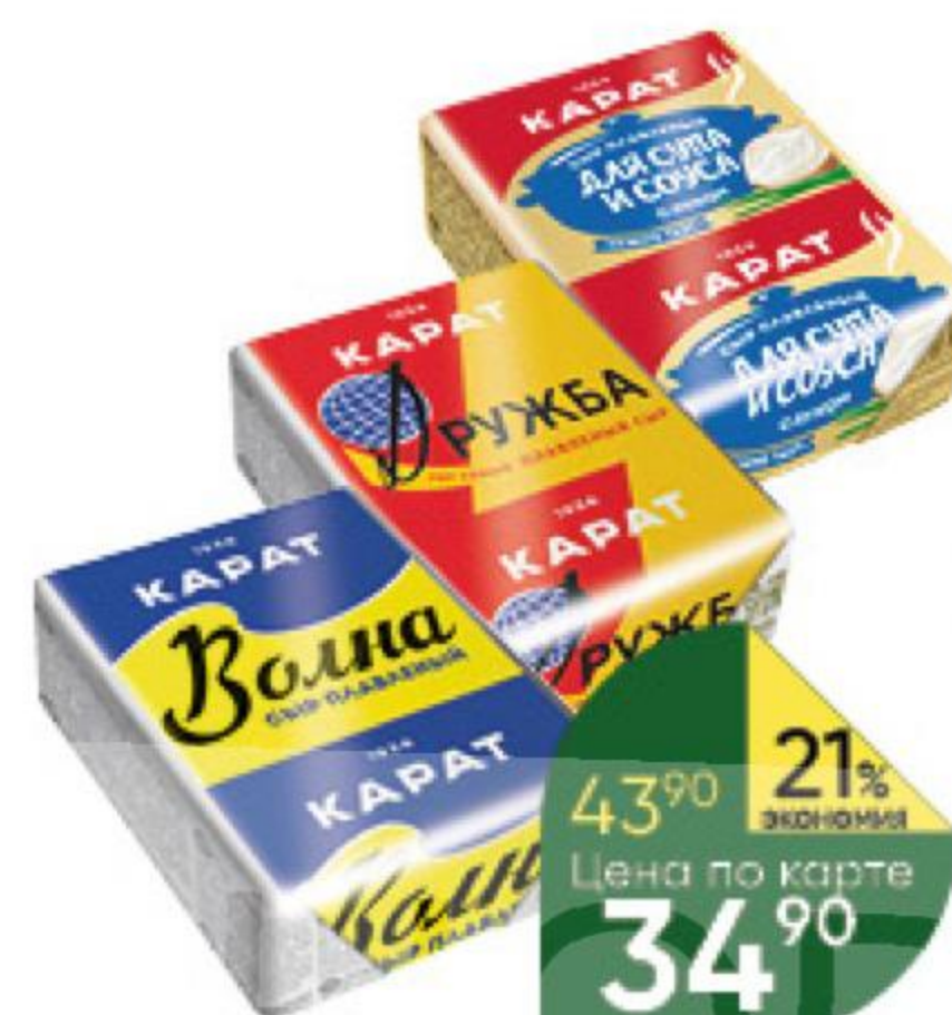
Сыр плавильный KARAT Волна; Дружба; С луком для супа 45%, 90 г