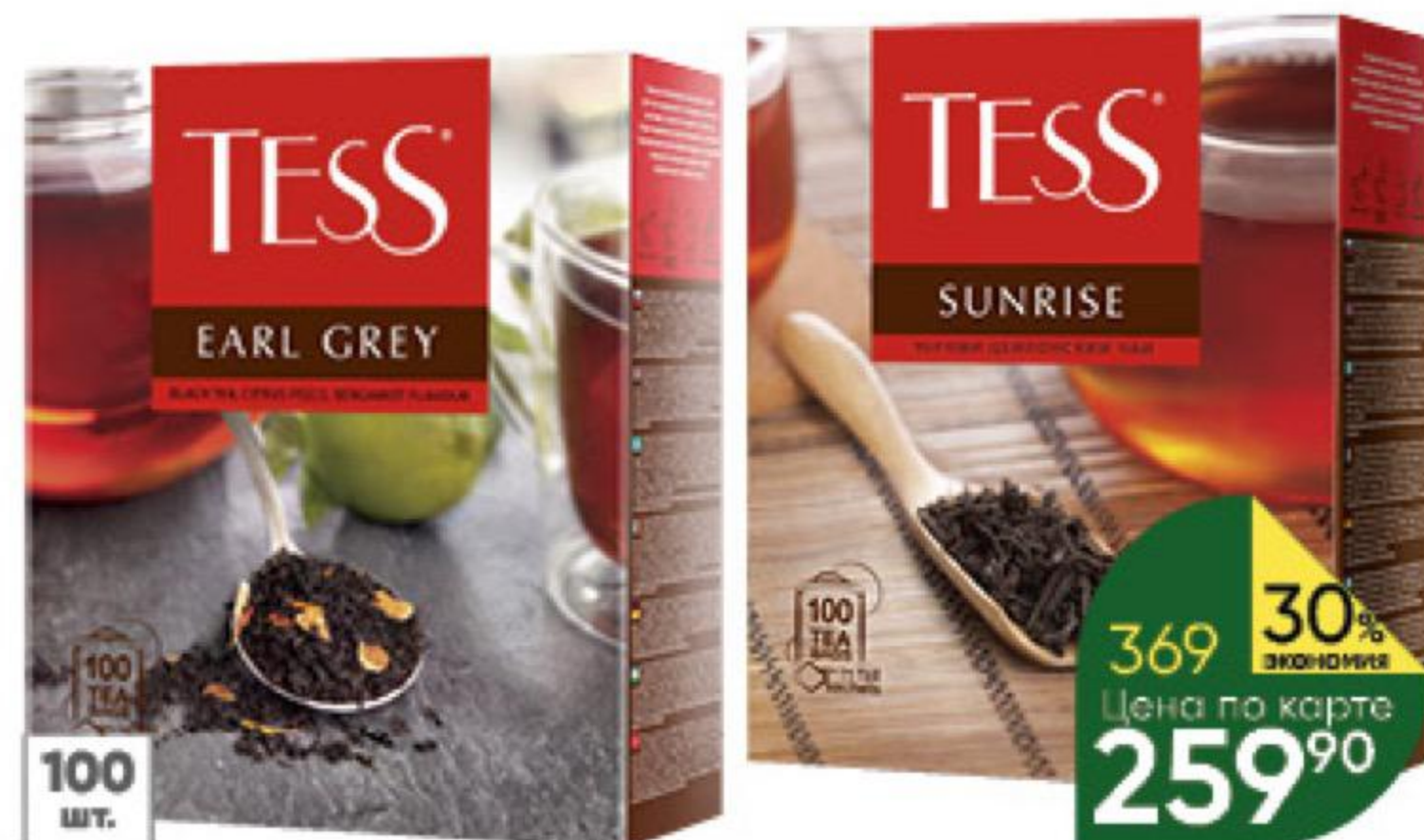
Чай TESS в ассортименте, 100 x 1,5-1,8 г

164 90 21% ЭКОНОМИЯ Цена по карте 129 90