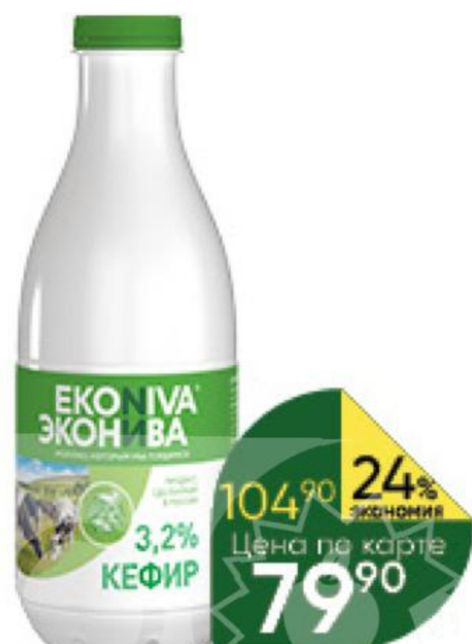
Кефир EKOИVA 3,2%, 1000 г