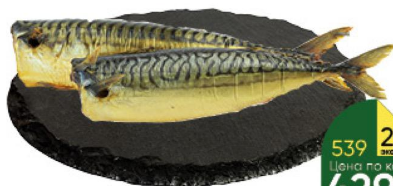
Скупбрия холодного копчения без головы, 1 кг