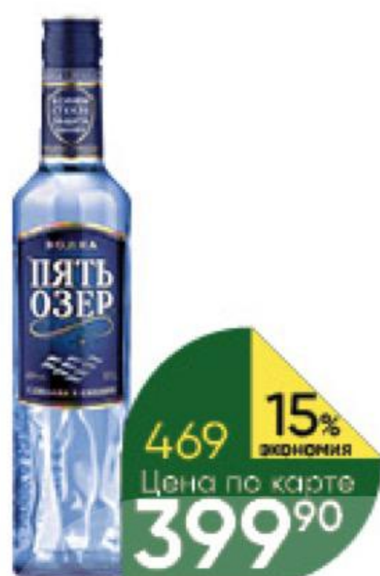
Водка П'ЯТЬ ОЗЁР 40%, 0,7 л (Россия)