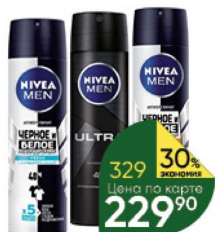
Антиперспирант NIVEA в ассортименте спрей, 150 мл