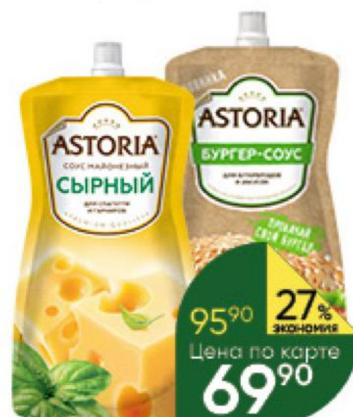
Соус майонезный ASTORIA в ассортименте 20-42%, 200-233 г