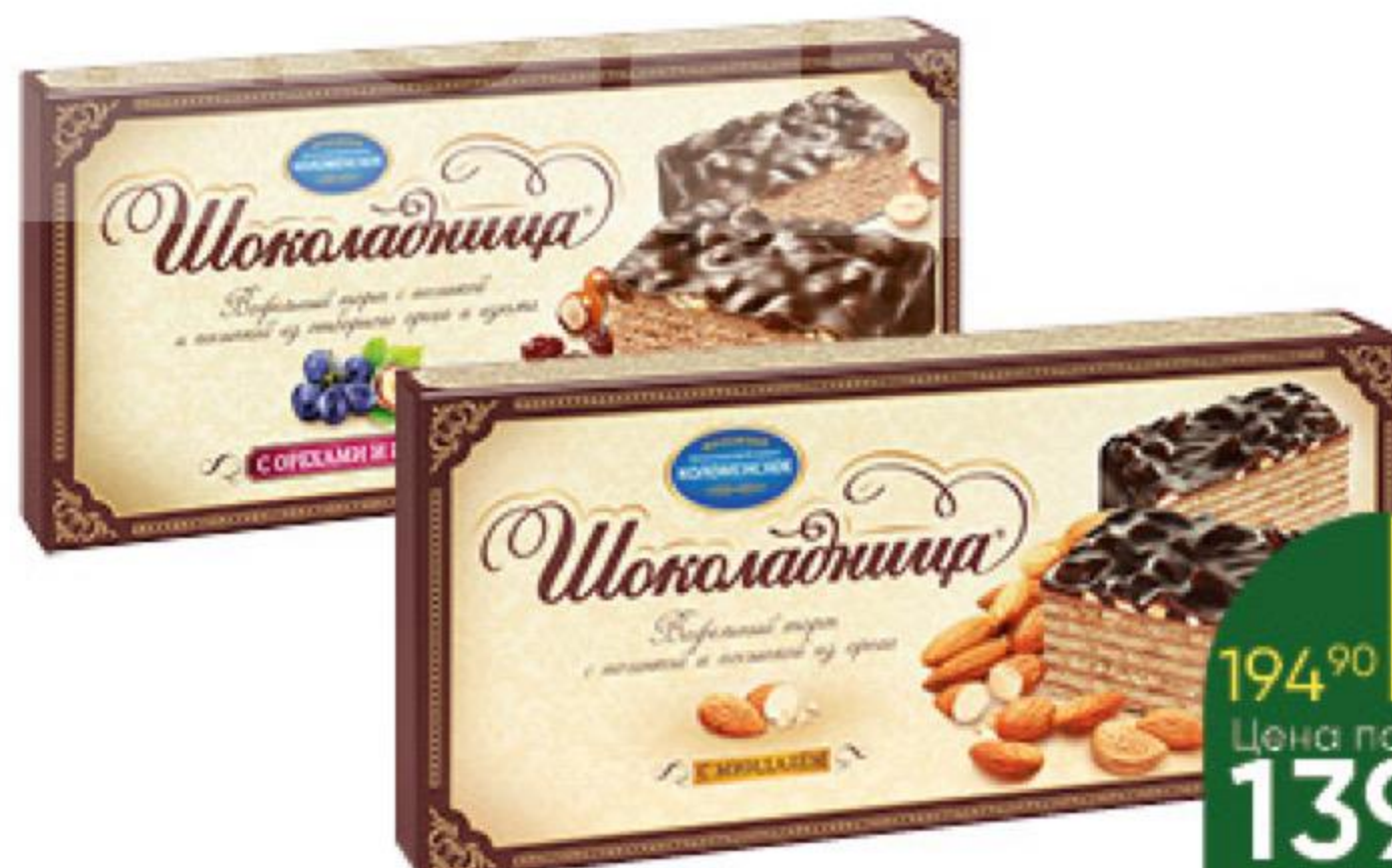
Торт вафельный ШОКОЛАДНИЦА с фундуком; с миндалём; с орехами и изюмом, 270 г

194 90 28% ЭКОНОМИЯ Цена по карте 139 90