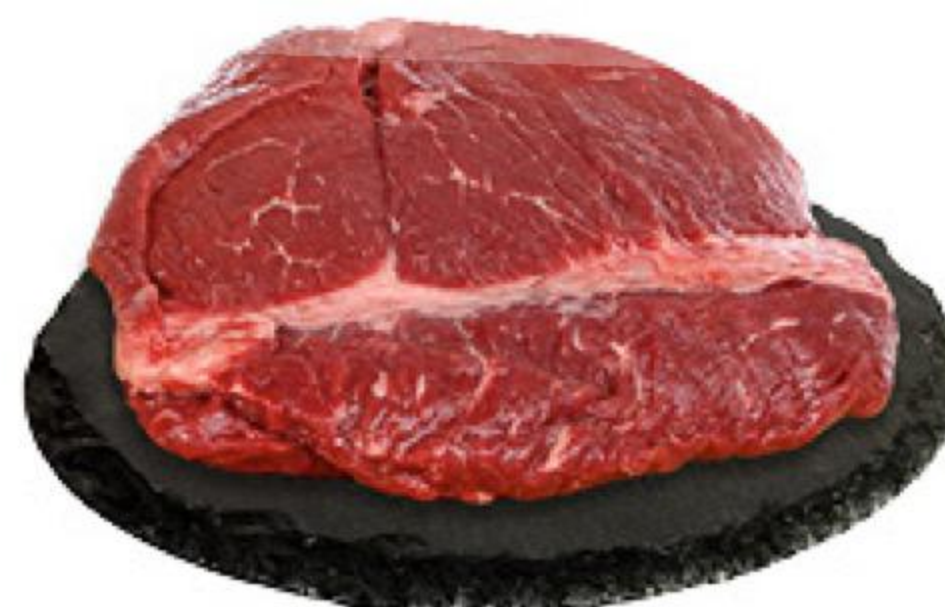
Говядина тазобедренная часть без кости охлаждённая, 1 кг