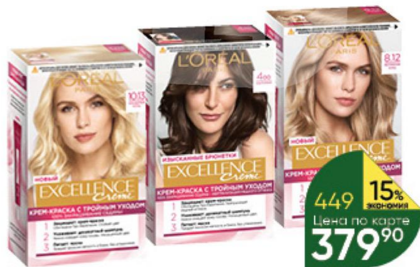
Крем-краска для волос L'OREAL PARIS Excellence Creme в ассортименте, 1 уп.