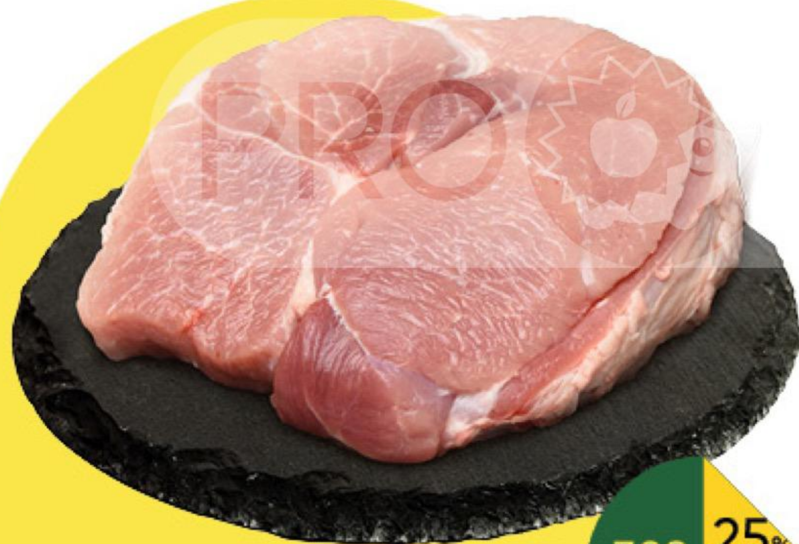
Свинина духовая без кости охлаждённая, 1 кг