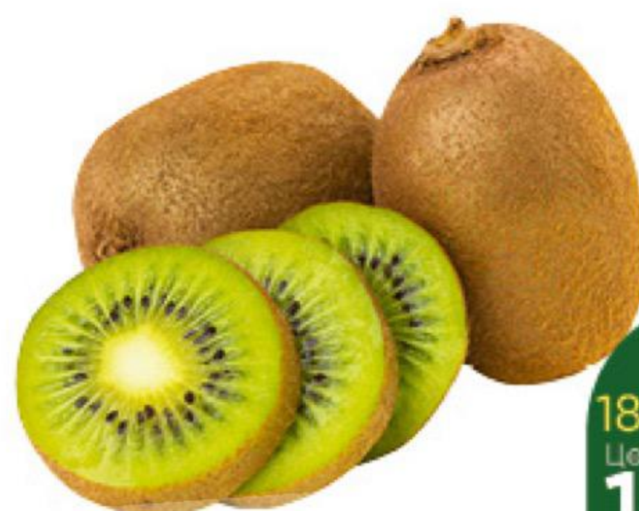
Киви, 1 кг

189 90 11% ЭКОНОМИЯ Цена по карте 169 90