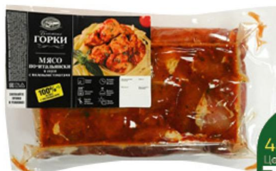
Мясо БЛИЖНИЕ ГОРКИ По-итальянски свинина в соусе с вялеными томатами охлаждённая, 1 кг