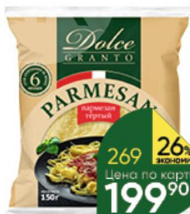
Сыр DOLCE GRANTO Parmesan тёртый 40%, 150 г