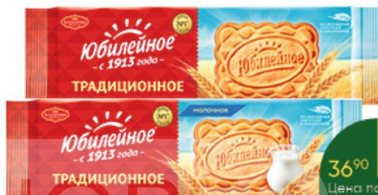
Печенье ЮБИЛЕЙНОЕ традиционное; молочное, 112 г