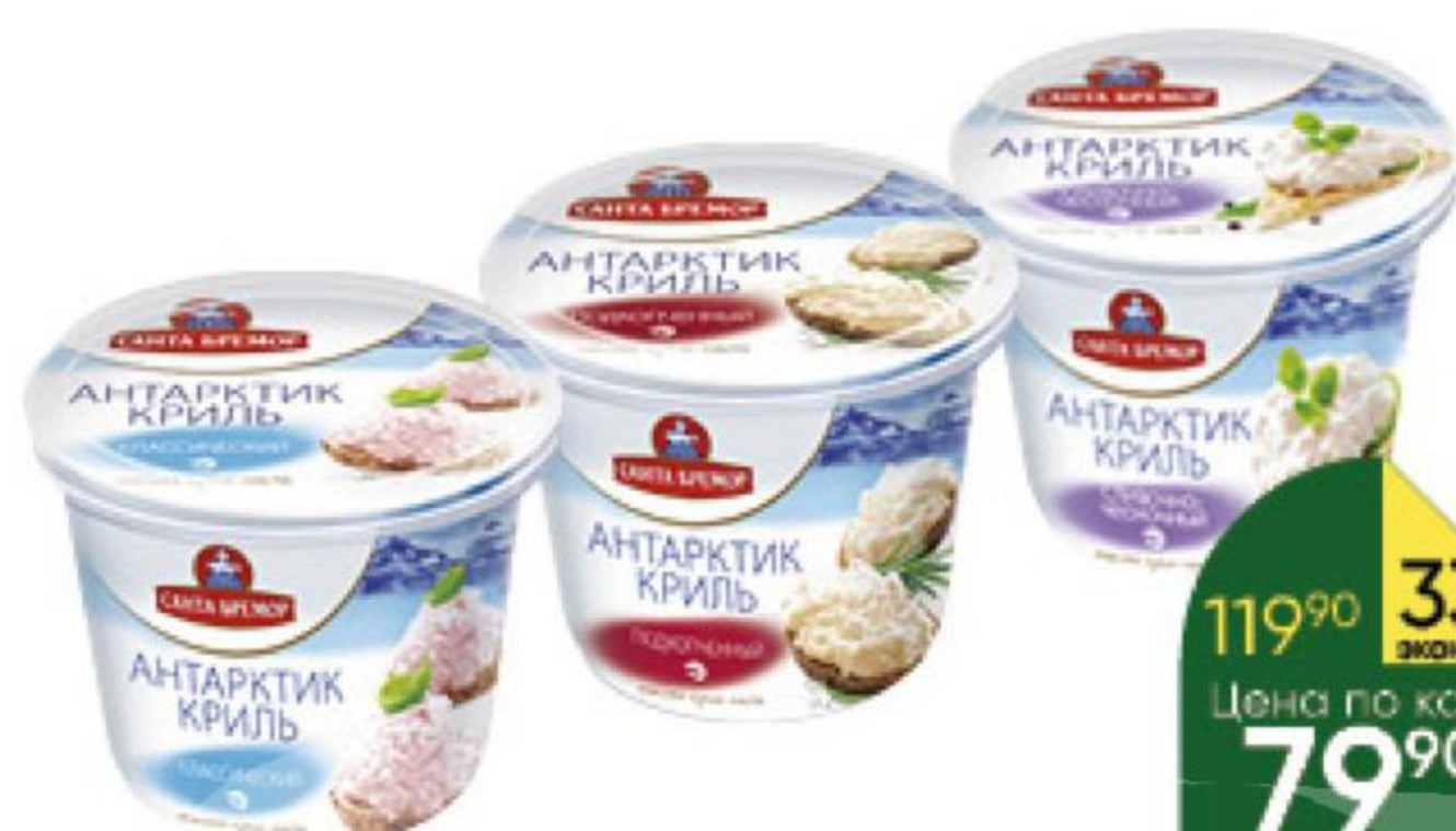
Крем-паста САНТА БРЕМОР Антарктик Криль классический; подкопчённый; сливочно-чесночный, 150 г