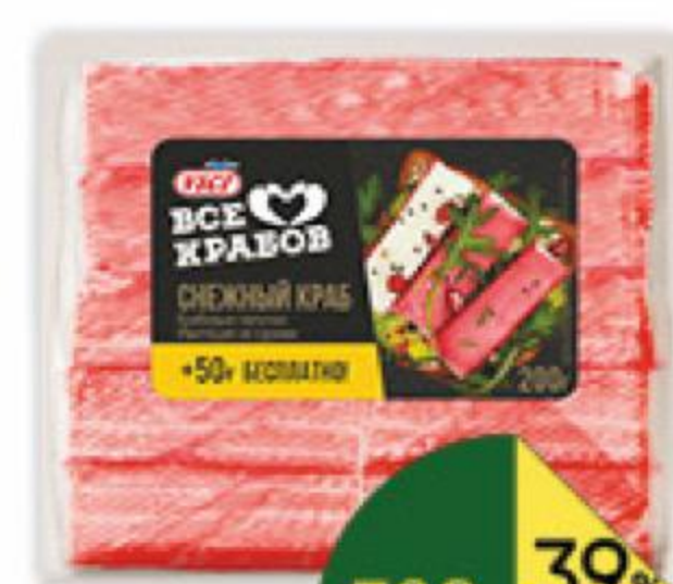
Крабовые палочки VICI Снежный краб, 200 г

189 90 21% ЭКОНОМИЯ Цена по карте 149 90