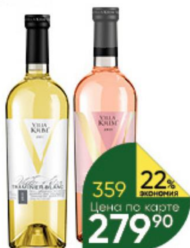
Вино VILLA KRIM в ассортименте 11-12%, 0,75 л (Россия)