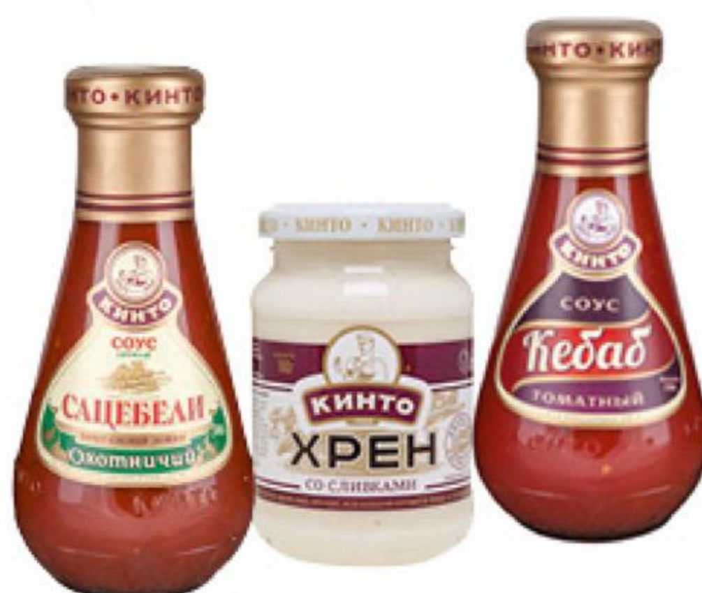
Соус; Хрен КИНТО в ассортименте, 180-310 г

174 90 26% ЭКОНОМИЯ Цена по карте 129 90