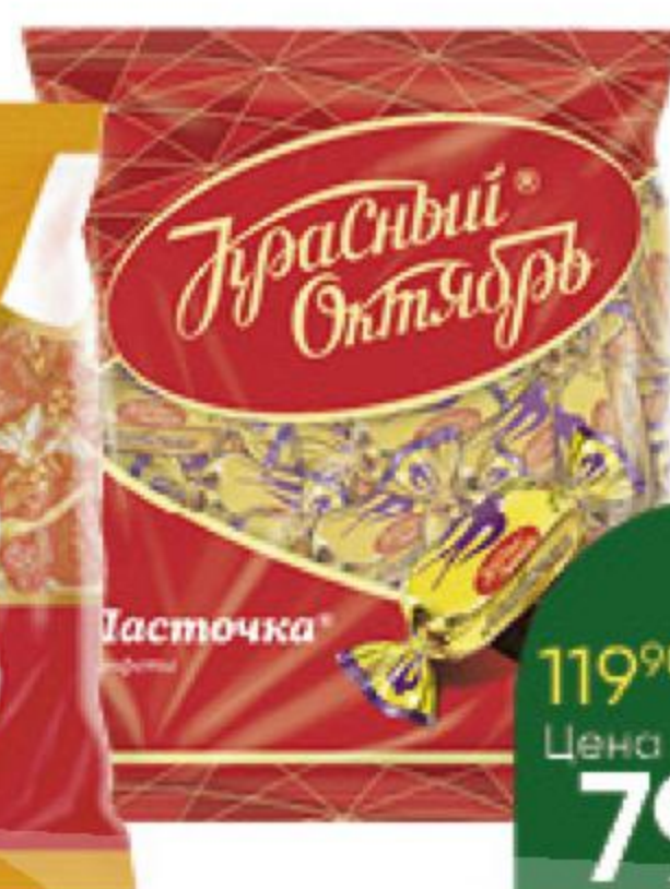
Конфеты РОТФРОНТ; КРАСНЫЙ ОКТЯБРЬ Карамель Москвичка; Ласточка, 250 г