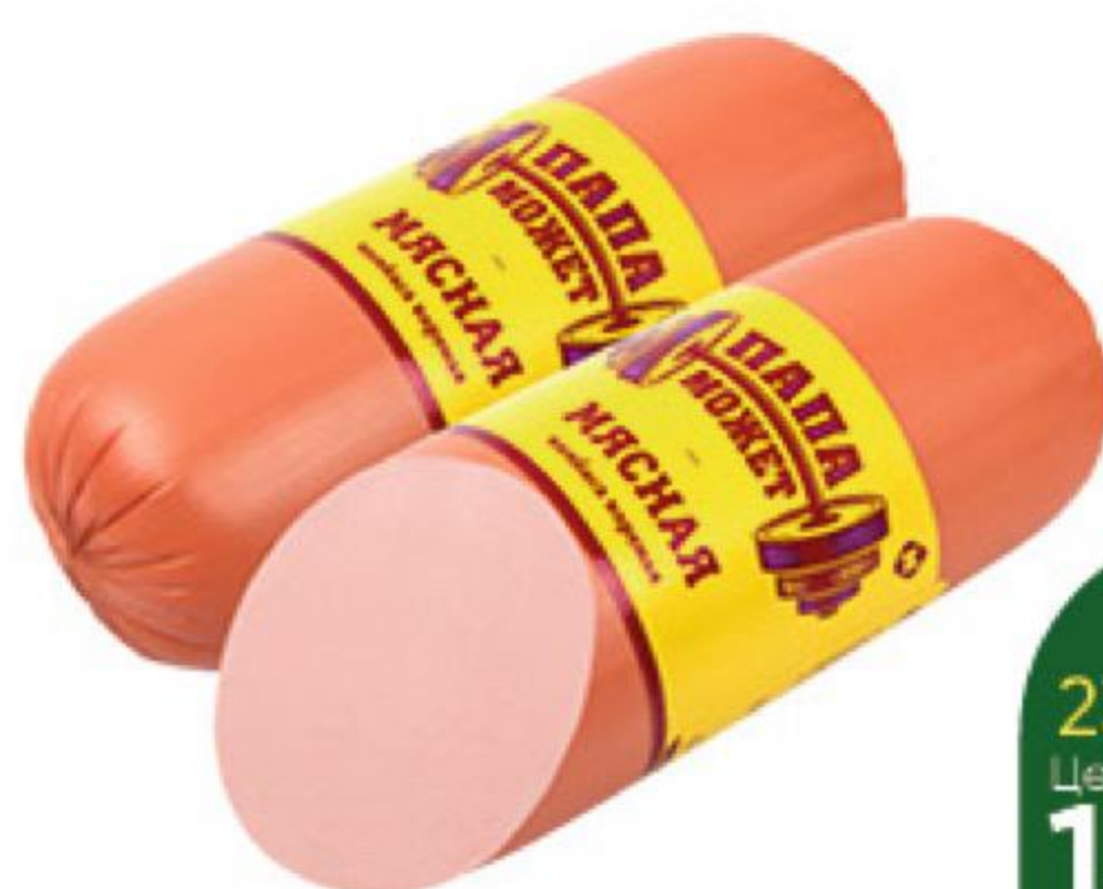
Колбаса ПАПА МОЖЕТ Мясная варёная, 500 г