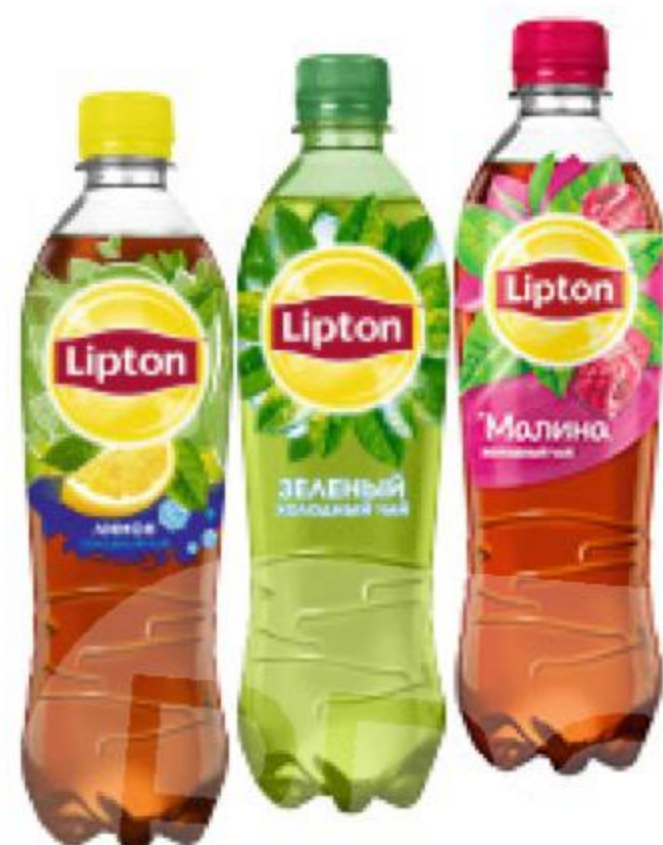
Холодный чай LIPTON в ассортименте, 0,5 л