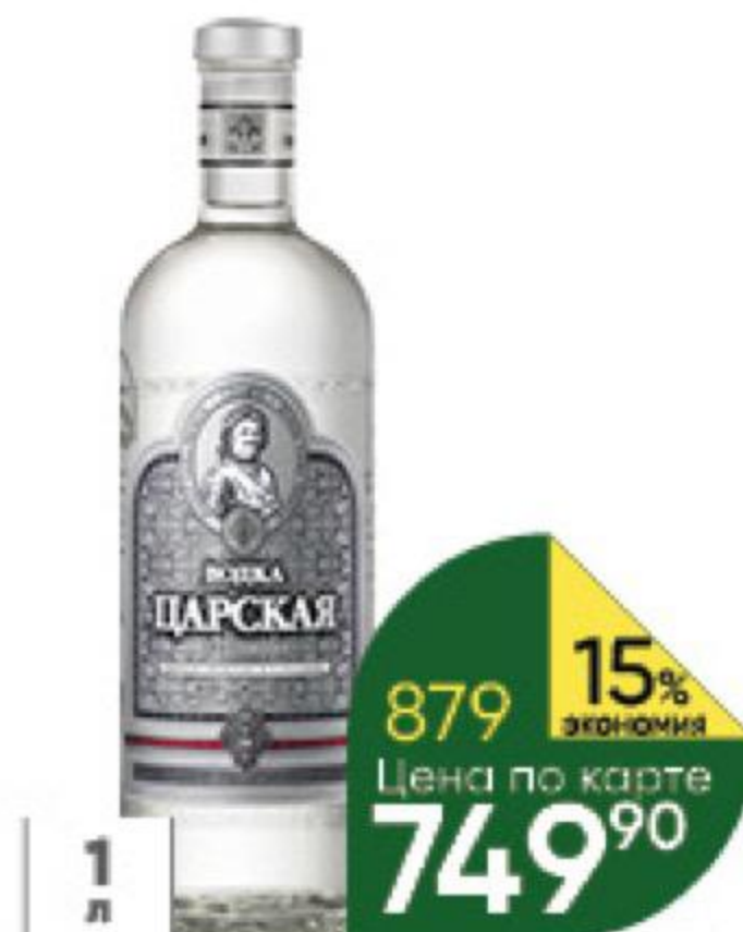
Водка ЛАДОГА Царская 40%, 1 л (Россия)