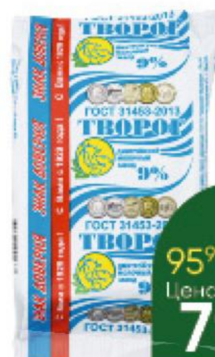
Творог ДМИТРОВСКИЙ 9%, 180 г