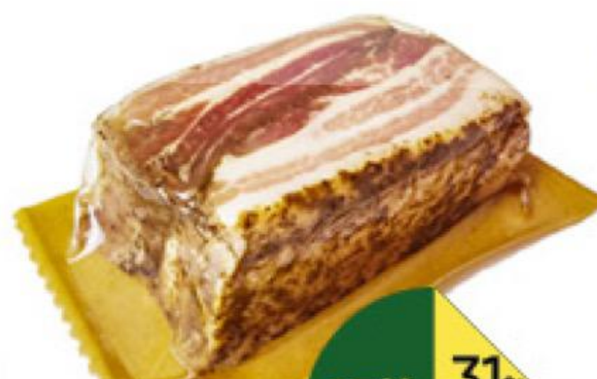
Сало ВОСТРЯКОВО Белорусское солёное из шпика свиного, 100 г