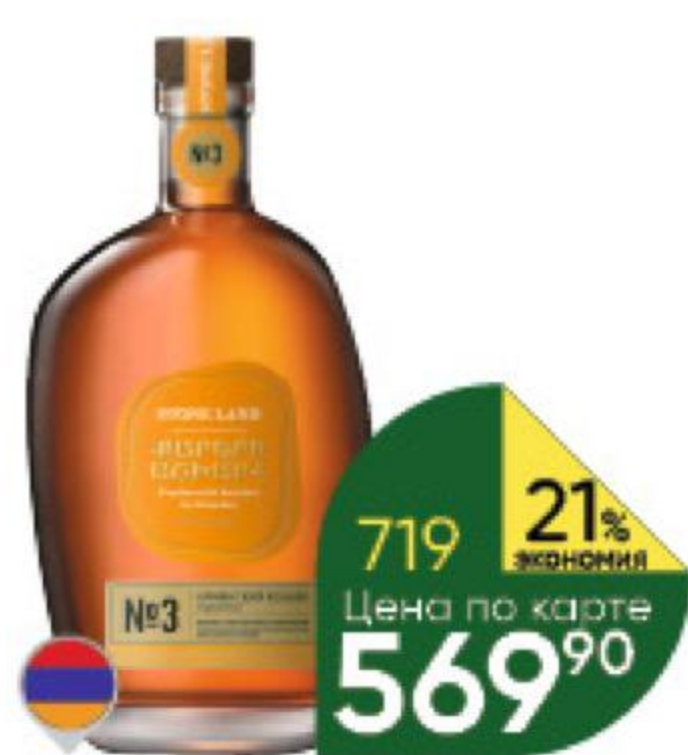
Коньяк STONE LAND Armenian №3 3 года 40%, 0,5 л (Армения)