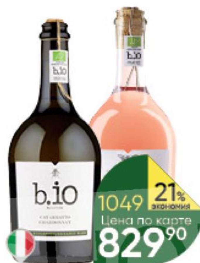
Вино b.i.o в ассортименте 12,5-13,5%, 0,75 л (Италия)