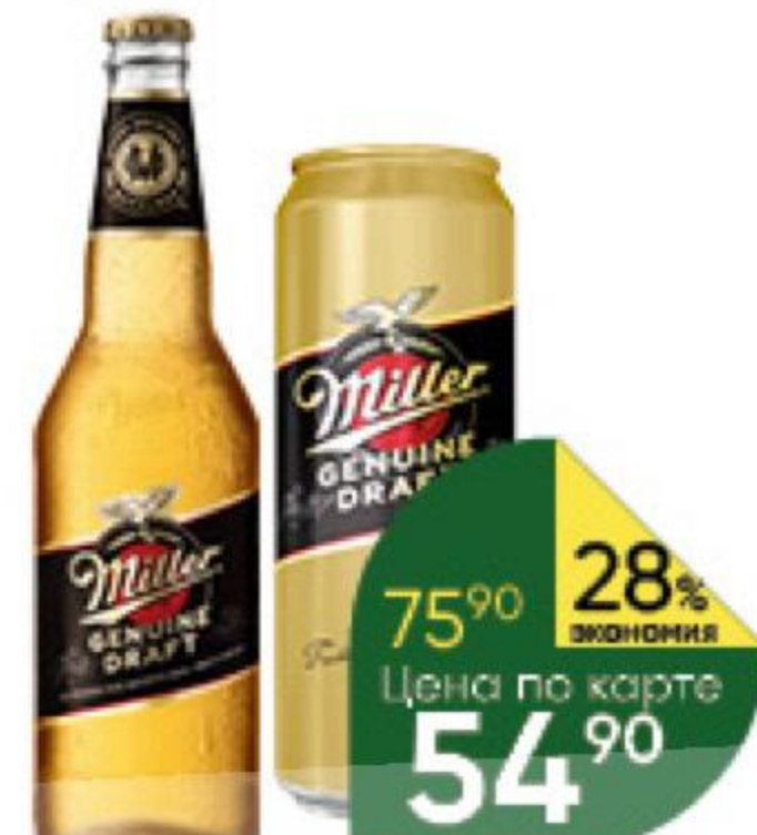
Напиток пивной MILLER Genuine Draft светлый 4,7%, 0,43–0,47 л (Россия)