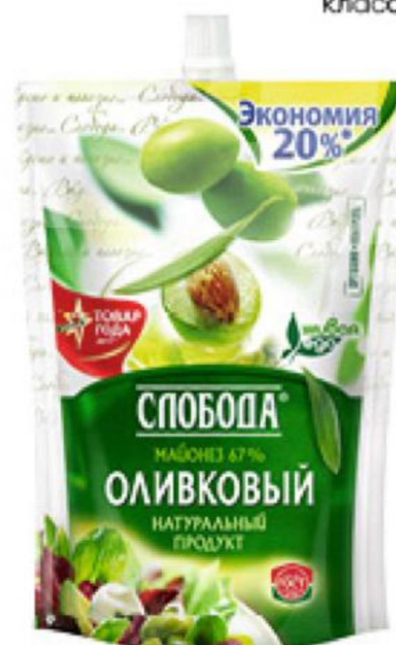
Майонез СЛОБОДА Оливковый, 800 мл