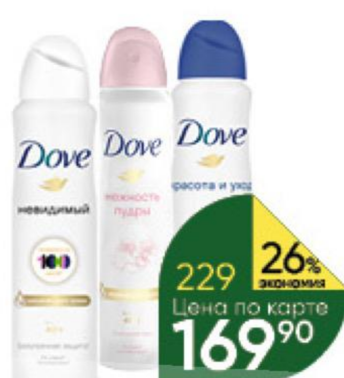
Антиперспирант DOVE в ассортименте, 150 мл

289 90 36% ЭКОНОМИЯ Цена по карте 159 90