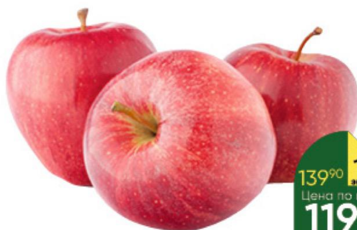
Яблоки Фуджи, 1 кг

139 90 14% ЭКОНОМИЯ Цена по карте 119 90