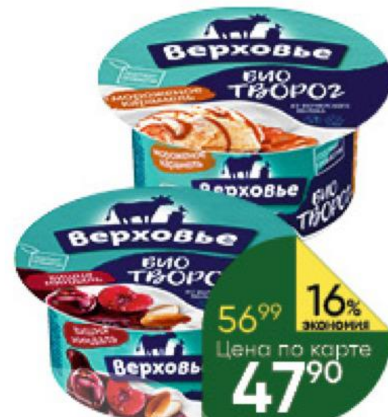
Биотворог ВЕРХОВЬЕ в ассортименте 4,2%, 140 г