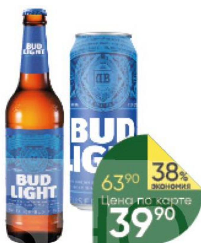
Пиво BUD Light светлое пастеризованное 4,1%, 0,44–0,45 л (Россия)