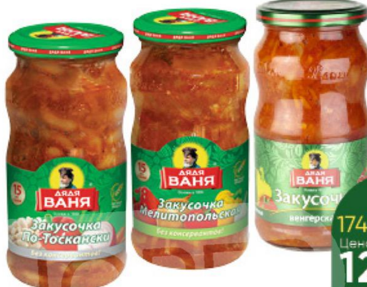
Консервы овощные ДЯДЯ ВАНЯ Закусочка Мелитопольская; По-тоскански; Венгерская, 460 г

174 90 26% ЭКОНОМИЯ Цена по карте 129 90