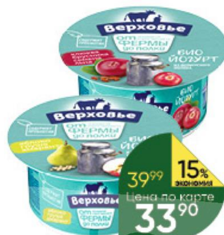
Бийогурт ВЕРХОВЬЕ в ассортименте 2,9-3,5%, 150 г