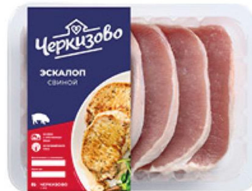
Эскалоп ЧЕРКИЗОВО свиной охлаждённый, 500 г

184 90 Цена по карте 129 90 30% ЭКОНОМИЯ