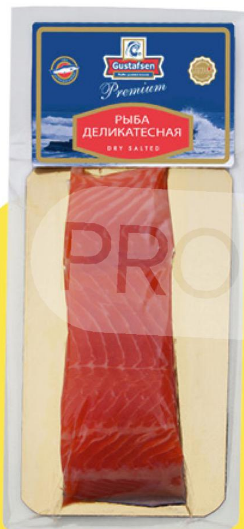
Форель GUSTAFSEN слабосоленая филе-кусочек, 180 г