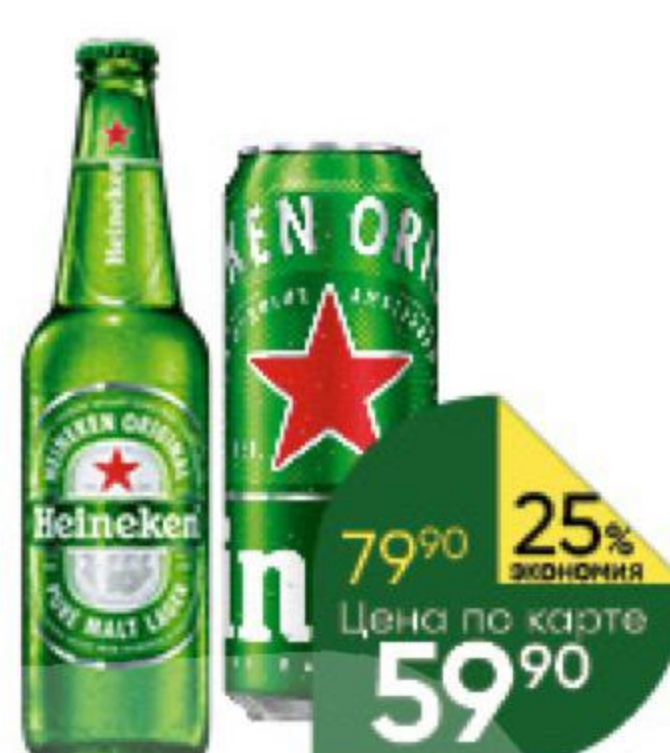
Пиво HEINEKEN светлое 4,8%, 0,43–0,47 л (Россия)