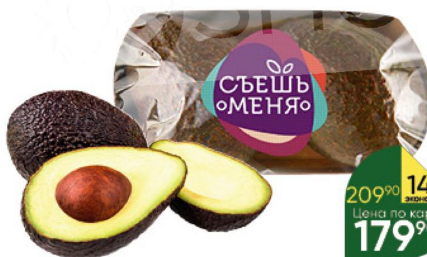
Авокадо READY TO EAT Hass, 2 шт.

169 90 18% ЭКОНОМИЯ Цена по карте 139 90