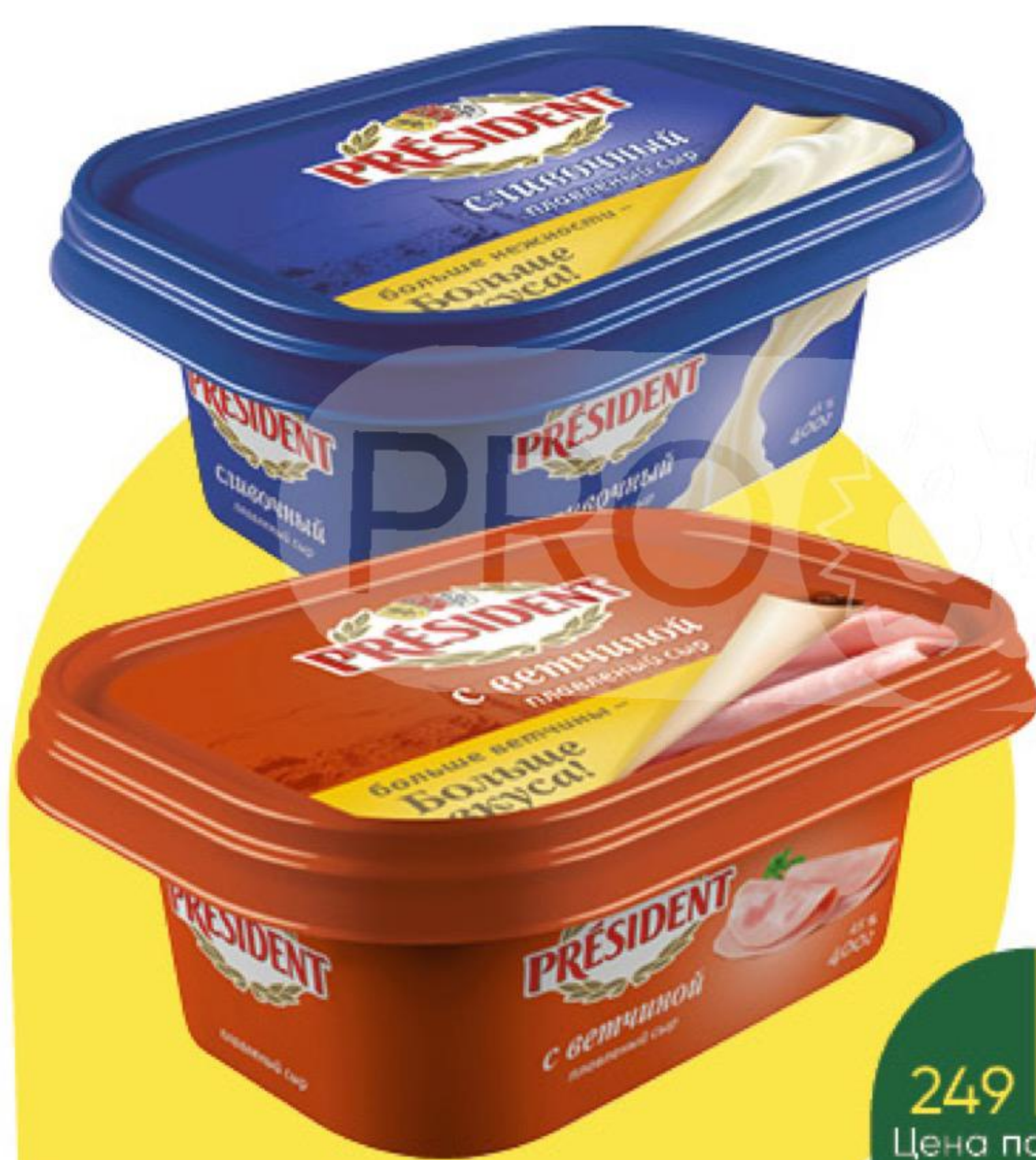
Сыр плавильный PRESIDENT с ветчиной; с грибами; сливочный 45%, 400 г