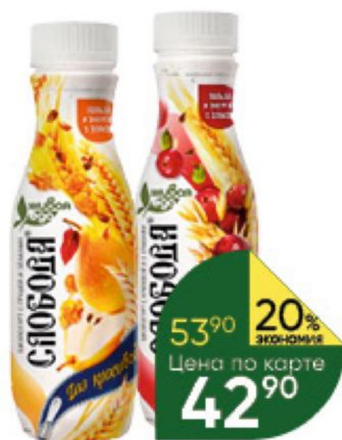
Бийогурт СЛОБОДА в ассортименте 0-2%, 260 г