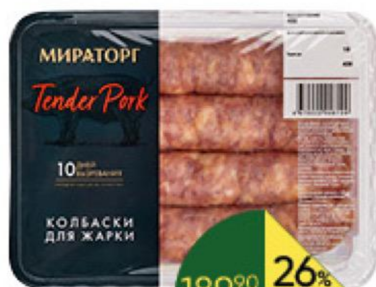
Колбаски МИРАТОРГ свино-говяжьи для жарки охлаждённые, 400 г

189 90 Цена по карте 139 90 26% ЭКОНОМИЯ