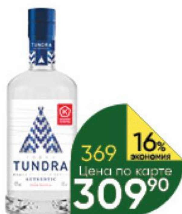
Водка TUNDRA Authentic Крайнего севера 40%, 0,5 л (Россия)