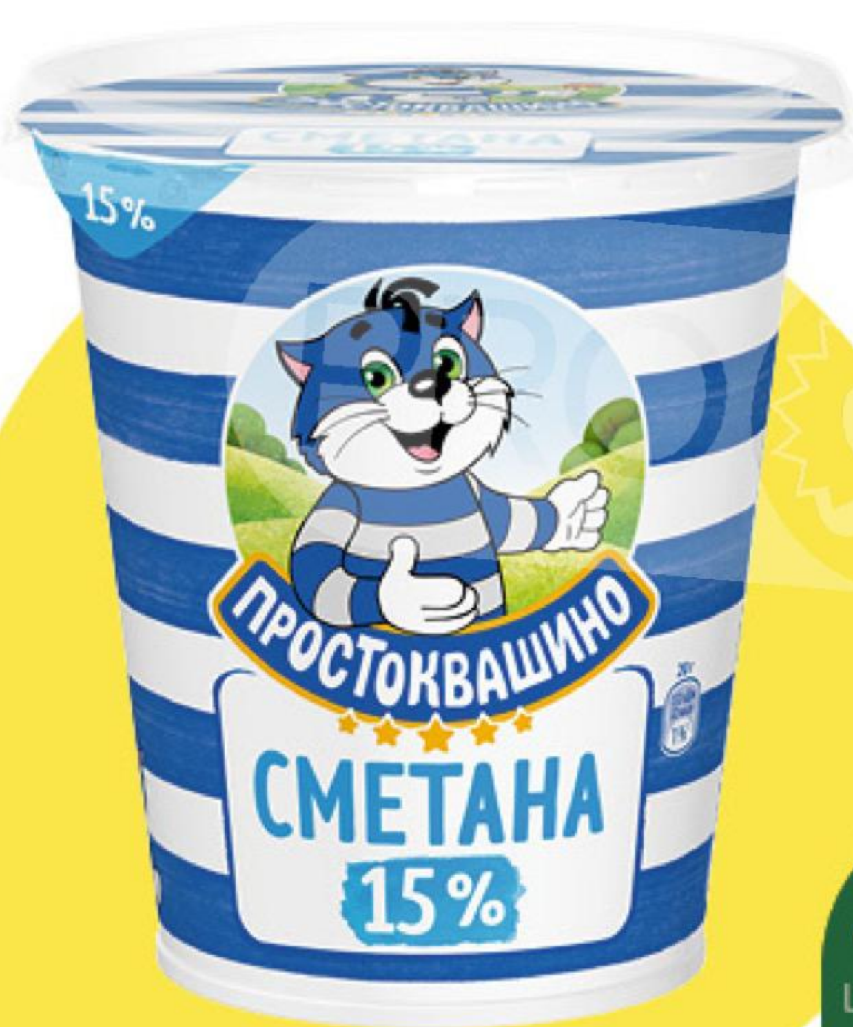
Сметана ПРОСТОКВАШИНО 15%, 300 г