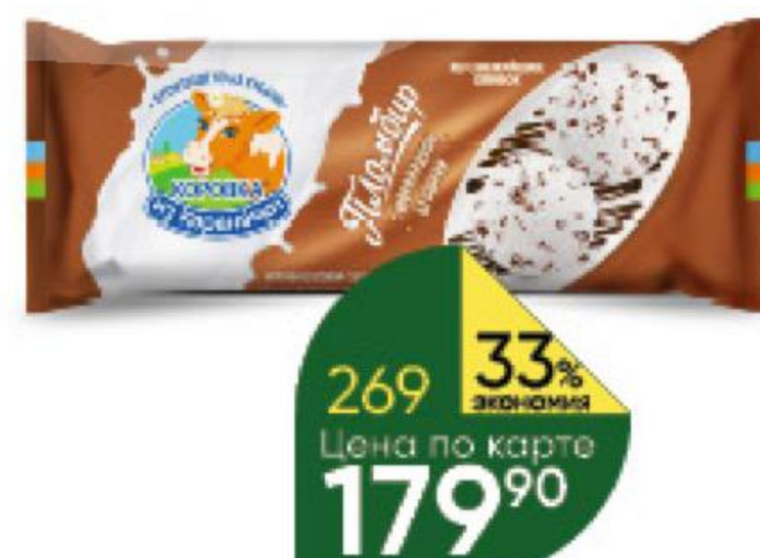
Мороженое ЧИСТАЯ ЛИНИЯ Московская Лакомка пломбир ванильный; шоколадный, 80 г