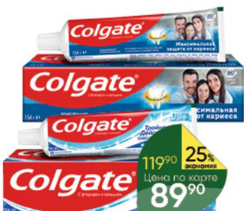
Зубная паста COLGATE в ассортименте, 100 мл