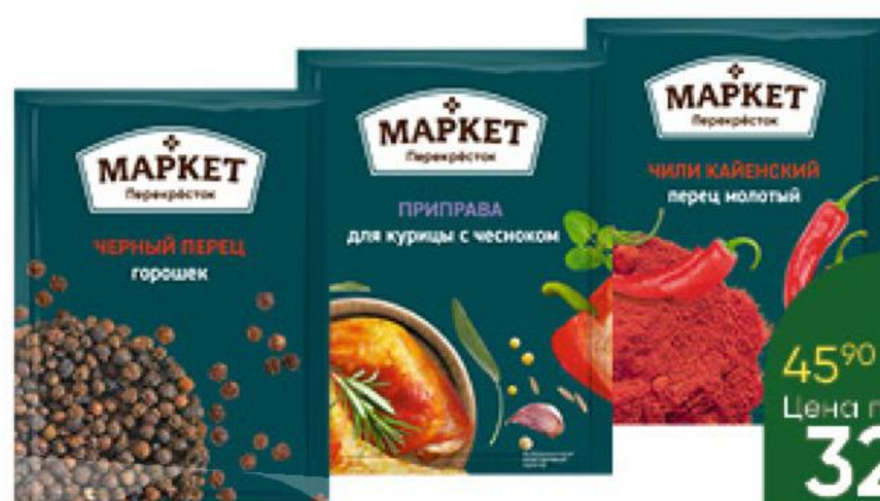
Приправы; Специи МАРКЕТ ПЕРЕКРЕСТОК в ассортименте, 5-28 г

174 90 26% ЭКОНОМИЯ Цена по карте 129 90