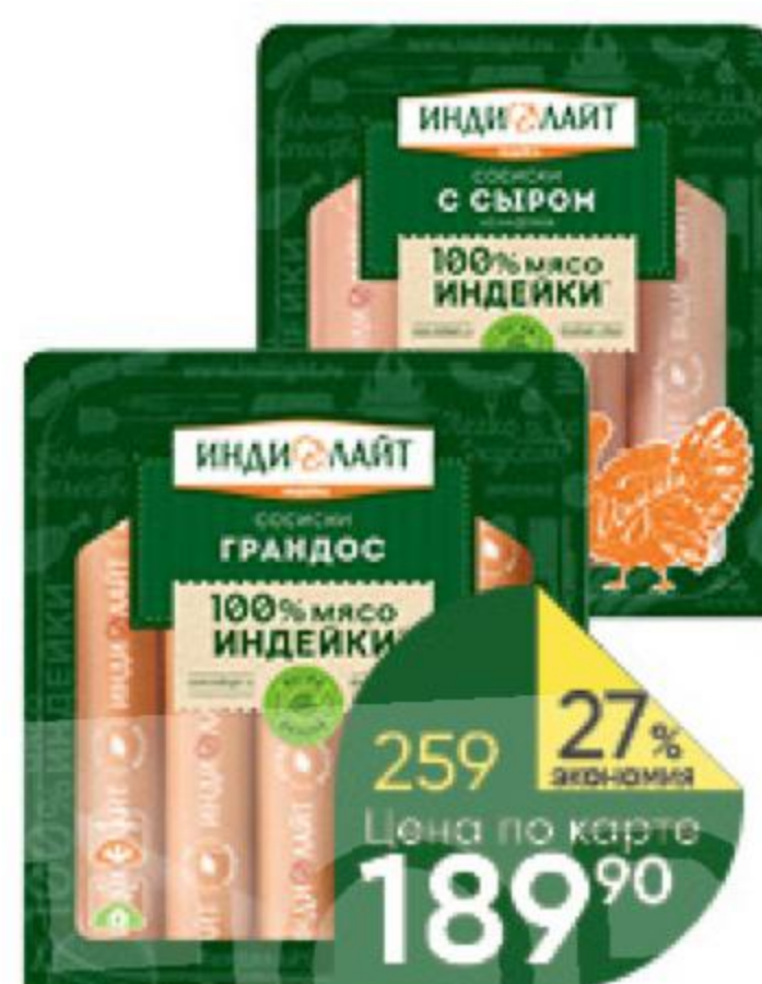
Сосиски ИНДИЛАЙТ Грандос; С сыром из индейки варёные, 440 г