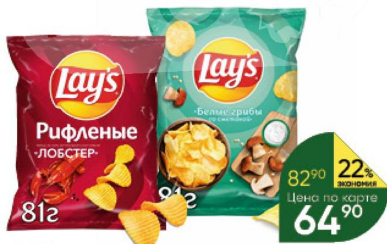
Чипсы LAY'S из натурального картофеля в ассортименте, 81 г