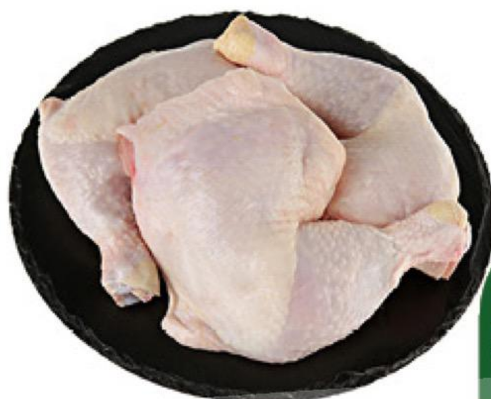
Окорочка куриные охлажденные, 1 кг

154 90 Цена по карте 129 90 16% ЭКОНОМИЯ