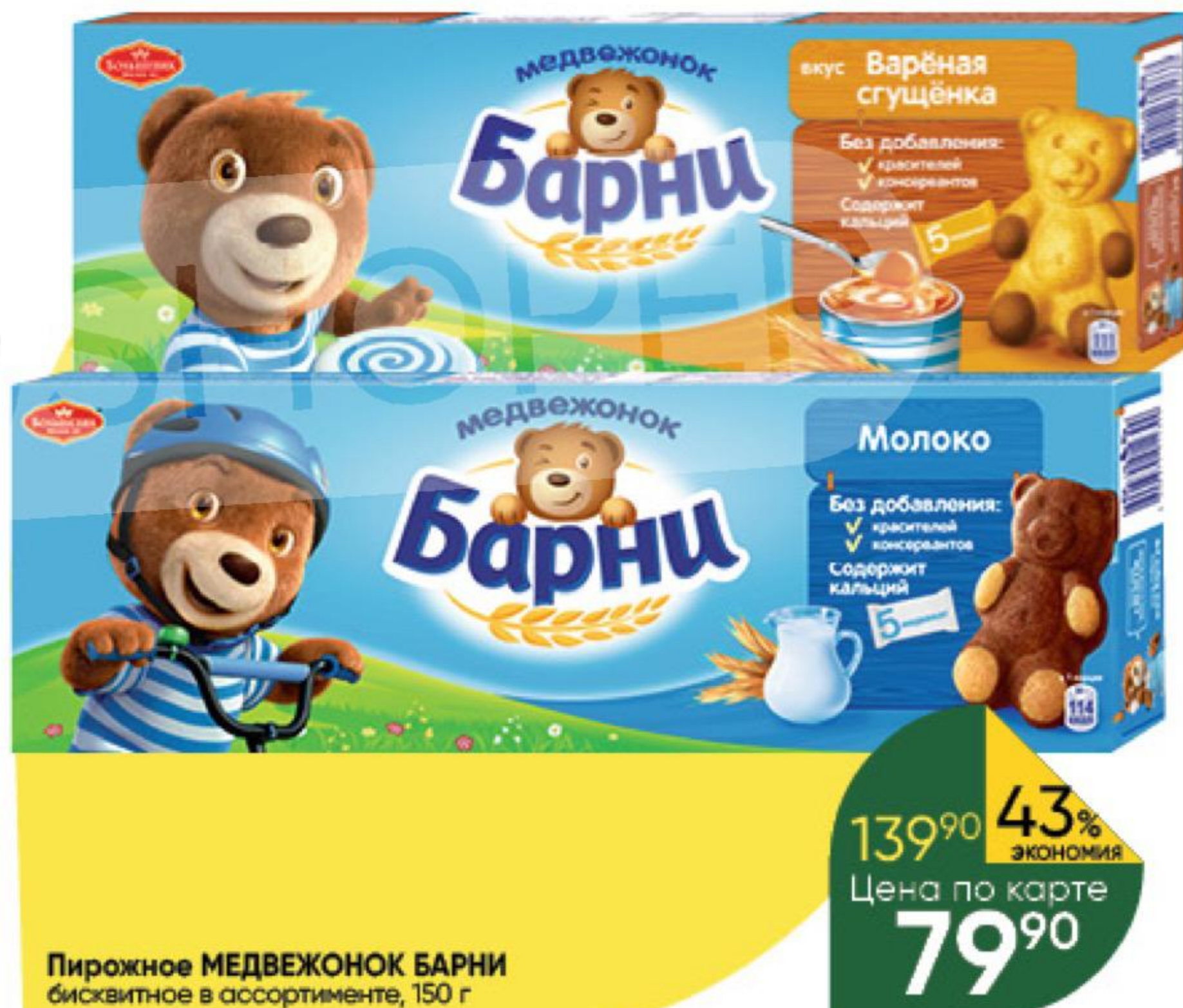
Пирожное МЕДВЕЖОНОК БАРНИ бисквитное в ассортименте, 150 г