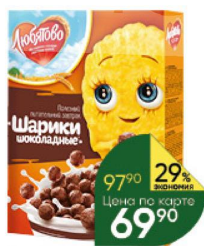
Сухой завтрак ЛЮБЯТОВО шарики шоколадные, 250 г