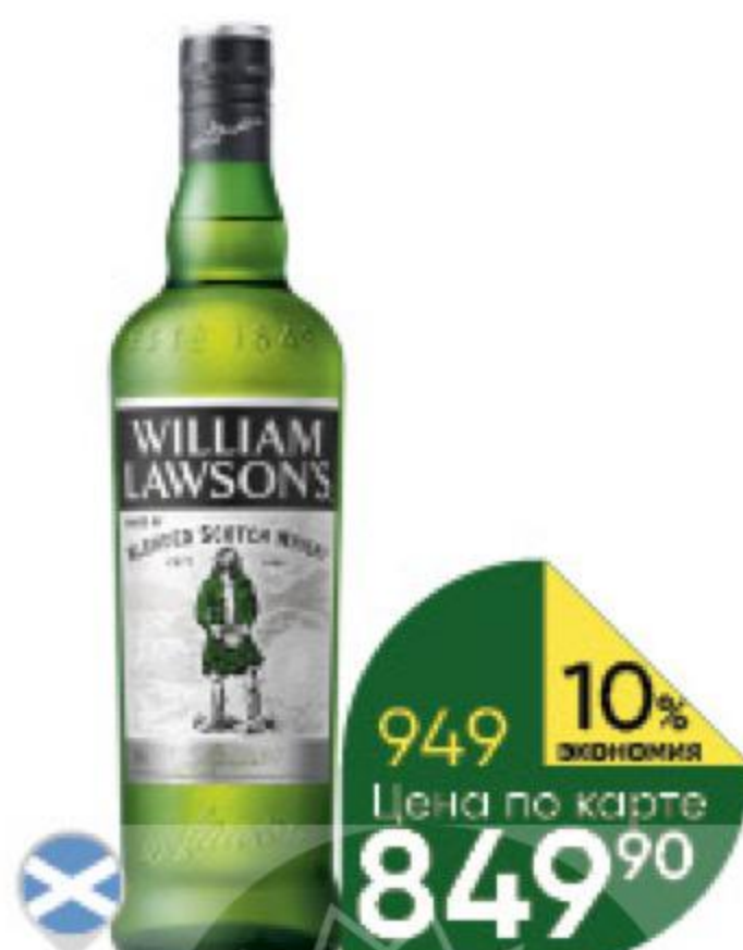
Виски WILLIAM LAWSON'S Ecological KV 7 лет выдержанный 40%, 0,7 л (Шотландия)