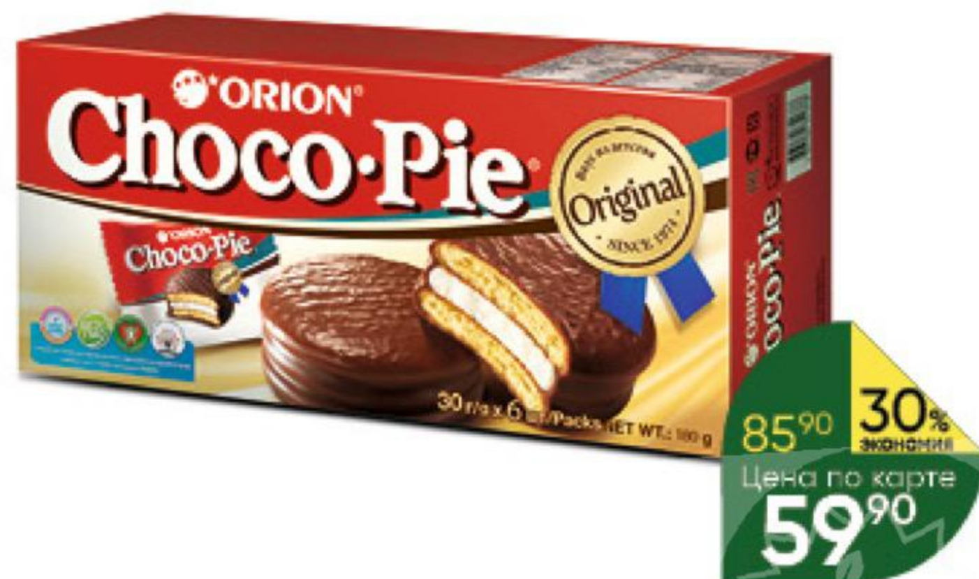
Пирожное ORION Choco Pie в глазури 6 шт., 180 г