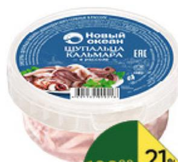
Щупальца кальмара НОВЫЙ ОКЕАН в рассоле, 180 г

189 90 21% ЭКОНОМИЯ Цена по карте 149 90