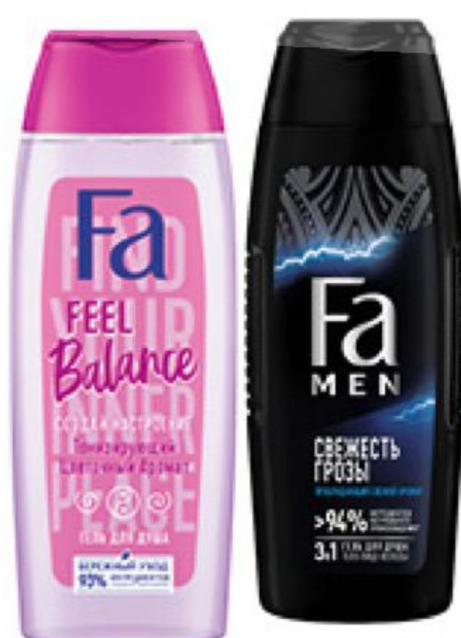
Гель для душа FA в ассортименте, 250 мл

149 90 13% ЭКОНОМИЯ Цена по карте 129 90