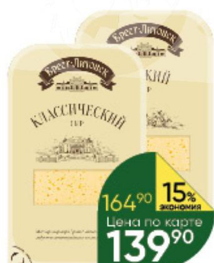
Сыр БРЕСТ-ЛИТОВСК Лёгкий 35%; Классический 45%, 150 г

169 90 24% ЭКОНОМИЯ Цена по карте 129 90