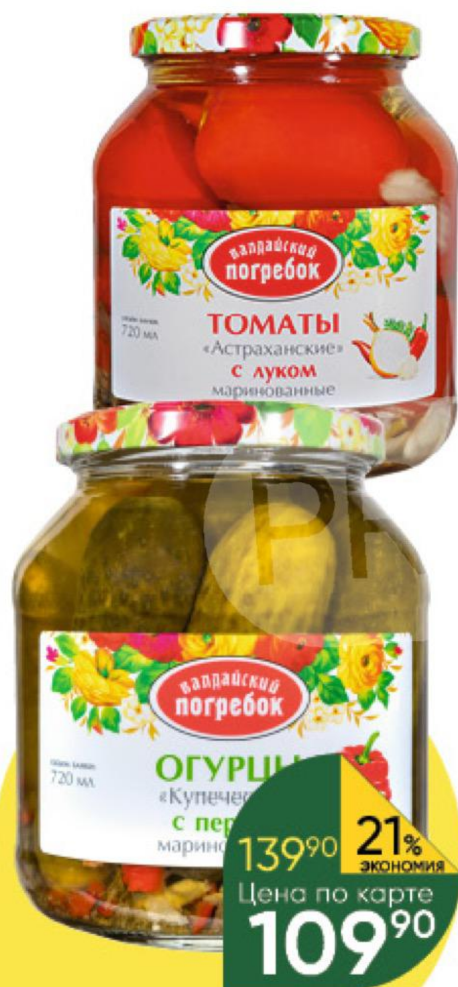
Консервы овощные ВАЛДАЙСКИЙ ПОГРЕБОК огурцы Купеческие; томаты Астраханские маринованные; томаты Кубанские неочищенные в томатном соке, 650-660 г; 720 мл

139 90 21% ЭКОНОМИЯ Цена по карте 109 90