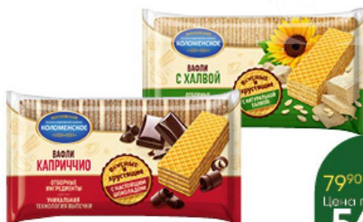
Вафли КОЛОМЕНСКОЕ в ассортименте, 200-220 г