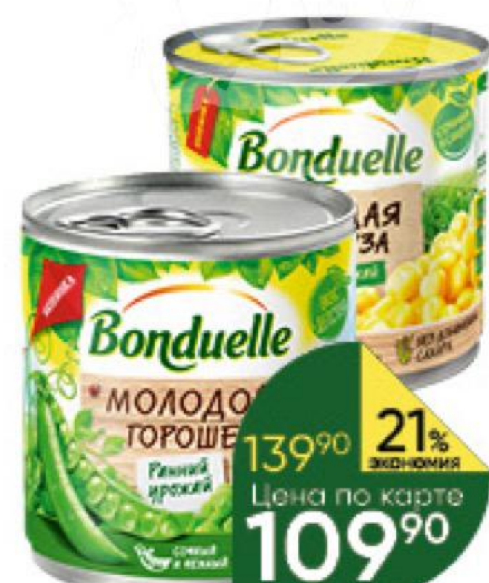
Консервы овощные BONDUELLE горошек зелёный молодой, 400 г; кукуруза молодая сладкая, 425 мл

139 90 21% ЭКОНОМИЯ Цена по карте 109 90