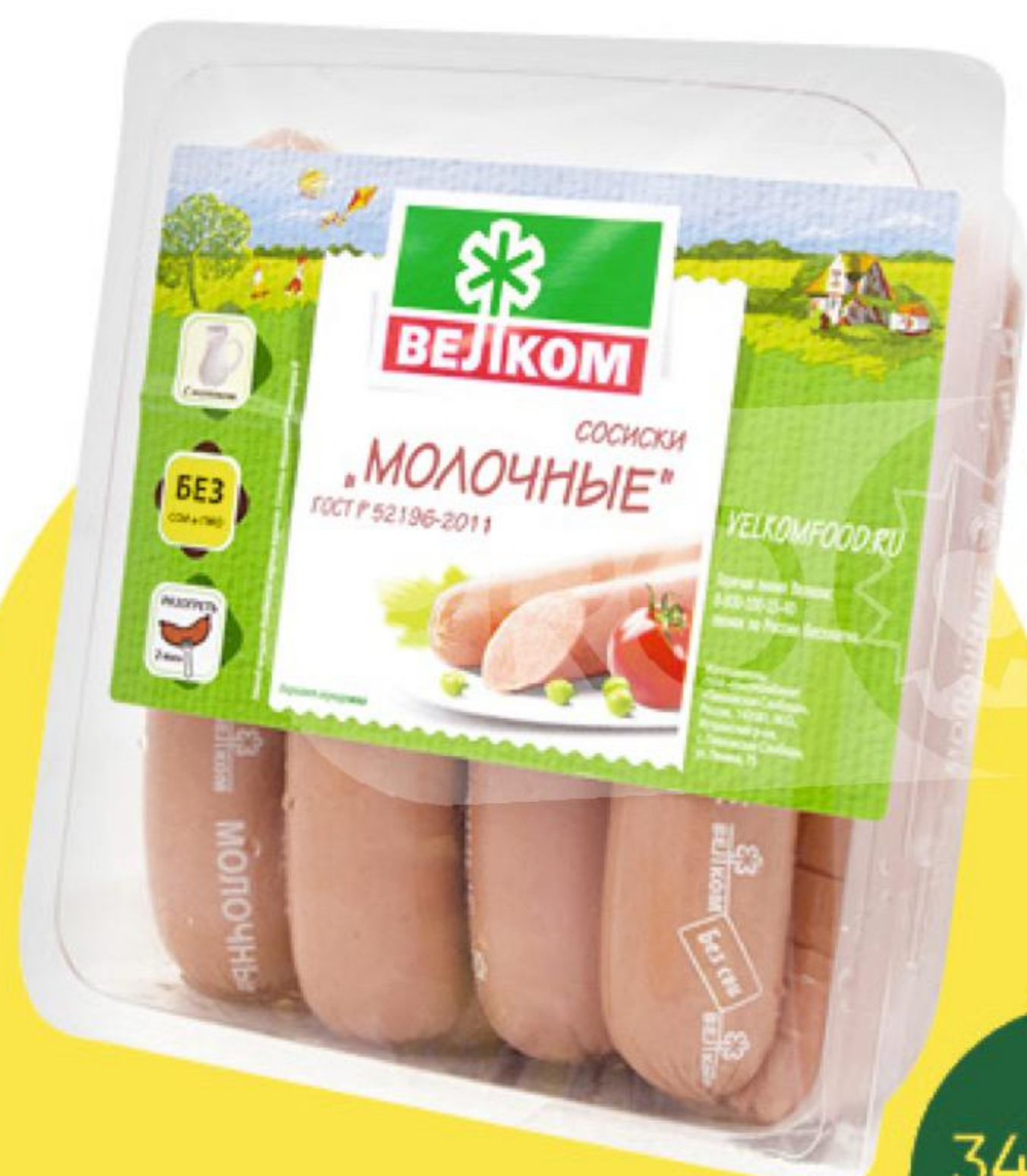
Сосиски ВЕЛКОМ Молочные, 480 г