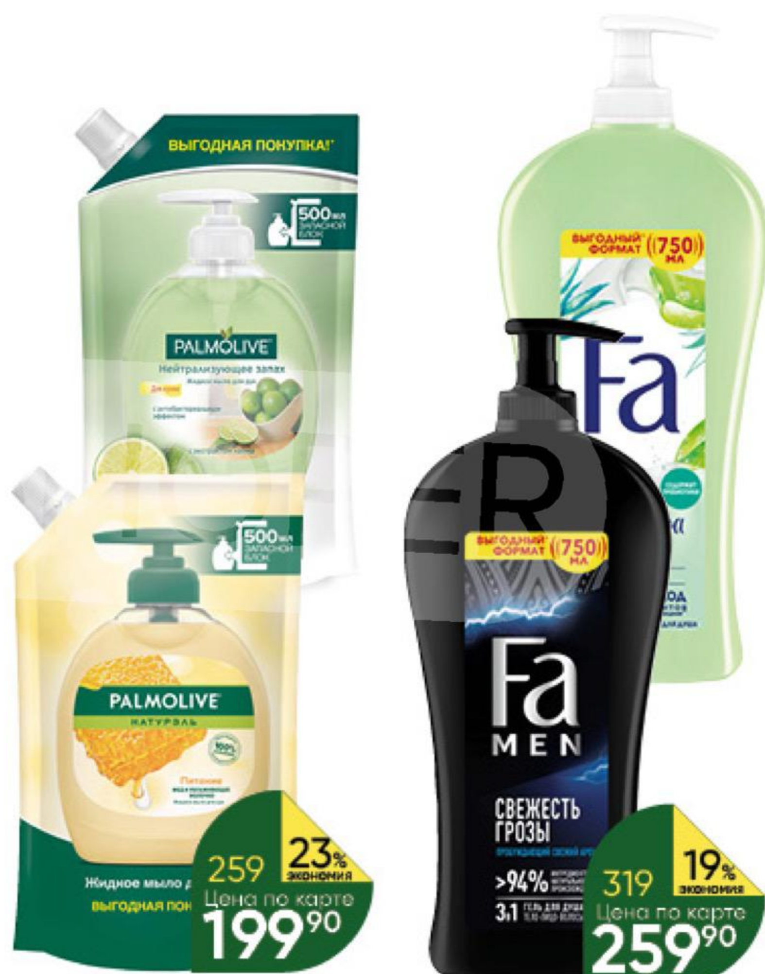
Мыло жидкое для рук PALMOLIVE Натурэль питание; интенсивное увлажнение; нейтрализующее запах, 500 мл