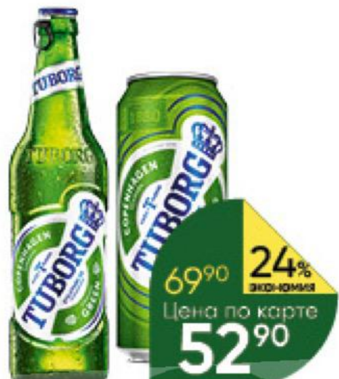
Пиво TUBORG Green светлое 4,6%, 0,45–0,48 л (Россия)