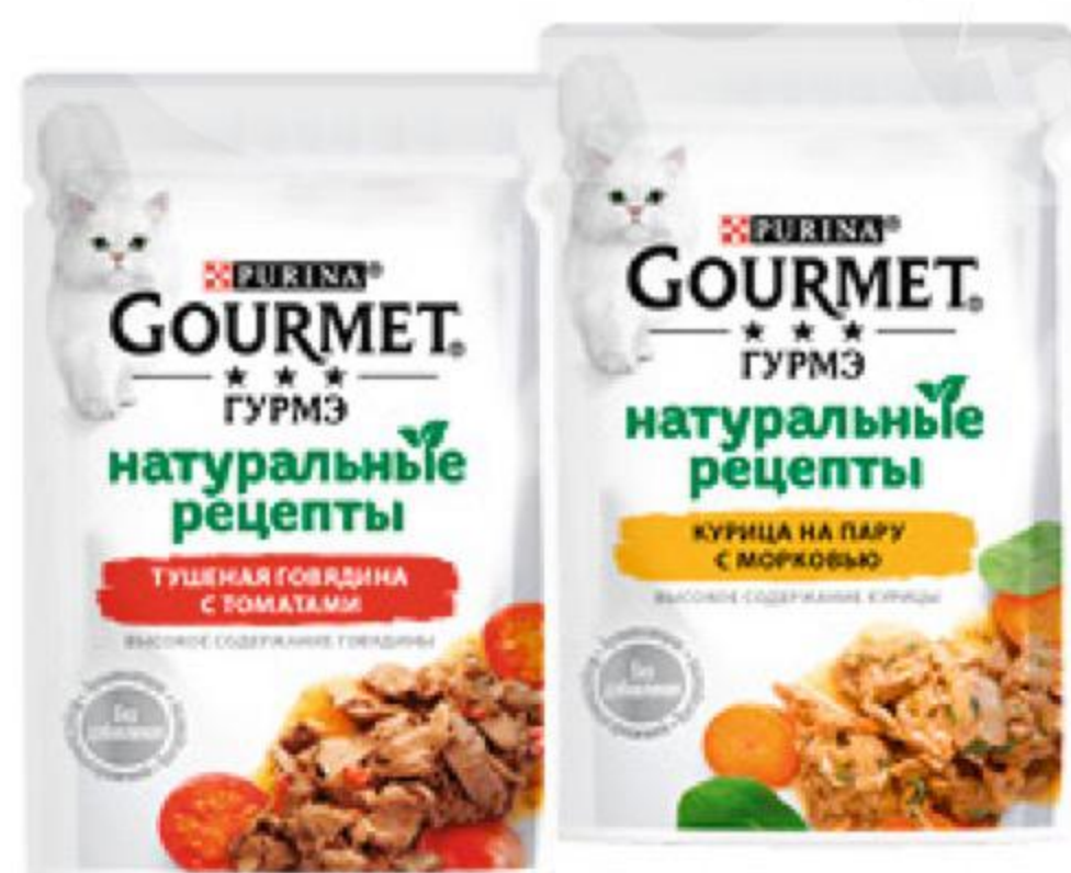
Корм для кошек PURINA Gourmet консервы в ассортименте, 75 г