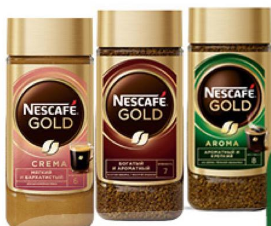
Кофе NESCAFÉ Gold Aroma Intenso растворимый с молотым; Gold Crema нежная пенка; Gold растворимый, 85-95 г