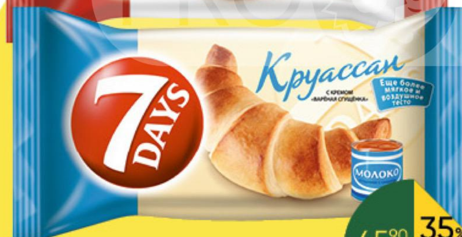
Круассан 7DAYS в ассортименте, 65 г