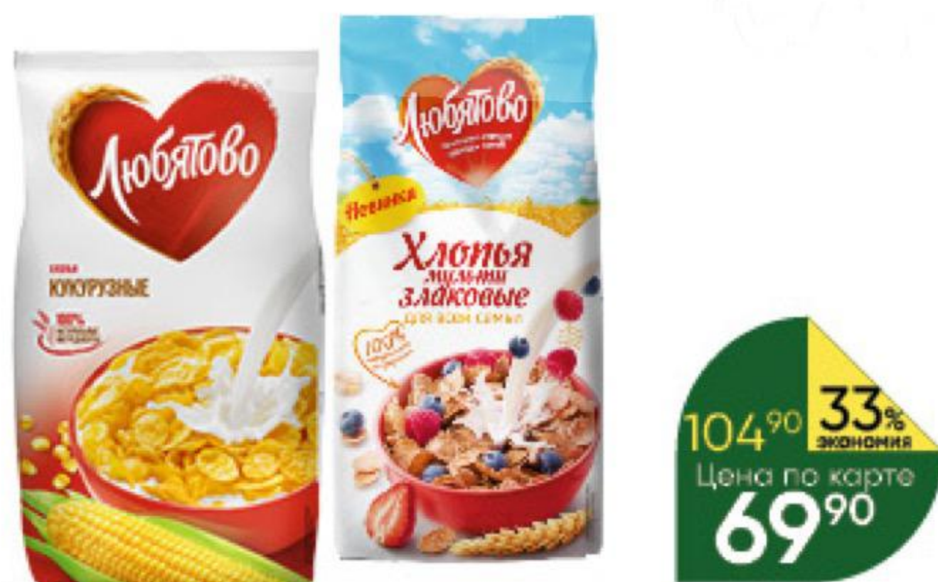
Хлопья ЛЮБЯТОВО мультизлаковые; кукурузные, 250-300 г

179 90 25% ЭКОНОМИЯ Цена по карте 134 90