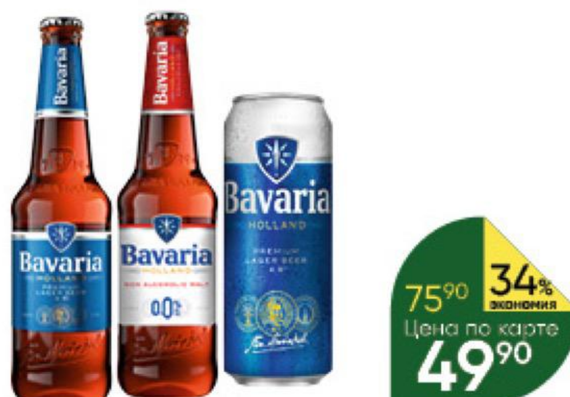
Пиво; Напиток пивной BAVARIA Premium светлое фильтрованное 4,9%; Malt безалкогольный, 0,45 л (Россия)