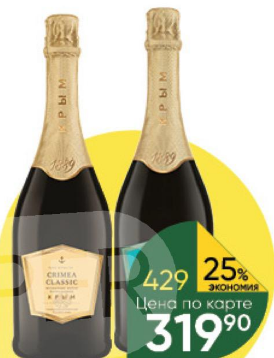
Вино игристое CRIMEA CLASSIC мускатное белое полусладкое; белое брют 12-12,5%, 0,75 л (Россия)