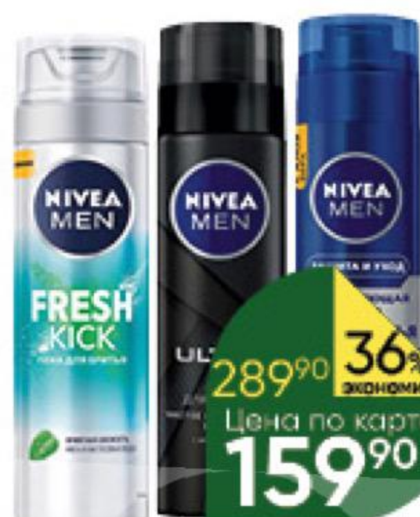
Пена для бритья NIVEA Меп в ассортименте, 200 мл

289 90 36% ЭКОНОМИЯ Цена по карте 159 90