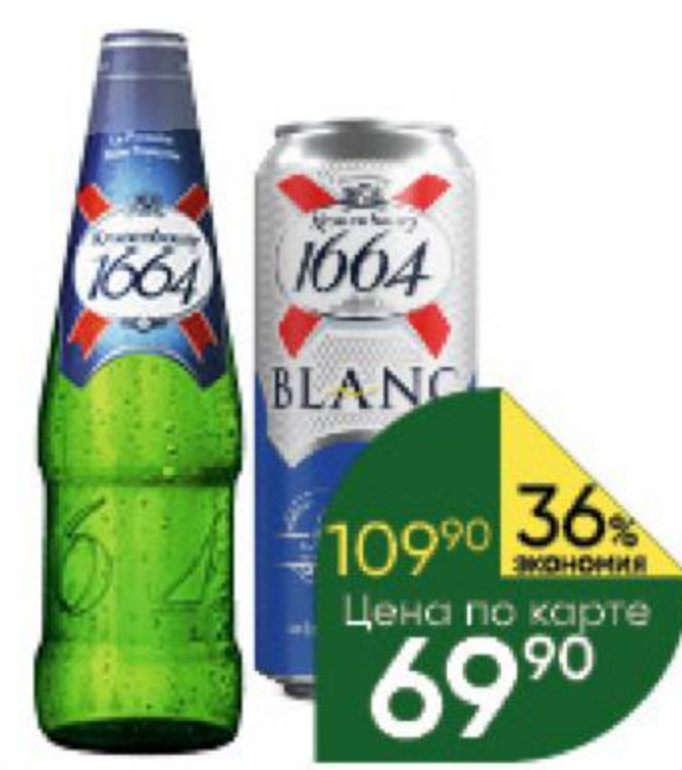
Пиво; Напиток пивной KRONENBOURG 1664 Classic; Blanc светлое 4,5%, 0,45–0,46 л (Россия)