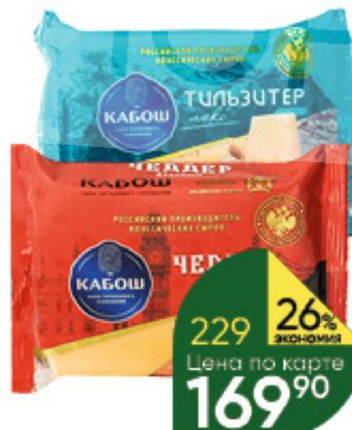
Сыр КАБОШ Тильзитер; Чеддер 47-49%, 200 г

164 90 15% ЭКОНОМИЯ Цена по карте 139 90