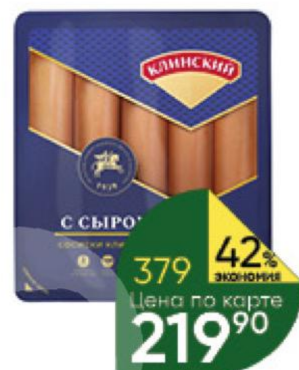
Сосиски КЛИНСКИЙ Клинские с сыром, 470 г