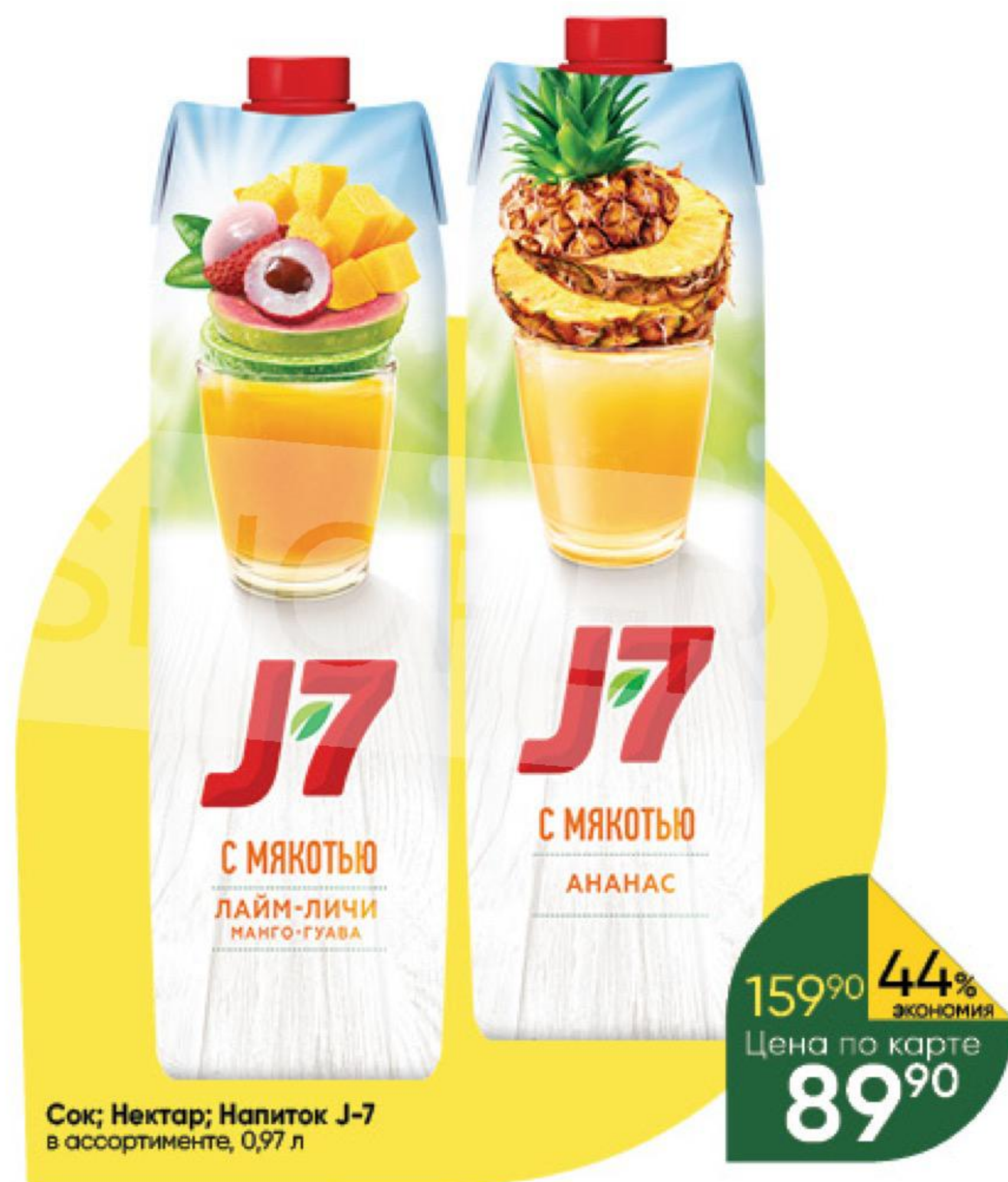
Сок; Нектар; Напиток J-7 в ассортименте, 0,97 л