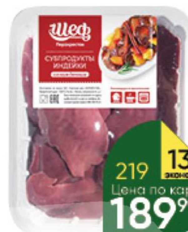
Печень индейки ШЕФ ПЕРЕКРЕСТОК охлажденная, 500 г