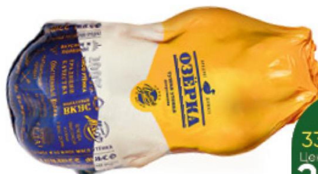
Тушка утки ОЗЕРКА потрошенная охлажденная, 1 кг