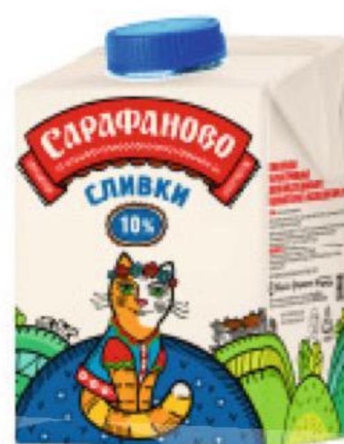
Сливки САРАФАНОВО ультрапастеризованные 10%, 480 мл