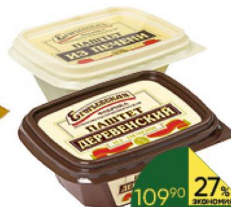
Паштет ЕГОРЬЕВСКАЯ Из печени; Деревенский из печени, 150 г