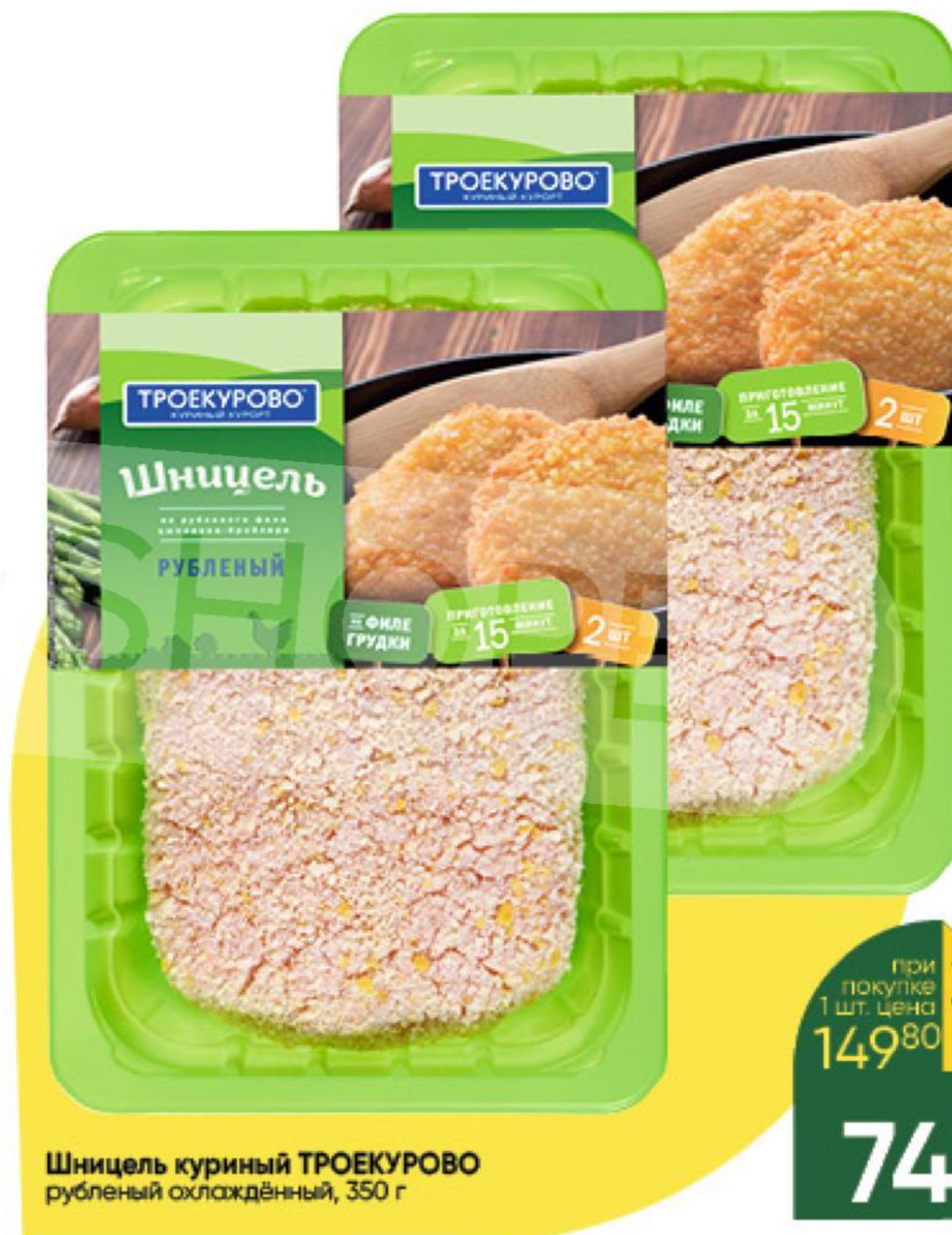
Шницель куриный ТРОЕКУРОВО рубленный охлажденный, 350 г

при покупке 1 шт. цена 149 80 74 90 * 2 по цене 1