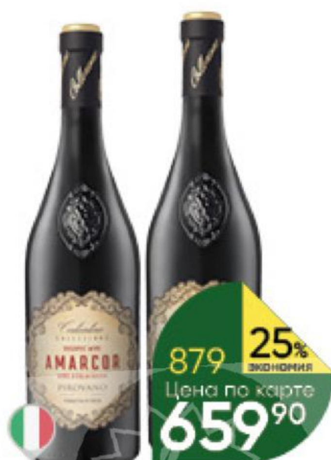
Вино COLLEZIONE COSTANTINO Organic Amarcor; Salento Rosso Passito красное полусухое 14-14,5%, 0,75 л (Италия)