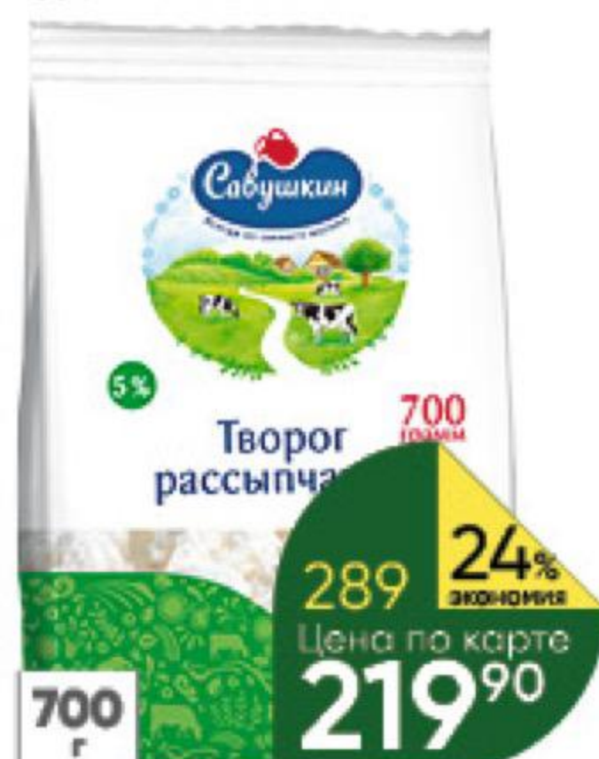
Творог САВУШКИН рассыпчатый 5%, 700 г