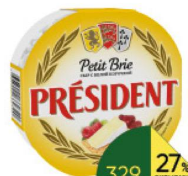
Сыр PRESIDENT Petit Brie мягкий с белой плесенью 60%, 125 г