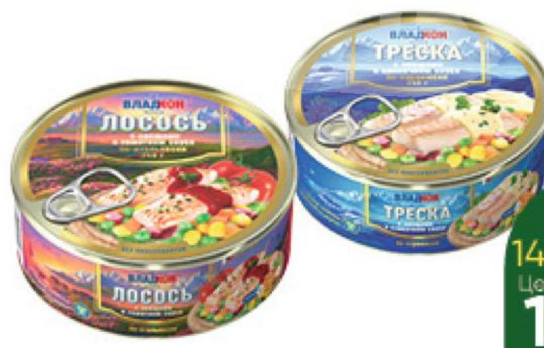
Консервы рыбные с овощами ВЛАДКОН Треска по-норвежски в сливочном соусе; Тунец по-гавайски; Лосось по-итальянски в томатном соусе, 240 г

139 90 21% ЭКОНОМИЯ Цена по карте 109 90