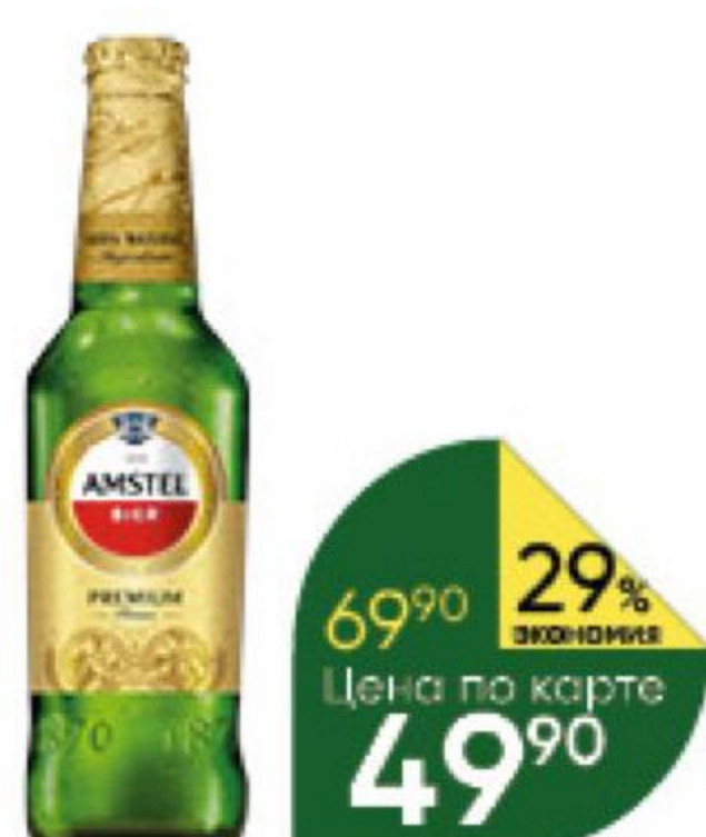
Пиво AMSTEL Premium pilsener светлое 4,8%, 0,43–0,45 л (Россия)