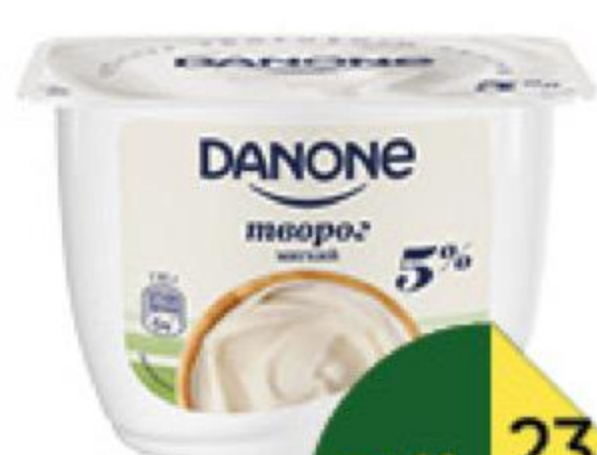
Творог DANONE мягкий 5%, 170 г