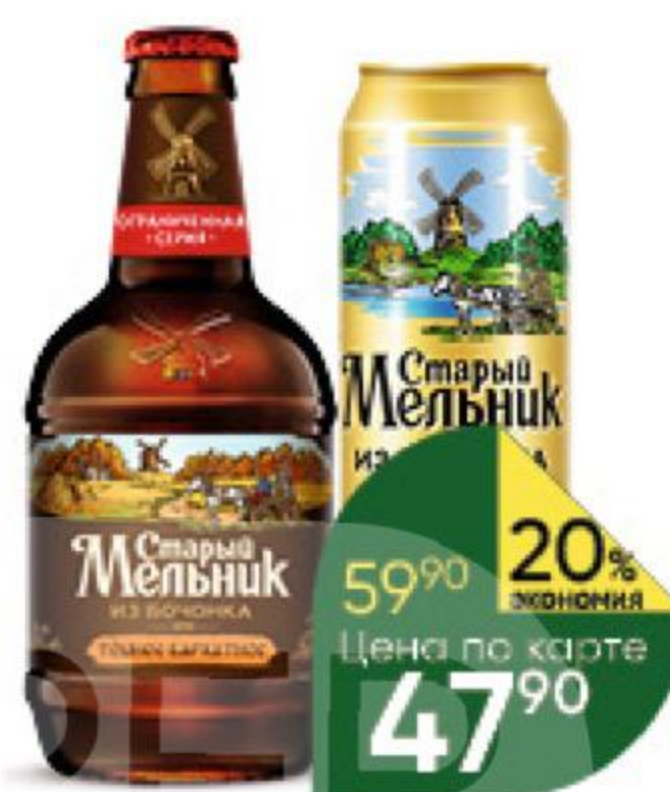
Пиво СТАРЫЙ МЕЛЬНИК Из Бочонка в ассортименте 4,2–5%, 0,45 л (Россия)