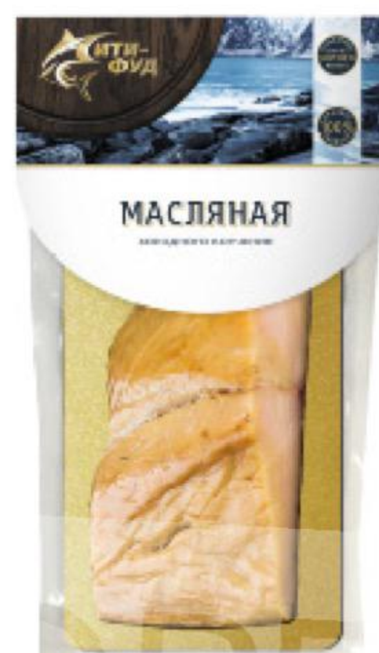
Рыба Масляная СИТИ-ФУД холодного копчения кусок, 200 г