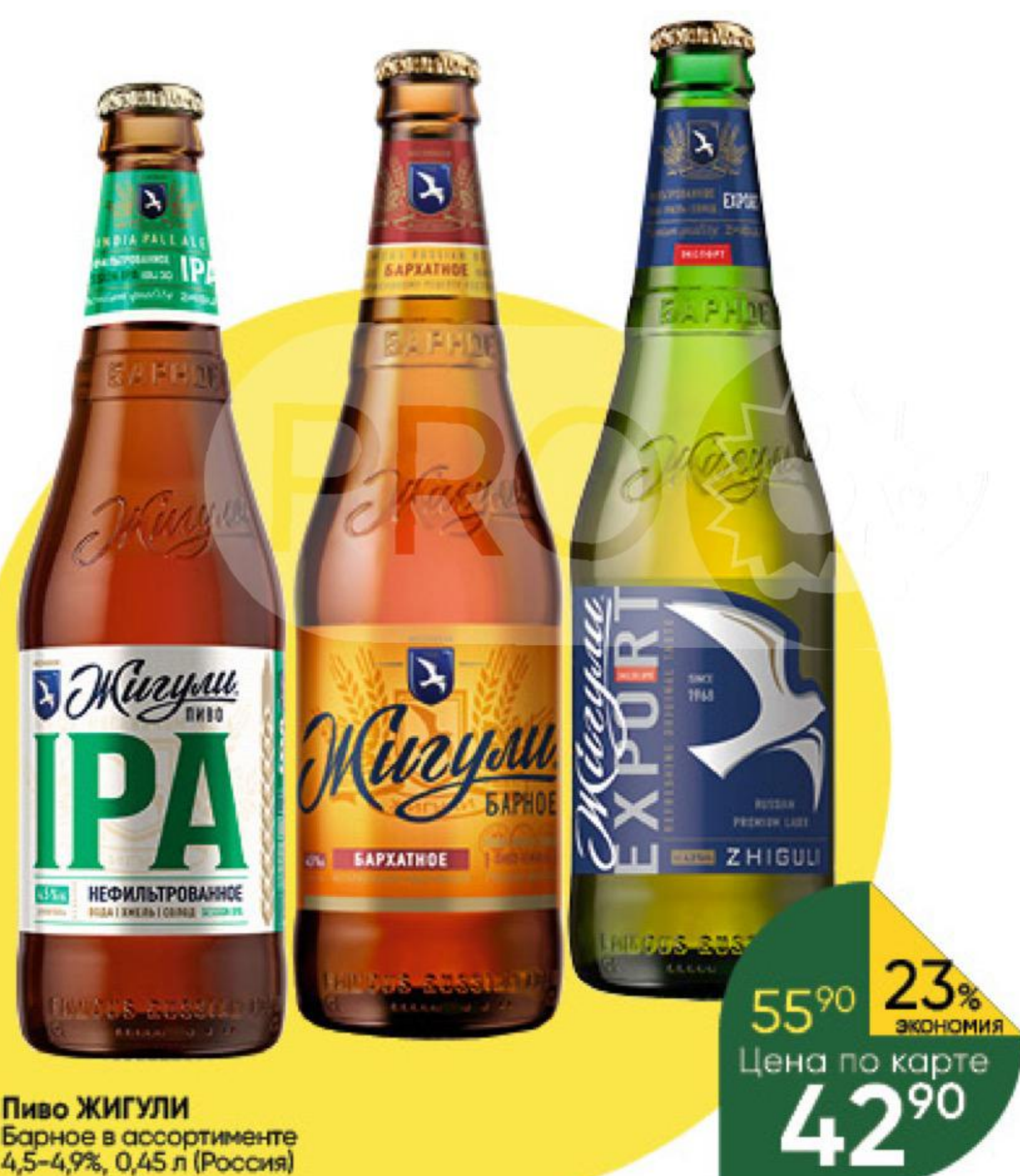
Пиво ЖИГУЛИ Барное в ассортименте 4,5–4,9%, 0,45 л (Россия)