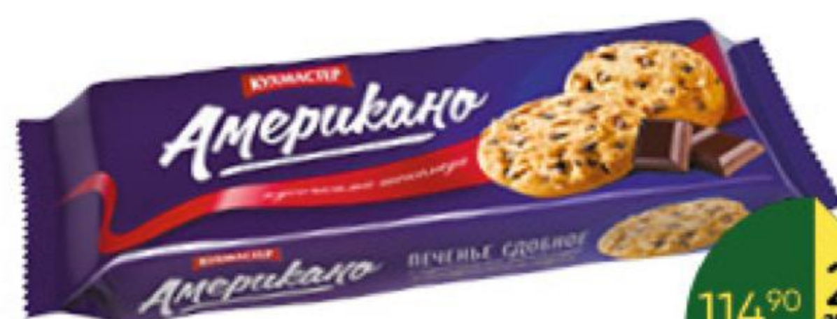
Печенье КУХМАСТЕР Американо сдобное с кусочками шоколада, 270 г