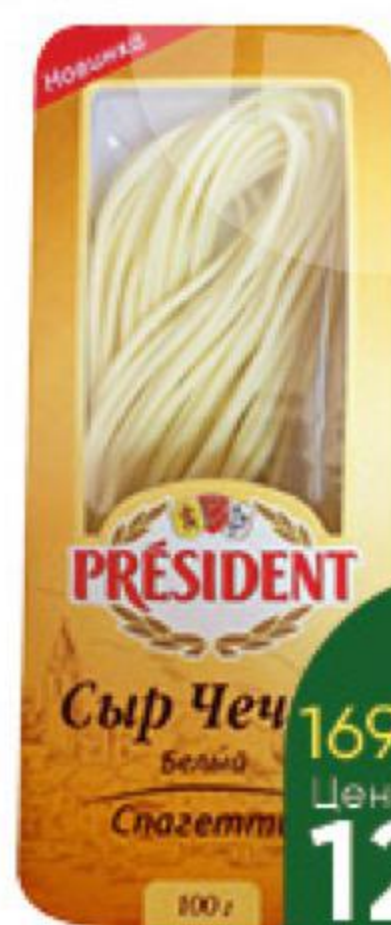
Сыр PRESIDENT Чедил белый спагетти 35%, 100 г

169 90 24% ЭКОНОМИЯ Цена по карте 129 90