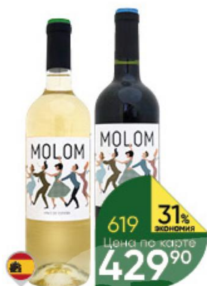
Вино MOLOM Blanco белое сухое; Tinto красное сухое 11-12%, 0,75 л (Испания)

ПРЕЗЕРВНОЕ УПОТРЕБЛЕНИЕ АЛКОГОЛЯ ВРЕДИТ ВАШЕМУ ЗДОРОВЬЮ 18+