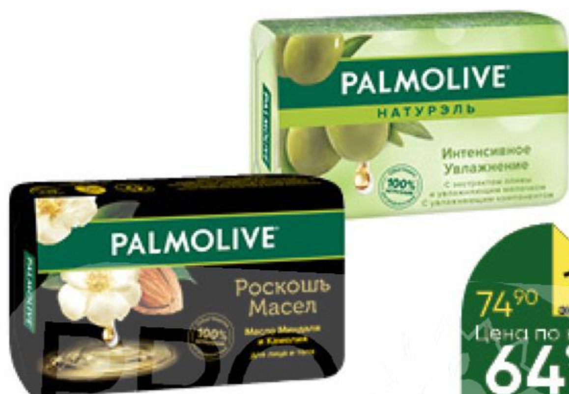
Мыло PALMOLIVE туалетное твёрдое в ассортименте, 90 г