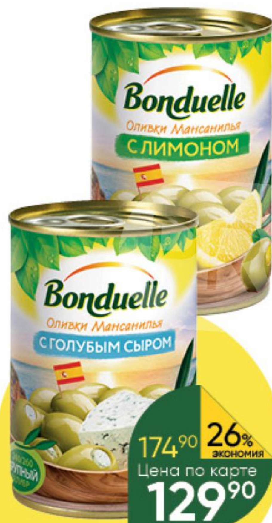
Маслины; Оливки BONDUELLE в ассортименте, 300 г

174 90 26% ЭКОНОМИЯ Цена по карте 129 90