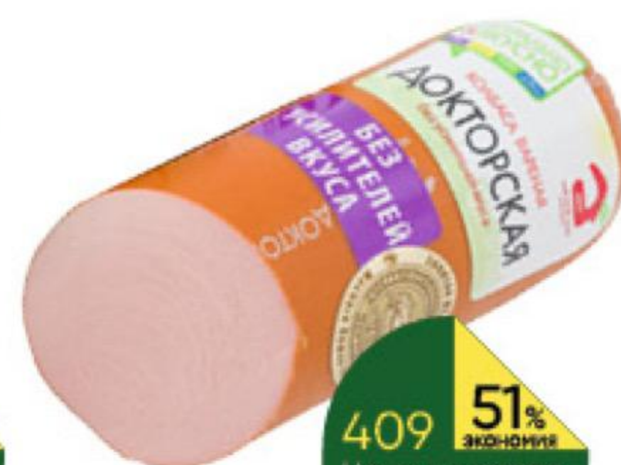
Колбаса МЯСНОЙ ДОМ БОРОДИНА Докторская варёная, 500 г