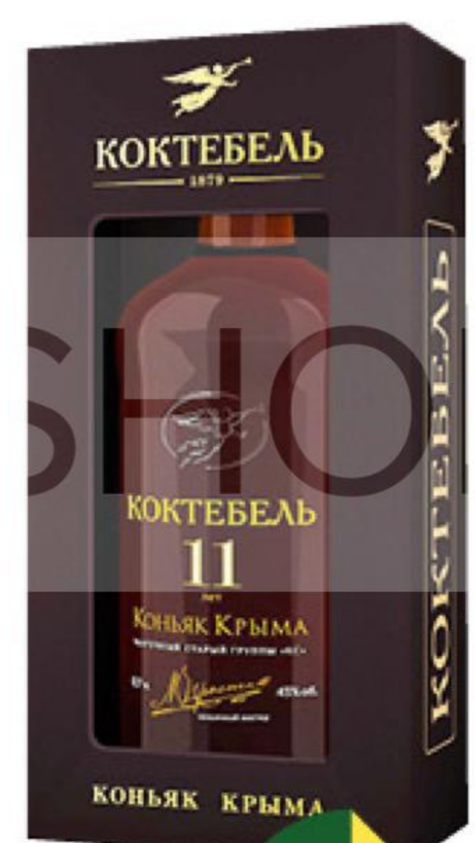
Коньяк КОКТЕБЕЛЬ 11 КС старый 40%, 0,7 л (Россия)