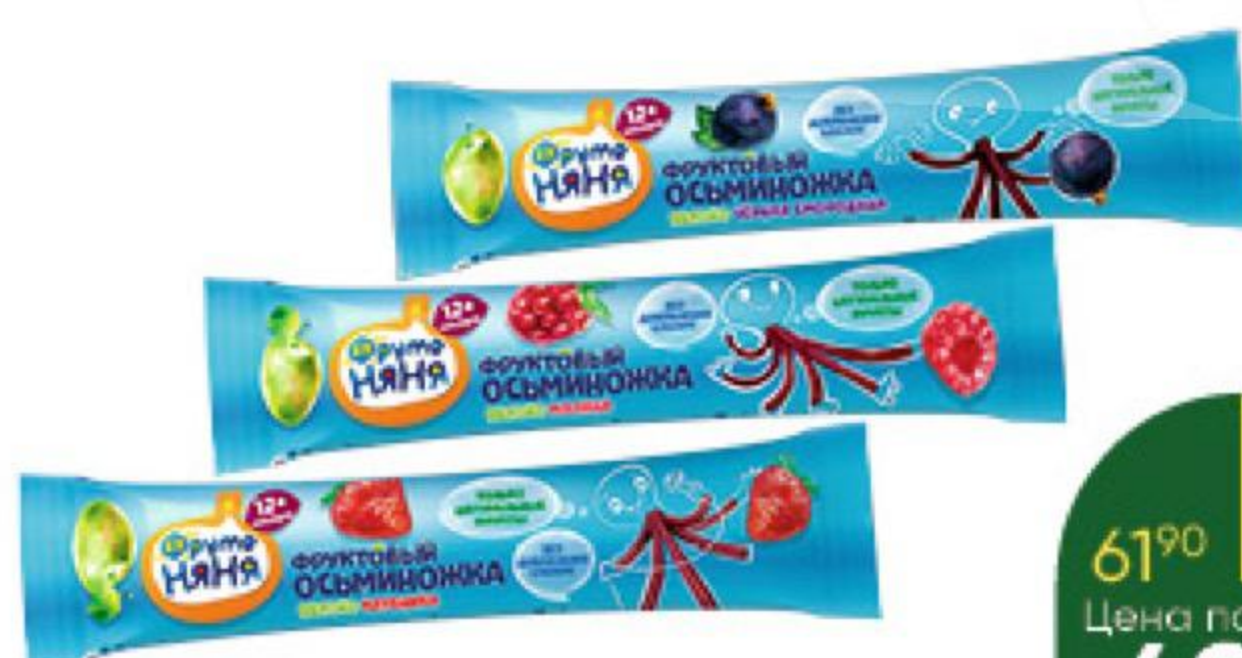
Фруктовые кусочки ФРУТОНЯНЯ яблоко-клубника; яблоко-малина; яблоко-чёрная смородина, 16 г