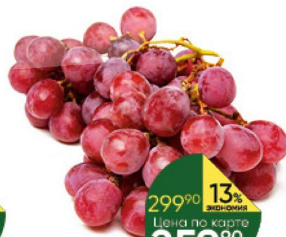
Виноград красный Ред Глоб, 1 кг

209 90 14% ЭКОНОМИЯ Цена по карте 179 90