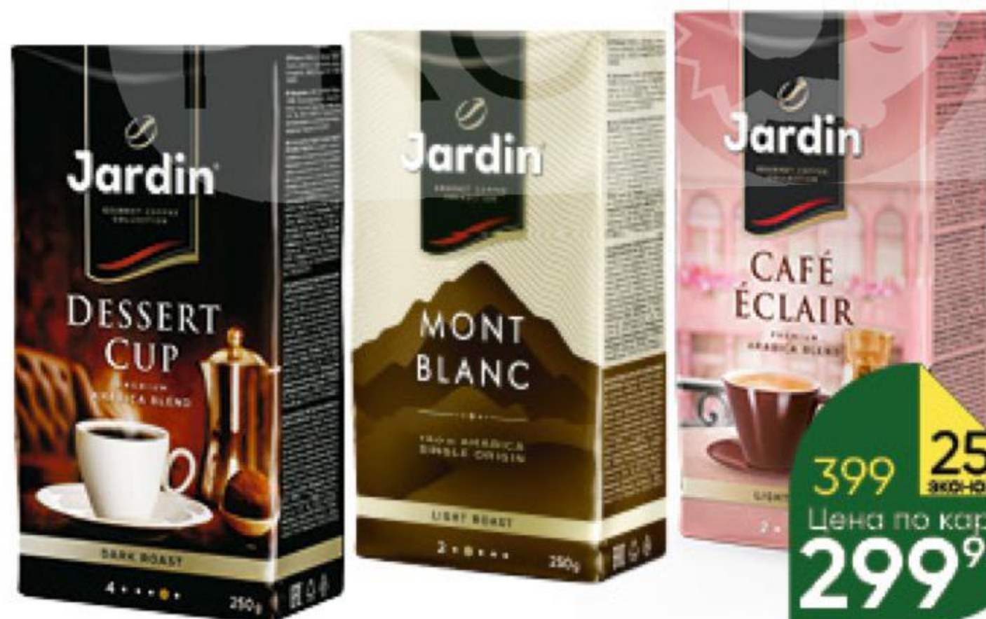
Кофе JARDIN в ассортименте молотый; в зёрнах, 250 г