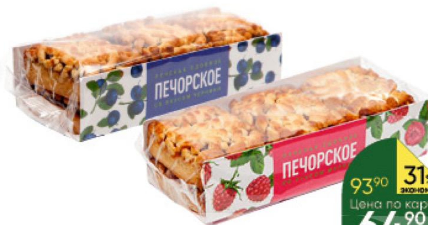
Печенье ПЕЧОРСКОЕ сдобное черника; малина, 330 г