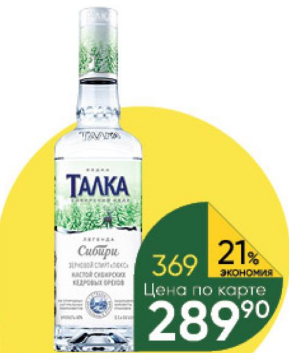
Водка ТАЛКА Сибирский кедр особая 40%, 0,5 л (Россия)