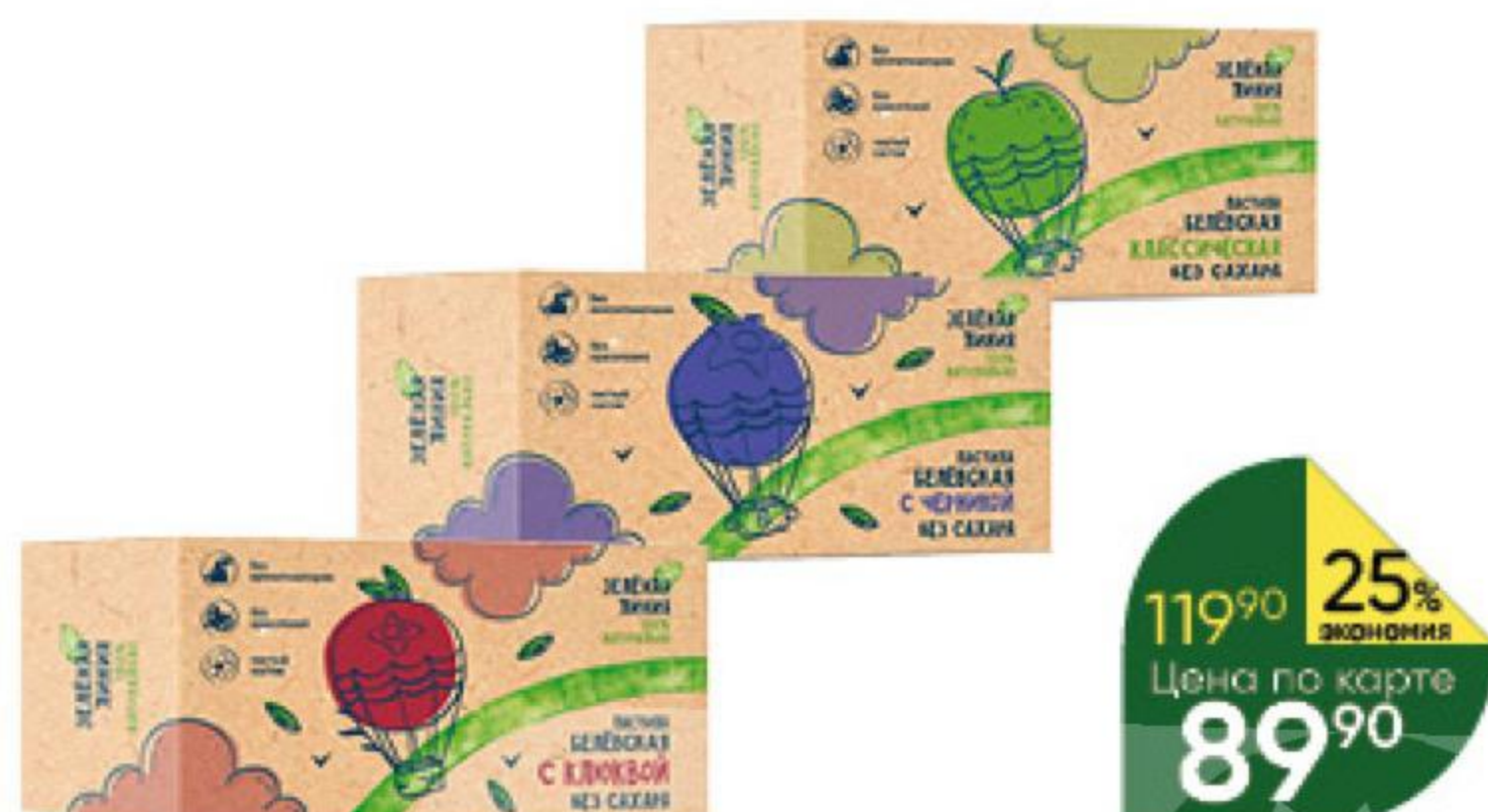
Пастила ЗЕЛЁНАЯ ЛИНИЯ Белёвская классическая; с клюквой; с черникой без сахара, 100 г