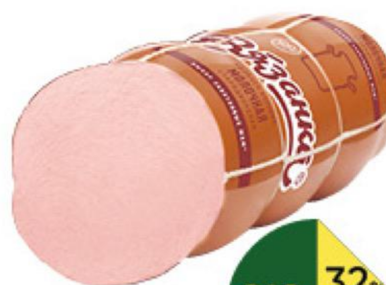
Колбаса СТАРОДВОРСКИЕ КОЛБАСЫ Вязанка Молочная Стародворская варёная, 500 г