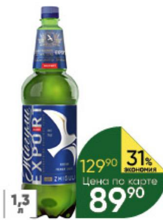
Пиво ЖИГУЛИ Барное Экспорт светлое 4,8%, 1,3 л (Россия)