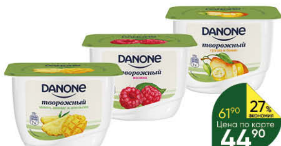
Продукт творожный DANONE в ассортименте 3,6%, 170 г