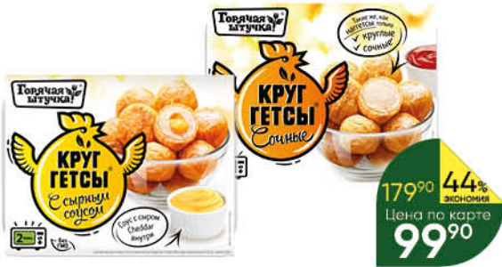
Круггетсы ГОРЯЧАЯ ШТУЧКА сочные; с сыром и мясом птицы, 250 г