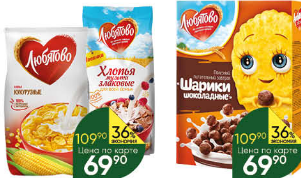
Хлопья ЛЮБЯТОВО мультизлаковые; кукурузные, 250-300 г

199 90 33% экономия Цена по карте 134 90