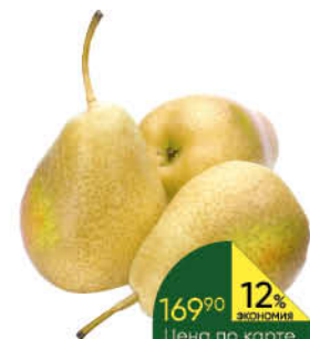
Груша сезонная, 1 кг

139 90 14% ЭКОНОМИЯ Цена по карте 119 90