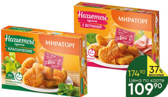
Наггетсы куриные МИРАТОРГ классические; с ветчиной, 300 г