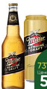
Напиток пивной MILLER Genuine Draft светлый 4,7%, 0,43-0,47 л (Россия)