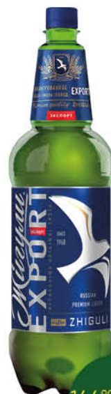
Пиво ЖИГУЛИ Барное Экспорт светлое 4,8%, 1,3 л (Россия)

1,3 л 144 90 38% Цена по карте 89 90 ЭКОНОМИЯ