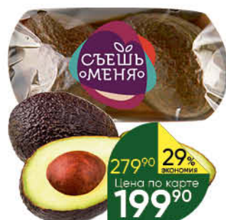
Авокадо HASS ready to eat, 1 уп.

169 90 12% ЭКОНОМИЯ Цена по карте 149 90