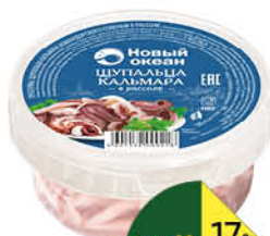
Шумальца кальмара НОВЫЙ ОКЕАН в рассоле, 180 г

179 90 17% ЭКОНОМИЯ Цена по карте 149 90