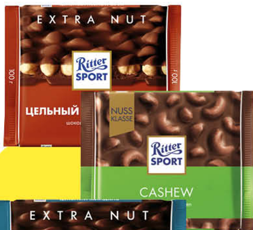
Шоколад RITTER SPORT в ассортименте, 100 г

169 90 29% ЭКОНОМИЯ Цена по карте 119 90