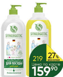
Средство для мытья посуды SYNERGETIC алоэ; лимон биоразлагаемое, 1 л