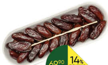
Финики, 1 уп.

169 90 12% ЭКОНОМИЯ Цена по карте 149 90