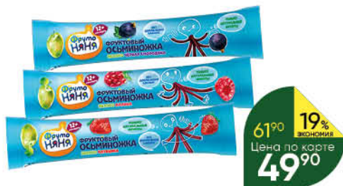
Фруктовые кусочки ФРУТОНЯНЯ яблоко-клубника; яблоко-малина; яблоко-чёрная смородина, 16 г

Товар представлен не во всех супермаркетах «Перекрёсток».