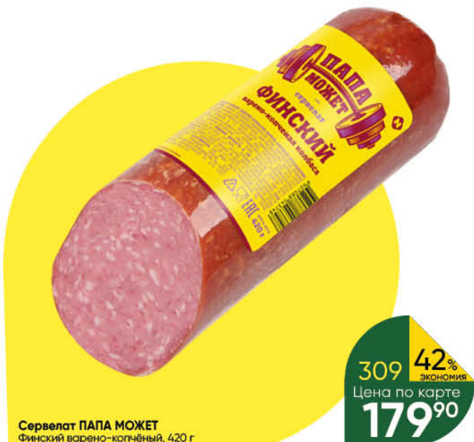
Сервелат ПАПА МОЖЕТ Финский варено-копченый, 420 г