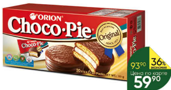
Пирожное ORION Choco Pie в глазури 6 шт., 180 г