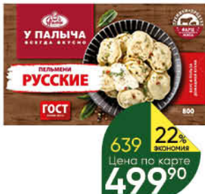
Пельмени У ПАЛЫЧА Русские, 800 г