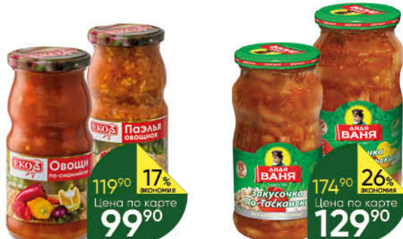
Консервы овощные ЕКО в ассортименте, 480-500 г

139 90 21% ЭКОНОМИЯ Цена по карте 109 90