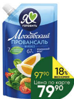
Майонез МОСКОВСКИЙ ПРОВАНСАЛЬ классический 67%, 390 мл