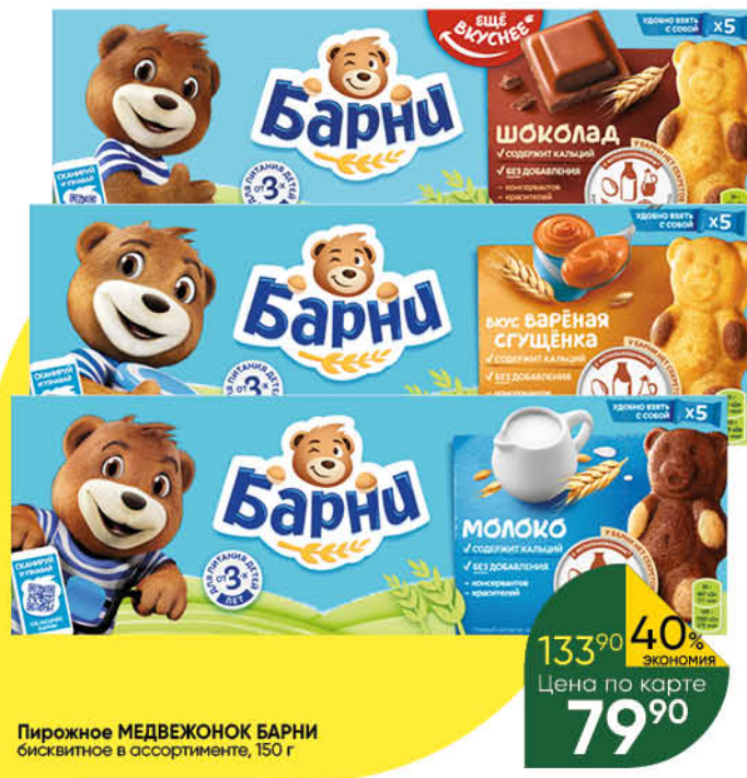
Пирожное МЕДВЕЖОНОК БАРНИ бисквитное в ассортименте, 150 г