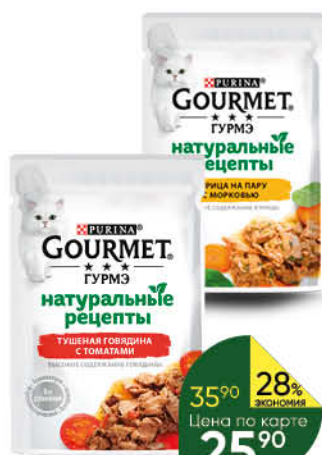
Корм для кошек PURINA Gourmet консервы в ассортименте, 75 г