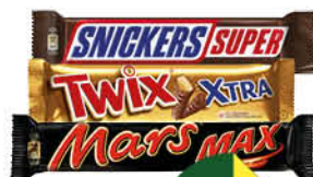
Шоколадный батончик; Драже MARS; SNICKERS; TWIX; M&M'S в ассортименте, 80-95 г