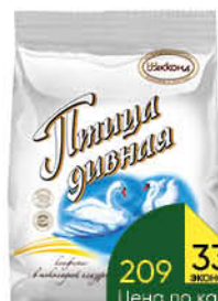
Конфеты шоколадные АККОНД Птица дивная, 300 г