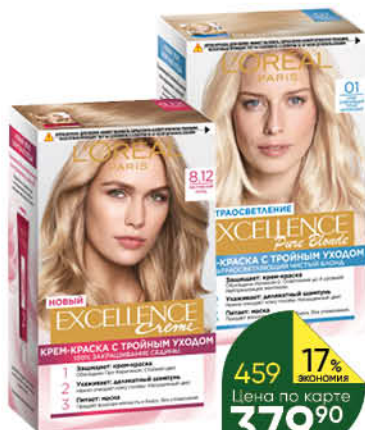
Крем-краска для волос L'OREAL PARIS Excellence Creme в ассортименте, 1 уп.