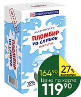
Мороженое БАШКИРСКИЙ ХОЛОД пломбир из сливок ванильное, 15% 230 г

Товар представлен не во всех супермаркетах «Перекрёсток».