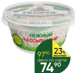
Творог ПЕСТРАВКА 5%, 200 г