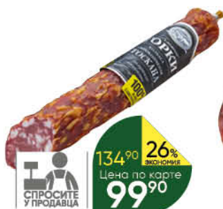
Колбаса БЛИЖНИЕ ГОРКИ Тоскана сырокопченая, 100 г