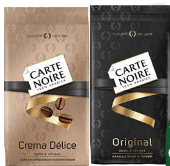
Кофе CARTE NOIRE Original; Crema Delice в зёрнах, 800 г