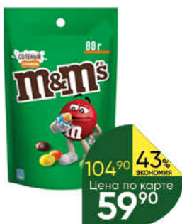
Драже M&M'S, 80 г