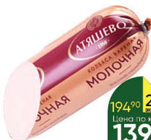
Колбаса АТЯШЕВО Молочная вареная, 500 г

194 90 28% Экономия Цена по карте 139 90