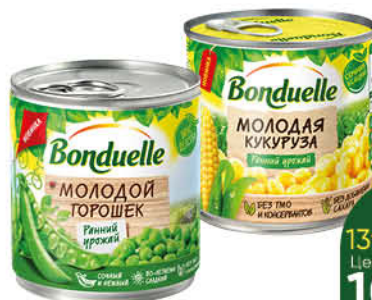
Консервы овощные BONDUELLE горошек зелёный молодой, 400 г; кукуруза молодая сладкая, 425 мл

179 90 28% ЭКОНОМИЯ Цена по карте 129 90