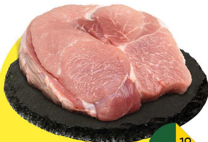
Свинина духовая без кости охлаждённая, 1 кг