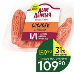
Сосиски ДЫМ ДЫМЫЧ с говядиной, 400 г

159 90 31% Экономия Цена по карте 109 90