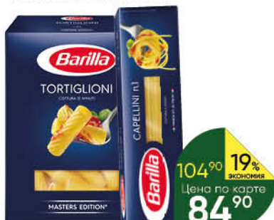
Макаронные изделия BARILLA в ассортименте, 450 г