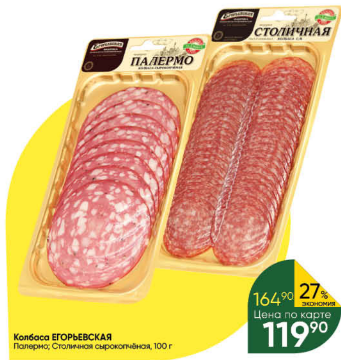
Колбаса ЕГОРЬЕВСКАЯ Палермо; Столичная сырокопченая, 100 г