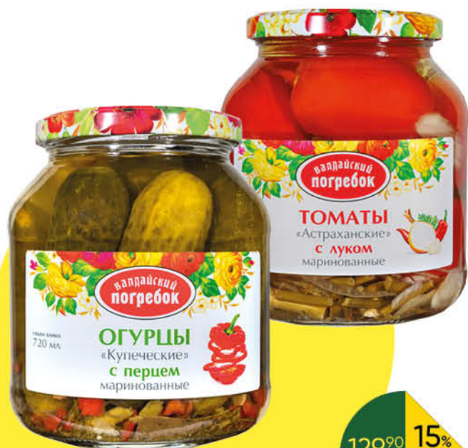
Консервы овощные ВАЛДАЙСКИЙ ПОГРЕБОК огурцы Купеческие; томаты Астраханские маринованные; томаты Кубанские неочищенные в томатном соке, 650-660 г; 720 мл

129 90 15% ЭКОНОМИЯ Цена по карте 109 90