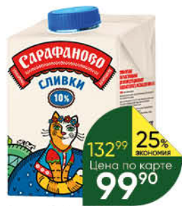
Сливки САРАФАНОВО ультрапастеризованные 10%, 480 мл