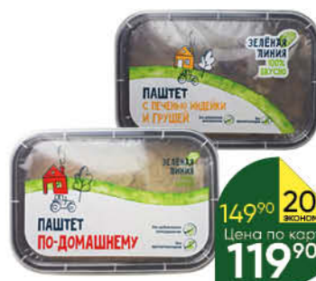
Паштет ЗЕЛЁНАЯ ЛИНИЯ По-домашнему, с печенью индейки и грушей, 160 г

149 90 20% Экономия Цена по карте 119 90