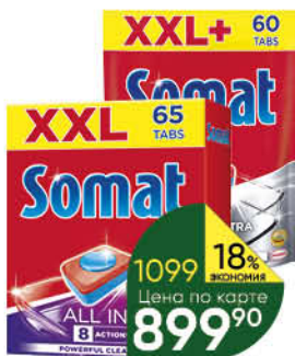
Таблетки для посудомоечной машины SOMAT All in 1 Extra; All in 1, 60–65 шт.