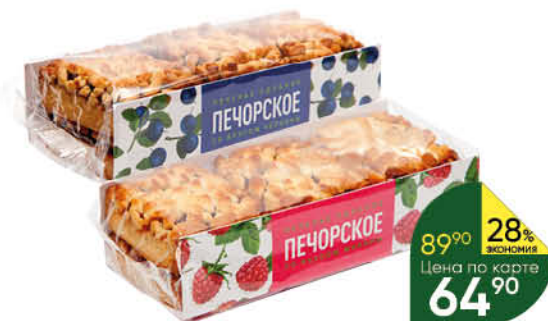
Печенье ПЕЧОРСКОЕ сдобное черника; малина, 330 г