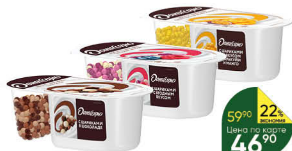
Йогurt ДАНИССИМО Фантазия с хрустящими шариками в ассортименте 6,9%, 105 г