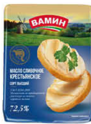
Масло сливочное ВАМИН Крестьянское 72,5%, 180 г