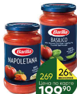
Соус томатный BARILLA Basilico с базиликом; Napolitana с овощами, 400 г