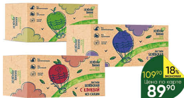
Пастила ЗЕЛЁНАЯ ЛИНИЯ Белёвская классическая; с клюквой; с черникой без сахара, 100 г