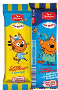
Сырок творожный СВИТЛОГОРЬЕ варёная сгущёнка; ваниль 16%, 40 г