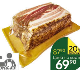
Сало ВОСТРЯКОВО Белорусское солёное из шпика свиного, 100 г

159 90 31% Экономия Цена по карте 109 90