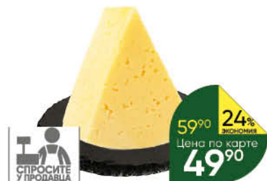
Сыр Российский 45%, 100 г