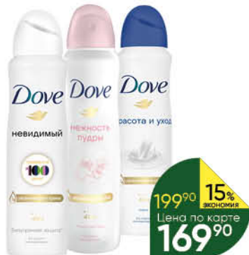
Антиперспирант DOVE в ассортименте, 150 мл

199 90 15% экономия Цена по карте 169 90