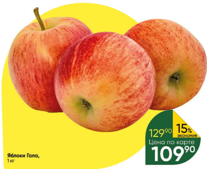
Яблоки Гала, 1 кг

129 90 15% ЭКОНОМИЯ Цена по карте 109 90