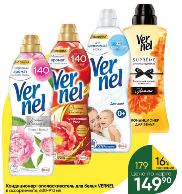
Кондиционер-ополаскиватель для белья VERNEL в ассортименте, 600–910 мл

Товар представлен не во всех супермаркетах «Перекрёсток». Изображения товаров в каталоге могут незначительно отличаться от представленных в супермаркете «Перекрёсток». Цены указаны в рублях с учётом всех скидок за единицу товара и действуют с 9:00 первого дня акции. Дополнительная скидка на товар, указанный в каталоге, не распространяется. В течение проведения промоакции цена может быть дополнительно снижена относительно заявленной в рекламе. Товары, подлежащие обязательной сертификации или иному обязательному подтверждению соответствия требованиям технических регламентов, имеют необходимые подтверждающие документы. Не является публичной офертой. Количество товара ограничено. Цены действительны с 15 по 21 марта 2022 года.