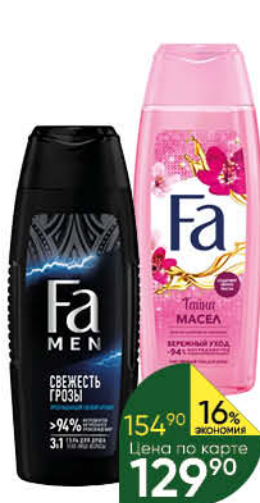
Гель для душа FA в ассортименте, 250 мл

154 90 16% экономия Цена по карте 129 90