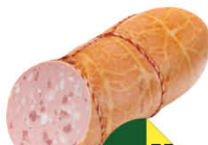
Колбаса ОСТАНКИНО Телячья вареная, 100 г