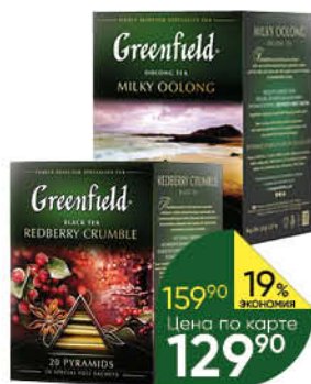
Чай GREENFIELD в ассортименте, 20 x 1,8-2 г

159 90 19% ЭКОНОМИЯ Цена по карте 129 90