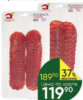
Колбаса МЯСНОЙ ДОМ БОРОДИНА Лацио; Шервудская сырокопченая, 70 г