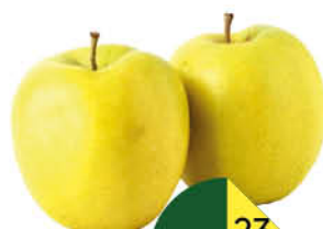
Яблоки Гольден, 1 кг