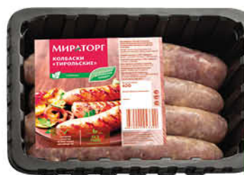
Колбаски МИРАТОРГ Тирольские охлаждённые, 400 г

169 90 18% Цена по карте ЭКОНОМИЯ 139 90