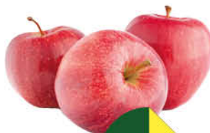
Яблоки Фуджи, 1 кг

139 90 14% ЭКОНОМИЯ Цена по карте 119 90