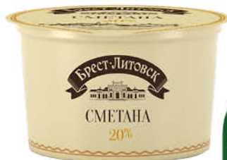
Сметана БРЕСТ-ЛИТОВСК 20%, 180 г