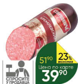
Сервелат СТАРОДВОРЬЕ Кремлевский варено-копченый, 100 г