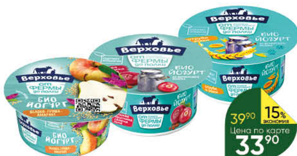
Биоюгurt ВЕРХОВЬЕ в ассортименте 2,9-3,5%, 150 г