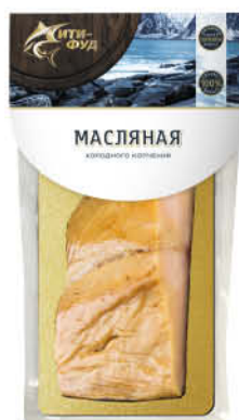
Рыба Масляная СИТИ-ФУД холодного копчения кусок, 200 г