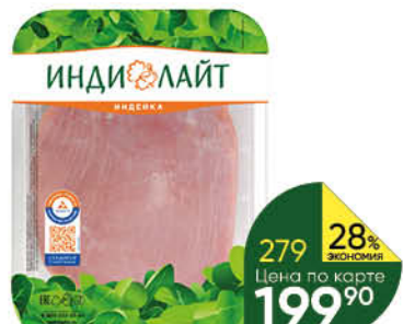
Филе грудки индейки ИНДИЛАЙТ охлажденное, 500 г