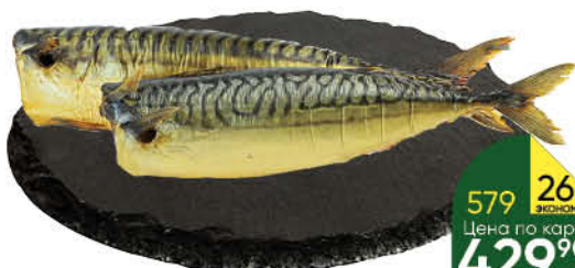
Скумбрия холодного копчения без головы, 1 кг