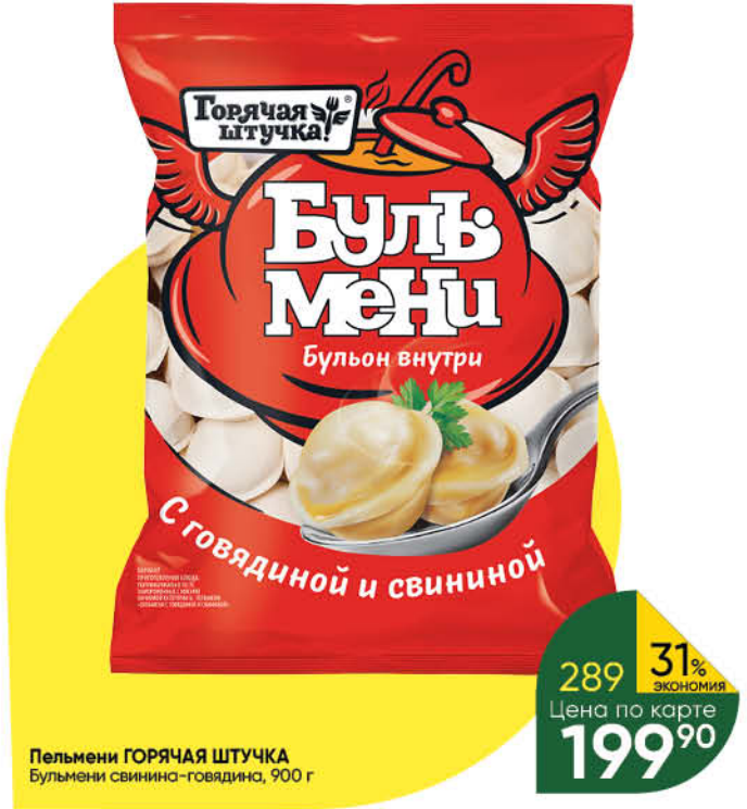
Пельмени ГОРЯЧАЯ ШТУЧКА Булъмеңи свинина-говядина, 900 г