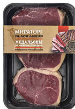
Медальоны МИРАТОРГ Skin из блока говядины охлаждённые, 490 г

159 90 31% Цена по карте ЭКОНОМИЯ 109 90