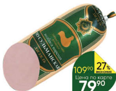
Колбаса ТУРБАСЛИНСКИЙ БРОЙЛЕР Мусульманская Халаль вареная, 400 г