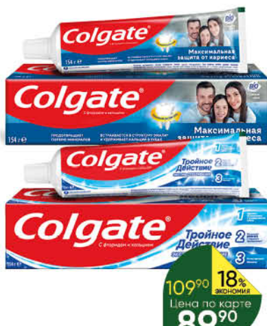
Зубная паста COLGATE в ассортименте, 100 мл