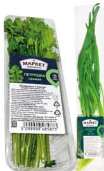
Зелень МАРКЕТ ПЕРЕКРЁСТОК петрушка; лук зелёный, 50 г