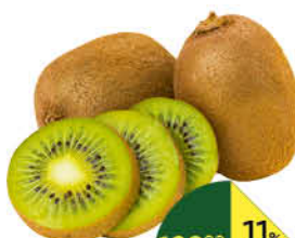
Киви, 1 кг

189 90 11% ЭКОНОМИЯ Цена по карте 169 90