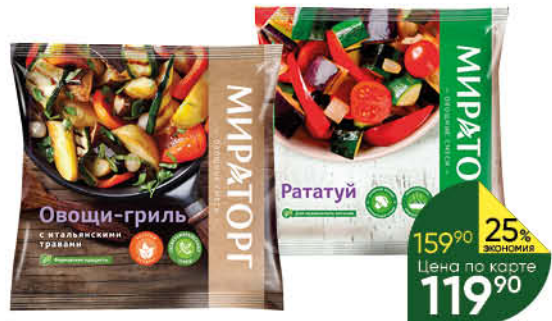
Смесь ВИТАМИН Рататуй; Овощи-гриль с итальянскими травами, 400 г