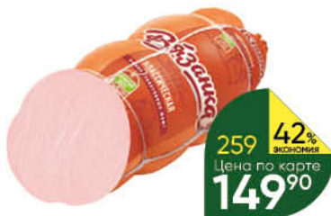
Колбаса ВЯЗАНКА Классическая варёная, 500 г

329 90 30% экономия Цена по карте 229 90