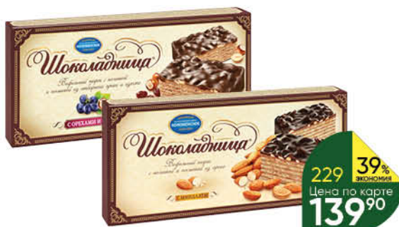
Торт вафельный ШОКОЛАДНИЦА с фундуком; с миндалём; с орехами и изюмом, 270 г