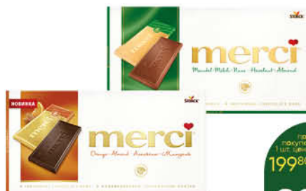
Шоколад MERCI в ассортименте, 100-112 г