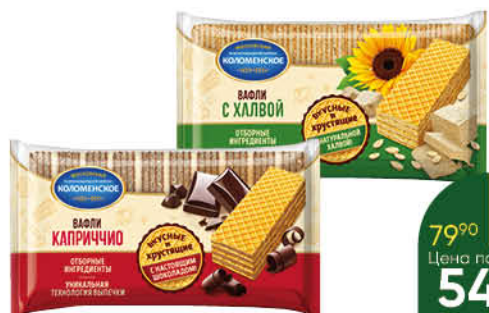
Вафли КОЛОМЕНСКОЕ в ассортименте, 200-220 г