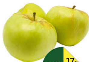
Яблоки Богатырь, 1 кг

129 90 15% ЭКОНОМИЯ Цена по карте 109 90