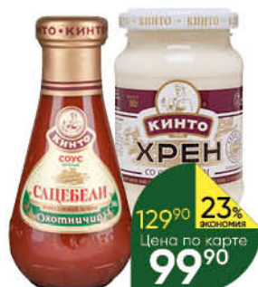
Соус; Хрен КИНТО в ассортименте, 180-310 г

49 35 3 по цене 2 при покупке 1 шт. товара 32 90 *