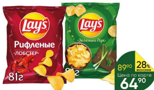
Чипсы LAY'S из натурального картофеля вассортименте, 81 г