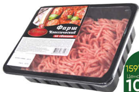
Фарш свиной АТЯШЕВО Классический охлаждённый, 400 г

169 90 18% Цена по карте ЭКОНОМИЯ 139 90