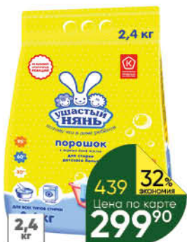
Стиральный порошок УШАСТЫЙ НЯНЬ для детского белья, 2,4 кг