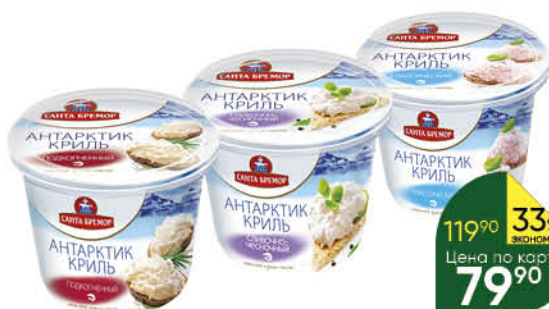
Крем-паста САНТА БРЕМОР Антарктик Криль классический; подкопчённый; сливочно-чесночный, 150 г