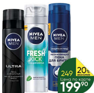
Пена для бритья NIVEA Men в ассортименте, 200 мл