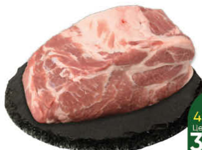
Шейка свиная без кости охлаждённая, 1 кг