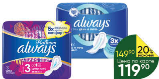
Прокладки гигиенические ALWAYS в ассортименте, 6–10 шт.