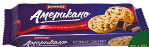
Печенье КУХМАСТЕР Американо сдобное с кусочками шоколада, 270 г