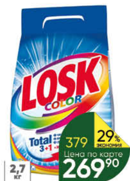
Средство для стирки LOSK Ароматерапия; Горное озеро; Color порошок, 2,7 кг