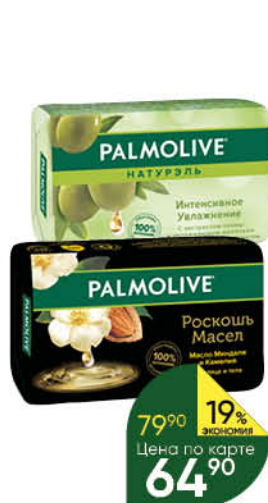
Мыло PALMOLIVE туалетное твердое в ассортименте, 90 г