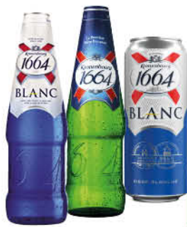
Пиво; Напиток пивной KRONENBOURG 1664 Classic; Blanc светлое 4,5%, 0,45-0,46 л (Россия)