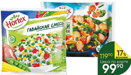
Смесь овощная HORTEX Гавайская; Овощи для жарки с картофелем обжаренным, 400 г