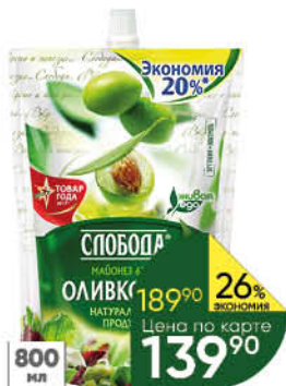
Майонез СЛОБОДА Оливковый, 800 мл