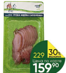
Грудка индейки ЗЕЛЕНАЯ ЛИНИЯ сырвяляная, 100 г

Товар представлен не во всех супермаркетах «Перекресток». Изображения товаров в каталоге могут незначительно отличаться от представленных в супермаркете «Перекресток». Цены указаны в рублях с учётом всех скидок за единицу товара и действуют с 9:00 первого дня акции. Дополнительная скидка на товар, указанный в каталоге, не распространяется. В течение проведения промоакции цена может быть дополнительно снижена относительно заявленной в рекламе. Товары, подлежащие обязательной сертификации или иному обязательному подтверждению соответствия требованиям технических регламентов, имеют необходимые подтверждающие документы. Не является публичной офертой. Количество товара ограничено. Цены действительны с 15 по 21 марта 2022 года.