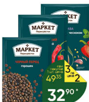
Приправы; Специи МАРКЕТ ПЕРЕКРЁСТОК в ассортименте, 5-28 г

49 35 3 по цене 2 при покупке 1 шт. товара 32 90 *