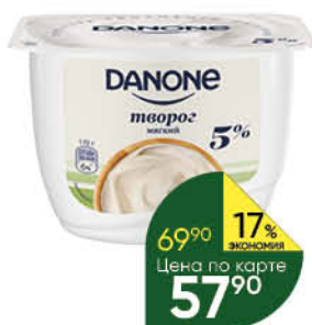
Творог DANONE мягкий 5%, 170 г