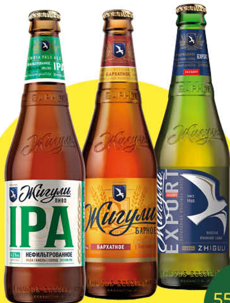
Пиво ЖИГУЛИ Барное в ассортименте 4,5-4,9%, 0,45 л (Россия)