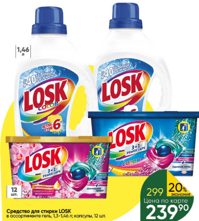
Средство для стирки LOSK в ассортименте гель, 1,3–1,46 л; капсулы, 12 шт.