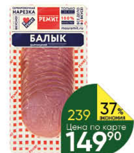
Мясные деликатесы РЕМИТ Балык Дарницкий сырокопченый, 150 г