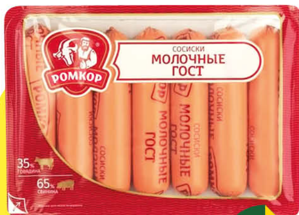
Сосиски POMKOR Молочные, 350 г