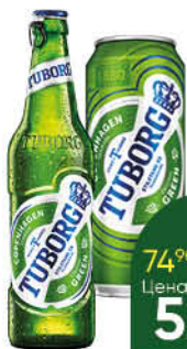
Пиво TUBORG Green светлое 4,6%, 0,45-0,48 л (Россия)