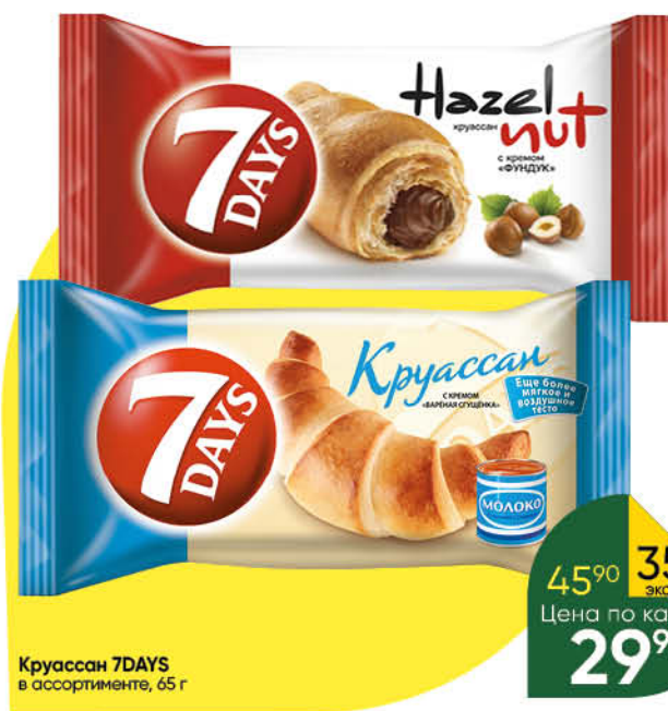
Круассан 7DAYS в ассортименте, 65 г