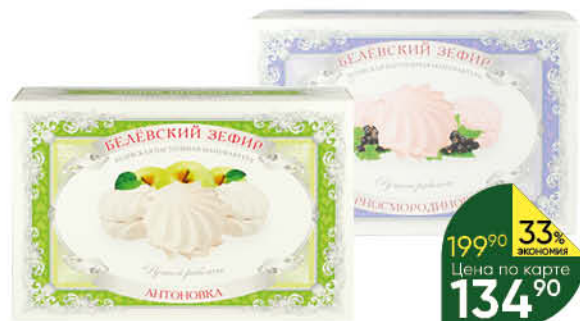
Зефир БЕЛЁВСКАЯ ПАСТИЛЬНАЯ МАНУФАКТУРА Антоновка; Зефирное детство; Черносмородиновый, 250 г

199 90 33% экономия Цена по карте 134 90