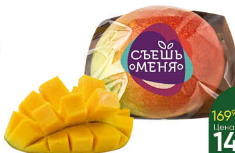
Манго спелый плод, 1 шт.

169 90 12% ЭКОНОМИЯ Цена по карте 149 90