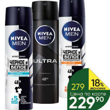
Антиперспирант NIVEA в ассортименте спрей, 150 мл

199 90 15% экономия Цена по карте 169 90