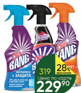
Чистящее средство CILLIT BANG в ассортименте, 750 мл