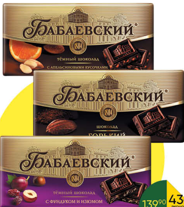
Шоколад БАБАЕВСКИЙ в ассортименте, 100 г