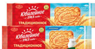
Печенье ЮБИЛЕЙНОЕ традиционное; молочное, 112 г