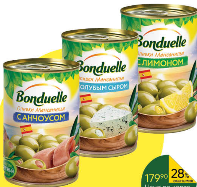
Маслины; Оливки BONDUELLE в ассортименте, 300 г

179 90 28% ЭКОНОМИЯ Цена по карте 129 90