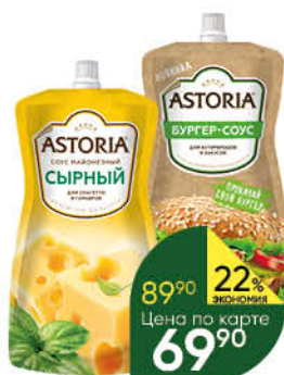
Соус майонезный ASTORIA в ассортименте 20-42%, 200-233 г

129 90 15% ЭКОНОМИЯ Цена по карте 109 90