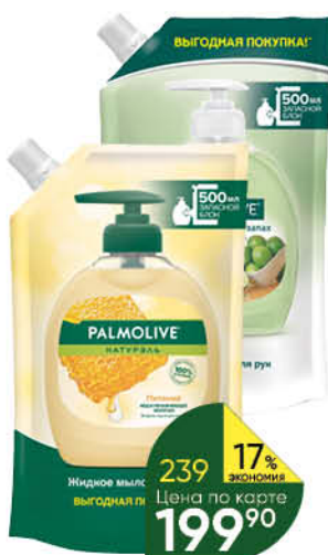
Мыло жидкое для рук PALMOLIVE. Натуральное питание; интенсивное увлажнение; нейтрализующее запах, 500 мл