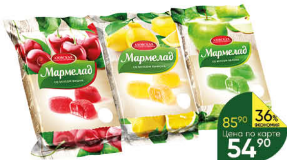
Мармелад АЗОВСКАЯ КФ в ассортименте, 300 г