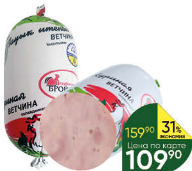
Ветчина куриная ТУРБАСЛИНСКИЙ БРОЙЛЕР Халаль, 400 г

299 90 23% Экономия Цена по карте 229 90