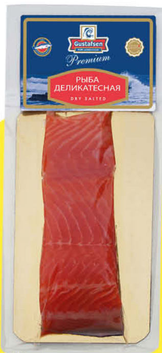
Форель GUSTAFSEN слабосоленая филе-кусоч, 180 г