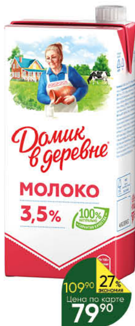
Молоко ДОМИК В ДЕРЕВНЕ 3,5%, 950 г