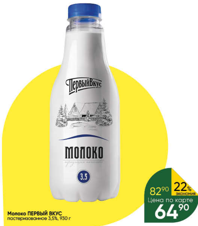
Молоко ПЕРВЫЙ ВКУС пастеризованное 3,5%, 930 г