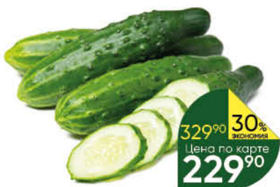
Огурцы ТСХ тепличные, 1 кг

329 90 30% экономия Цена по карте 229 90