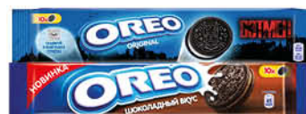
Печенье OREO с какао и начинкой с ванильным; клубничным; шоколадным вкусом, 95 г