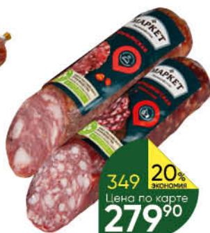
Колбаса МАРКЕТ ПЕРЕКРЕСТОК Брауншвейгская; Итальянская сырокопченая, 300 г