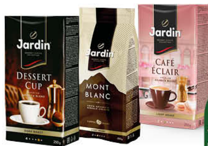
Кофе JARDIN в ассортименте молотый; в зёрнах, 250 г