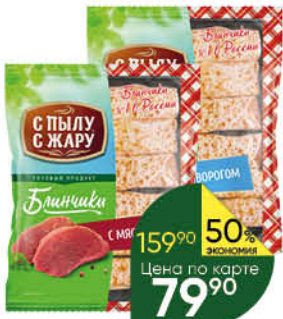
Блинчики С ПЫЛУ С ЖАРУ с мясом; с творогом, 360 г