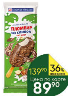
Мороженое БАШКИРСКИЙ ХОЛОД Пломбир из сливок эскимо 15%, 60 г