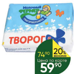
Творог МОЛОЧНЫЙ ФЕРМЕР 5%, 200 г