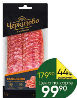
Колбаса ЧЕРКИЗОВО Сальчиchon сырокопченая нарезка, 100 г