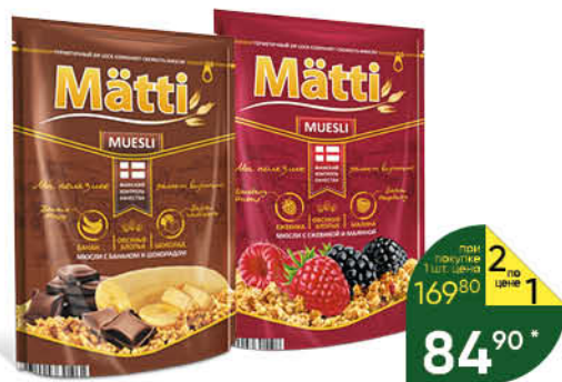
Мюсли МАТТИ с бананом и шоколадом; с ежевикой и малиной; с орехом и яблоком, 250 г