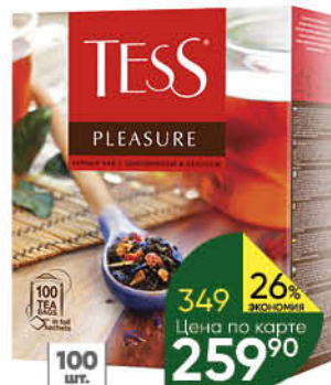
Чай TESS в ассортименте, 100 x 1,5-1,8 г

159 90 19% ЭКОНОМИЯ Цена по карте 129 90