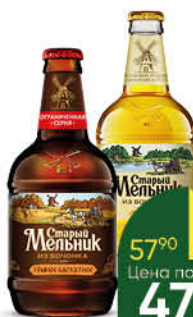
Пиво СТАРЫЙ МЕЛЬНИК Из Бочонка в ассортименте 4,2-4,3%, 0,45 л (Россия)