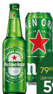
Пиво HEINEKEN светлое 4,8%, 0,43-0,47 л (Россия)