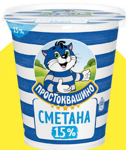
Сметана ПРОСТОКВАШИНО 15%, 300 г