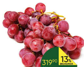
Виноград красный Ред Глоб, 1 кг

189 90 11% ЭКОНОМИЯ Цена по карте 169 90