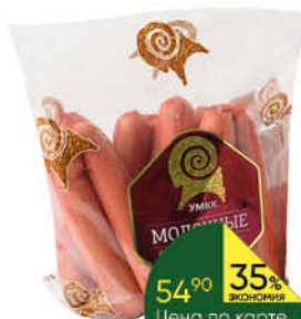
Сосиски УМКК Молочные, 100 г