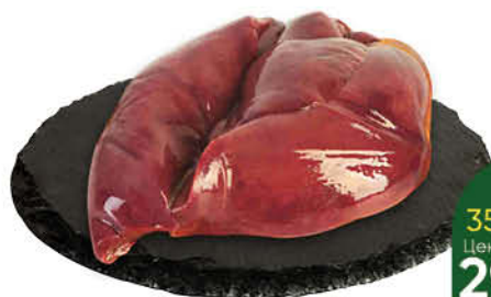
Печень говяжья охлаждённая, 1 кг