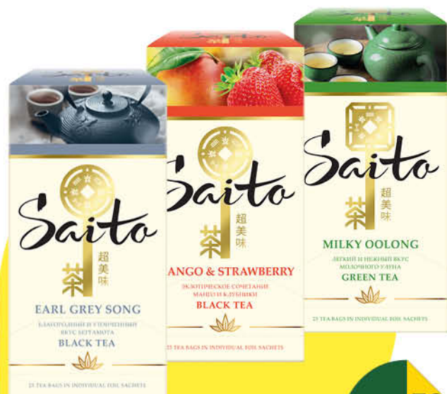
Чай SAITO в ассортименте, 25 x 1,3-1,7 г