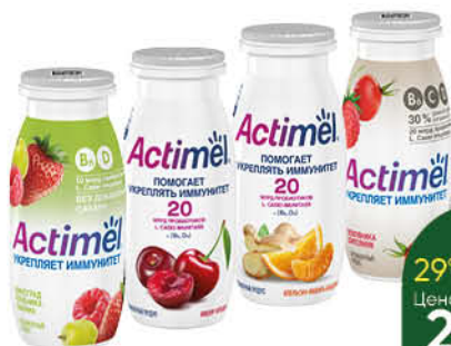
Напиток кисломолочный DANONE Actimel в ассортименте 2,2-2,5%, 95-100 г