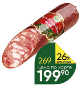
Сервелат ЧЕЛНЫ-МЯСО Татарское трио полукопченый, 380 г