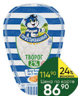
Творог ПРОСТОКВАШИНО 2%, 200 г