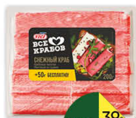
Крабовые палочки VICI Снежный краб, 200 г

179 90 17% ЭКОНОМИЯ Цена по карте 149 90