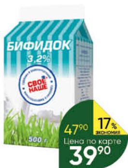
Кефир Бифидок СВОЁ-НАШЕ обогатённый 3,2%, 500 г