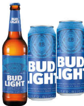
Пиво BUD Light светлое пастеризованное 4,1%, 0,44-0,45 л (Россия)