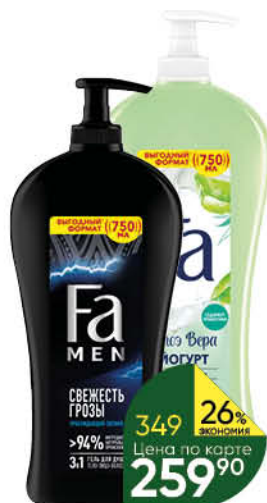
Гель; Гель-пена для душа FA в ассортименте, 750 мл

154 90 16% экономия Цена по карте 129 90