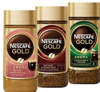
Кофе NESCAFÉ Gold Aroma Intenso растворимый с молотым; Gold Crema нежная пенка; Gold растворимый, 85-95 г