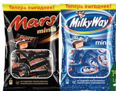
Шоколадный батончик SNICKERS; MARS; TWIX; MILKY WAY minis, 176-184 г

169 90 29% ЭКОНОМИЯ Цена по карте 119 90