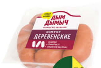
Шпикачки ДЫМ ДЫМЫЧ Деревенские, 100 г

159 90 31% Экономия Цена по карте 109 90