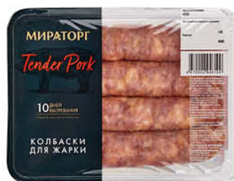
Колбаски свиные МИРАТОРГ для жарки охлаждённые, 400 г