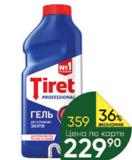
Гель TIRET Professional для устранения и профилактики засоров в трубах, 500 мл