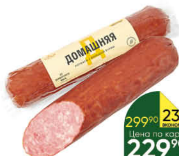
Колбаса САВА Домашняя варёно-копчёная, 350 г

194 90 28% Экономия Цена по карте 139 90