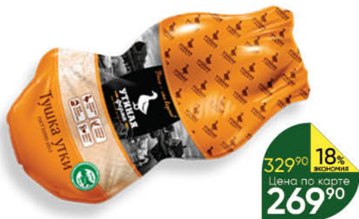
Тушка утки УТИНИНАЯ ФЕРМА охлажденная, 1 кг