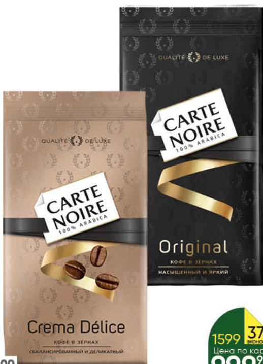
Кофе CARTE NOIRE Original; Crema Delice в зёрнах, 800 г

800 г 1599 37% ЭКОНОМИИ Цена по карте 999 90