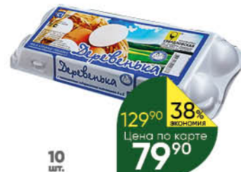
Яйцо куриное ДЕРЕВЕНКА С1, 10 шт.

189 90 26% ЭКОНОМИЯ Цена по карте 139 90