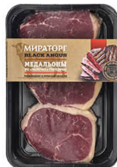
Медальоны МИРАТОРГ Skin из яблока говядины охлажденные, 490 г