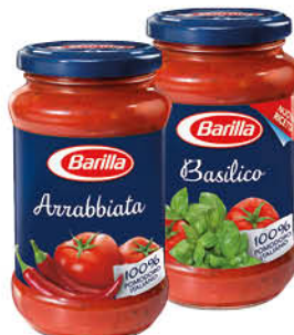
Соус томатный BARILLA Basilico с базиликом; Arrabbiata с перцем чили; Napoletana с овощами, 400 г