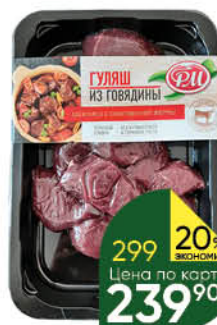
Гуляш РОДНЫЕ МЕСТА из говядины охлажденный, 400 г

184 90 24% ЭКОНОМИЯ Цена по карте 139 90