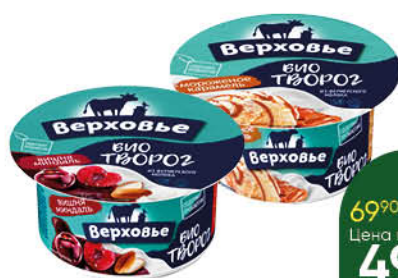
Бийотворог ВЕРХОВЬЕ в ассортименте 4,2%, 140 г