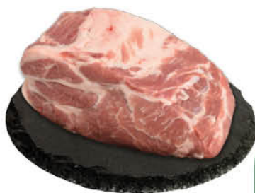
Шейка свиная без кости охлажденная, 1 кг