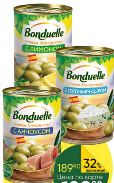
Маслины; Оливки BONDUELLE в ассортименте, 300 г; 314 мл

189 90 32% экономия Цена по карте 129 90