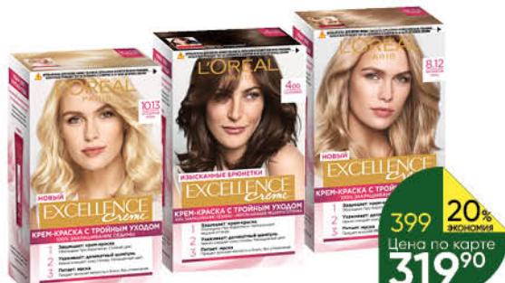
Крем-краска для волос L'OREAL PARIS Excellence Creme в ассортименте, 1 уп.