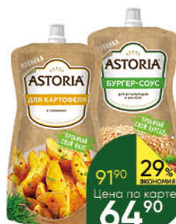
Соус майонезный ASTORIA в ассортименте 20-42%, 200-233 г

при покупке 3 шт. Цена 49 35 3 по цене 2 32 90