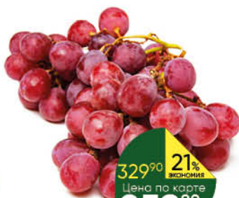
Виноград красный Ред Глоб, 1 кг

329 90 21% Цена по карте ЭКОНОМИЯ 259 90