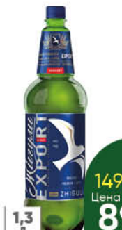
Пиво ЖИГУЛИ Барное Экспорт светлое 4,8%, 1,3 л (Россия)