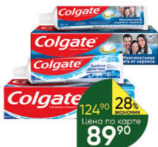
Зубная паста COLGATE в ассортименте, 100 мл