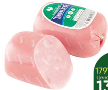
Ветчина ЧЕРКИЗОВО из индейки, 400 г

179 90 22% ЭКОНОМИЯ Цена по карте 139 90