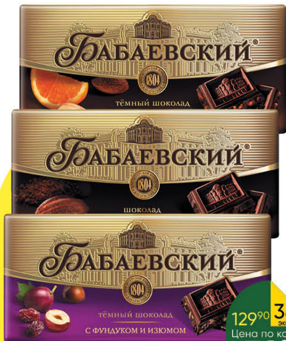
Шоколад БАБАЕВСКИЙ в ассортименте, 100 г