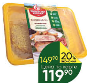
Кордон блю ПАРВЛОВСКАЯ КУРОЧКА с сыром и ветчиной охлажденный, 400 г