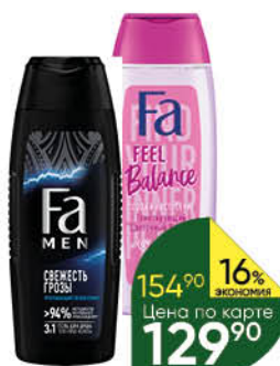
Гель для душа FA в ассортименте, 250 мл