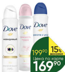
Антиперспирант DOVE в ассортименте, 150 мл

259 90 23% Экономия Цена по карте 199 90