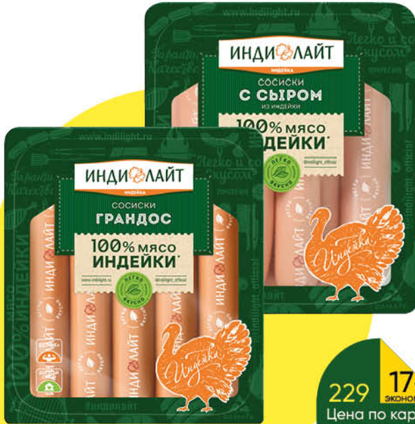
Сосиски ИНДИЛАЙТ Грандос; С сыром из индейки варёные, 440 г