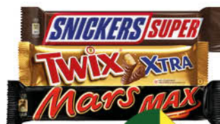
Шоколадный батончик MARS; SNICKERS; TWIX в ассортименте, 81-95 г