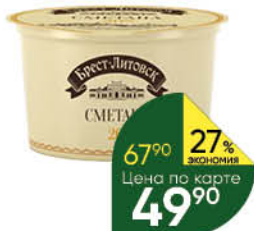
Сметана БРЕСТ-ЛИТОВСК 20%, 180 г