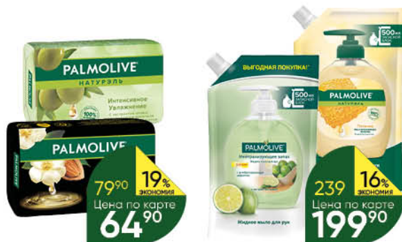
Мыло PALMOLIVE туалетное твердое в ассортименте, 90 г