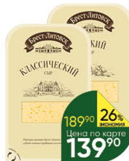
Сыр БРЕСТ-ЛИТОВСК Лёгкий 35%; Классический 45%, 150 г

189 90 26% ЭКОНОМИЯ Цена по карте 139 90