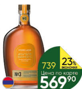
Коньяк STONE LAND Armenian №3 3 года 40%, 0,5 л (Армения)