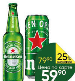
Пиво HEINEKEN светлое 4,8%, 0,43-0,47 л (Россия)