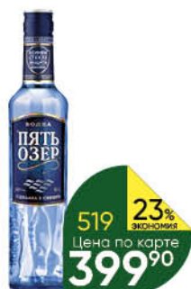
Водка ПЯТЬ ОЗЁР 40%, 0,7 л (Россия)