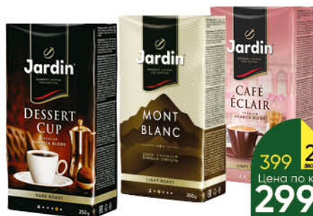
Кофе JARDIN в ассортименте молотый; в зёрнах, 250 г