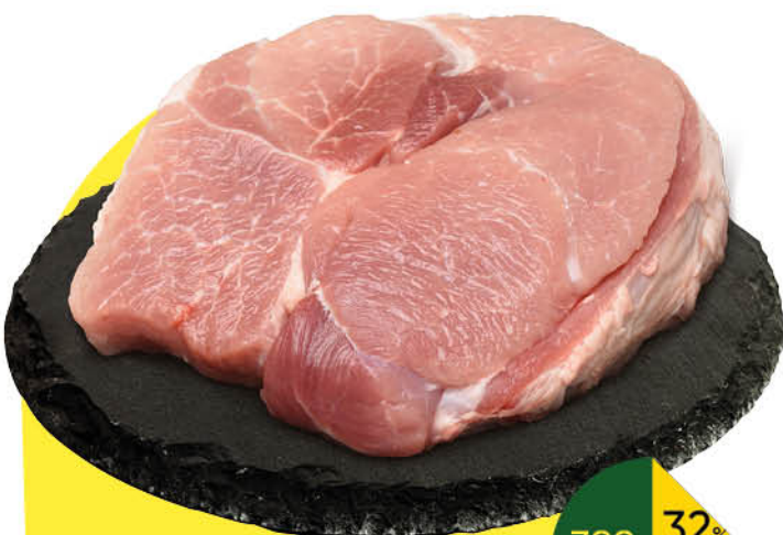
Свинина духовая охлажденная, 1 кг