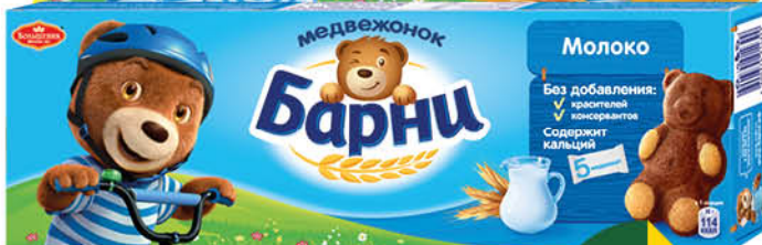
Пирожное МЕДВЕЖОНОК БАРУНИ бисквитное в ассортименте, 150 г