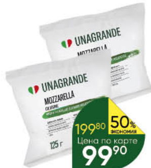
Сыр UNAGRANDE Mozzarella Ciliegine 50%, 225 г

159 90 19% ЭКОНОМИЯ Цена по карте 129 90