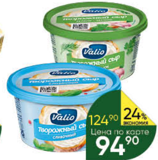
Сыр творожный VALIO с оливками-розмарином; с укропом-чесноком- петрушкой; сливочный 66-70%, 150 г