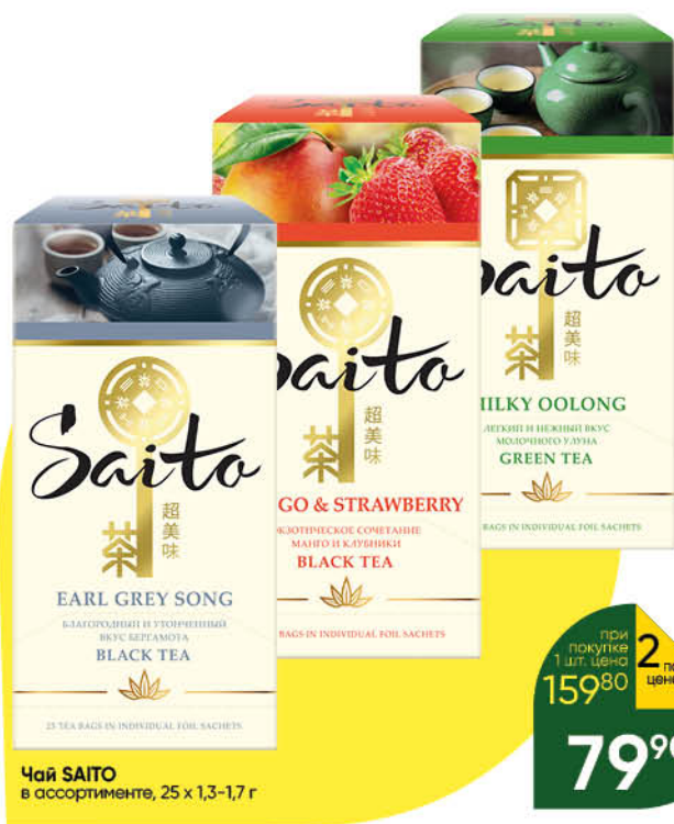
Чай SAITO в ассортименте, 25 x 1,3-1,7 г

при покупке 1 шт. цена 159 80 2 по цене 1 79 90*