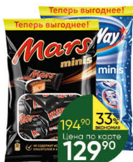
Шоколадный батончик SNICKERS; MARS; TWIX; MILKY WAY minis, 176-184 г

Теперь выгоднее! 194 90 33% ЭКОНОМИЯ Цена по карте 129 90