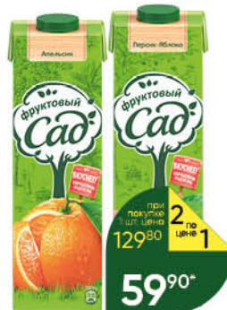
Сок; Нектар; Морс ФРУКТОВЫЙ САД в ассортименте, 0,95 л

при покупке 1 шт. цена 149 90 2 по цене 1 99 90 *