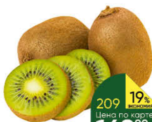
Киви, 1 кг

169 90 18% Цена по карте ЭКОНОМИЯ 139 90