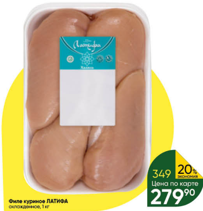
Филе куриное ЛАТИФА охлажденное, 1 кг