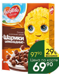
Сухой завтрак ЛЮБЯТОВО шарики шоколадные, 250 г