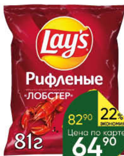
Чипсы LAY'S из натурального картофеля вассортименте, 81 г