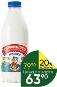
Молоко САРАФАНОВО пастеризованное 2,5%, 930 мл