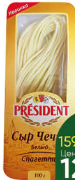
Сыр PRESIDENT Чечил белый спагетти 35%, 100 г

159 90 19% ЭКОНОМИЯ Цена по карте 129 90