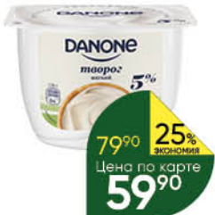
Творог DANONE мягкий 5%, 170 г