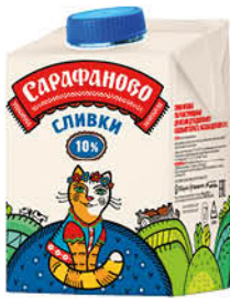
Сливки САРАФАНОВО ультрапастеризованные 10%, 480 мл