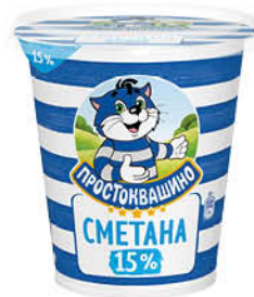
Сметана ПРОСТОКВАШИНО 15%, 300 г