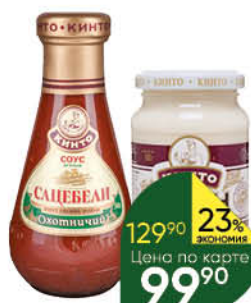
Соус; Хрен КИНТО в ассортименте, 180-310 г

159 90 19% экономия Цена по карте 129 90