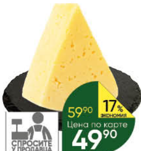
Сыр Российский 45%, 100 г