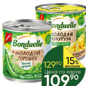
Консервы овощные BONDUELLE горошек зелёный молодой, 400 г; кукуруза молодая сладкая, 425 мл

129 90 15% экономия Цена по карте 109 90