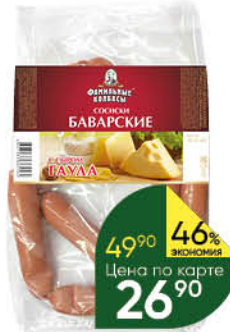
Сосиски ФАМИЛЬНЫЕ КОЛБАСЫ Баварские с сыром, 100 г