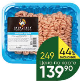
Фарш ПАВА ПАВА Нежный из мяса индейки охлажденный, 500 г