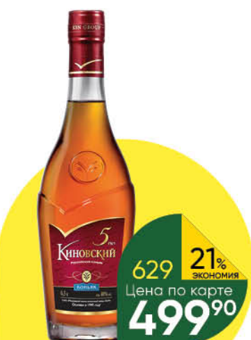
Коньяк КИНОВСКИЙ 5 лет 40%, 0,5 л (Россия)