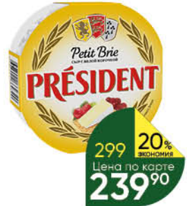
Сыр PRESIDENT Petit Brie мягкий с белой плесенью 60%, 125 г