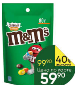
Драже M&M'S 80 г

158 90 25% ЭКОНОМИЯ Цена по карте 119 90