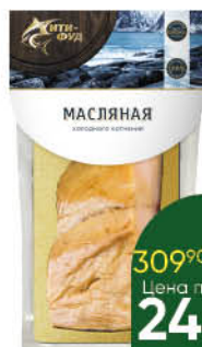
Рыба Масляная СИТИ-ФУД холодного копчения кусок, 200 г

309 90 19% Цена по карте 249 90 ЭКОНОМИЯ