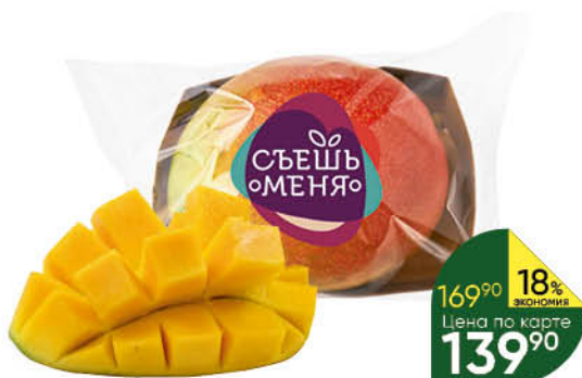
Манго спелый плод, 1 шт.

169 90 18% Цена по карте ЭКОНОМИЯ 139 90