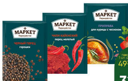
Приправы; Специи МАРКЕТ ПЕРЕКРЁСТОК в ассортименте, 5-28 г

189 90 32% экономия Цена по карте 129 90