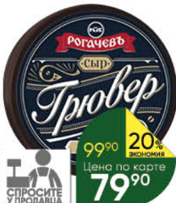
Сыр РОГАЧЁВЪ Трювер особый 45%, 100 г