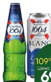
Пиво; Напиток пивной KRONENBOURG 1664 Classic; Blanc светлое 4,5%, 0,45-0,46 л (Россия)