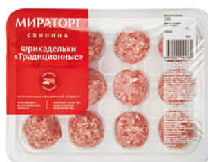
Фрикадельки МИРАТОРГ Традиционные охлажденные, 240 г