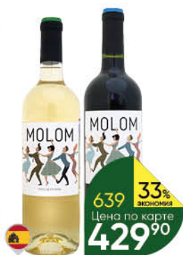
Вино MOLOM Blanco белое сухое; Tinto красное сухое 11-12%, 0,75 л (Испания)

ЧРЕЗМЕРНОЕ УПОТРЕБЛЕНИЕ АЛКОГОЛЯ ВРЕДИТ ВАШЕМУ ЗДОРОВЬЮ 18+