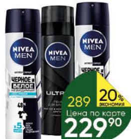
Антиперспирант NIVEA в ассортименте спрей, 150 мл

199 90 15% Экономия Цена по карте 169 90