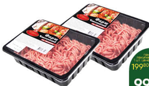
Фарш свиной АТЯШЕВО Классический охлажденный, 400 г