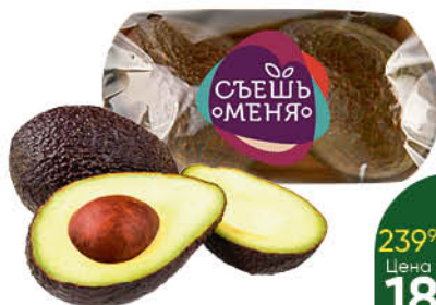
Авокадо READY TO EAT Hass, 1 уп.

329 90 21% Цена по карте ЭКОНОМИЯ 259 90