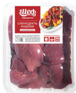
Печень индейки ШЕФ ПЕРЕКРЕСТОК охлажденная, 500 г