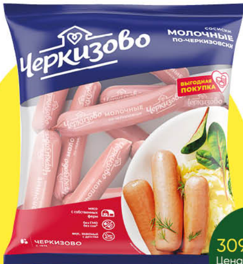
Сосиски ЧЕРКИЗОВО по-Черкизовски, 650 г

179 90 22% ЭКОНОМИЯ Цена по карте 139 90