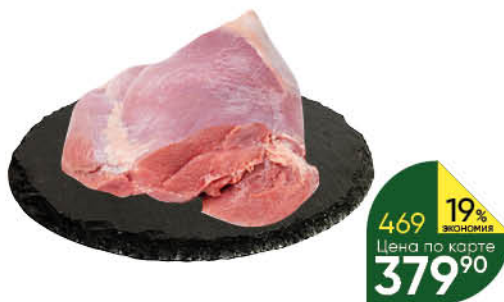
Филе бедра индейки охлажденное, 1 кг

Товар представлен не во всех супермаркетах «Перекрёсток». Изображения товаров в каталоге могут незначительно отличаться от представленных в супермаркете «Перекрёсток». Цены указаны в рублях с учётом всех скидок за единицу товара и действуют с 9:00 первого дня акции. Дополнительная скидка на товар, указанный в каталоге, не распространяется. В течение проведения промоакции цена может быть дополнительно снижена относительно заявленной в рекламе. Товары, подлежащие обязательной сертификации или иному обязательному подтверждению соответствия требованиям технических регламентов, имеют необходимые подтверждающие документы. Не является публичной офертой. Количество товара ограничено. Цены действительны с 15 по 21 марта 2022 года.