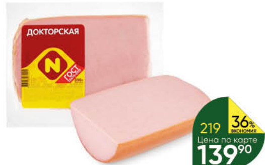
Колбаса ОСТАНКИНО Докторская ГОСТ вареная, 350 г