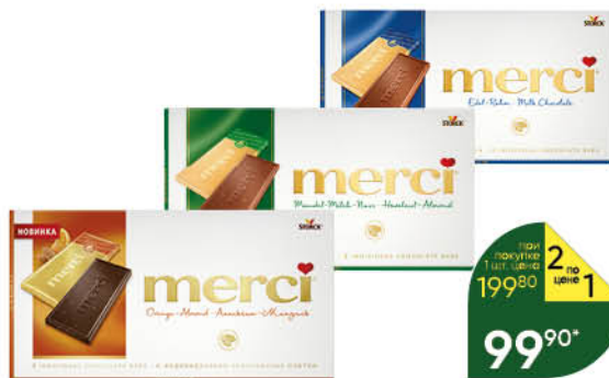
Шоколад MERCI в ассортименте, 100-112 г

при покупке 1 шт. - 1 рубль 199 80 2 по цене 1 99 90