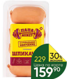
Шпикачки ПАПА МОЖЕТ Сочные, 400 г