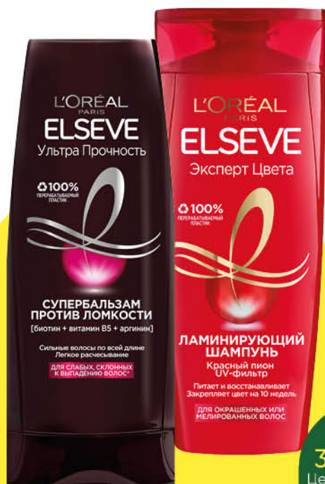
Средство для волос L'OREAL PARIS Elseve Шампунь; Бальзам-уход; Маска в ассортименте, 150-400 мл