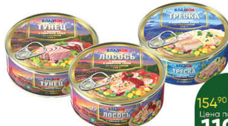
Консервы рыбные с овощами ВЛАДКОН Треска по-норвежски в сливочном соусе; Тунец по-гавайски; Лосось по-итальянски в томатном соусе, 240 г

129 90 15% экономия Цена по карте 109 90