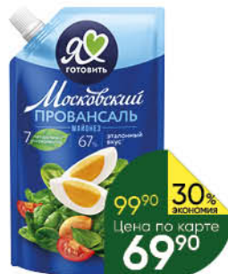
Майонез МОСКОВСКИЙ ПРОВАНСАЛЬ классический 67%, 390 мл