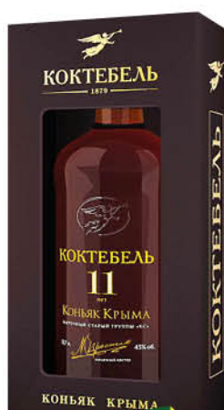
Коньяк КОКТЕБЕЛЬ 11 КС старый 40%, 0,7 л (Россия)