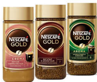
Кофе NESCAFÉ Gold Aroma Intenso растворимый с молотым; Gold Crema нежная пенка; Gold растворимый, 85-95 г

100 шт. 339 23% ЭКОНОМИИ Цена по карте 259 90