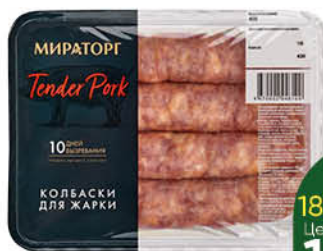
Колбаски свиные МИРАТОРГ для жарки охлажденные, 400 г

184 90 24% ЭКОНОМИЯ Цена по карте 139 90