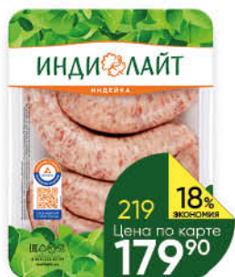
Купаты ИНДИЛАЙТ Боярские охлажденные, 500 г