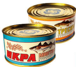
Икра СРК минтая; трески пробойная солёная деликатесная, 130 г