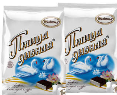
Конфеты шоколадные АККОНД Птица дивная, 300 г

при покупке 1 шт. - 1 рубль 199 80 2 по цене 1 99 90