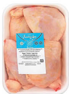
Бедро куриное ЛАТИФА охлажденное, 1 кг