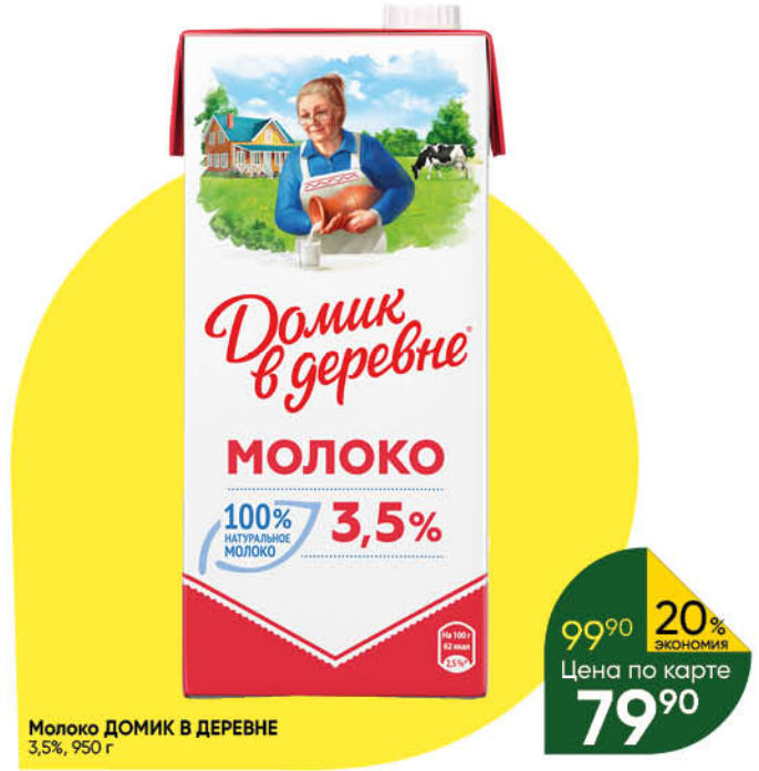
Молоко ДОМИК В ДЕРЕВНЕ 3,5%, 950 г