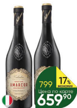
Вино COLLEZIONE COSTANTINO Organic Amarcor, Salento Rosso Passito красное полусухое 14-14,5%, 0,75 л (Италия)