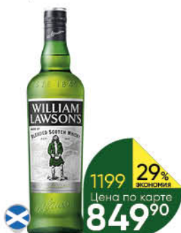
Виски WILLIAM LAWSON'S Ecological KV 7 лет выдержанный 40%, 0,7 л (Шотландия)