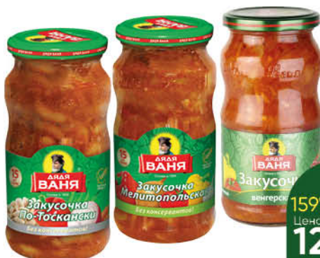
Консервы овощные ДЯДЯ ВАНЯ Закусочка Мелитопольская; Тосканская; Венгерская, 460 г

159 90 19% экономия Цена по карте 129 90