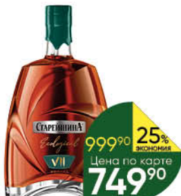
Коньяк СТАРЕЙШИНА Ecological KV 7 лет выдержанный 40%, 0,5 л (Россия)