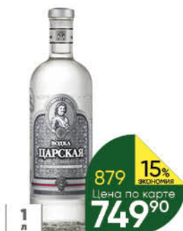
Водка ЛАДОГА Царская 40%, 1 л (Россия)