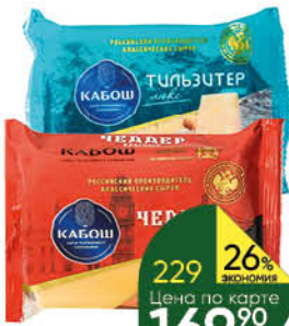
Сыр КАБОШ Тильзитер; Чеддер 47-49%, 200 г