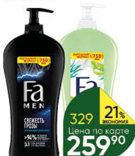
Гель; Гель-пена для душа FA в ассортименте, 750 мл

154 90 16% Экономия Цена по карте 129 90