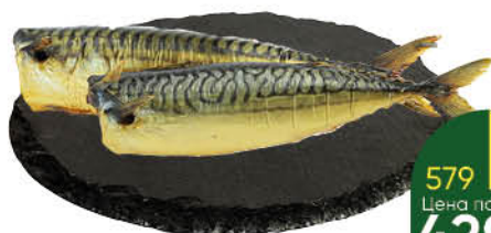
Скумбрия холодного копчения без головы, 1 кг

309 90 19% Цена по карте 249 90 ЭКОНОМИЯ