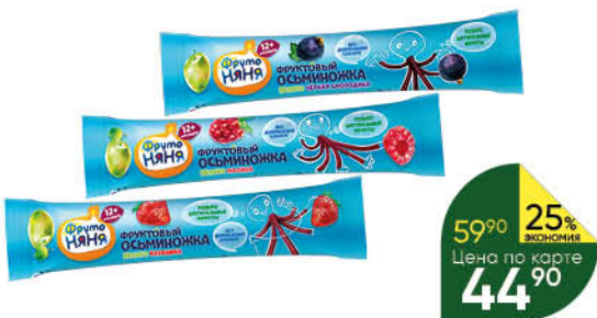
Фруктовые кусочки ФРУТОНЯ яблоко-клубника; яблоко-малина; яблоко-чёрная смородина, 16 г