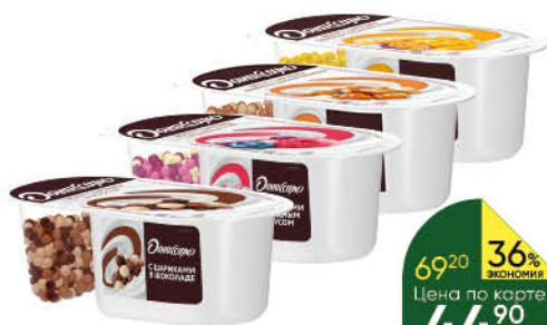
Йогурт ДАНИССИМО Фантазия с хрустящими шариками в ассортименте 6,9%, 105 г