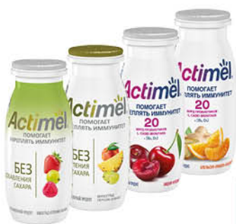
Напиток кисломолочный DANONE Actimel в ассортименте 2,2-2,5%, 95-100 г