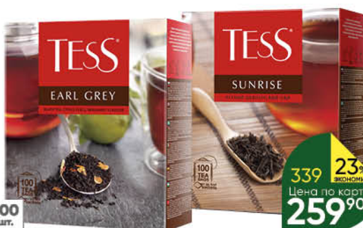
Чай TESS в ассортименте, 100 x 1,5-1,8 г

164 90 21% ЭКОНОМИИ Цена по карте 129 90