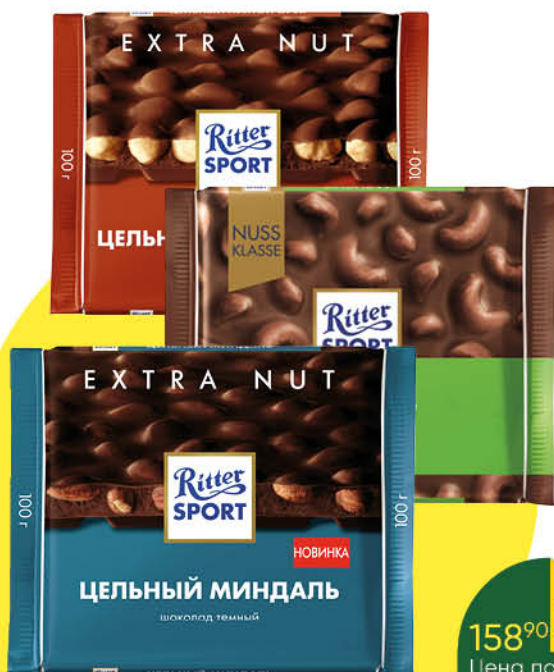
Шоколад RITTER SPORT в ассортименте, 100 г

158 90 25% ЭКОНОМИЯ Цена по карте 119 90