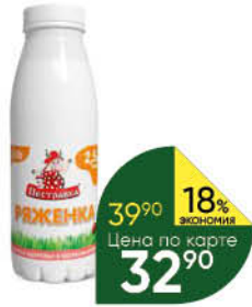
Ряженка ПЕСТРАВКА 2,5%, 310 г