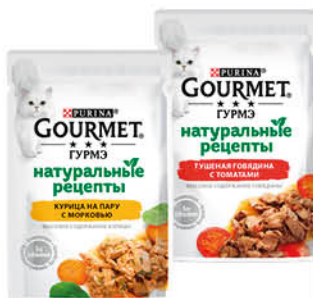
Корм для кошек PURINA Gourmet консервы в ассортименте, 75 г