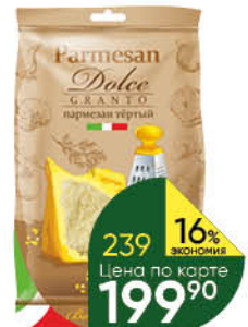
Сыр DOLCE GRANTO Parmesan тёртый 40%, 150 г