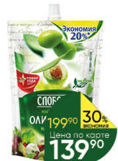
Майонез СЛОБОДА Оливковый, 800 мл

Товар представлен не во всех супермаркетах «Перекрёсток». Изображения товаров в каталоге могут незначительно отличаться от представленных в супермаркете «Перекрёсток». Цены указаны в рублях с учётом всех скидок за единицу товара и действуют с 9:00 первого дня акции. Дополнительная скидка на товар, указанный в каталоге, не распространяется. В течение проведения промоакции цена может быть дополнительно снижена относительно заявленной в рекламе. Товары, подлежащие обязательной сертификации или иному обязательному подтверждению соответствия требованиям технических регламентов, имеют необходимые подтверждающие документы. Не является публичной офертой. Количество товара ограничено. Цены действительны с 15 по 21 марта 2022 года.