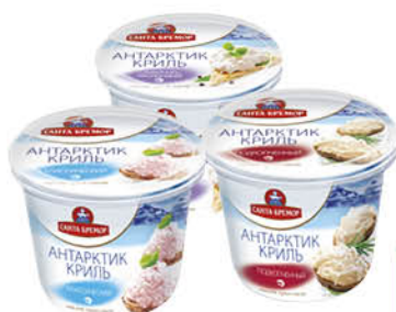
Крем-паста САНТА БРЕМОР Антарктик Криль классический; подкопчённый; сливочно-чесночный, 150 г