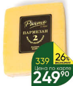
Сыр PARME Пармезан 43%, 200 г