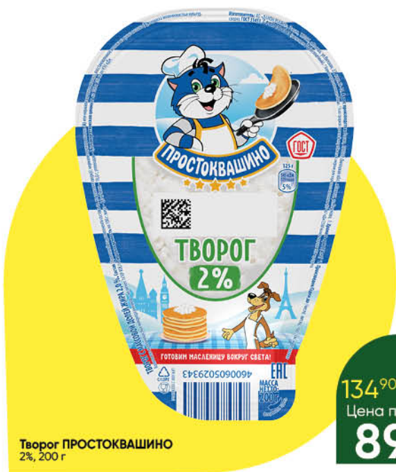
Творог ПРОСТОКВАШИНО 2%, 200 г