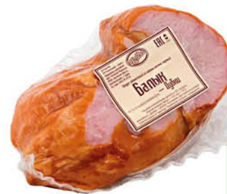
Балкы свиной ДУБКИ копчено-вареный, 100 г