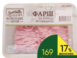
Фарш куриный МИРАТОРГ охлажденный, 400 г