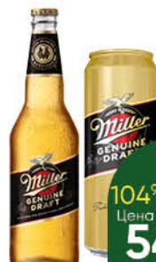
Напиток пивной MILLER Genuine Draft светлый 4,7%, 0,43-0,47 л (Россия)