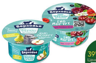
Бийогурт ВЕРХОВЬЕ в ассортименте 2,9-3,5%, 150 г