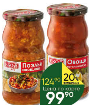
Консервы овощные ЕКО в ассортименте, 480-500 г

144 90 24% экономия Цена по карте 109 90