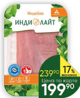
Филе грудки индейки ИНДИЛАЙТ охлажденное, 500 г