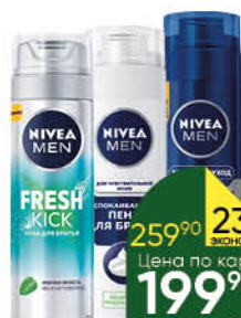
Пена для бритья NIVEA Men в ассортименте, 200 мл

259 90 23% Экономия Цена по карте 199 90