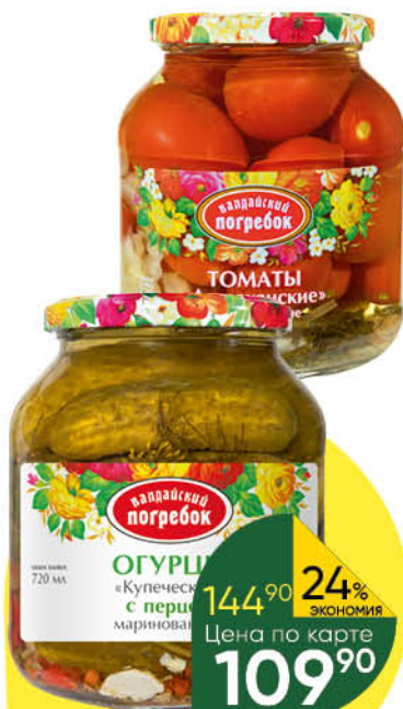
Консервы овощные ВАЛДАЙСКИЙ ПОГРЕБОК огурцы Купеческие; томаты Астраханские маринованные; томаты Кубанские неочищенные в томатном соке, 650-660 г; 720 мл

144 90 24% экономия Цена по карте 109 90