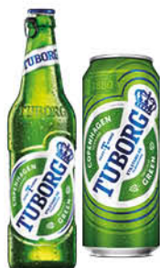
Пиво TUBORG Green светлое 4,6%, 0,45-0,48 л (Россия)