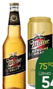
Напиток пивной MILLER Genuine Draft светлый 4,7%, 0,43-0,47 л (Россия)