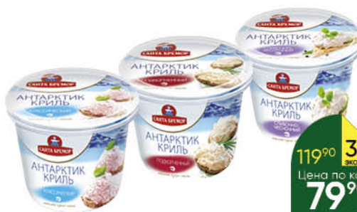
Крем-паста САНТА БРЕМОР Антарктик Криль классический; подкопчённый; сливочно-чесночный, 150 г