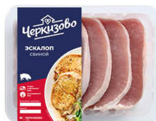
Эскалоп ЧЕРКИЗОВО свиной охлаждённый, 500 г

184 90 Цена по карте 129 90 30% ЭКОНОМИЯ