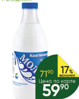
Молоко КНЯГИНИНО 2,5%, 930 г ТОЛЬКО ДЛЯ СУПЕРМАРКЕТОВ Г. ИВАНОВО