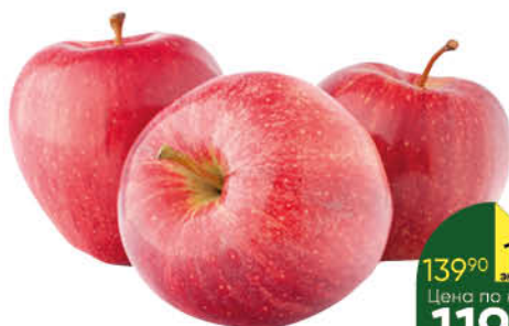
Яблоки Фуджи, 1 кг

139 90 14% Цена по карте ЭКОНОМИЯ 119 90