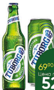
Пиво TUBORG Green светлое 4,6%, 0,45-0,48 л (Россия)