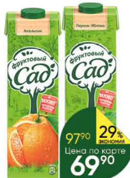
Сок; Нектар; Морс ФРУКТОВЫЙ САД в ассортименте, 0,95 л