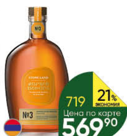
Коньяк STONE LAND Armenian №3 3 года 40%, 0,5 л (Армения)