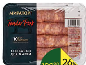
Колбаски МИРАТОРГ свино-говяжьи для жарки охлаждённые, 400 г

189 90 Цена по карте 139 90 26% ЭКОНОМИЯ