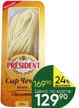
Сыр PRESIDENT Чеддер белый спагетти 35%, 100 г

169 90 24% ЭКОНОМИЯ Цена по карте 129 90