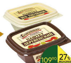
Паштет ЕГОРЬЕВСКАЯ Из печени; Деревенский из печени, 150 г