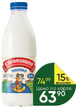
Молоко САРАФАНОВО пастеризованное 2,5%, 930 мл