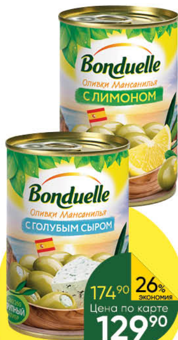
Маслины; Оливки BONDUELLE в ассортименте, 300 г

174 90 26% ЭКОНОМИЯ Цена по карте 129 90