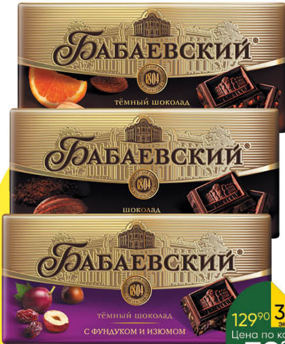
Шоколад БАБАЕВСКИЙ в ассортименте, 100 г