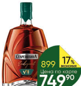
Коньяк СТАРЕЙШИНА Ecological KV 7 лет выдержанный 40%, 0,5 л (Россия)