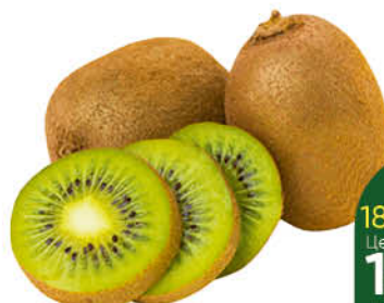
Киви, 1 кг

189 90 11% Цена по карте ЭКОНОМИЯ 169 90