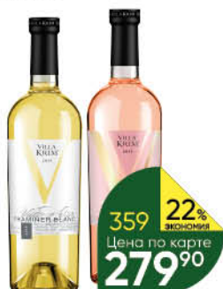
Вино VILLA KRIM в ассортименте 11-12%, 0,75 л (Россия)