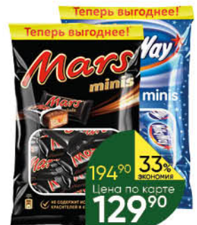
Шоколадный батончик SNICKERS; MARS; TWIX; MILKY WAY minis, 176-184 г

194 90 33% ЭКОНОМИЯ Цена по карте 129 90