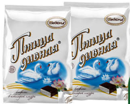
Конфеты шоколадные АККОНД Птица дивная, 300 г

184 90 41% ЭКОНОМИЯ Цена по карте 109 90