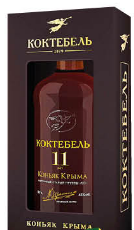
Коньяк КОКТЕБЕЛЬ 11 КС старый 40%, 0,7 л (Россия)