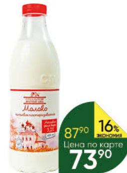
Молоко СУЗДАЛЬСКИЙ МЗ пастеризованное питьевое, 3,2%, 930 мл ТОЛЬКО ДЛЯ СУПЕРМАРКЕТОВ Г. ВЛАДИМИР