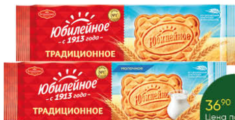
Печенье ЮБИЛЕЙНОЕ традиционное; молочное, 112 г