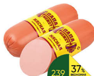
Колбаса ПАПА МОЖЕТ Мясная варёная, 500 г