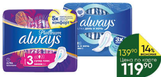
Прокладки гигиенические ALWAYS в ассортименте, 5-10 шт.

139 90 14% ЭКОНОМИЯ Цена по карте 119 90