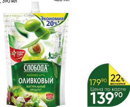
Майонез СЛОБОДА Оливковый, 800 мл

Товар представлен не во всех супермаркетах «Перекрёсток».