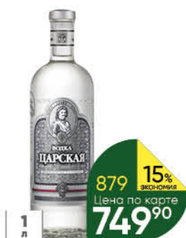
Водка ЛАДОГА Царская 40%, 1 л (Россия)