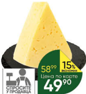
Сыр Российский 45%, 100 г