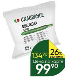
Сыр UNAGRANDE Mozzarella Ciliegine 50%, 225 г