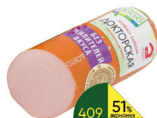
Колбаса МЯСНАЯ ДОМ БОРОДИНА Докторская варёная, 500 г