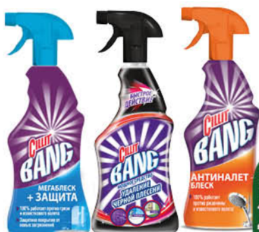
Чистящее средство CILLIT BANG в ассортименте, 750 мл