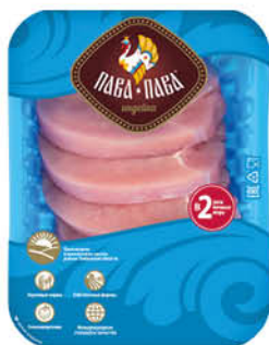
Эскалоп ПАВА-ПАВА из филе грудки индейки охлаждённый, 600 г