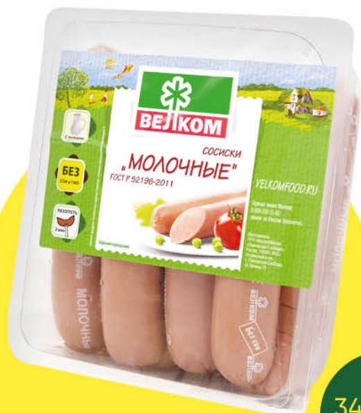
Сосиски ВЕЛКОМ Молочные, 480 г