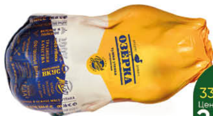
Тушка утёнка ОЗЁРКА потрошёная охлаждённая, 1 кг