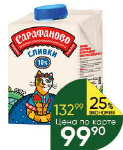
Сливки САРАФАНОВО ультрапастеризованные 10%, 480 мл