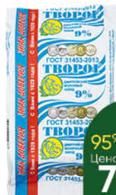
Творог ДМИТРОВСКИЙ 9%, 180 г