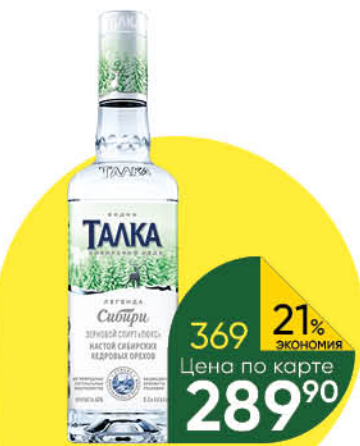
Водка ТАЛКА Сибирский кедр особая 40%, 0,5 л (Россия)