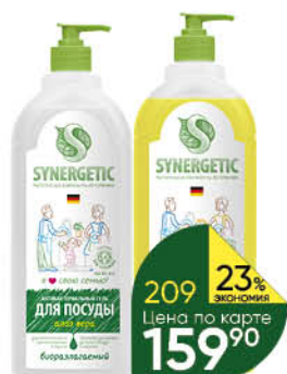
Средство для мытья посуды SYNERGETIC алюз; лимон биоразлагаемое, 1 л