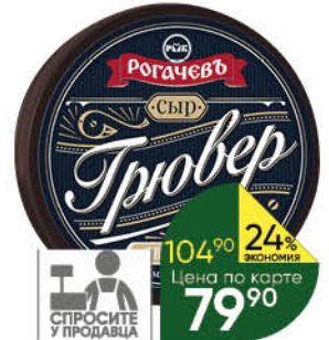
Сыр РОГАЧЁВЪ Грювер особый 45%, 100 г