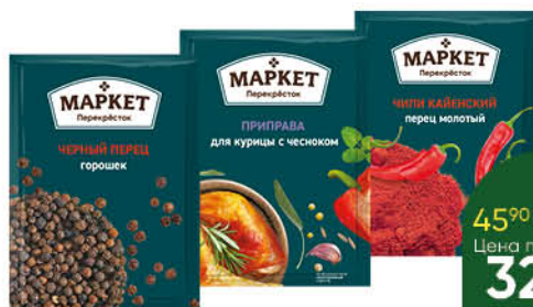
Приправы; Специи МАРКЕТ ПЕРЕКРЁСТОК в ассортименте, 5–28 г

174 90 26% ЭКОНОМИЯ Цена по карте 129 90