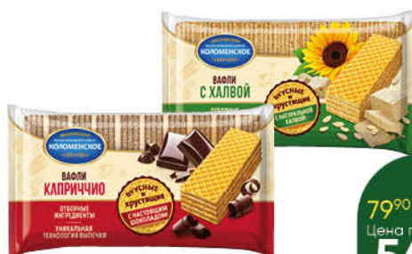
Вафли КОЛОМЕНСКОЕ в ассортименте, 200-220 г