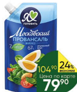
Майонез МОСКОВСКИЙ ПРОВАНСАЛЬ классический 67%, 390 мл