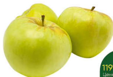
Яблоки Богатырь, 1 кг

129 90 15% Цена по карте ЭКОНОМИЯ 109 90