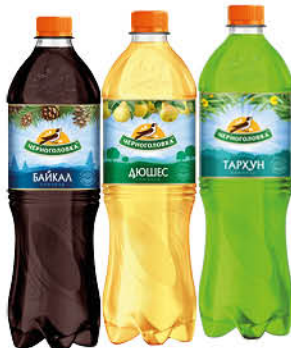
Напиток ЧЕРНОГОЛОВКА безалкогольный сильногазированный в ассортименте, 1,25 л