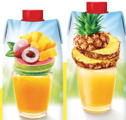
Сок; Нектар; Напиток J-7 в ассортименте, 0,97 л