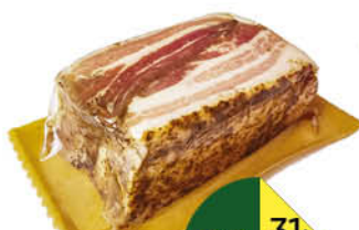
Сало ВОСТРЯКОВО Белорусское солёное из шпика свиного, 100 г