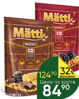
Мюсли МАТТИ с бананом и шоколадом; с ежевикой и малиной; с орехом и яблоком, 250 г