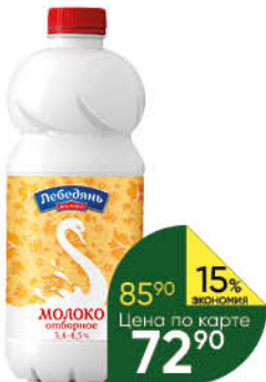
Молоко ЛЕБЕДЯНЬМОЛОКО пастеризованное отборное, 3,4-4,5%, 900 г ТОЛЬКО ДЛЯ СУПЕРМАРКЕТОВ Г. КАЛУГА, РЯЗАНЬ, СМОЛЕНСК, ТУЛА