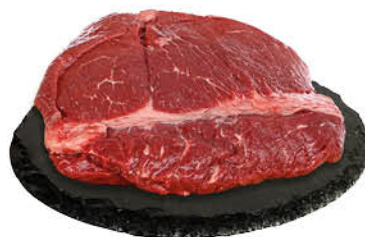
Говядина тазобедренная часть без кости охлаждённая, 1 кг