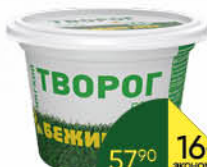
Творог БЕЖИН ЛУГ мягкий 5%, 200 г ТОЛЬКО ДЛЯ СУПЕРМАРКЕТОВ Г. КАЛУГА, РЯЗАНЬ, ТуЛА