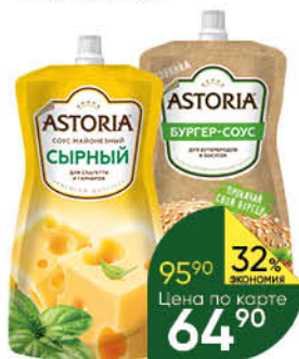
Соус майонезный ASTORIA в ассортименте 20–42%, 200–233 г