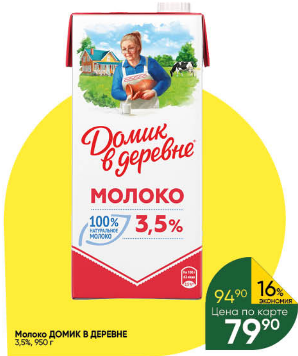
Молоко ДОМИК В ДЕРЕВНЕ 3,5%, 950 г