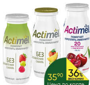
Напиток кисломолочный DANONE Actimel в ассортименте 2,2-2,5%, 95-100 г