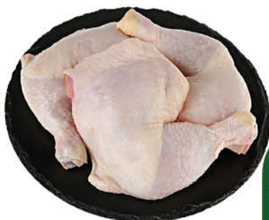
Окорочка куриные охлаждённые, 1 кг

154 90 Цена по карте 129 90 16% экономия