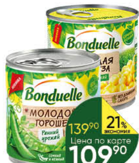
Консервы овощные BONDUELLE горошек зелёный молодой, 400 г; кукуруза молодая сладкая, 425 мл

139 90 21% ЭКОНОМИЯ Цена по карте 109 90