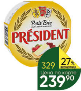
Сыр PRESIDENT Petit Brie мягкий с белой плесенью 60%, 125 г