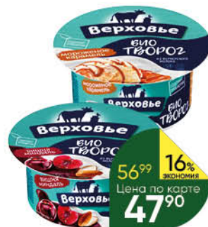
Биотворог ВЕРХОВЬЕ в ассортименте 4,2%, 140 г