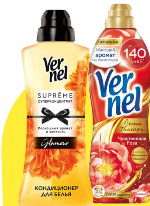
Кондиционер-ополаскиватель для белья VERNEL в ассортименте, 600-910 мл

399 90 25% ЭКОНОМИЯ Цена по карте 299 90