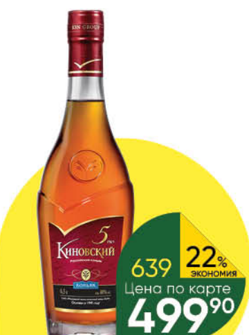
Коньяк КИНОВСКИЙ 5 лет 40%, 0,5 л (Россия)