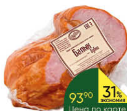
Деликатес ДУБКИ Балык свиной, 100 г