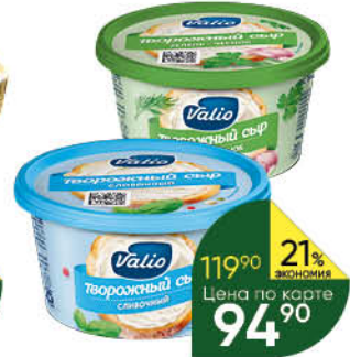
Сыр творожный VALIO с оливками-розмарином; с укропом-чесноком- петрушкой; сливочный 66-70%, 150 г