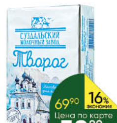
Творог СУЗДАЛЬСКИЙ М3 5%, 200 г ТОЛЬКО ДЛЯ СУПЕРМАРКЕТОВ Г. ИВАНОВО, ВЛАДИМИР