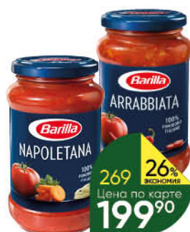
Соус томатный BARILLA Basilico с базиликом; Arrabbiata с перцем чили; Napolitana с овощами, 400 г