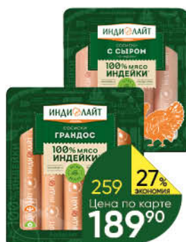
Сосиски ИНДИЛАЙТ Грандос; С сыром из индейки варёные, 440 г