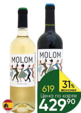
Вино MOLOM Blanco белое сухое; Tinto красное сухое 11-12%, 0,75 л (Испания)

ЧРЕЗМЕРНОЕ УПОТРЕБЛЕНИЕ АЛКОГОЛЯ ВРЕДИТ ВАШЕМУ ЗДОРОВЬЮ 18+