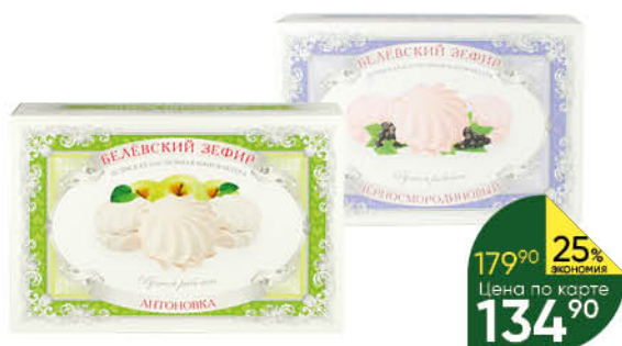
Зефир БЕЛЁВСКАЯ ПАСТИЛЬНАЯ МАНУФАКТУРА Антоновка; Зефирное детство; Черносмородиновый, 250 г

179 90 25% ЭКОНОМИЯ Цена по карте 134 90