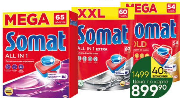
Таблетки для посудомоечной машины SOMAT Gold; All in 1 Extra; All in 1, 54-65 шт.

139 90 14% ЭКОНОМИЯ Цена по карте 119 90