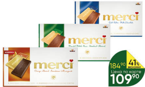
Шоколад MERCI в ассортименте, 100-112 г

184 90 41% ЭКОНОМИЯ Цена по карте 109 90