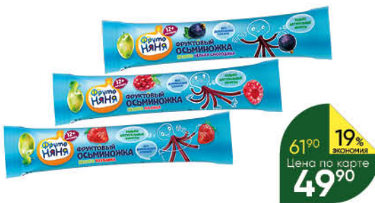
Фруктовые кусочки ФРУТОНЯ яблоко-клубника; яблоко-малина; яблоко-чёрная смородина, 16 г