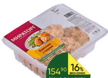
Биточки МИРАТОРГ С сыром из мяса цыплёнка-бройлера охлаждённые, 380 г

при покупке 1 шт. Цена 149 80 2 по цене 1 74 90 *