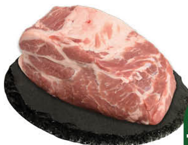
Шейка свинная без кости охлаждённая, 1 кг