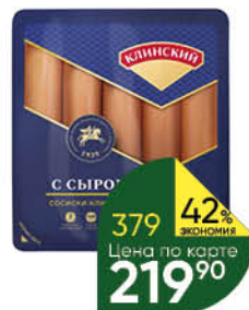
Сосиски КЛИНСКИЙ Клинские с сыром, 470 г