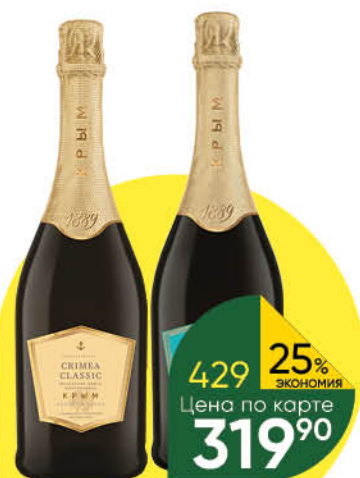
Вино игристое CRIMEA CLASSIC мускатное белое полусладкое; белое брют 12-12,5%, 0,75 л (Россия)