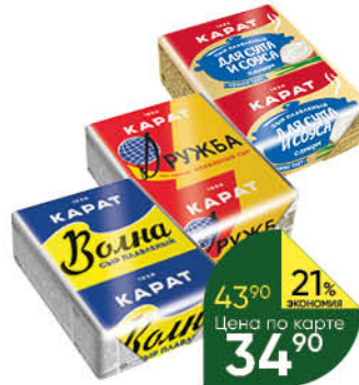
Сыр плавный KARAT Волна; Дружба; С луком для супа 45%, 90 г