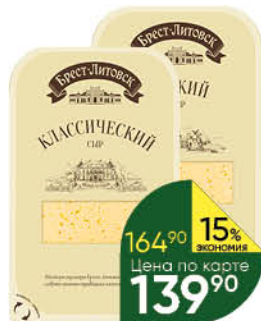
Сыр БРЕСТ-ЛИТОВСК Лёгкий 35%; Классический 45%, 150 г

169 90 24% ЭКОНОМИЯ Цена по карте 129 90