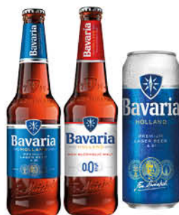
Пиво; Напиток пивной BAVARIA Premium светлое фильтрованное 4,9%; Malt безалкогольный, 0,45 л (Россия)