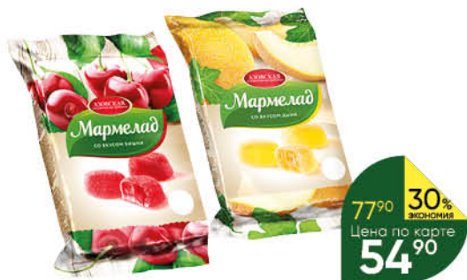
Мармелад АЗОВСКАЯ в ассортименте, 300 г