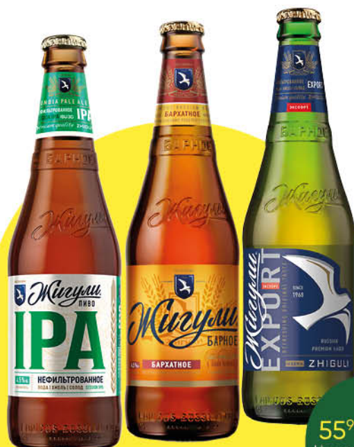
Пиво ЖИГУЛИ Барное в ассортименте 4,5-4,9%, 0,45 л (Россия)