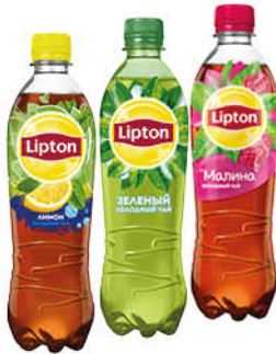
Холодный чай LIPTON в ассортименте, 0,5 л