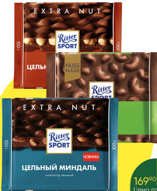
Шоколад RITTER SPORT в ассортименте, 100 г

189 90 26% ЭКОНОМИЯ Цена по карте 139 90