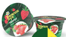
Творог БЕЖИН ЛУГ в ассортименте КАКОЙ?, 160 г ТОЛЬКО ДЛЯ СУПЕРМАРКЕТОВ Г. КАЛУГА, РЯЗАНЬ, ТуЛА