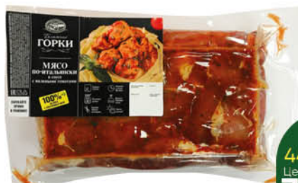
Мясо БЛИЖНИЕ ГОРКИ По-итальянски свинина в соусе с вялеными томатами охлаждённая, 1 кг