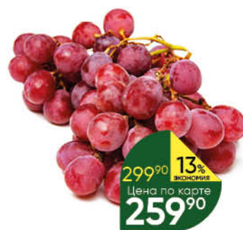
Виноград красный Ред Глоб, 1 кг

209 90 14% Цена по карте ЭКОНОМИЯ 179 90