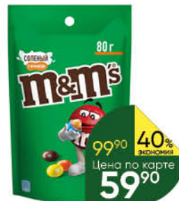
Драже M&M'S, 80 г

169 90 29% ЭКОНОМИЯ Цена по карте 119 90