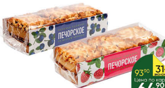
Печенье ПЕЧОРСКОЕ сдобное черника; малина, 330 г