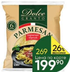
Сыр DOLCE GRANTO Parmesan тёртый 40%, 150 г