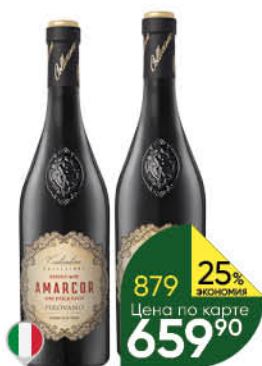
Вино COLLEZIONE COSTANTINO Organic Amarcor, Salento Rosso Passito красное полусухое 14-14,5%, 0,75 л (Италия)