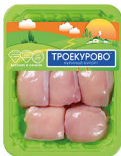
Филе бедра цыплёнка-бройлера ТРОЕКУРОВО охлаждённое, 750 г