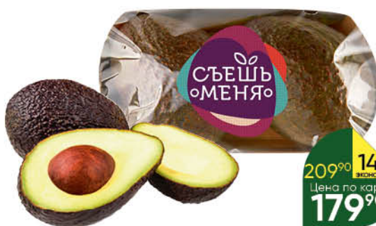
Авокадо READY TO EAT Hass, 2 шт.

169 90 18% Цена по карте ЭКОНОМИЯ 139 90