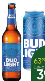
Пиво BUD Light светлое пастеризованное 4,1%, 0,44-0,45 л (Россия)