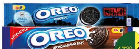
Печенье OREO с какао и начинкой с ванильным; клубничным; шоколадным вкусом, 95 г