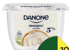
Творог DANONE мягкий 5%, 170 г