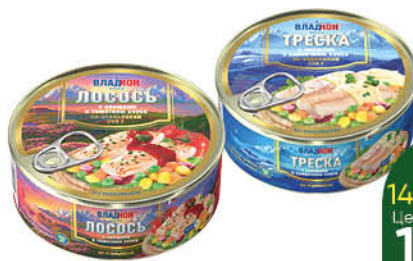
Консервы рыбные с овощами ВЛАДКОН Треска по-норвежски в сливочном соусе; Тунец по-гавайски; Лосось по-итальянски в томатном соусе, 240 г

139 90 21% ЭКОНОМИЯ Цена по карте 109 90