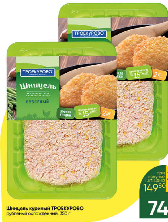
Шницель куриный ТРОЕКУРОВО рубленный охлаждённый, 350 г

при покупке 1 шт. Цена 149 80 2 по цене 1 74 90 *