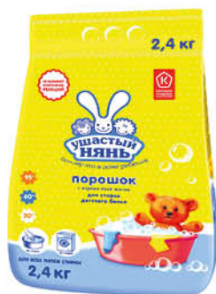
2,4 кг Стиральный порошок УШАСТЫЙ НЯНЬ для детского белья, 2,4 кг

399 90 25% ЭКОНОМИЯ Цена по карте 299 90