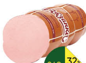
Колбаса СТАРОВДОРСКИЕ КОЛБАСЫ Вязанка Молочная Стародворская варёная, 500 г