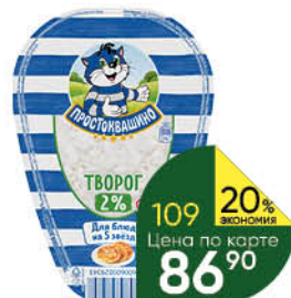
Творог ПРОСТОКВАШИНО 2%, 200 г