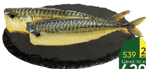
Скумбрия холодного копчения без головы, 1 кг