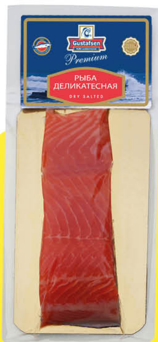
Форель GUSTAFSEN слабосоленая филе-кусоч, 180 г