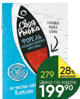
Форель СВОЯ РЫБКА холодного копчения ломтики, 120 г