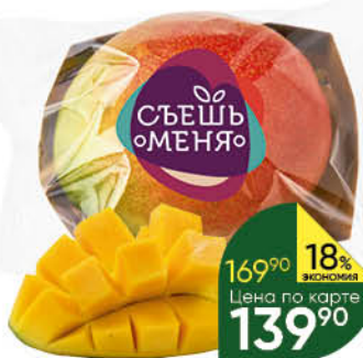
Манго спелый плод, 1 шт.

189 90 11% Цена по карте ЭКОНОМИЯ 169 90