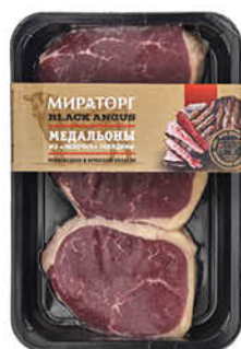
Медальоны МИРАТОРГ из яблочка говядины охлаждённые, 490 г