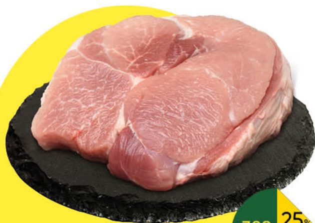
Свинина духовая без кости охлаждённая, 1 кг