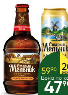
Пиво СТАРЫЙ МЕЛЬНИК Из Бочонка в ассортименте 4,2-5%, 0,45 л (Россия)