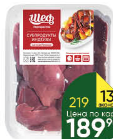
Печень индейки ШЕФ ПЕРЕКРЁСТОК охлаждённая, 500 г