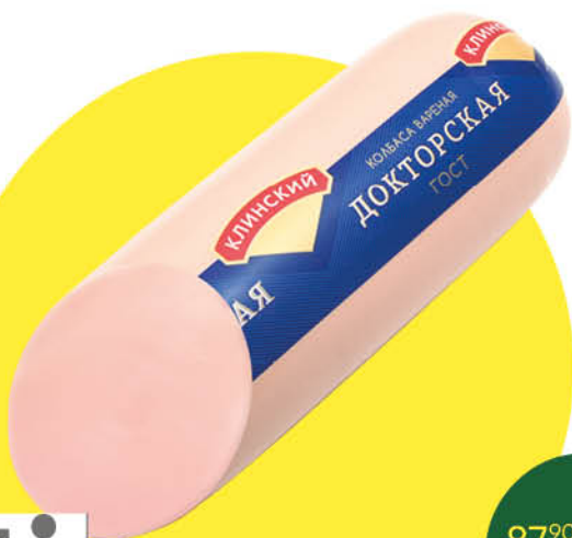
Колбаса КЛИНСКИЙ Докторская варёная, 100 г