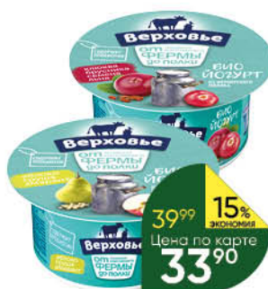
Биоюгурт ВЕРХОВЬЕ в ассортименте 2,9-3,5%, 150 г