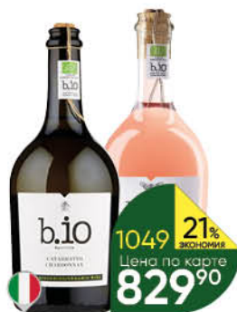
Вино B.I.O в ассортименте 12,5-13,5%, 0,75 л (Италия)