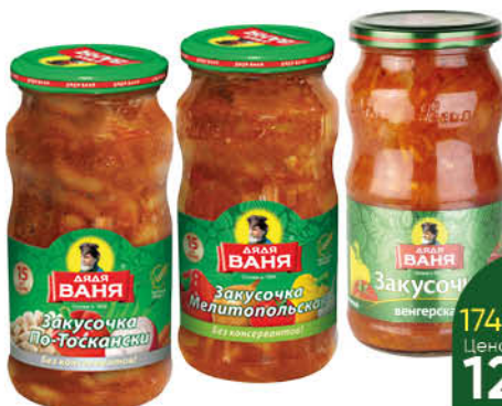
Консервы овощные ДЯДЯ ВАНЯ Закусочка Мелитопольская; По-тоскански; Венгерская, 460 г

174 90 26% ЭКОНОМИЯ Цена по карте 129 90