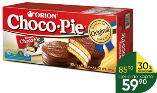
Пирожное ORION Choco Pie в глазури 6 шт., 180 г