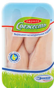
Филе грудки куриной ПЕРВАЯ СВЕЖЕСТЬ охлаждённое, 1 кг