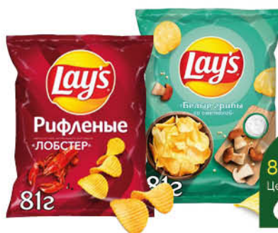
Чипсы LAY'S из натурального картофеля вассортименте, 81 г