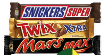
Шоколадный батончик MARS; SNICKERS; TWIX в ассортименте, 81-95 г