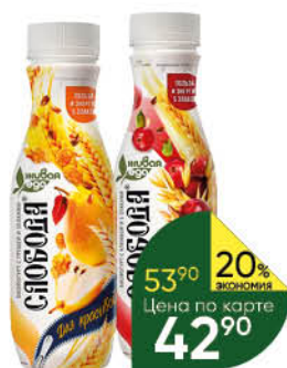
Биоюгурт СЛОБОДА в ассортименте 0-2%, 260 г