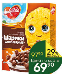
Сухой завтрак ЛЮБИТОВО шарики шоколадные, 250 г