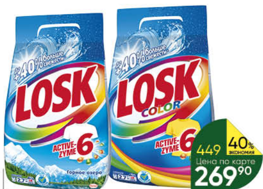
2,7 кг Средство для стирки LOSK Ароматерапия; Горное озеро; Color порошок, 2,7 кг