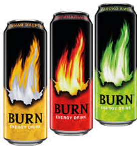
Напиток энергетический BURN в ассортименте, 449 мл