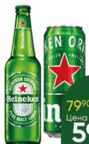
Пиво HEINEKEN светлое 4,8%, 0,43-0,47 л (Россия)