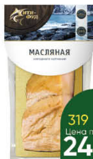
Рыба Масляная СИТИ-ФУД холодного копчения кусок, 200 г