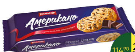
Печенье КУХМАСТЕР Американо сдобное с кусочками шоколада, 270 г