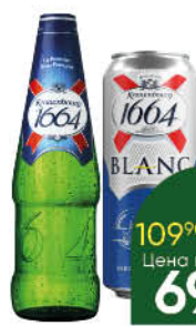
Пиво; Напиток пивной KRONENBOURG 1664 Classic; Blanc светлое 4,5%, 0,45-0,46 л (Россия)