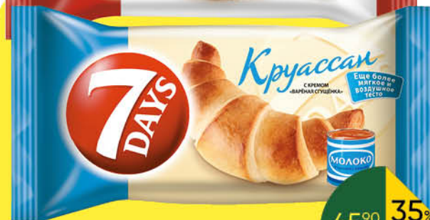
Круассан 7DAYS в ассортименте, 65 г