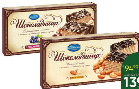
Торт вафельный ШОКОЛАДНИЦА с фундуком; с миндалём; с орехами и изюмом, 270 г

194 90 28% Цена по карте 139 90 ЭКОНОМИЯ