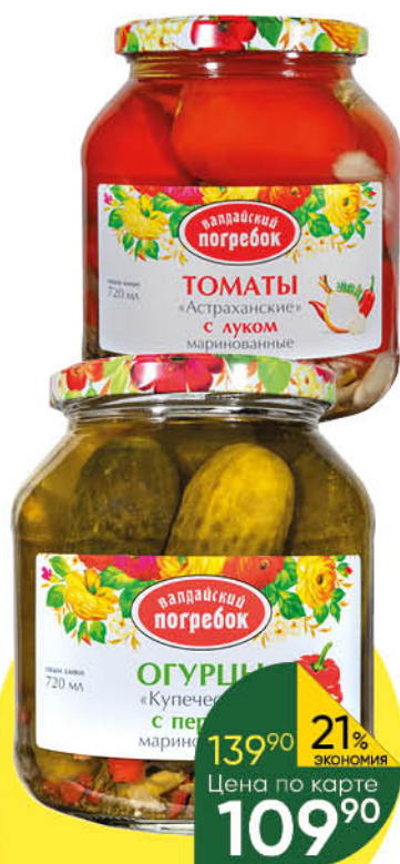
Консервы овощные ВАЛДАЙСКИЙ ПОГРЕБОК огурцы Купеческие; томаты Астраханские маринованные; томаты Кубанские неочищенные в томатном соке, 650–660 г; 720 мл

139 90 21% ЭКОНОМИЯ Цена по карте 109 90