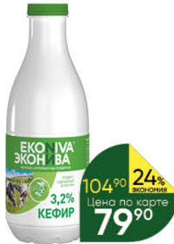
Кефир ЕКОНИВА 3,2%, 1000 г