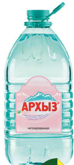
5 л Вода АРХЫЗ горная природная питьевая негазированная, 5 л