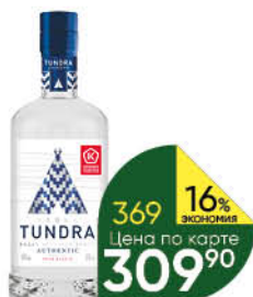
Водка TUNDRA Authentic Крайнего севера 40%, 0,5 л (Россия)