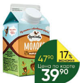
Молоко ЯРОСЛАВА цельное топленое, 3,6-4,2%, 450 г ТОЛЬКО ДЛЯ СУПЕРМАРКЕТОВ Г. ЯРОСЛАВЛЬ