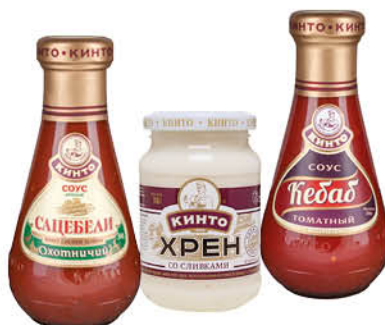
Соус; Хрен КИНТО в ассортименте, 180–310 г

174 90 26% ЭКОНОМИЯ Цена по карте 129 90