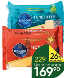
Сыр КАБОШ Тильзистер; Чеддер 47-49%, 200 г

164 90 15% ЭКОНОМИЯ Цена по карте 139 90