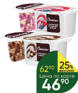
Йогурт ДАНИССИМО Фантазия с хрустящими шариками в ассортименте 6,9%, 105 г