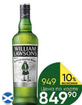
Виски WILLIAM LAWSON'S Ecological KV 7 лет выдержанный 40%, 0,7 л (Шотландия)