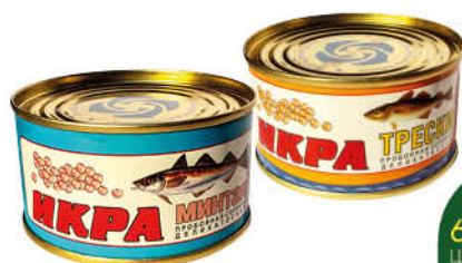
Икра СРК минтая, трески пробойная солёная деликатесная, 130 г