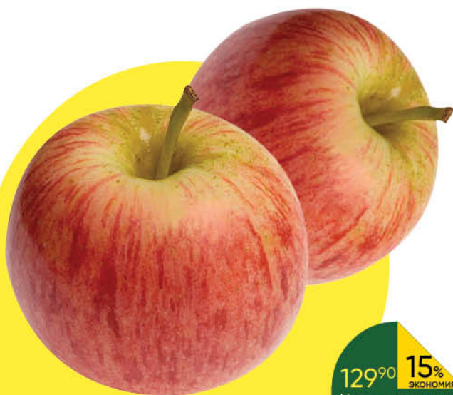
Яблоки Гала, 1 кг

129 90 15% Цена по карте ЭКОНОМИЯ 109 90