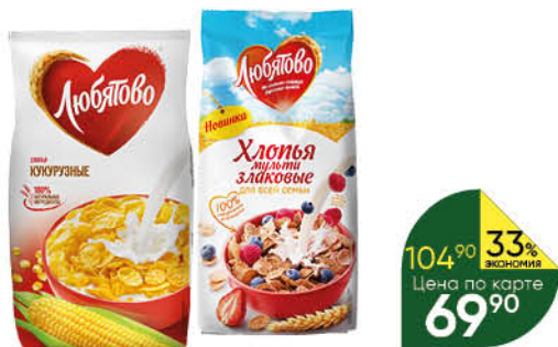
Хлопья ЛЮБИТОВО мультизлаковые; кукурузные, 250-300 г

179 90 25% ЭКОНОМИЯ Цена по карте 134 90