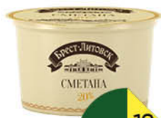
Сметана БРЕСТ-ЛИТОВСК 20%, 180 г