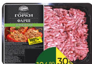
Фарш БЛИЖНИЕ ГОРКИ Деревенский охлаждённый, 400 г

189 90 Цена по карте 139 90 26% ЭКОНОМИЯ