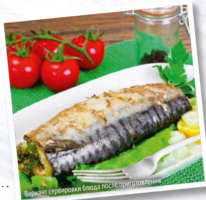
Вариант сервировки блюда после приготовления

Скумбрию выпотрошите, удалите голову, хвост и плавники, промойте под проточной водой и обсушите бумажными полотенцами.