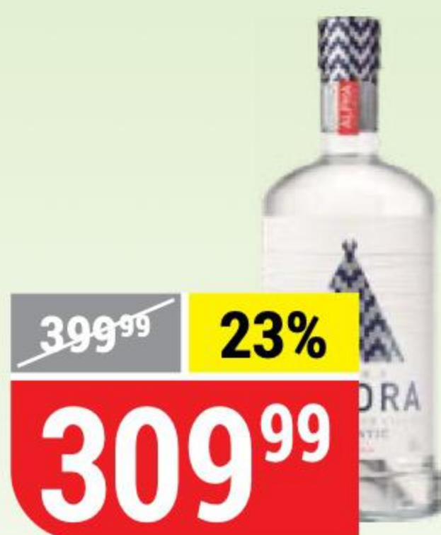
ВОДКА TUNDRA AUTHENTIC 40%, 0,5 л 124209