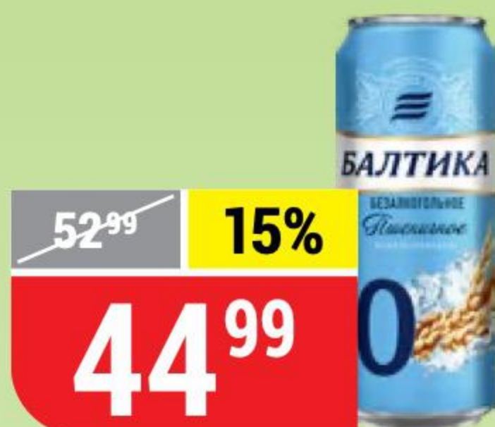
ПИВО БАЛТИКА №0 пшеничное, безалкогольное, 0,5%, 0,45 л 130969