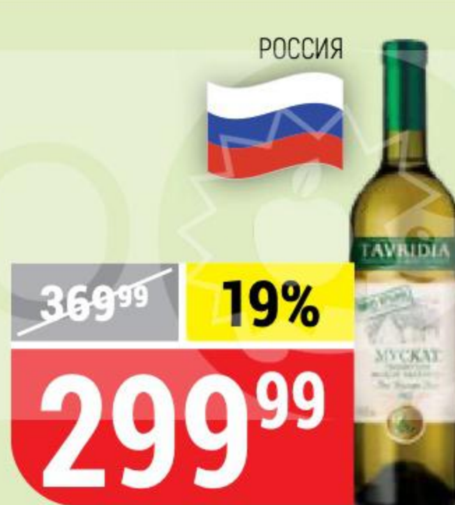
ВИНО TAVRIDIA мускат ркацители, белое, полусладкое, 10%, 0,75 л 159484