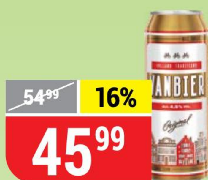
ПИВО VANBIER светлое, 4,5%, 0,45 л 154835