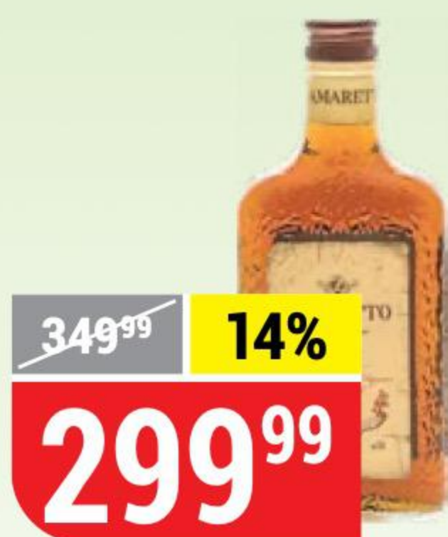
ЛИКЕР SAN MARCO АМАРЕТТО 25%, 0,5 л 103575