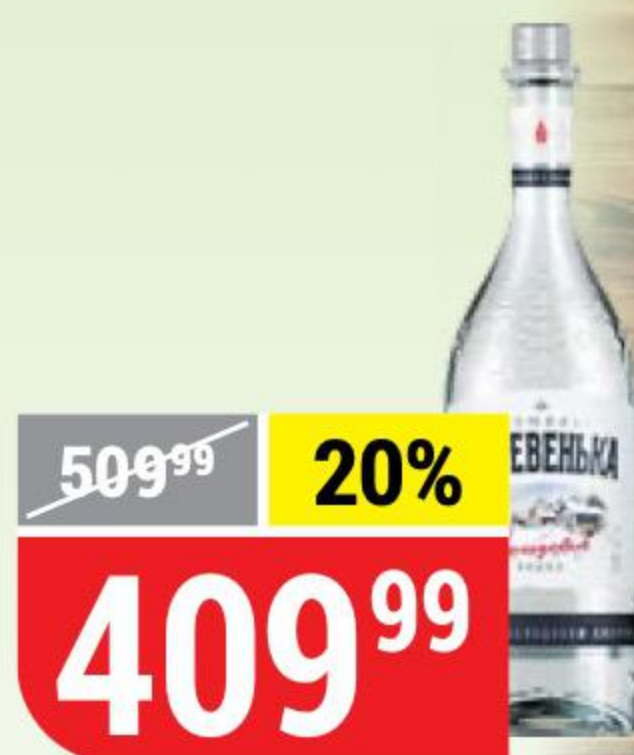
ВОДКА ЗИМНЯЯ ДЕРЕВЕНЬКА солодовая, 40%, 0,7 л 134451