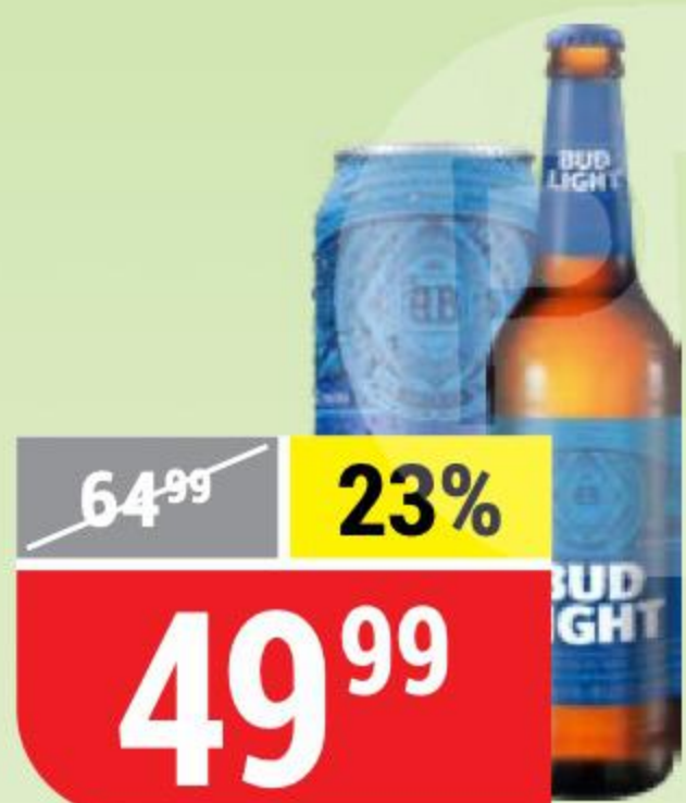
ПИВО BUD light , светлое, 4,1%, 0,44-0,45 л 160031/144906