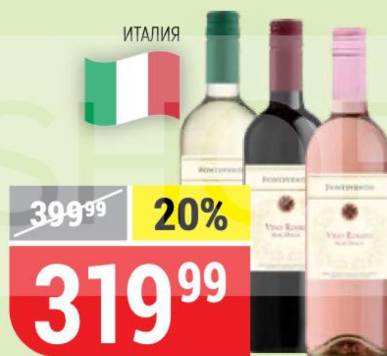
ВИНО FONTEVENTO в ассортименте, 10,5%, 0,75 л 163420/163426/163428