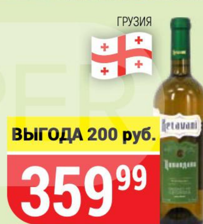
ВИНО KETAVANI цинандали, белое, сухое, 12%, 0,75 л 157212