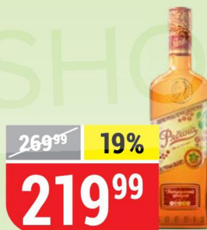
НАСТОЙКА РЯБИНА НА КОНЬЯКЕ сладкая, 21%, 0,5 л 140396