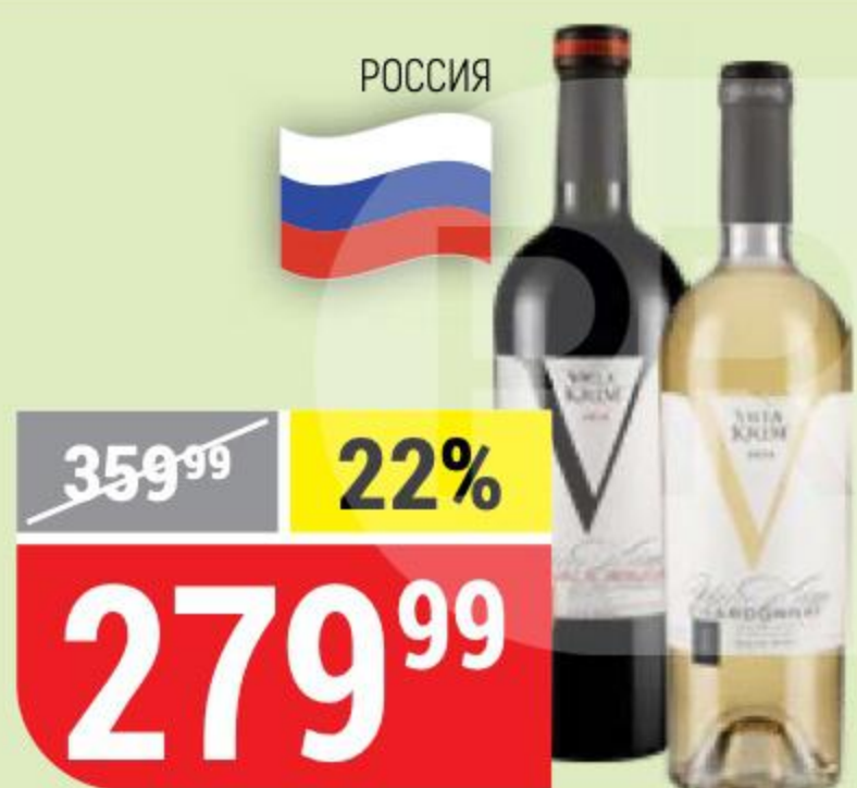
ВИНО VILLA KRIM chardonnay, белое, сухое; shevalie rouge, красное, полусладкое, 12-13%, 0,75 л 127665/127667