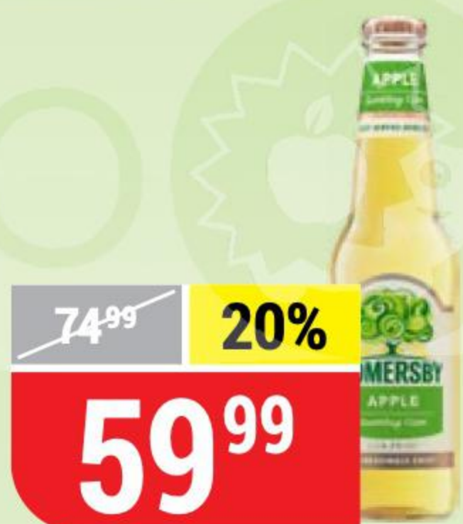
ПИВНОЙ НАПИТОК SOMERSBY apple, 4,5%, 0,4 л 152839