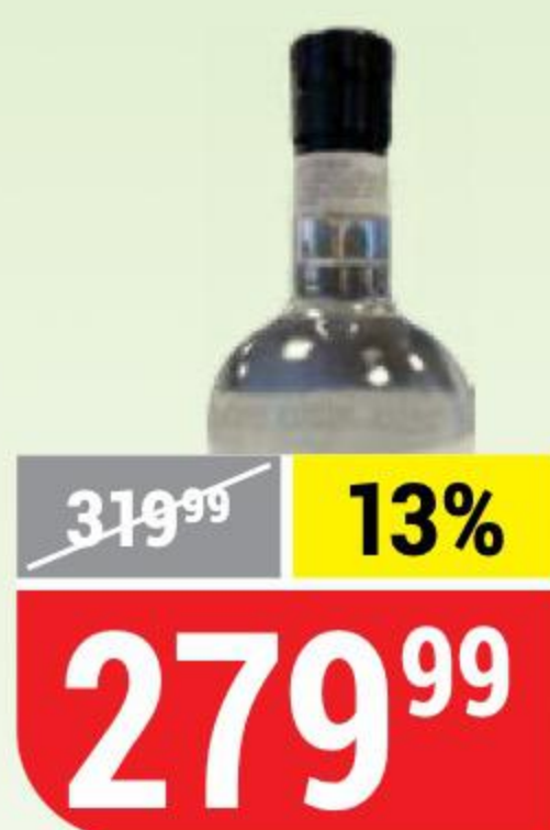
ВОДКА РАБОЧАЯ ПРАВДА 40%, 0,5 л 160403