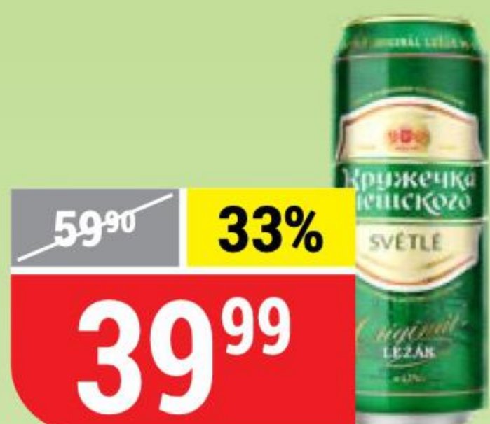
ПИВО КРУЖЕЧКА ЧЕШСКОГО светлое, 4,3%, 0,43 л 162100