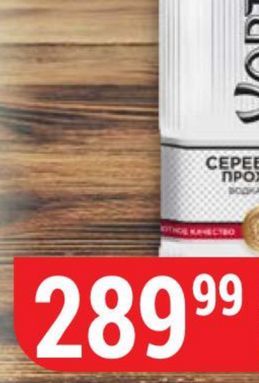
ВОДКА ХОРТИЦЯ особая, серебряная прохлада, 40%, 0,5 л 111253