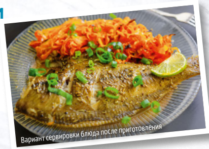
Вариант сервировки блюда после приготовления

Хорошо промыть камбалу под струей проточной воды и обсушить бумажным полотенцем.