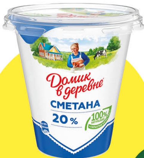
Сметана ДОМИК В ДЕРЕВНЕ 20%, 300 г