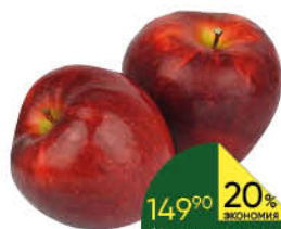
Яблоки Ред Чиф, 1 кг

149 90 20% ЭКОНОМИЯ Цена по карте 119 90