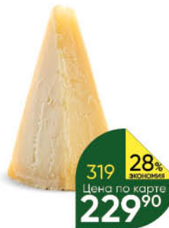
Сыр RYG твёрдый кусковой 40% 180 г