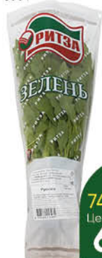
Рукола в горшочке, 1 шт

259 90 12% ЭКОНОМИЯ Цена по карте 229 90