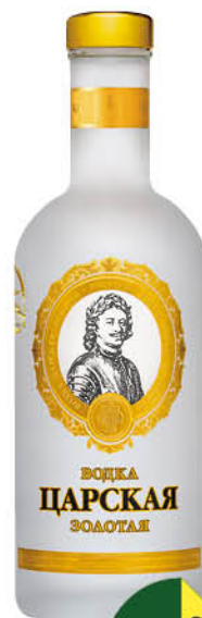
Водка ЦАРСКАЯ Золотая 40%, 0,5 л (Россия)