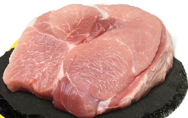
Свинина Духовая охлажденная, 1 кг