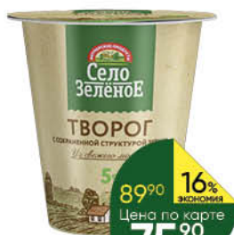
Творог СЕЛО ЗЕЛЁНОЕ 5%, 220 г* КРОМЕ СУПЕРМАРКЕТОВ Г. СУРГУТ, Г. НИЖНЕВАРТОВСК И Г. ХАНТЫ-МАНСЙЙСК