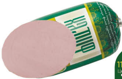
Колбаса вареная ХАЛИФ ХАЛЯЛЬ, 400 г ТОЛЬКО В СУПЕРМАРКЕТАХ Г. СУРГУТ, Г. ТЮМЕНЬ, Г. НИЖНЕВАРТОВСК И Г. ХАНТЫ-МАНСЙСКИЙ