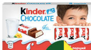
Шоколад KINDER Chocolate молочный с молочной начинкой, 100 г