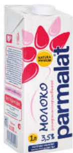
Молоко PARMALAT ультрапастеризованное 3,5%, 1 л

194 90 23% экономия Цена по карте 149 90