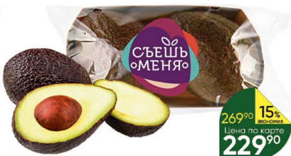
Авокадо READY TO EAT Hass, 1 уп.

209 90 10% ЭКОНОМИЯ Цена по карте 189 90