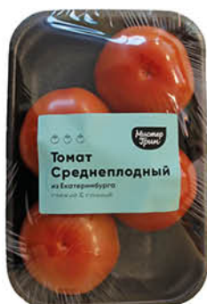
Томаты красные, 600 г

179 90 11% ЭКОНОМИЯ Цена по карте 159 90