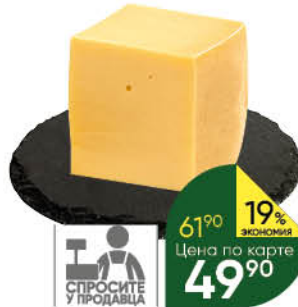
Сыр Эдам; Эдамский 35-50%, 100 г

149 90 27% ЭКОНОМИЯ Цена по карте 109 90