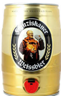
Пиво FRANZISKANER Пшеничное светлое нефильтрованное бочковое 5%, 5 л (Германия)