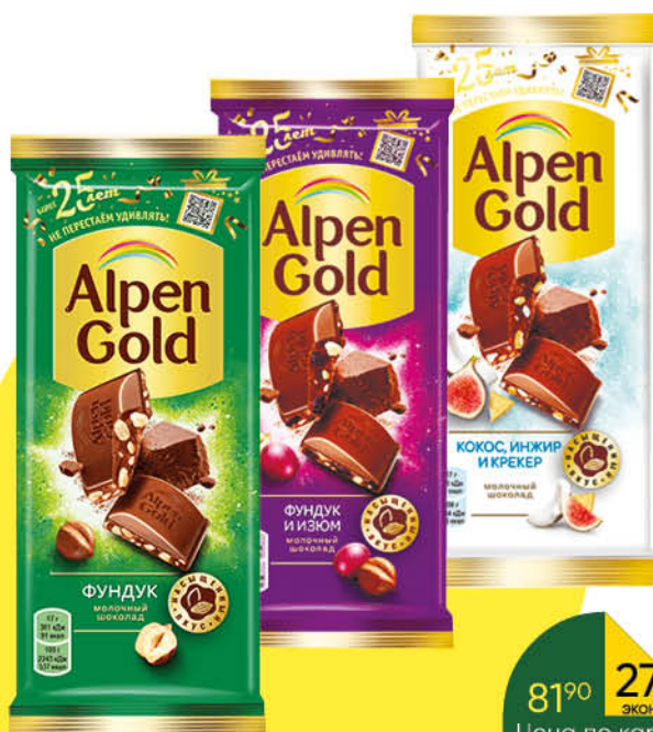
Шоколад ALPEN GOLD в ассортименте, 85-90 г