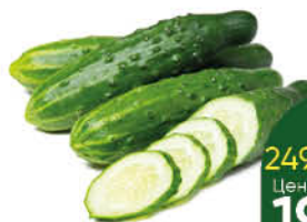
Огурцы ТСХ тепличные, 1 кг

249 90 20% экономия Цена по карте 199 90