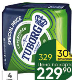
Пиво TUBORG GREEN светлое 4,6%, 4 x 0,45 л (Россия)