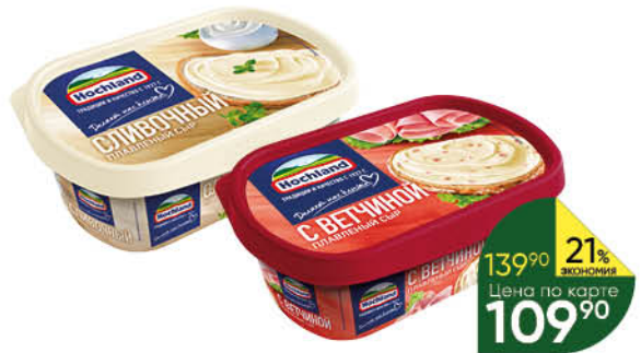
Сыр плавленый HOCHLAND с ветчиной; с грибами; сливочный 55%, 200 г

139 90 21% ЭКОНОМИЯ Цена по карте 109 90