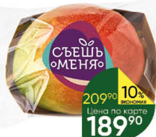
Манго спелый плод, 1 шт.

129 90 15% ЭКОНОМИЯ Цена по карте 109 90