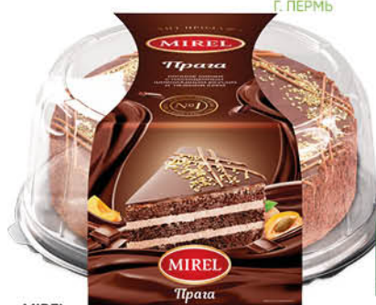
Торт MIREL Прага, 660 г