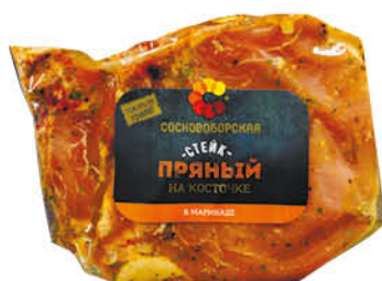
Стейк СОСНОВОБОРСКИЙ Пряный в маринаде на кости, 400 г