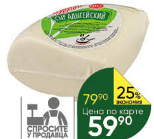
Сыр адыгейский ДЕРЕВНЯ СЫРОВАРОВ 45%, 100 г