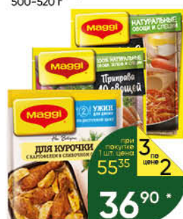
Специи MAGGI в ассортименте, 20–75 г

154 90 29% Цена по карте ЭКОНОМИЯ 109 90