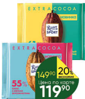
Шоколад RITTER SPORT 55%; 61%; 74% какао, 100 г

149 90 20% ЭКОНОМИЯ Цена по карте 119 90