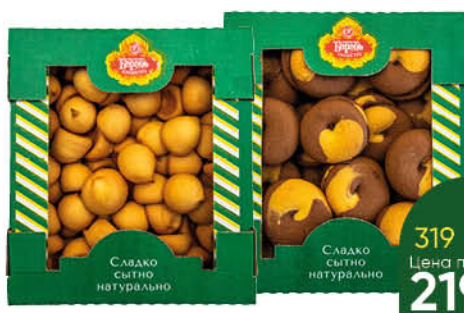
Печенье КОРОЛЬ СЛАДОСТЕЙ День-Ночь с варёной сгущёнкой; Сырное сдобное, 650 г

219 90 32% Цена по карте ЭКОНОМИЯ 149 90