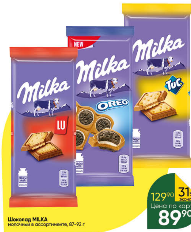
Шоколад MILKA молочный в ассортименте, 87-92 г

199 90 25% ЭКОНОМИЯ Цена по карте 149 90