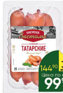
Сардельки Кунгурский МК Татарские 1 сорт, 300 г ТОЛЬКО В СУПЕРМАРКЕТАХ Г. ПЕРМЬ