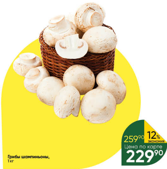
Грибы шампиньоны, 1 кг

199 90 15% ЭКОНОМИЯ Цена по карте 169 90