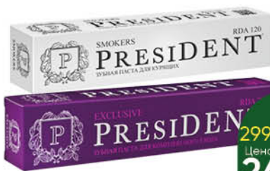
Зубная паста PRESIDENT Smokers; White; Exclusive, 75 мл

299 90 17% ЭКОНОМИЯ Цена по карте 249 90