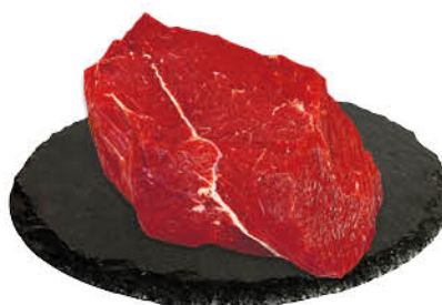
Говядина лопаточная часть, 1 кг