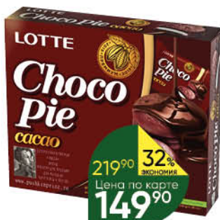
Печенье LOTTE Choco Pie cacao бисквитное в шоколадной глазури, 336 г

219 90 32% Цена по карте ЭКОНОМИЯ 149 90