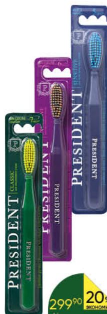
Зубная щётка PRESIDENT в ассортименте, 1 шт.

299 90 17% ЭКОНОМИЯ Цена по карте 249 90