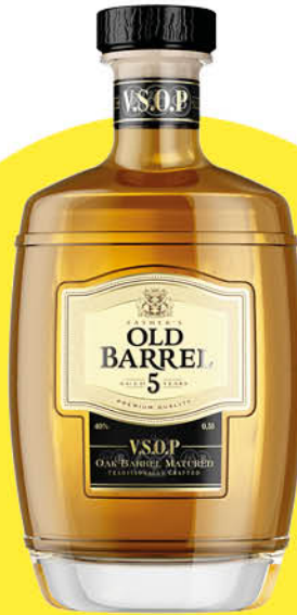
Коньяк FATHER'S Old Barrel 5 лет 40%, 0,5 л (Россия)