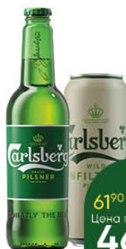
Пиво CARLSBERG светлое в ассортименте 4,5-4,6%, 0,44-0,45 л (Россия)