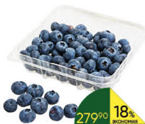
Голубика свежая, 125 г

329 90 12% ЭКОНОМИЯ Цена по карте 289 90