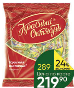
Конфеты КРАСНЫЙ ОКТЯБРЬ Красная Шапочка, 250 г