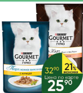
Корм для кошек PURINA Gourmet консервы в ассортименте, 75-85 г