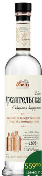
Водка АРХАНГЕЛЬСКАЯ Северная выдержка 40%, 0,7 л (Россия)

559 90 20% ЭКОНОМИЯ Цена по карте 449 90