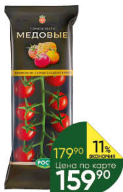
Томаты черри Медовые красные круглые, 200 г

154 90 16% ЭКОНОМИЯ Цена по карте 129 90