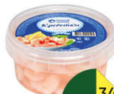
Креветки НОВЫЙ ОКЕАН в рассоле, 180 г