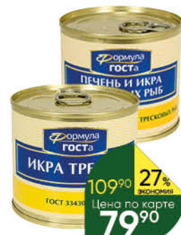
Консервы рыбные ФОРМУЛА ГОСТА поштет из печени и икры тресковых рыб; икра трески, 220 г