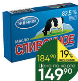
Масло сливочное ЭКОМИЛК Традиционное несоленое 82,5%, 180 г

149 90 17% Цена по карте ЭКОНОМИЯ 124 90