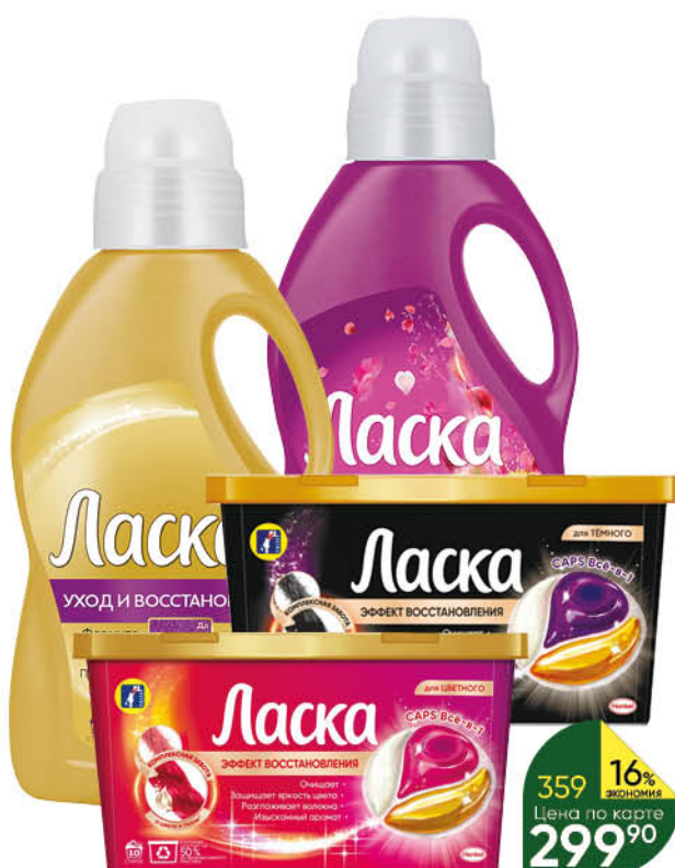
Средство для стирки ЛАСКА в ассортименте гель, 0,9-1 л; капсулы, 10 x 14,5 г

369 90 27% ЭКОНОМИЯ Цена по карте 269 90