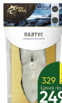
Палтус СИТИ-ФУД холодного копчения, 200 г