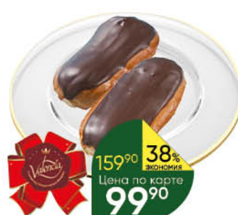
Пирожное Заварное ВАЛЕНСИЯ глазированный, 250 г* ТОЛЬКО В СУПЕРМАРКЕТАХ Г. ПЕРМЬ