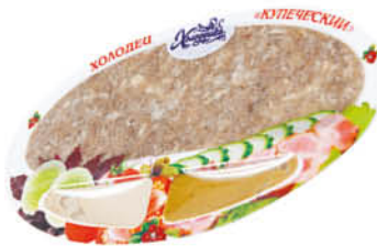
Холодец ХОЛОДУШКА Купеческий, 250 г