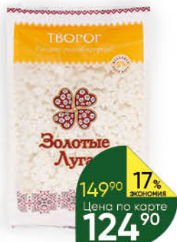
Творог ЗОЛОТЫЕ ЛУГА 5%, 350 г* ТОЛЬКО В СУПЕРМАРКЕТАХ Г. ТЮМЕНЬ, Г. СУРГУТ, Г. НИЖНЕВАРТОВСК И Г. ХАНТЫ-МАНСЙЙСК

149 90 17% Цена по карте ЭКОНОМИЯ 124 90