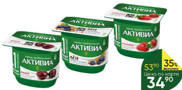
Йогурт питьевой DANONE Активиа в ассортименте 2,9-3,5%, 130 г