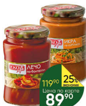
Консервы овощные ЕКО Икра из кабачков; Лечо по-болгарски, 680 г