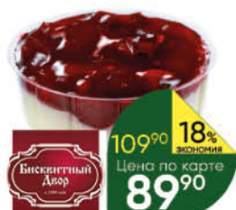
Пирожное БИСКВИТНЫЙ ДВОР десерт Вишня песочное, 180 г* ТОЛЬКО В СУПЕРМАРКЕТАХ: ЕКАТЕРИНБУРГ, Г. НИЖНИЙ ТАГИЛ, Г. ТЮМЕНЬ И Г. ЧЕЛЯБИНСК