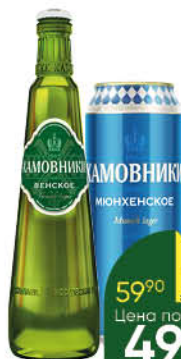
Пиво ХАМОВНИКИ в ассортименте 3,7-5,5%, 0,45-0,47 л (Россия)