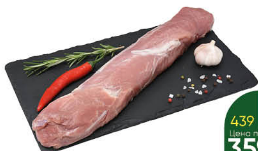
Вырезка свинная, 1 кг