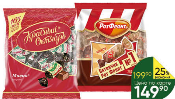
Конфеты РОТФРОНТ; КРАСНЫЙ ОКТЯБРЬ Батончики с шоколадно-сливочным вкусом; Маска, 250 г

199 90 25% ЭКОНОМИЯ Цена по карте 149 90