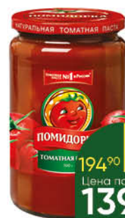
Паста томатная ПОМИДОРКА, 480 мл

194 90 28% Цена по карте ЭКОНОМИЯ 139 90