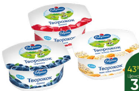
Паста творожная САВУШКИН в ассортименте 3,5%, 120 г