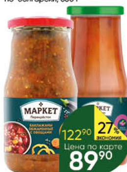
Консервы овощные МАРКЕТ ПЕРЕКРЕСТОК Баклажаны с овощами; в аджике; Икра из баклажанов, 500–520 г

189 90 26% Цена по карте ЭКОНОМИЯ 139 90