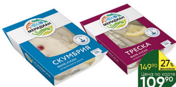
Скумбрия; Треска МЕРИДИАН отварная в желе филе-кусочек с кожей, 200 г

149 90 27% ЭКОНОМИЯ Цена по карте 109 90