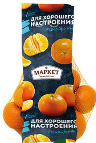
Мандарины МАРКЕТ ПЕРЕКРЁСТОК фасованные, 1 кг

279 90 18% ЭКОНОМИЯ Цена по карте 229 90