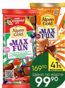
Шоколад ALPEN GOLD Max Fun в ассортименте, 150 г