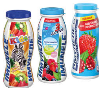
Напиток кисломолочный ИМУНЕЛЕ в ассортименте 1,2-1,5%, 100 г