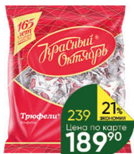
Конфеты КРАСНЫЙ ОКТЯБРЬ Трюфели, 200 г