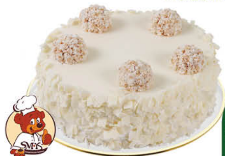
Торт СМАК РАФАЛЕТТО с кокосом, 440 г* КРОМЕ СУПЕРМАРКЕТОВ Г. ПЕРМЬ И Г. ХАНТЫ-МАНСИЙСК