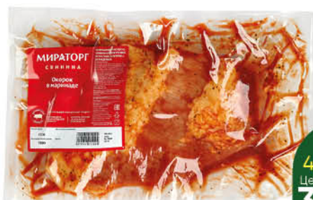
Окорок МИРАТОРГ для запекания в маринаде, 1 кг