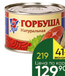
Горбуша 5 МОРЕЙ натуральная, 250 г