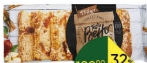
Пирог TESTO BESTO Баварский клубника-земляника; яблоко с корицей, 400 г

189 90 32% Цена по карте ЭКОНОМИЯ 129 90