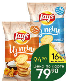
Чипсы картофельные LAY'S Из печи в ассортименте, 85 г