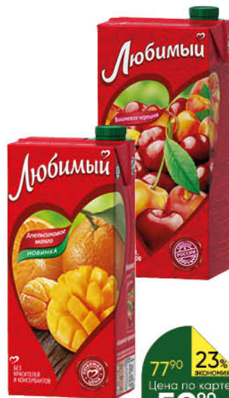
Нектар; Напиток сокоосодержащий ЛЮБИМЫЙ в ассортименте, 0,95 л