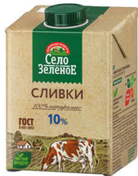
Сливки СЕЛО ЗЕЛЁНОЕ стерилизованные 10%, 500 г

184 90 19% Цена по карте ЭКОНОМИЯ 149 90