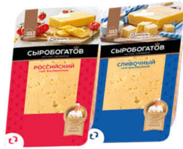
Сыр СЫРОБОГАТОВ Сливочный; Российский 50%, 125 г

169 90 24% ЭКОНОМИЯ Цена по карте 129 90