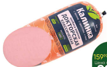
Колбаса КАЛИНКА Докторская варёная, 400 г ТОЛЬКО В СУПЕРМАРКЕТАХ Г. ЧЕЛЯБИНСК