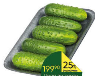
Огурцы Корнишоны, 300 г

149 90 13% ЭКОНОМИЯ Цена по карте 129 90