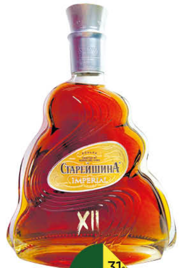
Коньяк СТАРЕЙШИНА Imperial КС 12 лет 40%, 0,5 л (Россия)