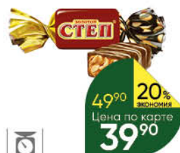
Конфеты СЛАВЯНКА; КРАСНЫЙ ОКТЯБРЬ Золотой Шаг, 100 г