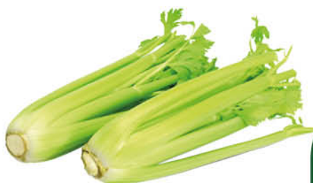
Сельдерей черешковый, 1 шт.

149 90 13% ЭКОНОМИЯ Цена по карте 129 90