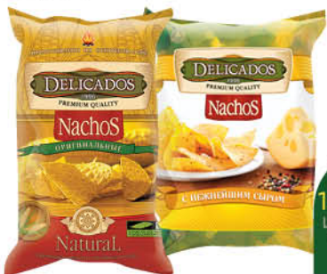
Чипсы кукурузные DELICADOS Nachos оригинальные; со вкусом сыра, 150 г