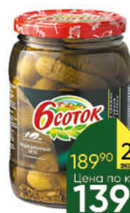
Огурцы Б СТОК Домашние; Хрустящие маринованные, 680 г; 720 мл

189 90 26% Цена по карте ЭКОНОМИЯ 139 90