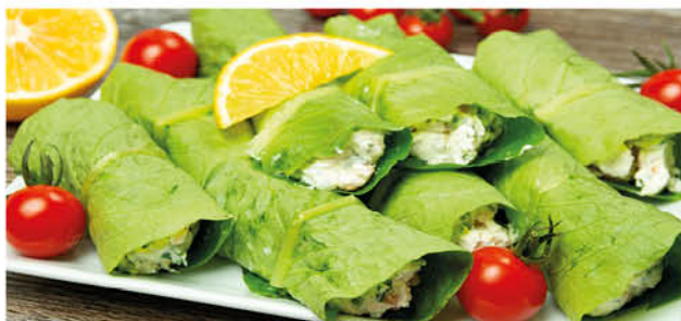
Кето: Закуска из слабосоленого лосося