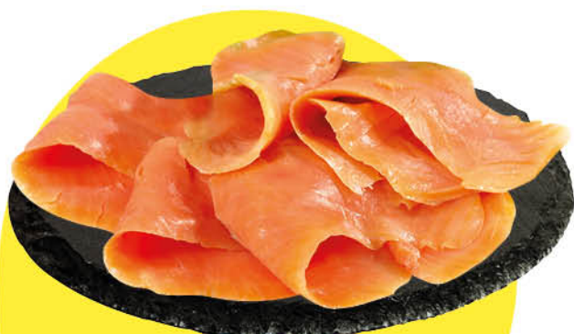
Сёмга слабосоленая ломтики, 100 г

249 90 20% ЭКОНОМИЯ Цена по карте 199 90