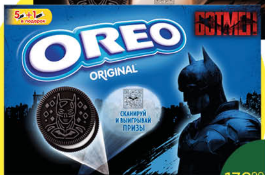
Печенье OREO Original; шоколадный вкус; какао с клубникой, 228 г

139 90 21% Цена по карте ЭКОНОМИЯ 109 90