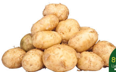
Картофель ранний, 1 кг

199 90 25% ЭКОНОМИЯ Цена по карте 149 90