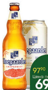
Напиток пивной HOEGAARDEN Wit Blanche светлый; Grapefruit нефильтрованный 4,6-4,9%, 0,44-0,45 л (Россия)