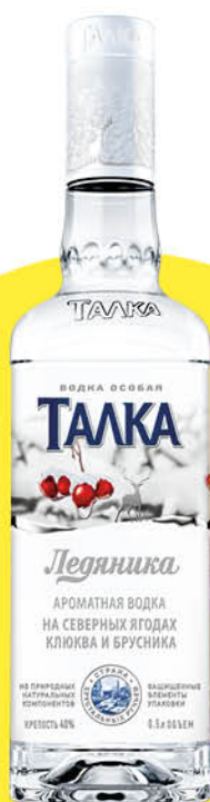
Водка ТАЛКА Ледяника особая 40%, 0,5л (Россия)