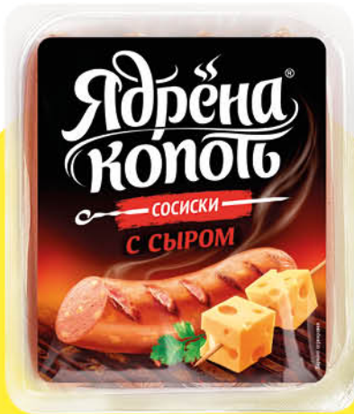
Сосиски ЯДРЕНА КОПОТЬ с сыром 420 г

189 90 42% ЭКОНОМИЯ Цена по карте 109 90