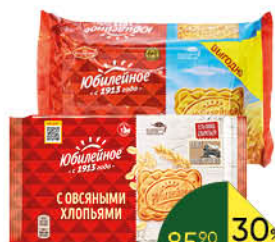
Печенье ЮБИЛЕЙНОЕ витаминизированное традиционное; с овсяными хлопьями, 268 г