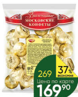
Конфеты РОТФРОНТ Осенний вальс, 250 г