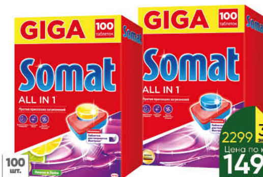
Таблетки для посудомоечной машины SOMAT All in 1 в 6 аромата; лимон и лайм, 100 шт.