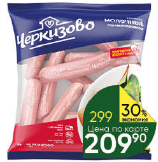
Сосиски Молочные ЧЕРКИЗОВО По-черкизовски, 650 г