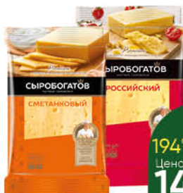
Сыр Российский; Сметанный; Король сыров СЫРОБОГАТОВ 50%, 200 г

249 90 20% экономия Цена по карте 199 90