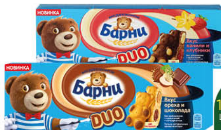
Пирожное МЕДВЕЖОНОК БАРНИ бисквитное малина-кокос; орех-шоколад; клубника-ваниль, 150 г