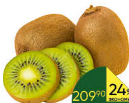
Киви, 1 кг

269 90 15% ЭКОНОМИЯ Цена по карте 229 90