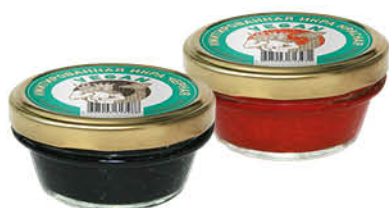
Икра VEGAN красная; чёрная имитированная, 100 г

149 90 27% ЭКОНОМИЯ Цена по карте 109 90