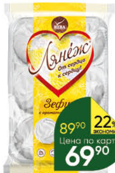
Зефир ЛЯНЕЖ с ароматом ванили, 315 г