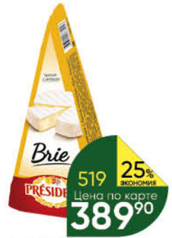
Сыр PRESIDENT Brie мягкий с белой плесенью 60%, 200 г