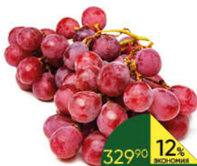
Виноград красный Ред Глоб, 1 кг

209 90 24% ЭКОНОМИЯ Цена по карте 159 90