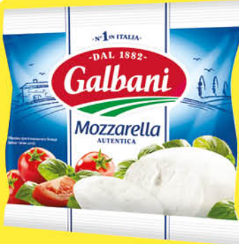
Сыр GALBANI Mozzarella 45%, 125 г

169 90 24% ЭКОНОМИЯ Цена по карте 129 90