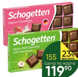
Шоколад SCHOGETTEN в ассортименте, 100 г