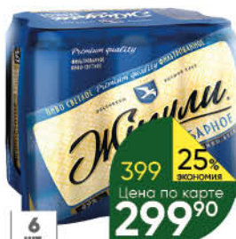
Пиво ЖИГУЛИ Барное светлое 4,9%, 6 x 0,45 л (Россия)