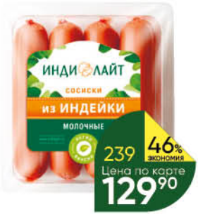
Сосиски варёные ИНДИЛАЙТ молочные из индейки высший сорт, 440 г