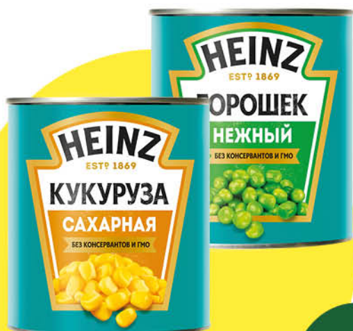
Консервы овощные HEINZ Кукуруза сахарная; Горошек нежный, 340–400 г