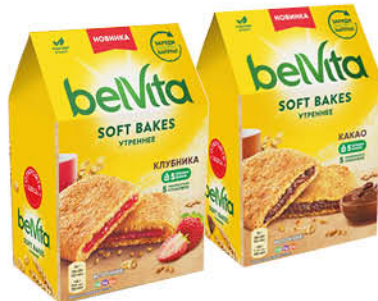
Печенье BELVITA Утреннее мультизлаковое с клубничной начинкой; с начинкой какао, 250 г

139 90 21% Цена по карте ЭКОНОМИЯ 109 90