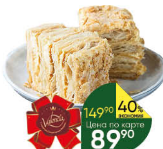
Торт Наполеон ВАЛЕНСИЯ, 300 г* ТОЛЬКО В СУПЕРМАРКЕТАХ Г. ПЕРМЬ