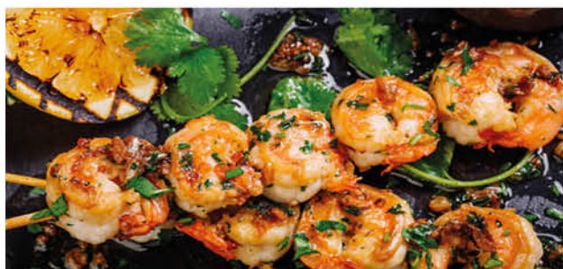
Креветки гриль с чесноком и специями