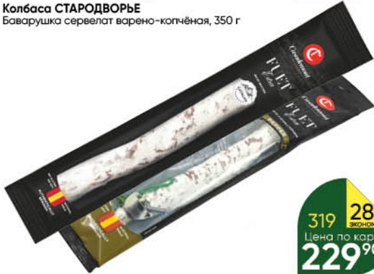
Колбаса СТАРОДВОРЬЕ Баварушка сервелат варено-копченая, 350 г

при покупке 2 шт. цена 279 80 1 на цене 1 139 90 *