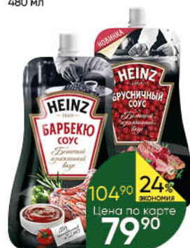
Соус HEINZ в ассортименте, 230 г