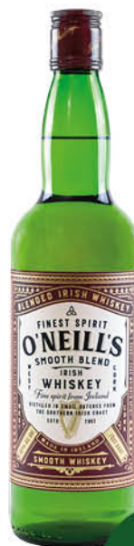
Виски O'NEILL'S купажированный 40%, 0,7 л (Ирландия)

559 90 20% ЭКОНОМИЯ Цена по карте 449 90