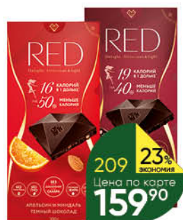
Шоколад RED Delight низкокалорийный в ассортименте, 85-110 г

149 90 20% ЭКОНОМИЯ Цена по карте 119 90