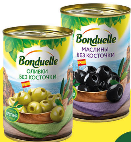
Оливки; Маслины BONDUELLE без косточки, 300 г

194 90 28% Цена по карте ЭКОНОМИЯ 139 90