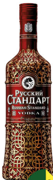
Водка РУССКИЙ СТАНДАРТ Original 40%, 0,5 л (Россия)