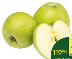
Яблоки Симиренко, 1 кг

144 90 17% ЭКОНОМИЯ Цена по карте 119 90