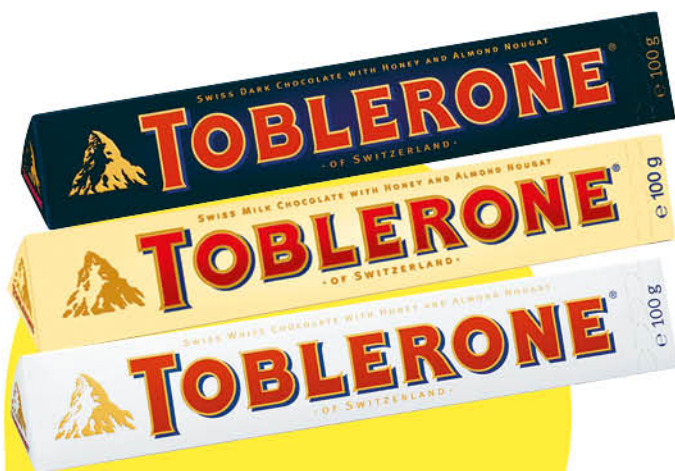
Шоколад TOBLERONE молочный; белый; тёмный с медово-миндальной нугой, 100 г