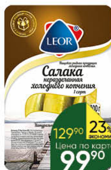
Салака LEOR балтийская неразделанная холодного копчения, 300 г

249 90 20% ЭКОНОМИЯ Цена по карте 199 90