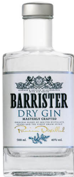
Джин BARRISTER Dry, 40%, 0,5 л (Россия)