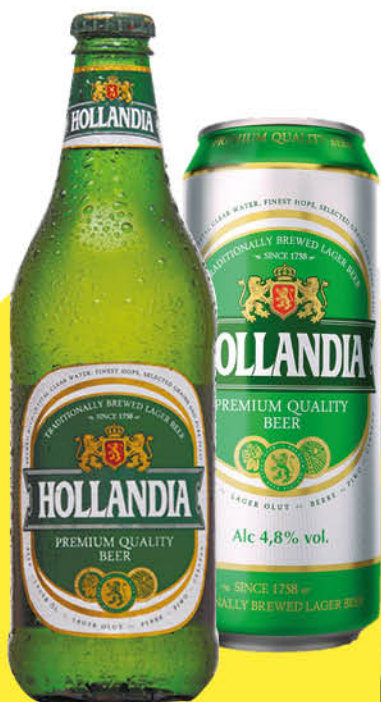
Пиво HOLLANDIA светлое 4,8%, 0,45 л (Россия)