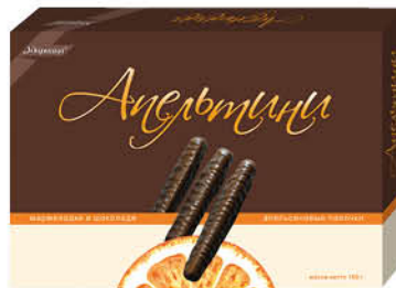
Мармелад УДАРНИЦА Апельсины апельсиновые палочки в шоколаде, 160 г

189 90 32% Цена по карте ЭКОНОМИЯ 129 90