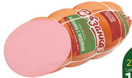
Колбаса с индейкой ВЯЗАНКА вареная, 450 г