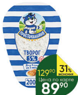
Творог ПРОСТОКВАШИНО 5%, 200 г