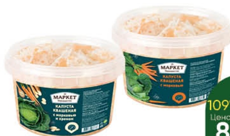
Соленья МАРКЕТ ПЕРЕКРЁСТОК Капуста квашеная с морковью; с морковью-хреном; Томаты черри; Огурцы корнишоны солёные, 500 г