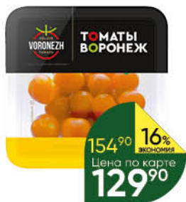
Томаты черри жёлтые, 200 г

154 90 16% ЭКОНОМИЯ Цена по карте 129 90