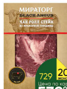
Стейк Чак Ролл МИРАТОРГ из мраморной говядины охлажденный, 570 г