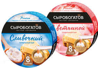
Сыр СЫРОБОГАТОВ плавленный в ассортименте 50 %, 130 г