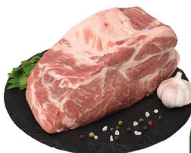
Шейка свинная охлажденная, 1 кг