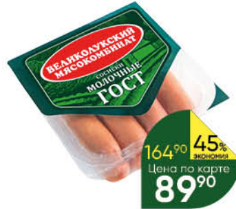
Сосиски Молочные ВЕЛИКОЛУКСКИЙ МК вареные, 330 г

189 90 42% ЭКОНОМИЯ Цена по карте 109 90