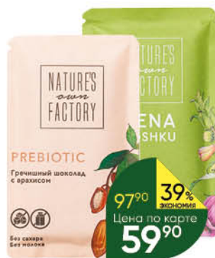
Шоколад NATURE'S OWN FACTORY греческий в ассортименте, 20 г