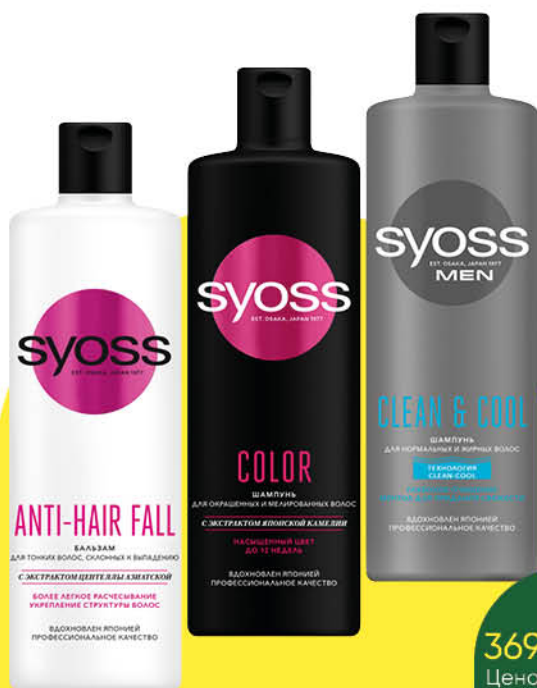
Шампунь; Бальзам SYOSS в ассортименте, 450 мл

369 90 27% ЭКОНОМИЯ Цена по карте 269 90