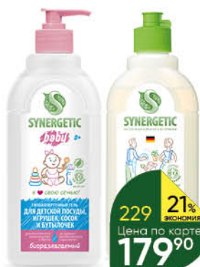
Средство для мытья посуды SYNERGETIC биоразлагаемое; алоэ; для детской посуды, сосок, бутылочек и игрушек, 0,5 л