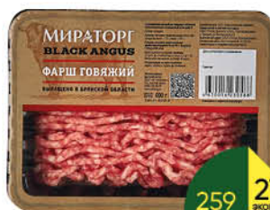
Фарш говяжий МИРАТОРГ охлажденный, 400 г