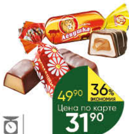
Конфеты СЛАВЯНКА; КРАСНЫЙ ОКТЯБРЬ Лёвушка; Ромашки, 100 г