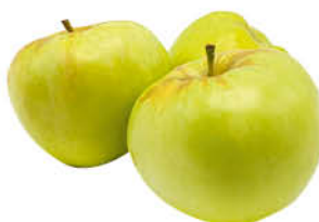
Яблоки Богатырь, 1 кг

149 90 20% ЭКОНОМИЯ Цена по карте 119 90