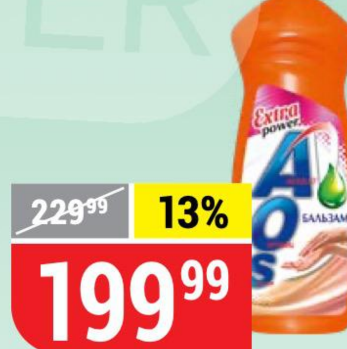
СРЕДСТВО ДЛЯ МЫТЬЯ ПОСУДЫ AOS бальзам, 900 мл 134882