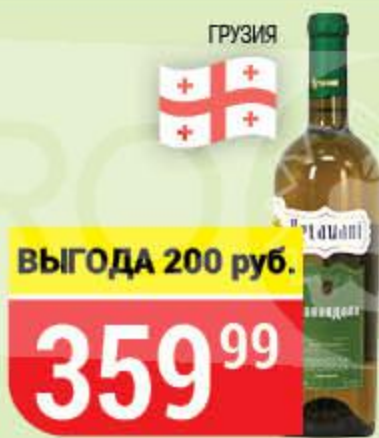
ВИНО KETAVANI цинандали, белое, сухое, 12%, 0,75 л 157212