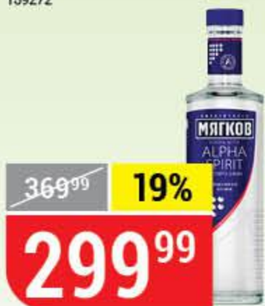
ВОДКА МЯГКОВ на спирте альфа, 40%, 0,5 л 157943