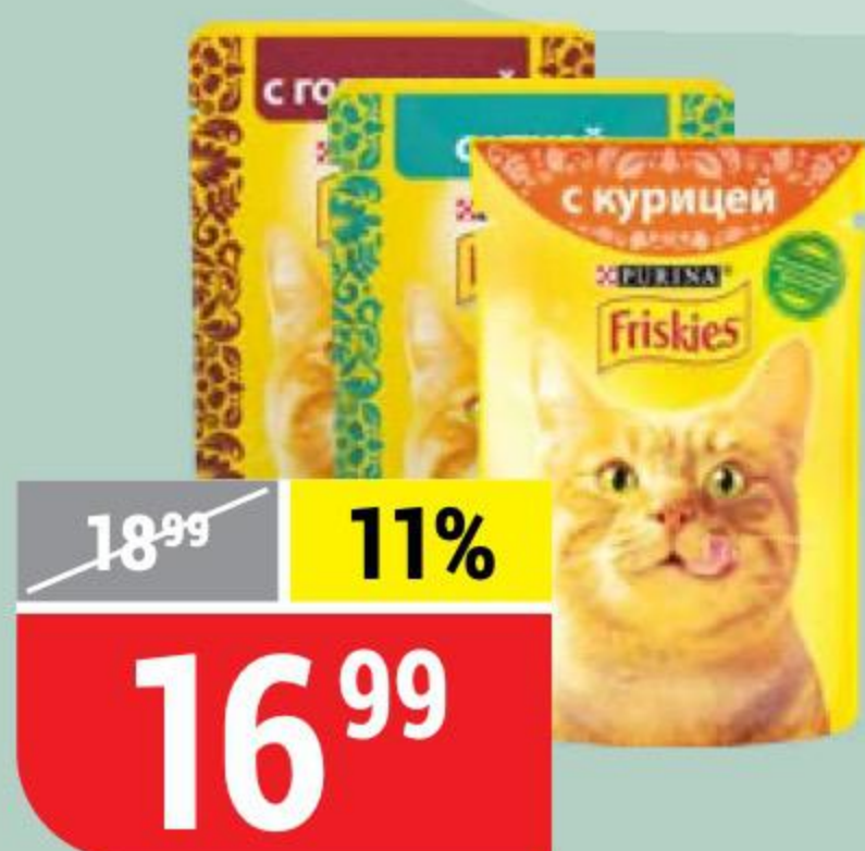
КОРМ ДЛЯ КОШЕК FRISKIES в ассортименте, 85 г 155151/155153/155155