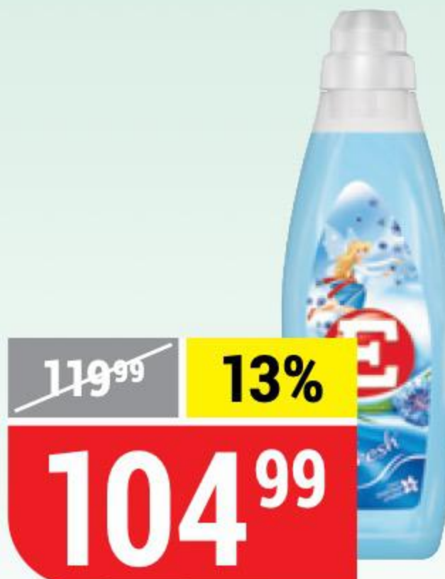
КОНДИЦИОНЕР ДЛЯ БЕЛЬЯ E fresh, 1 л 103001