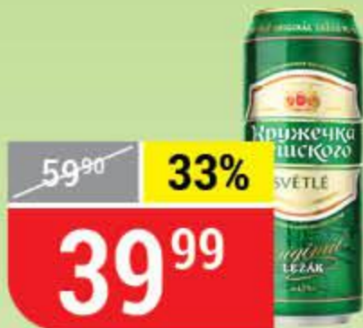
ПИВО КРУЖЕЧКА ЧЕШСКОГО светлое, 4,3%, 0,43 л 162100