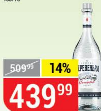
ВОДКА ЗИМНЯЯ ДЕРЕВЕНЬКА солодовая, 40%, 0,7 л 134451