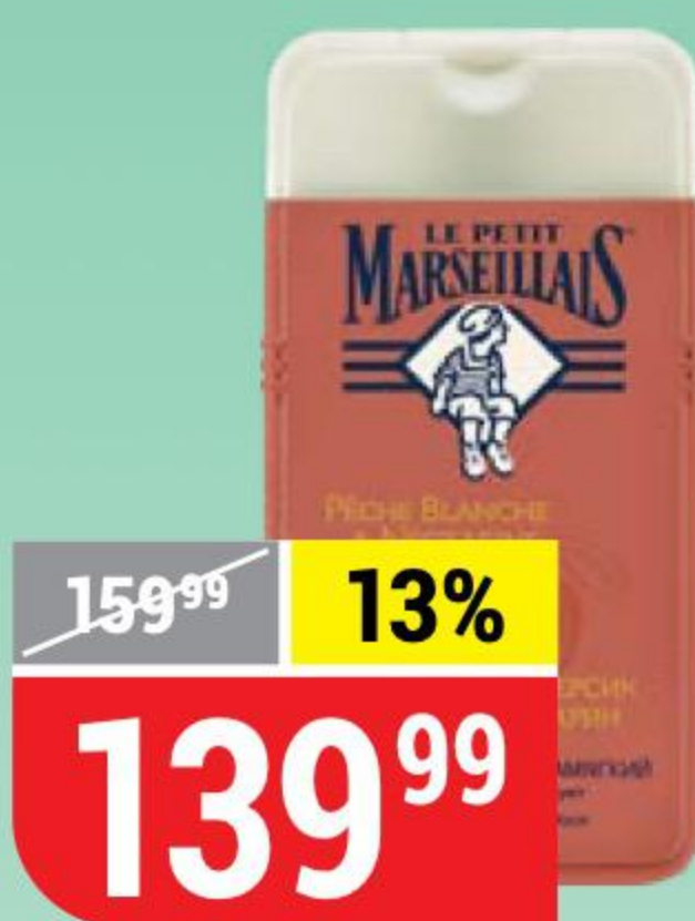
ГЕЛЬ ДЛЯ ДУША LE PETIT MARSEILLAIS белый персик-нектарин, 250 мл 107803