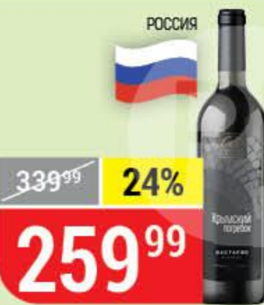
ВИНО КРЫМСКИЙ ПОГРЕБОК бастардо каберне, красное, сухое, 11%, 0,75 л 163512