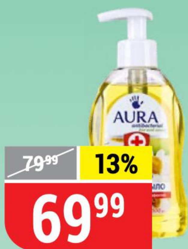
МЫЛО ЖИДКОЕ AURA антибактериальное, с ромашкой, 300 мл 120049