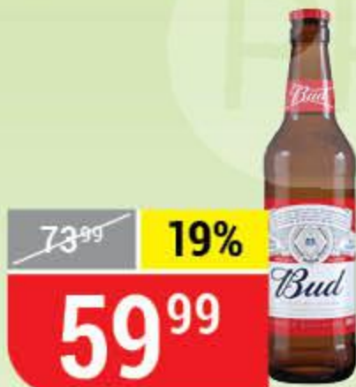
ПИВО BUD светлое, пастеризованное, 5%, 0,44 л 159272