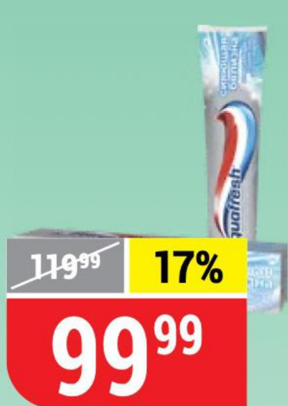
ЗУБНАЯ ПАСТА AQUAFRESH сияющая белизна, 100 мл 145356