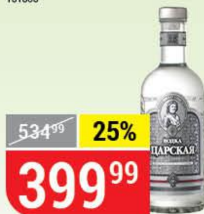
ВОДКА ЦАРСКАЯ ОРИГИНАЛЬНАЯ 40%, 0,5 л 139840