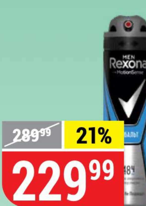
ДЕЗОДОРАНТ-АНТИПЕРСПИРАНТ REXONA мужской, кобальт, 150 мл 137756