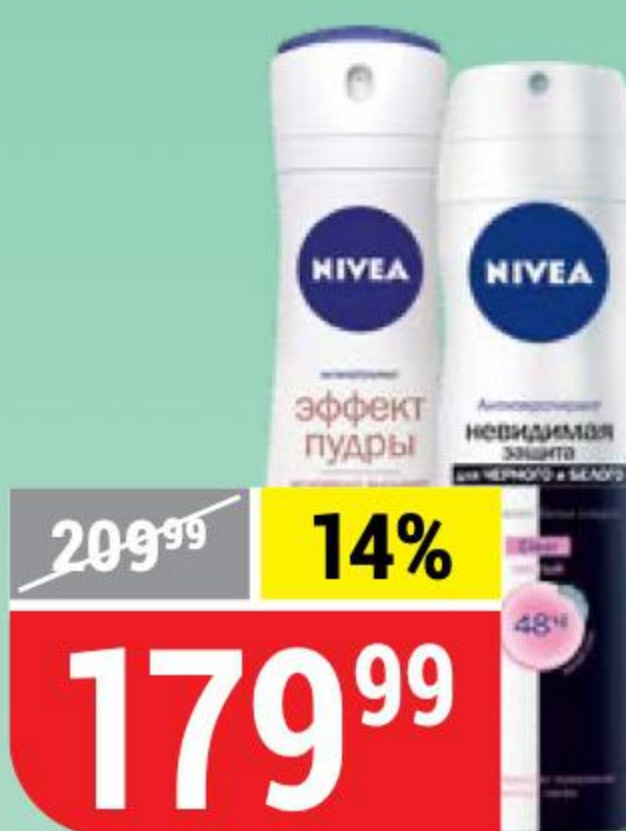
ДЕЗОДОРАНТ-СПРЕЙ NIVEA в ассортименте, 150 мл 110226/140169