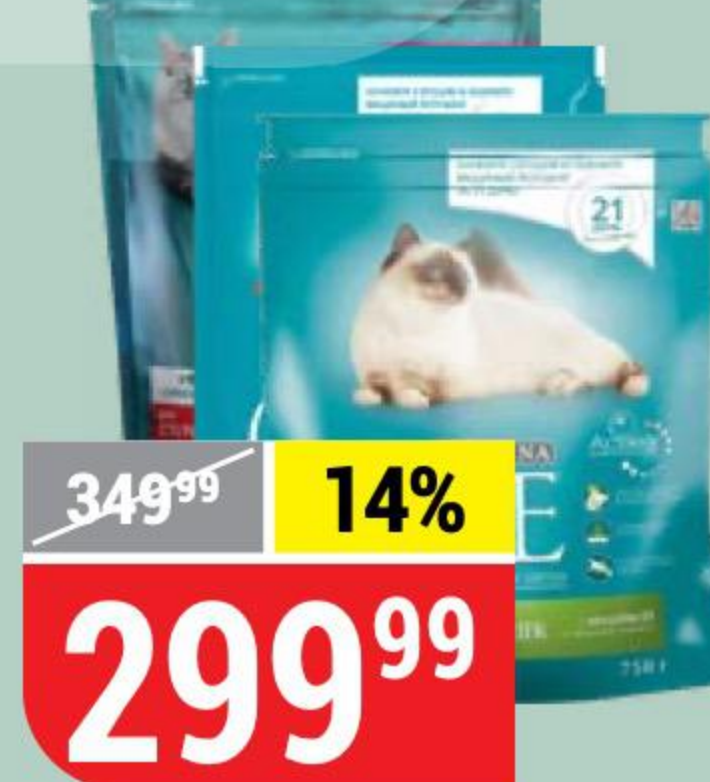
КОРМ ДЛЯ КОШЕК PURINA ONE в ассортименте, 750 г 126801/132155/139653