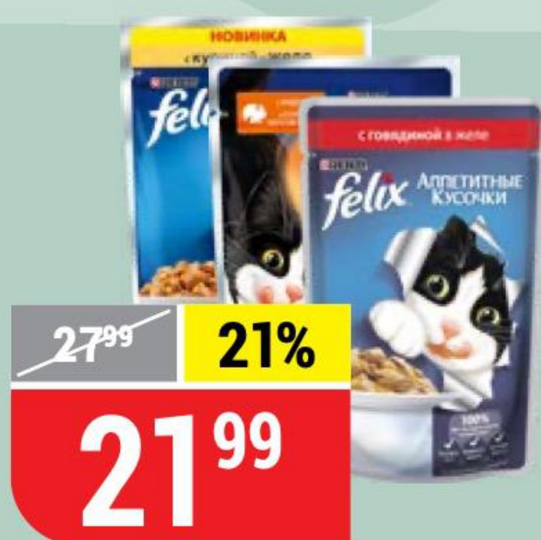
КОРМ ДЛЯ КОШЕК FELIX в ассортименте, 85 г 155051/155065/155129/155131/155133