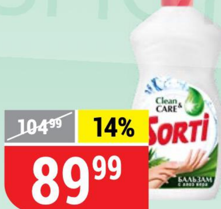
СРЕДСТВО ДЛЯ МЫТЬЯ ПОСУДЫ SORTI бальзам с алоэ вера, 450 г 132413