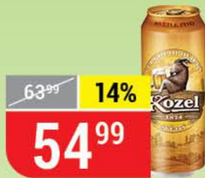
ПИВО VELKOROVICKY KOZEL светлое, 4%, 0,45 л 135441