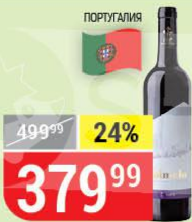
ВИНО PALMELA красное, полусухое, 14%, 0,75 л 160990