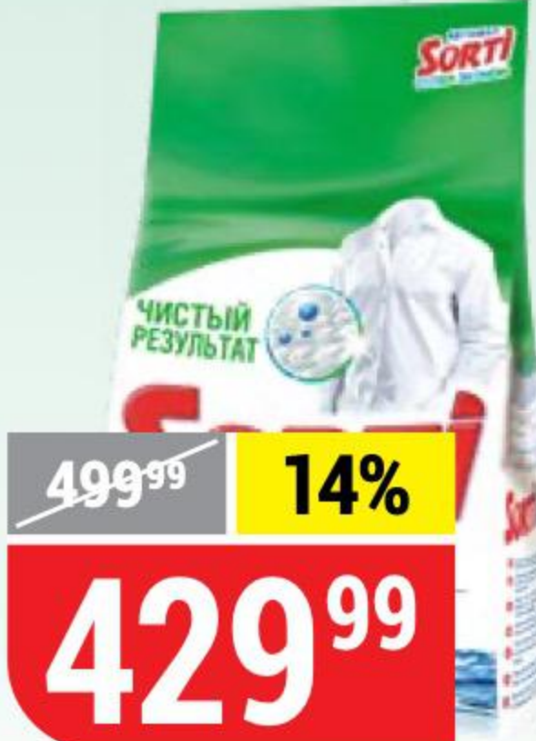
СТИРАЛЬНЫЙ ПОРОШОК SORTI суперэконом, автомат, 3 кг 117804