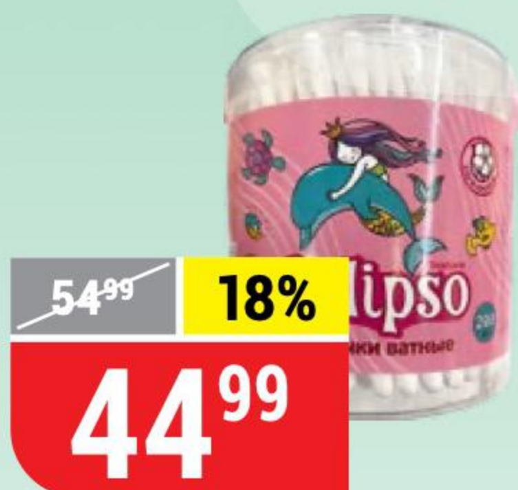
ВАТНЫЕ ПАЛОЧКИ CALIPSO стакан, 200 шт. 140612