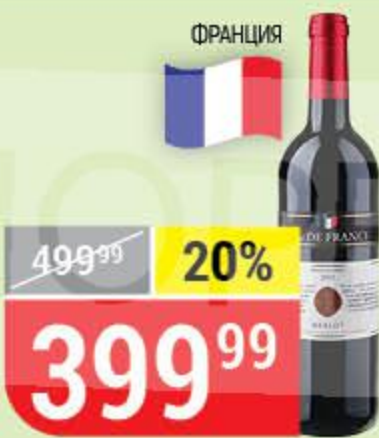
ВИНО VIN DE FRANCE merlot pays d'oc, красное, сухое, 13%, 0,75 л 163418