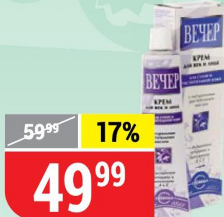
КРЕМ ДЛЯ ВЕК И ЛИЦА ВЕЧЕР Свобода, 41 г 148087