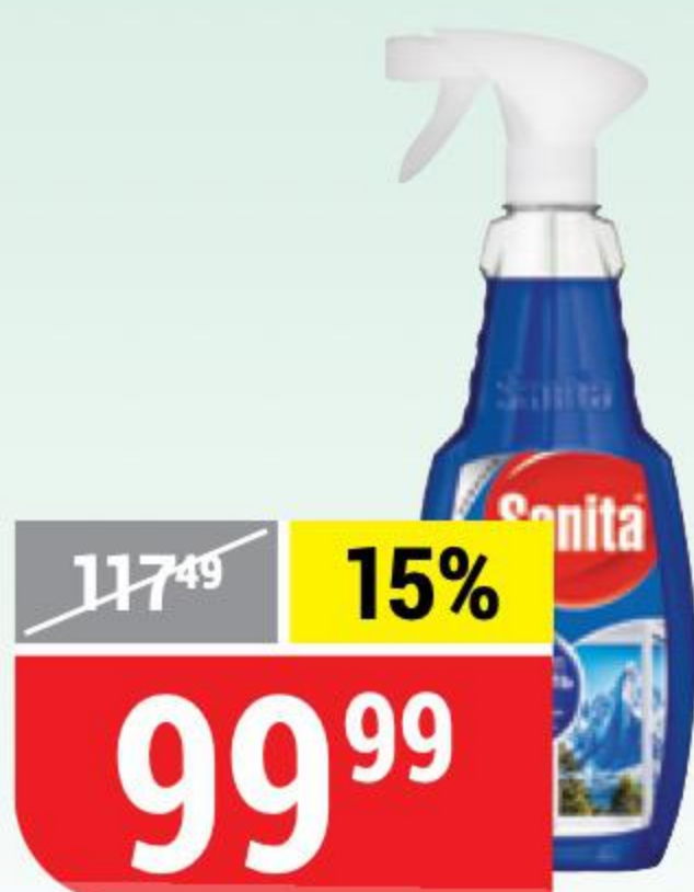
СРЕДСТВО ДЛЯ СТЕКОЛ SANITA антипыль, 500 г 110049