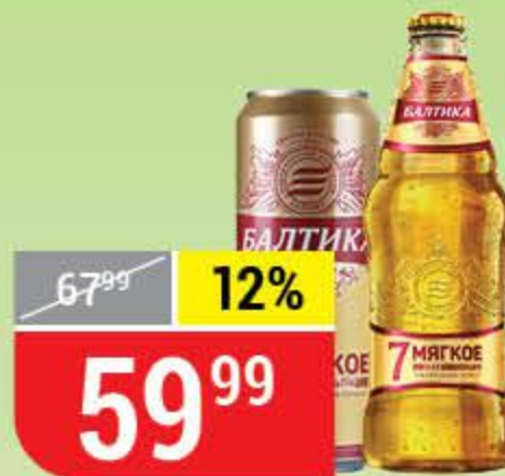
ПИВО БАЛТИКА №7 мягкое, светлое, 4,7%, 0,44-0,45 л 144307/144305