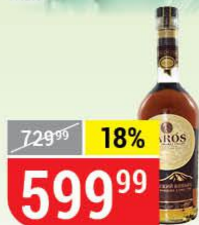
КОНЬЯК TAROS армянский, 3 года, 40%, 0,5 л 163594