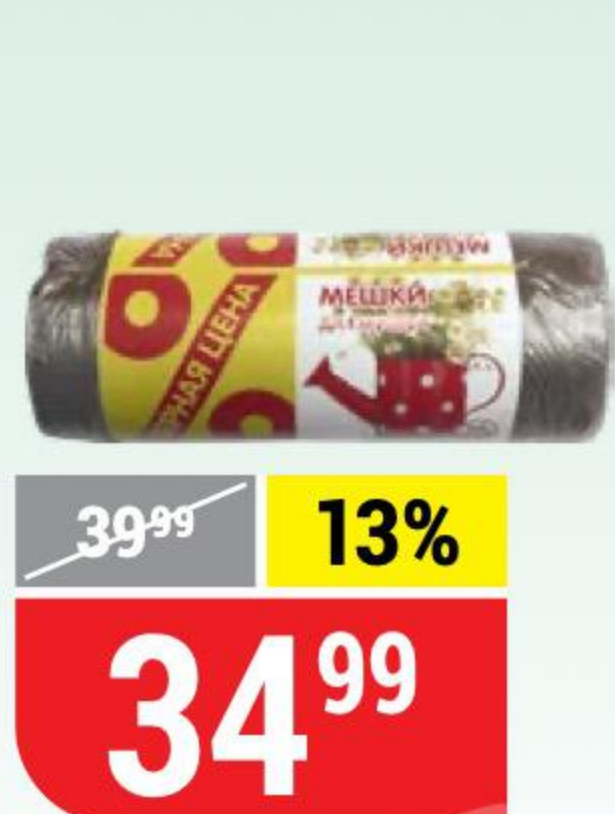
МЕШКИ ДЛЯ МУСОРА Верная Цена, 30 л, 30 шт. 108537