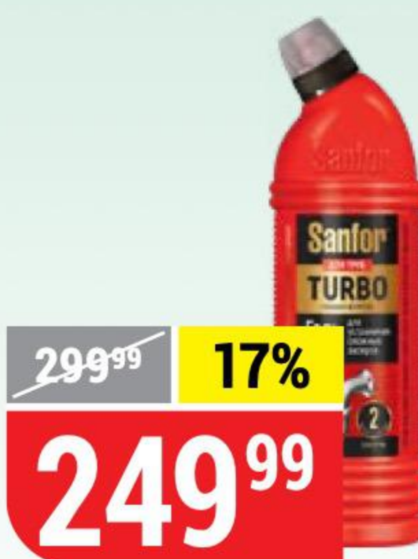
ЧИСТЯЩЕЕ СРЕДСТВО SANFOR turbo, для труб, 750 г 157484