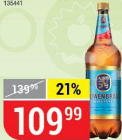
ПИВО LOWENBRAU ORIGINAL 5,4%, 1,3 л 151805