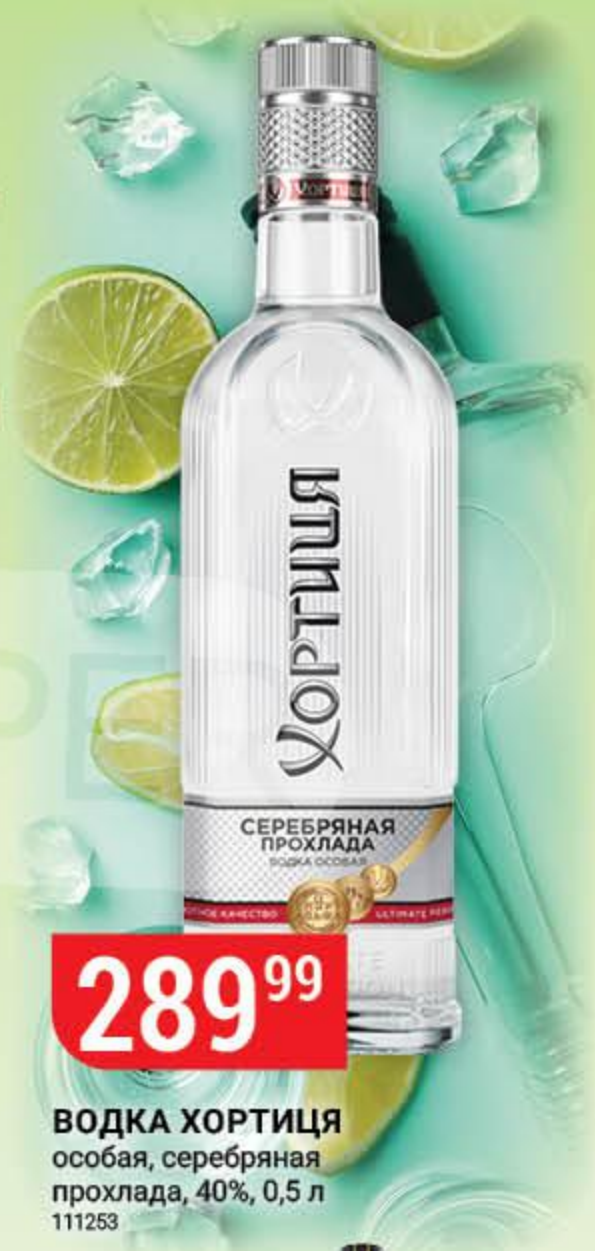
ВОДКА ХОРТИЦА особая, серебряная прохлада, 40%, 0,5 л 111253