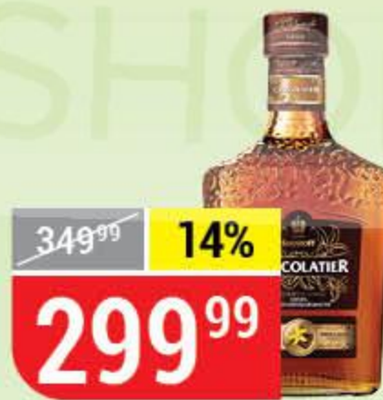
КОКТЕЙЛЬ SHUSTOFF CHOCOLATIER шоколад-ваниль, 30%, 0,5 л 163778