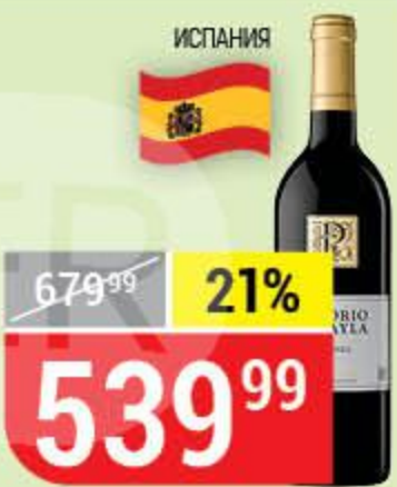
ВИНО SENORIO DE PRAYLA crianza rioja, красное, сухое, 13%, 0,75 л 163432