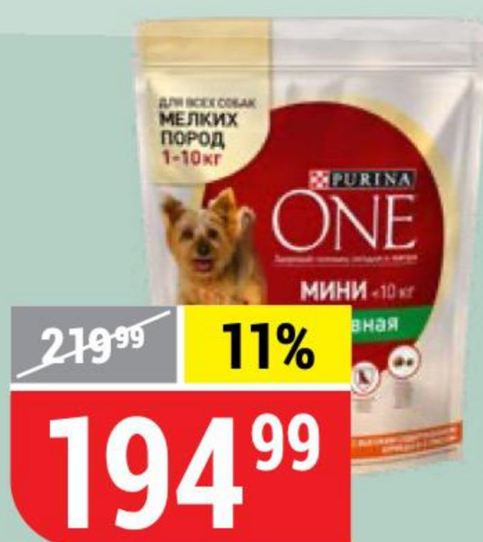
КОРМ ДЛЯ СОБАК PURINA ONE для мелких пород, курица-рис, 600 г 116720