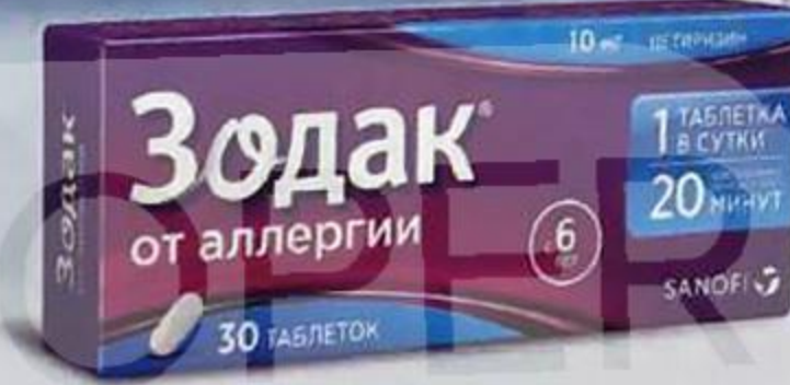
ТАБЛ. П. О. 10 МГ, №30 П N013867/01