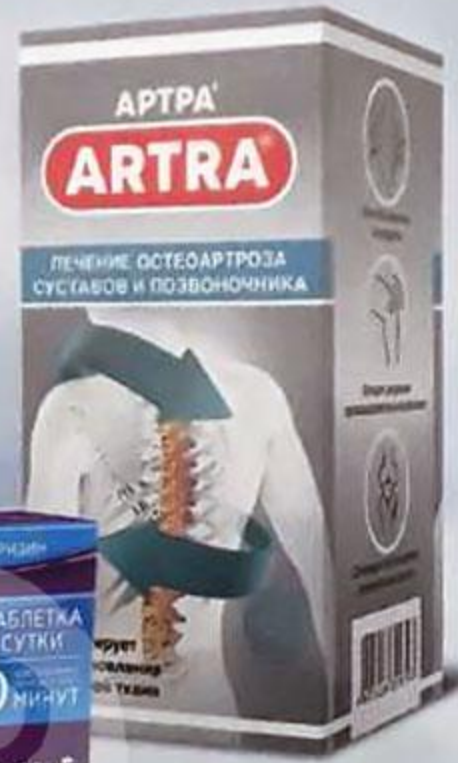
ТАБЛ. П. О. №120 П N014829/01