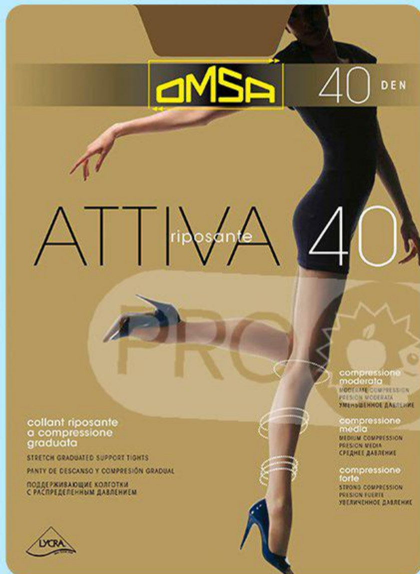
Колготки Omsa Attiva, 40 den