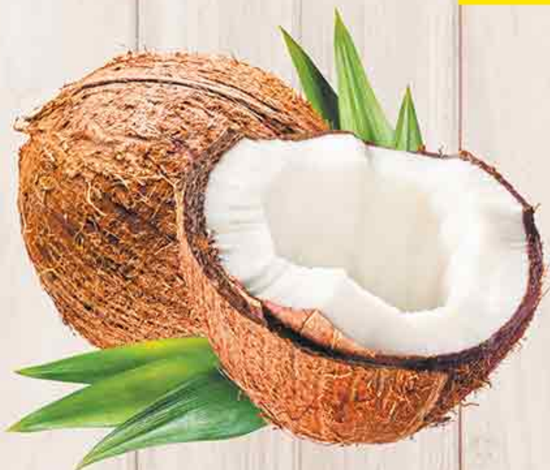
КОКОС 1 ШТ. 49,90