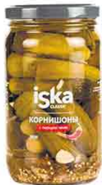
КОРНИШОНЫ С ПЕРЦЕМ ЧИЛИ ISKA 350 Г