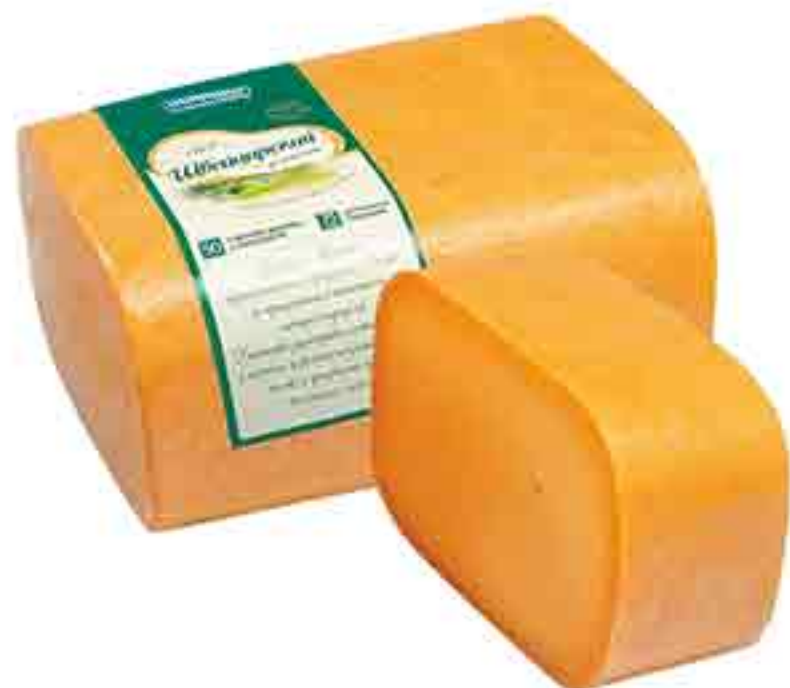
СЫР ШВЕЙЦАРСКИЙ ТВЁРДЫЙ КИПРИНО 100 Г