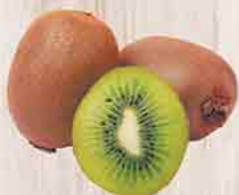
КИВИ 1 КГ