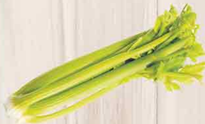
СЕЛЬДЕРЕЙ СТЕБЕЛЬ 1 КГ