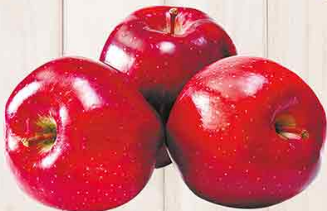
ЯБЛОКИ РЕД ДЕЛИШЕЗ 1 КГ