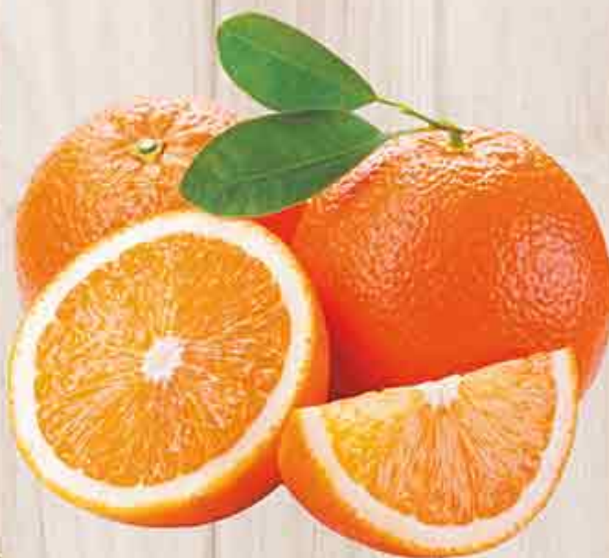
АПЕЛЬСИНЫ 1 КГ