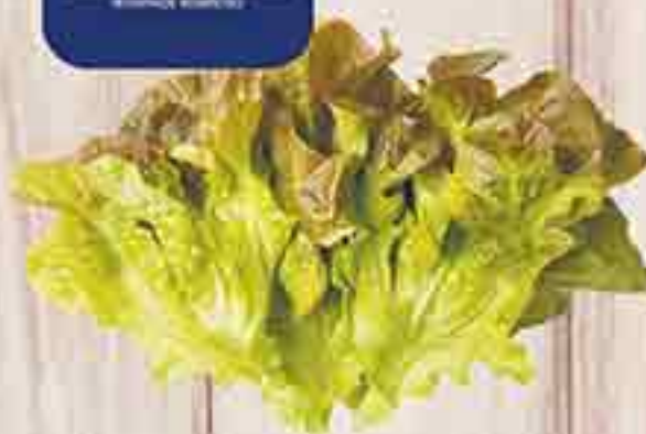
ЗЕЛЕНЬ САЛАТА ДУБОЛИСТНЫЙ/ МАНГОЛЬД ГОРКУНОВ 1 ШТ.