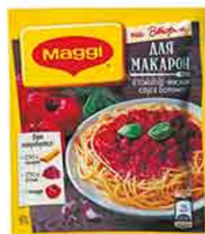
СМЕСЬ ДЛЯ МАКАРОН БОЛОНЕЗ MAGGI НА ВТОРОЕ 40 Г