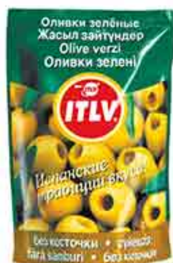
ОЛИВКИ ITLV 195 Г