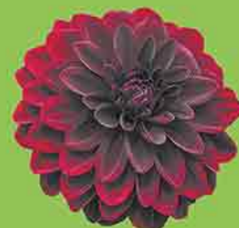
ГЕОРГИНЫ ДЕКОРАТИВНЫЕ АРАБИАН НАЙТ ГЭЛЛЕРИ АРТ ФЭР СИДЛЕР ШТОЛЬЦЕ 1 ЛУКОВИЦА