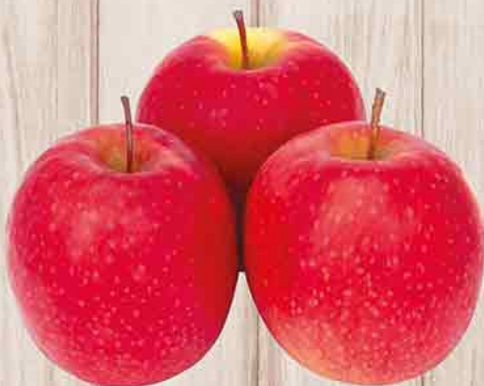
ЯБЛОКИ КРИПС ПИНК 1 КГ 139,90