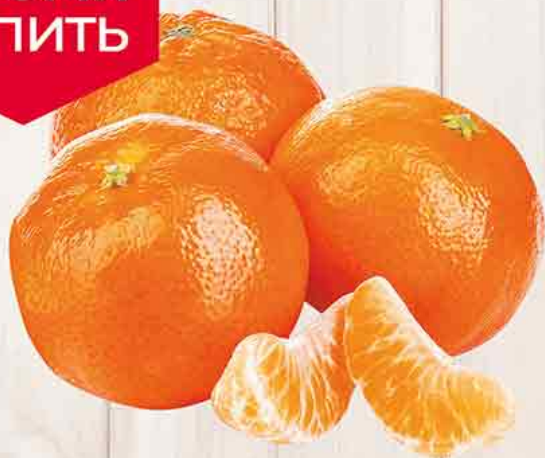
МАНДАРИНЫ МАРОККО 1 КГ 169,90