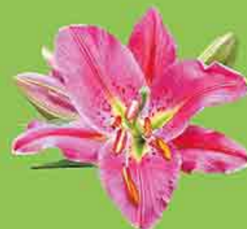
ЛИЛИЯ АЗИАТСКАЯ ВОСТОЧНАЯ БЛЭК АУТ ЛЕВИ ФУРИО 1 ЛУКОВИЦА