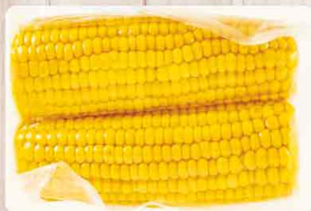
КУКУРУЗА СЛАДКАЯ 1 ШТ. 99,90