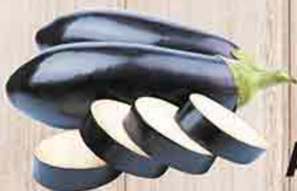
БАКЛАЖАНЫ ИМПОРТ 1 КГ