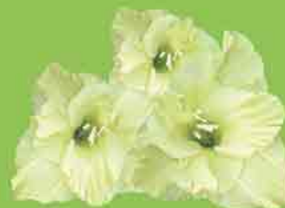
ГЛАДИОЛУС КРУПНОЦВЕТКОВЫЙ ПИПЕР ПИРС ВАЙН ПРОСПЕРИТИ ГРИН СТАР 2 ЛУКОВИЦЫ