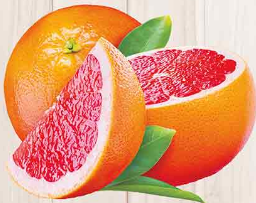
ГРЕЙФРУТЫ 1 КГ 169,90