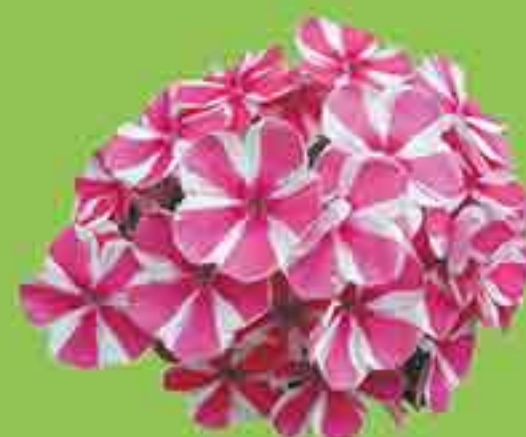
ФЛОКС МЕТЕЛЬЧАТЫЙ АМЕТИСТ ВИНДЗОР ЛАВЕНДЕЛ ВОЛЬКЕ 1 ЛУКОВИЦА