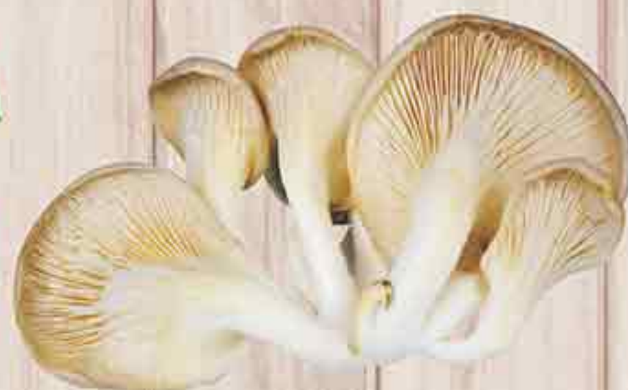
ГРИБЫ СВЕЖИЕ ВЕШЕНКИ 300 Г 109,90