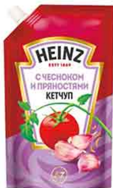
КЕТЧУП С ЧЕСНОКОМ И ПРЯНОСТЯМИ ТОМАТНЫЙ HEINZ, 320 Г