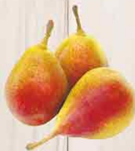
ГРУШИ НОВЫЙ УРОЖАЙ 1 КГ