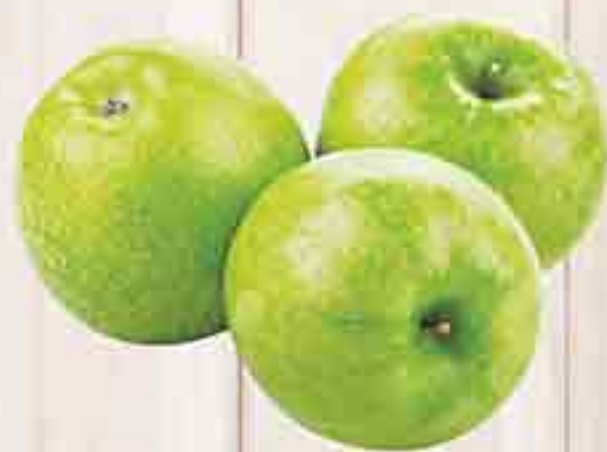
ЯБЛОКИ СЕМЕРИНКА 1 КГ