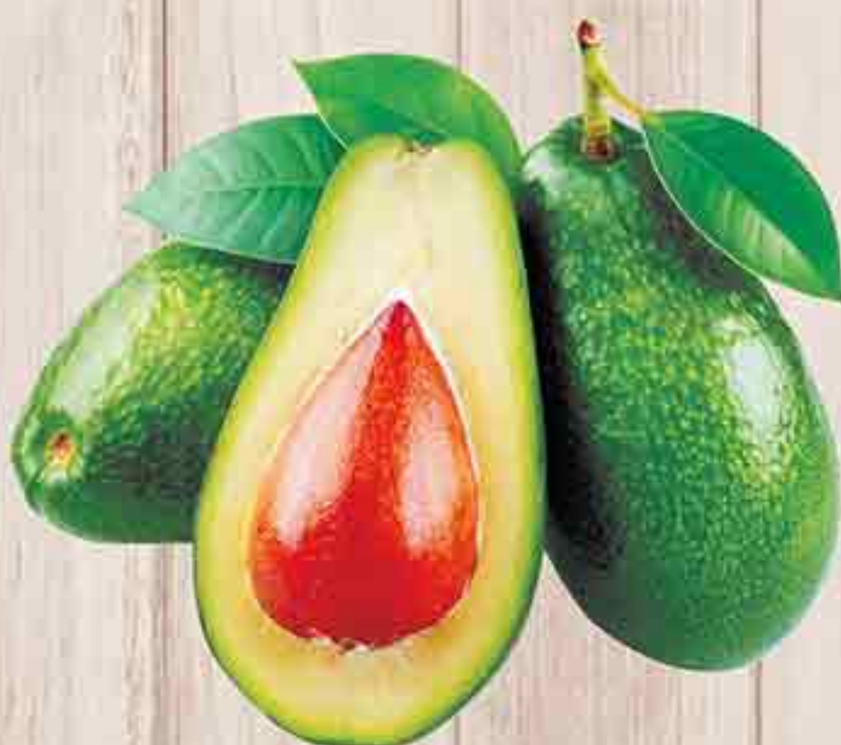
АВОКАДО 1 ШТ. 69,90