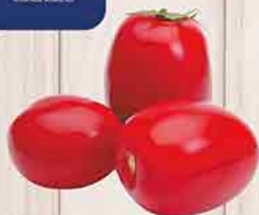
ТОМАТЫ СЛИВКА ГОРКУНОВ 600Г