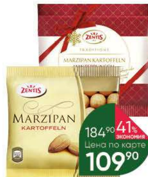
Картошка марципановая ZENTIS классическая; со вкусом зимнего пунша, 100 г