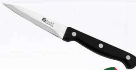
Нож APOLLO Sapphire для овощей, 9 см

144 90 24% Экономия Цена по карте 109 90