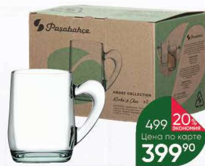
Кружка PASABAHCE Recycled Mocha & Chai 335 мл, 2 шт.