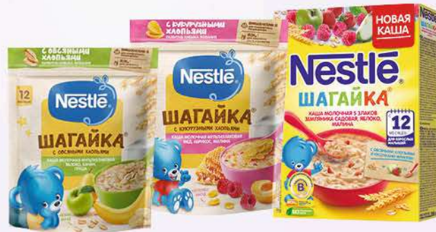
Каша NESTLE в ассортименте с 12 мес., 190-200 г