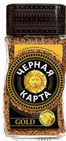
Кофе ЧЁРНАЯ КАРТА Gold растворимый, 95 г