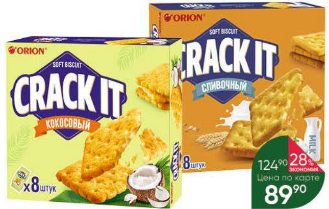
Печенье ORION Crack it сливочный; кокосовый, 144-160 г