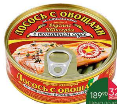
Лосось ВКУСНЫЕ КОНСЕРВЫ с овощами по-итальянски в томатном соусе, 230 г

189 90 32% экономия Цена по карте 129 90