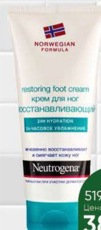
Крем для ног NEUTROGENA Norwegian Formula восстанавливающий, 100 мл

209 90 19% экономия Цена по карте 169 90