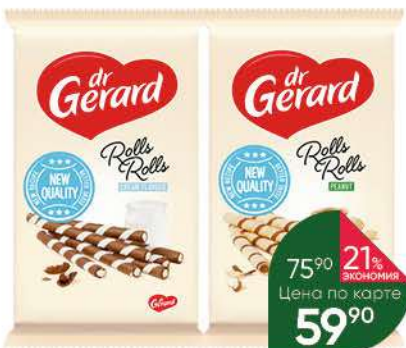
Вафельные трубочки DR GERARD с какао и сливочным; ореховым кремом, 112 г