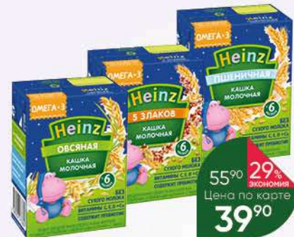
Кашка HEINZ готовая молочная в ассортименте, 200 мл