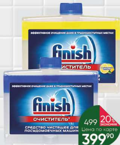
Очиститель для посудомоечных машин FINISH без аромата; с ароматом лимона, 250 мл