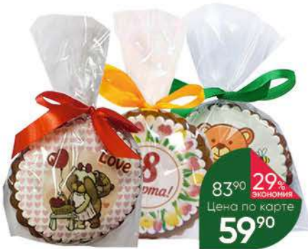
Печенье PETRA Искушение, 60 г