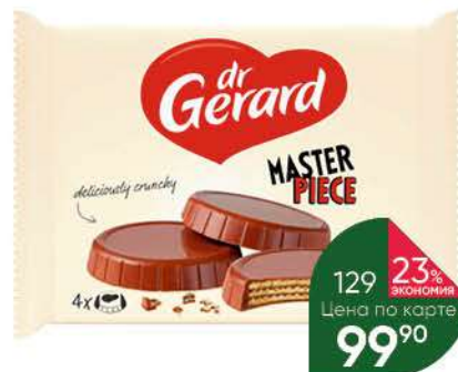
Вафли DR GERARD с какао-ореховым кремом, 114 г