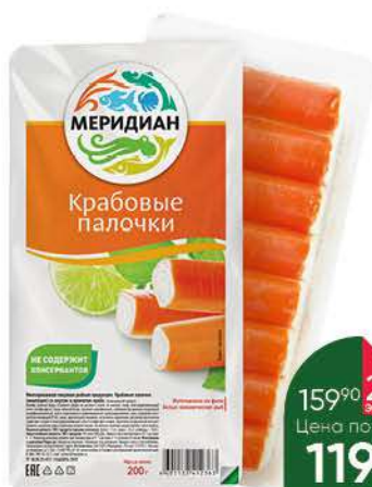
Крабо́вые палочки МЕРИДИАН охлаждённые, 200 г

159 90 25% экономия Цена по карте 119 90