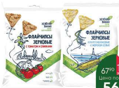
Флайчипсы ЗЕЛЁНАЯ ЛИНИЯ зерновые с томатами и оливками; кукурузно-рисовые с солью, 40 г