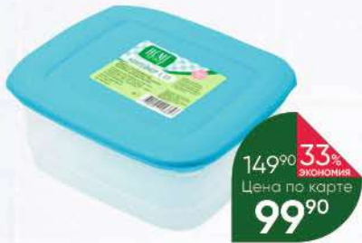
Контейнер HOME STORY, 0,8 л

149 90 20% Экономия Цена по карте 119 90