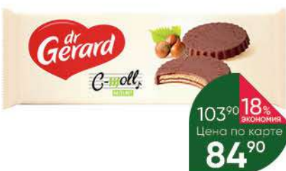
Вафли DR GERARD в молочном шоколаде с какао-кремом, 100 г