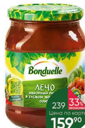
Лечо BONDUELLE , 500 мл