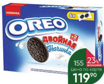
Печенье OREO с какао и двойной начинкой с ванильным вкусом, 170 г