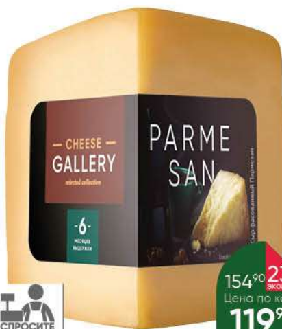
Сыр CHEESE GALLERY Parmesan 32%, 100 г

154 90 23% экономия Цена по карте 119 90