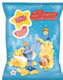
Палочки кукурузные УХТЫШКИ сладкие, 140 г

Морковь вымойте, почистите, натрите на тёрке. Муку просейте через сито. Подготовьте миксер и силиконовые формочки. Разогрейте духовку до 190 градусов. Муку смешайте с разрыхлителем, солью, пищевой содой и пряностями. Объедините яйца с маслом и сахаром, взбейте миксером до кремообразного состояния. Введите морковь, добавьте ванильный экстракт, перемешайте до однородности. Работая на малых оборотах, постепенно введите мучную смесь. Распределите тесто по формочкам, разровняйте его по поверхности. Поставьте в средний отдел духового шкафа на 20–25 минут.