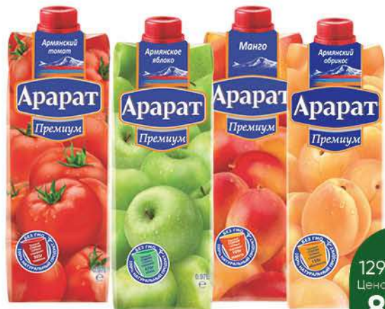
Сок; Нектар АРАРАТ Premium в ассортименте, 0,97 л