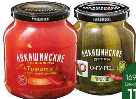
Консервы овощные ЛУКАШИНСКИЕ Томаты южные в томатной мякоти; Огурцы солёные по-домашнему, 350–670 г

169 90 29% экономия Цена по карте 119 90