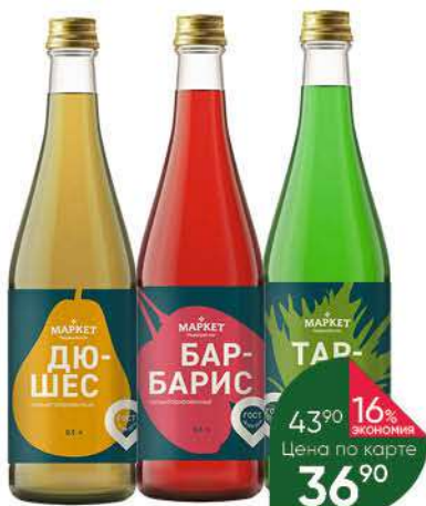
Напиток МАРКЕТ ПЕРЕКРЁСТОК в ассортименте сильногазированный, 0,5 л

159 90 19% экономия Цена по карте 129 90