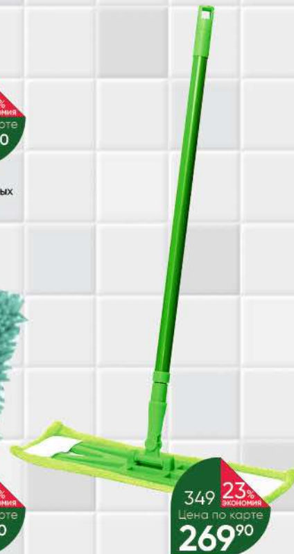
Швабра HOME STORY для дома со сменной насадкой

Товар представлен не во всех супермаркетах «Перекрёсток».