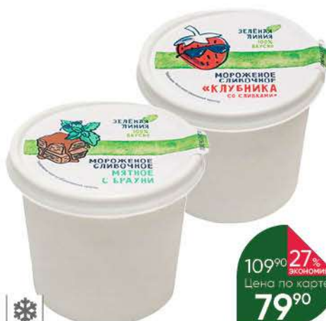
Мороженое ЗЕЛЁНАЯ ЛИНИЯ клубника со сливками; мятное с брауни 10%, 75 г

Подготовьте творожную массу. Протрите творог через сито до получения однородной рассыпчатой массы. Перелейте желтки в жаропрочную ёмкость, добавьте сахар. Поставьте ёмкость на водяную баню и нагрейте, взбивая, пока масса не посветлеет. Смешайте желтки с сахаром и творогом, добавьте сливки, сливочное масло и хорошо перемешайте. Приготовьте творожную пасху с цукатами. В творожную массу выложите цукаты и ванильный сахар, тщательно размешайте. Застелите форму для пасхи двойным слоем марли, переложите в неё творожную массу. Закройте её свободными краями марли, поставьте сверху тарелку с грузом. Форму поместите в миску, где будет собираться сыворотка, и поставьте в холодильник на 6–8 часов. Аккуратно переверните форму с пасхой на сервировочное блюдо, снимите форму и марлю.