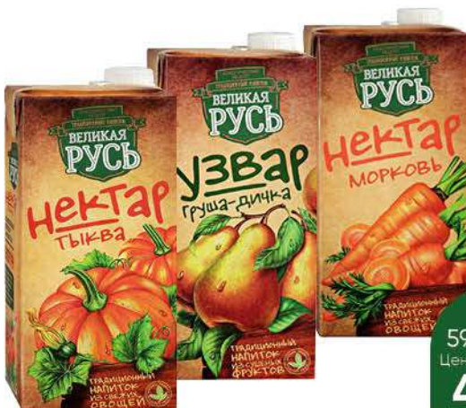
Нектар; Узвар ВЕЛИКАЯ РУСЬ в ассортименте, 1 л