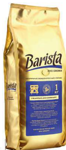
Кофе BARISTA Pro Crema в зёрнах, 1 кг