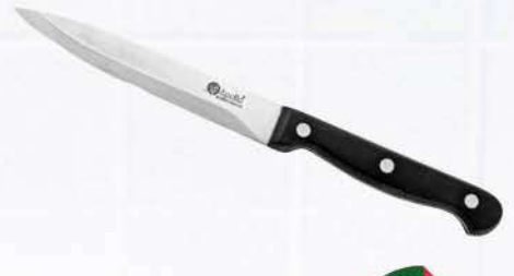
Нож APOLLO Sapphire универсальный, 13 см

144 90 24% Экономия Цена по карте 109 90