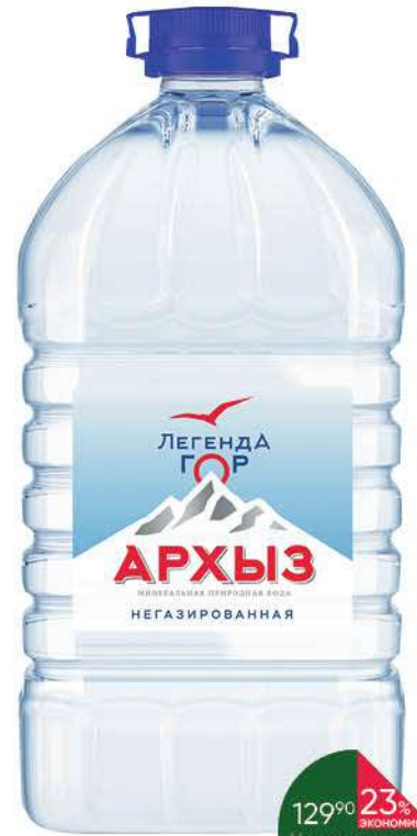
Вода АРХЫЗ Легенда гор питьевая негазированная, 5 л