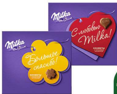
Набор конфет MILKA из молочного шоколада с молочной; ореховой начинкой, 110 г