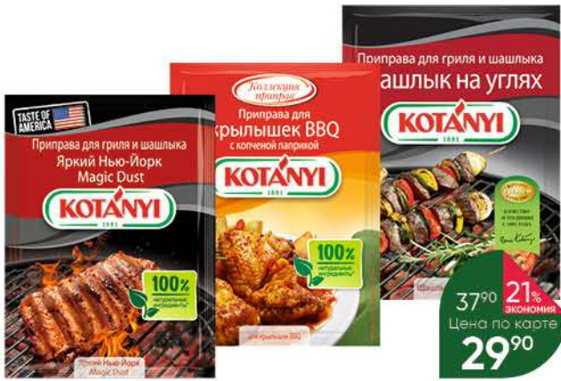
Специи; Приправы KOTANYI в ассортименте, 20-30 г