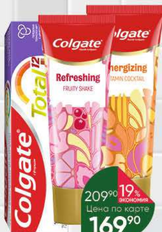
Зубная паста COLGATE Fruity Shake; Vitamin Cocktail; Total Pro здоровье десен, 75 мл

209 90 19% экономия Цена по карте 169 90