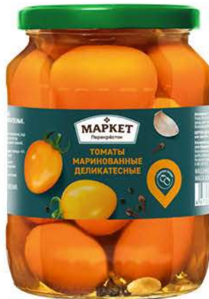
Томаты МАРКЕТ ПЕРЕКРЁСТОК маринованные деликатесные, 680 г

Нарежьте баклажаны. Выложите пластинки баклажанов в горячее масло, обжаривайте с каждой стороны, пока они не станут золотистыми. Выложите обжаренные баклажаны на тарелку, застеленную бумажными салфетками, чтобы избавиться от излишков масла. Приготовьте начинку. В чаше блендера соедините грецкие орехи, кинзу и петрушку, чеснок, соль, хмели-сунели и соус наршараб. Перебейте до однородной массы. Затем добавьте 1–2 ст. л. тёплой воды и ещё раз перемешайте. Равномерно распределите массу на пластинках баклажана и сверните их в рулеты.