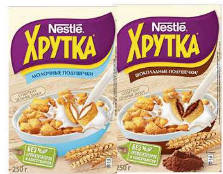
Сухой завтрак NESTLE Хрутка подушечки мультизлаковые молочная; шоколадная начинка, 250 г