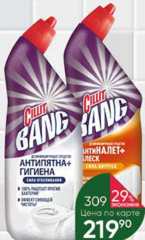
Средство CILLIT BANG Антипятна + гигиена; Антиналёт + блеск сила цитруса, 750 мл