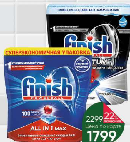
Средство для посудомоечных машин FINISH таблетки All in 1 Max, 100 шт.; капсулы Quantum Ultimate, 60 шт.