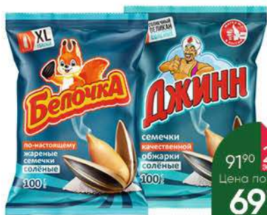
Семена подсолнечника ДЖИНН; БЕЛОЧКА жареные солёные, 100 г