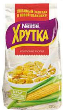
Сухой завтрак NESTLE Хрутка хлопья кукурузные, 320 г