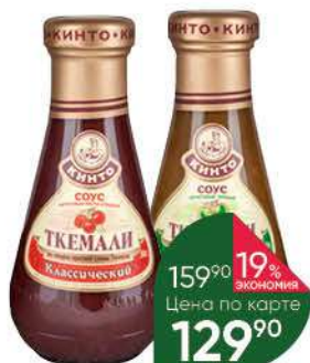
Соус КИНТО Ткемали классический; ранний, 300 г

159 90 19% экономия Цена по карте 129 90