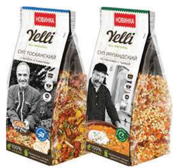
Суп YELLI Ирландский из перловки с тывкой; Тосканский с полбой и томатами, 200 г