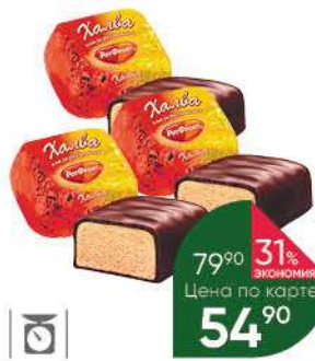
Халва РОТФРОНТ глазированная, 100 г