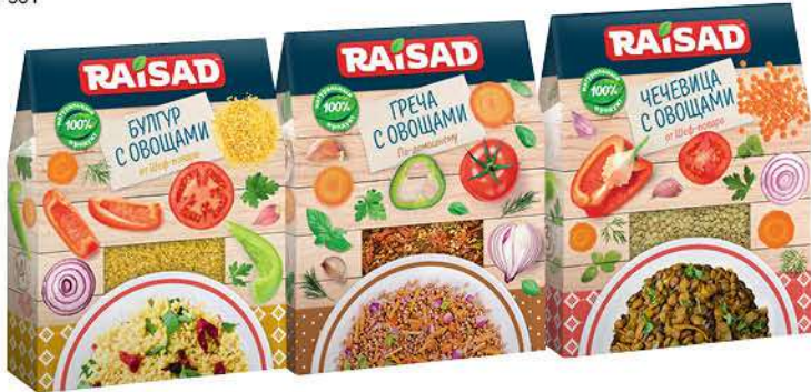
Гарнир RAISAD греча; булгур; чечевица с овощами, 200 г