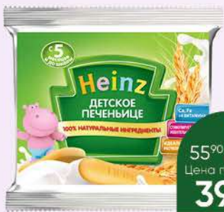
Печенье HEINZ Детское печенье, 60 г