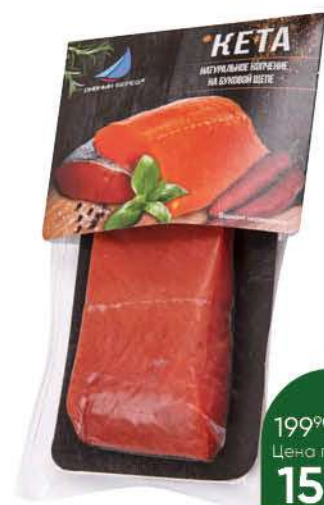
Кета ДИВНЫЙ БЕРЕГ филе-кусоч холодного копчения, 130 г

189 90 32% экономия Цена по карте 129 90