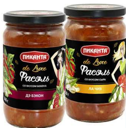
Фасоль ПИКАНТА De Luxe Де Бэкон со вкусом бекона; Ла Чиз со вкусом сыра, 360 г