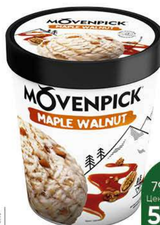
Мороженое MOVENPICK Maple walnut 12%, 298 г