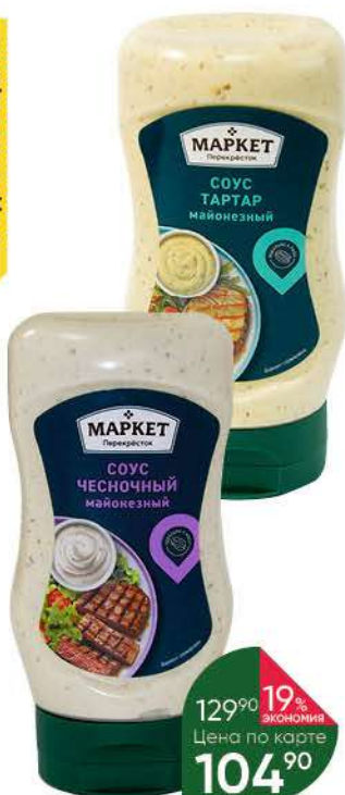
Соус майонезный МАРКЕТ ПЕРЕКРЁСТОК Чесночный; Тартар, 300 мл

129 90 19% экономия Цена по карте 104 90