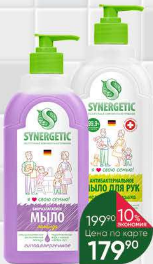
Мыло SYNERGETIC жидкое антибактериальное лаванда; мелисса и ромашка, 0,5 л