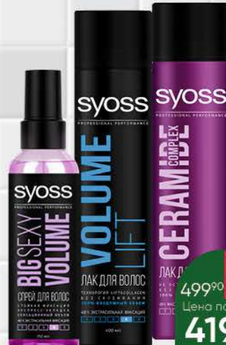
Средство для укладки волос SYOSS спрей; лак в ассортименте, 150-400 мл

489 90 18% экономия Цена по карте 399 90