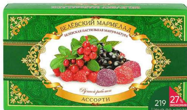
Мармелад БЕЛЁВСКАЯ МАПУФАКТУРА ассорти, 260 г