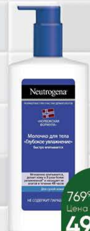
Молочко для тела NEUTROGENA глубокое увлажнение, 250 мл

519 90 25% экономия Цена по карте 389 90