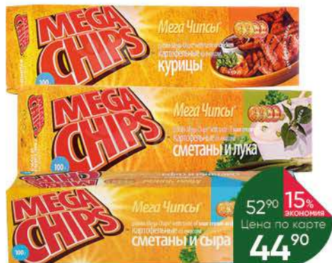
Чипсы картофельные БЕЛПРОДУКТ Mega Chips в ассортименте, 100 г