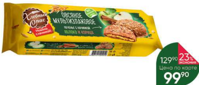
Печенье ХЛЕБНЫЙ СПАС сдобное овсяное мультизлаковое яблоко-корица, 250 г