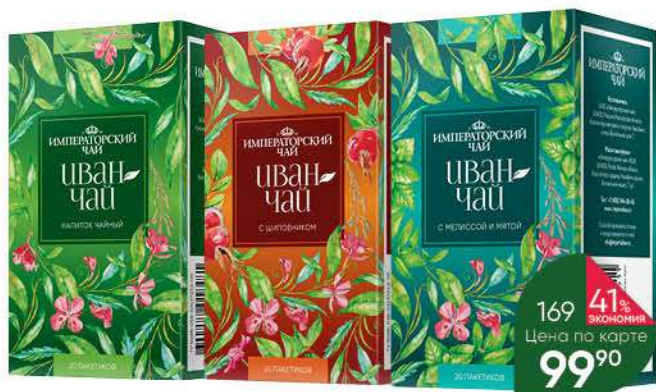
Чай травяной ИМПЕРАТОРСКИЙ Иван-чай в ассортименте, 20 x 1,2 г