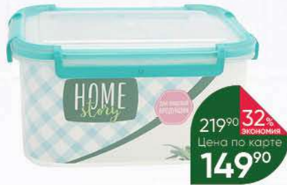
Контейнер HOME STORY, 1,6 л

219 90 32% Экономия Цена по карте 149 90