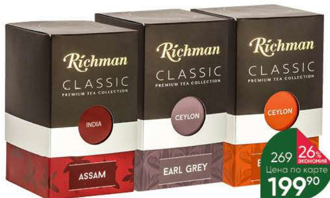
Чай чёрный RICHMAN Flowerly Broken Orange Pekoe; Orange Pekoe с ароматом бергамота; India Assam листовой, 100 г