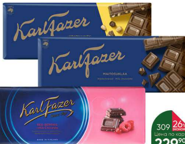
Шоколад KARL FAZER молочный; с цельным фундуком; малина-клюква, 200 г