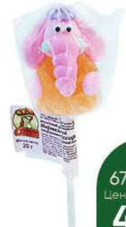
Мармелад МАРМЕЛАДНАЯ СКАЗКА желейный формовой, 20 г