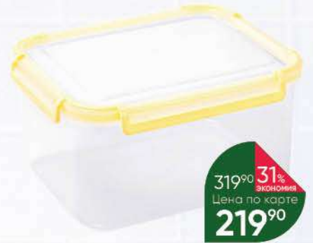
Контейнер HOME STORY, 2,75 л

219 90 32% Экономия Цена по карте 149 90