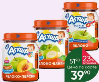
Пюре АГУША яблоко; яблоко-банан; яблоко-персик с 4-6 мес., 100 г