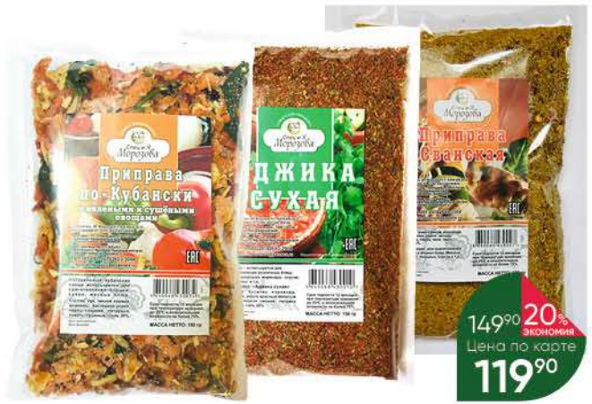
Приправа СПЕЦ и Я МОРОЗОВА Сванская; Аджика сухая; По-кубански, 150 г