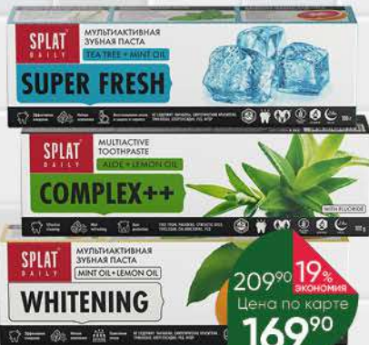
Зубная паста SPLAT Daily Complex; Whitening; Super Fresh, 100 г

539 90 17% экономия Цена по карте 449 90