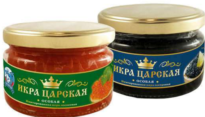
Икра лососёвая; осетровая ЦАРСКАЯ имитированная, 220 г