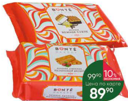
Печенье BONTE Bakery Малиновый десерт; Нежное суфле, 240-270 г