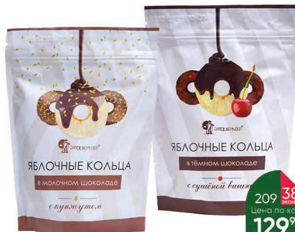
Кольца яблочные ЭКОФЕРМЕР в молочном шоколаде с кунжутом; в тёмном шоколаде с сушёной вишней, 100 г

184 90 30% ЭКОНОМИЯ Цена по карте 129 90