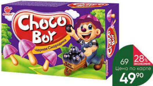
Печенье ORION Chocoboy Black Currant, 45 г