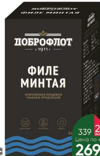
Минтай ДОБРОФЛОТ филе без кожи, 520 г