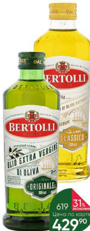
Масло оливковое BERTOLLI Olive Oil Classico нерафинированное; рафинированное с добавлением нерафинированного, 500 мл