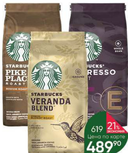
Кофе STARBUCKS в ассортименте жареный молотый; в зёрнах, 200 г