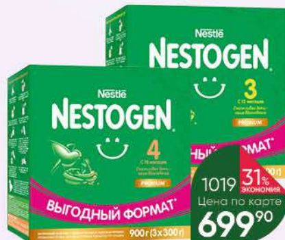
Напиток NESTLE Nestogen Детское молочко молочный сухой быстрорастворимый №3 с 12 мес.; №4 с 18 мес., 900 г