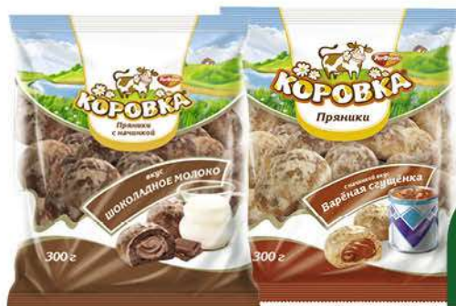
Пряники РОТФРОНТ Коровка шоколадное молоко; с начинкой из варёной сгущёнки, 300 г