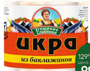
Икра овощная УГОЩЕНИЕ СЛАВЯНКИ из баклажанов, 545 г