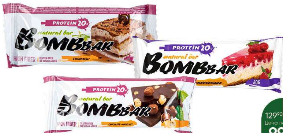
Батончик BOMBBAR в ассортименте, 60 г