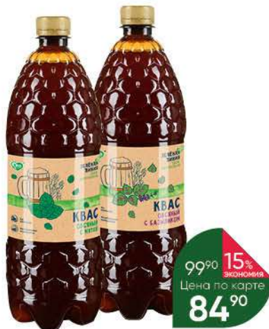
Квас ЗЕЛЁНАЯ ЛИНИЯ овсяный с базиликом; мятой, 1 л

159 90 13% экономия Цена по карте 139 90