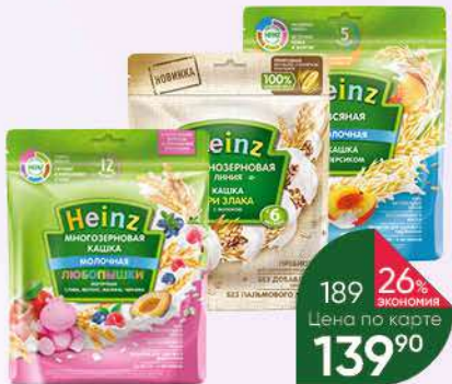
Каша HEINZ в ассортименте, 180-200 г