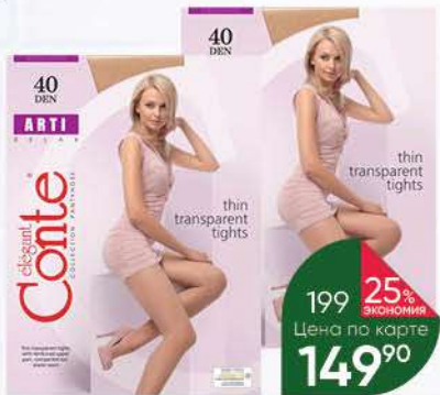
Колготки CONTE Elegant Arti 40 natural; nero, p. 2; 3; 4

319 90 31% Экономия Цена по карте 219 90