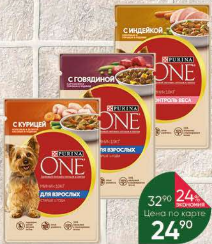
Корм для собак PURINA One консервы в ассортименте, 85 г