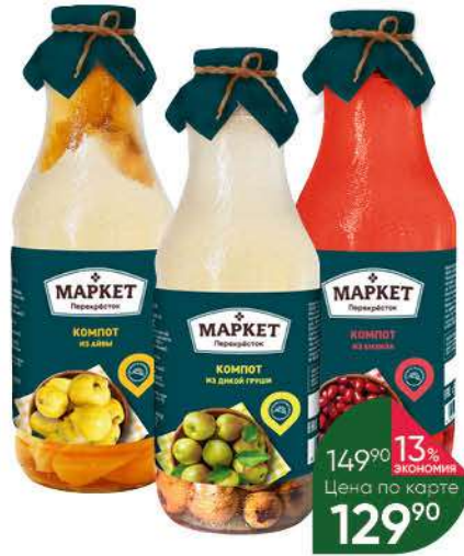
Компот МАРКЕТ ПЕРЕКРЁСТОК из айвы; дикой груши; кизила, 1050 г; 1000 мл

149 90 13% экономия Цена по карте 129 90