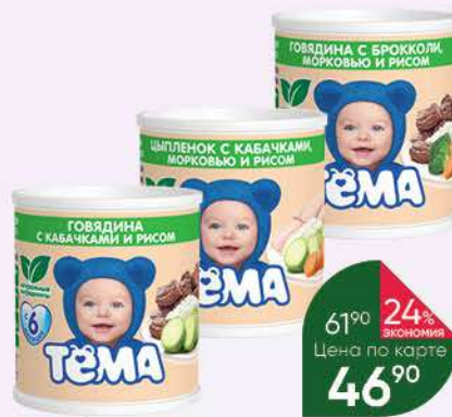
Пюре ТЕМА в ассортименте, 100 г