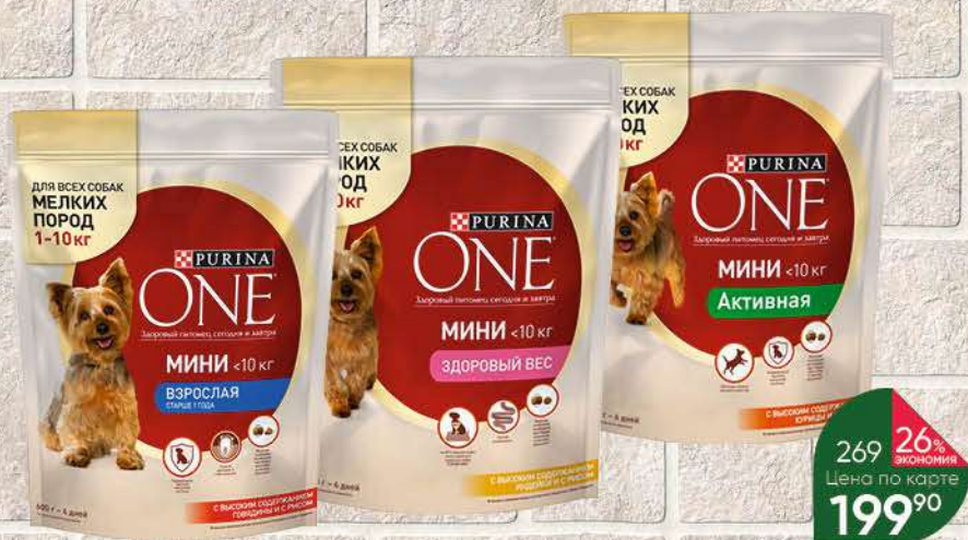
Корм для собак PURINA One сухой в ассортименте, 600 г