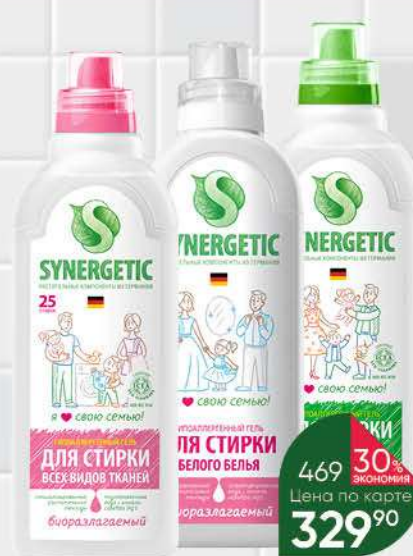
Гель для стирки SYNERGETIC в ассортименте, 0,75 л