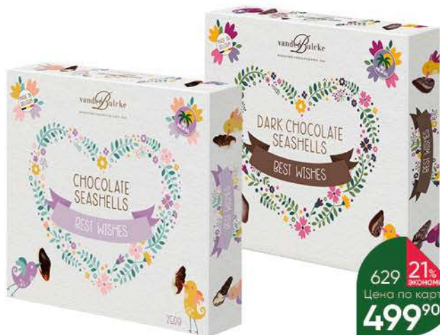
Конфеты VANDENBULCKE Морские ракушки шоколадные; с пралине, 250 г