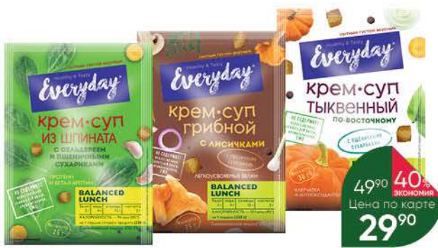
Крем-суп EVERYDAY Грибной с лисичками и пшеничными сухариками; Пряный тыквенный по-восточному; Из шпината с сельдереем и пшеничными сухариками, 25-30 г