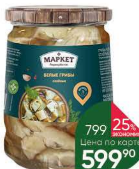
Грибы МАРКЕТ ПЕРЕКРЁСТОК Белые солёные, 540 г