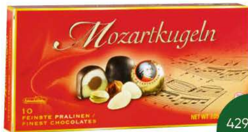
Конфеты SCHLUCKWERDER Mozartkugeln шоколадные, 200 г