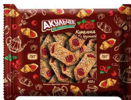
Печенье АКУЛЬЧЕВ Купелька сдобное с брусничкой, 400 г