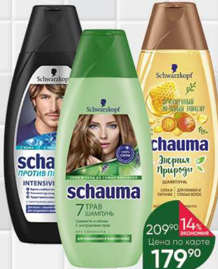
Шампунь для волос SCHAUMA в ассортименте, 380-400 мл

194 90 23% экономия Цена по карте 149 90