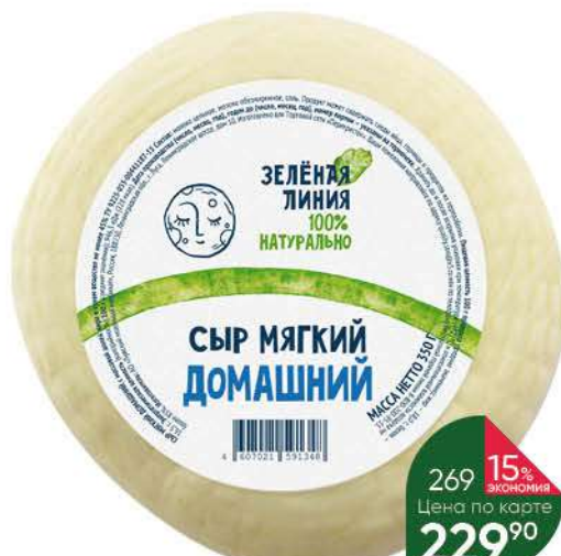
Сыр мягкий ЗЕЛЁНАЯ ЛИНИЯ Домашний 45%, 350 г

154 90 23% экономия Цена по карте 119 90