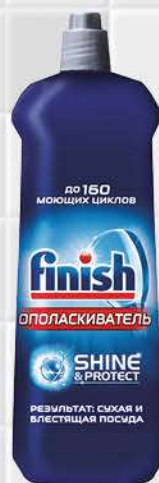
Ополаскиватель FINISH для посудомоечных машин, 800 мл