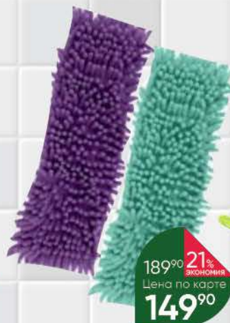
Насадка для швабры HOME STORY шенилл; микрофибра