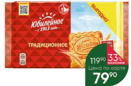
Печенье ЮБИЛЕЙНОЕ витаминизированное традиционное, 403 г