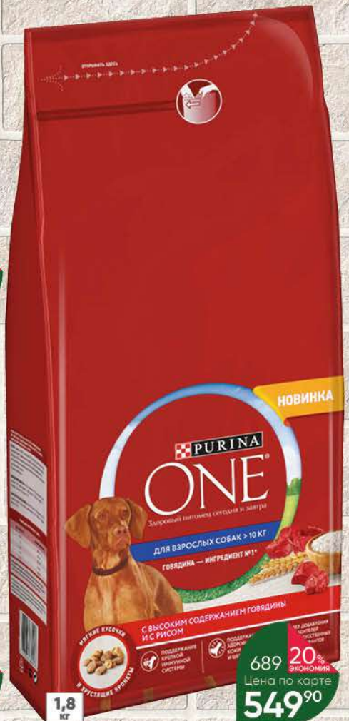
Корм для взрослых собак PURINA One Говядина с рисом сухой для крупных пород, 1,8 кг