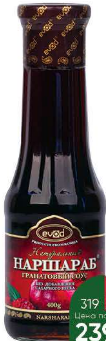
Соус EVOD Наршараб гранатовый, 400 г

149 90 20% экономия Цена по карте 119 90