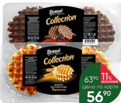
Вафли BONTE Collection Парижские бисквитные; бисквитные в глазури, 90-110 г