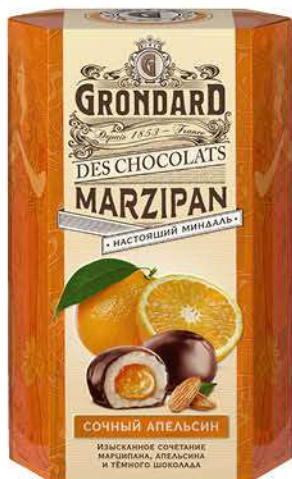
Конфеты GRONDARD апельсин, 140 г