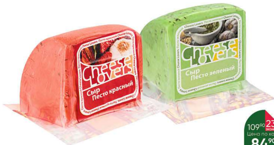
Сыр CHEESE LOVERS Песто зелёный; красный 50%, 100 г