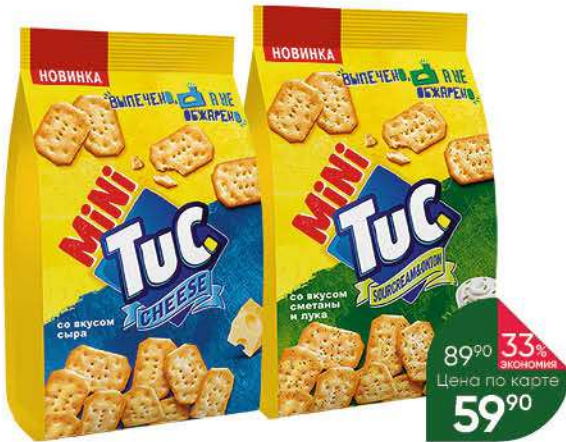
Крекер TUC Mini со вкусом сметаны и лука; сыр, 100 г