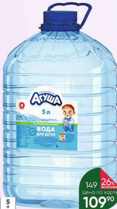
Вода АГУША Зелёная долина для детей, 5 л