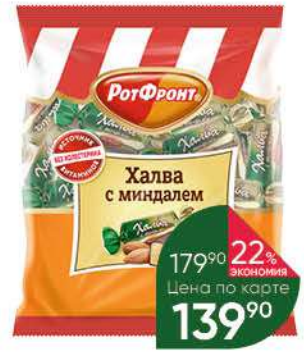
Халва РОТФРОНТ с миндалём, 250 г