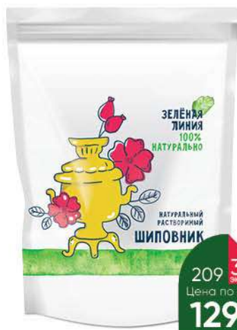
Напиток ЗЕЛЁНАЯ ЛИНИЯ Шиповник натуральный растворимый, 75 г