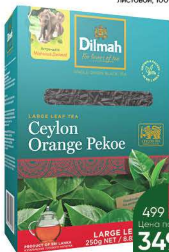
Чай чёрный DILMAH листовой, 250 г