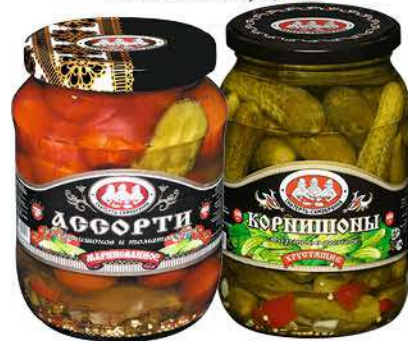
Ассорти; Огурцы СКАТЕРТЬ САМОБРАНКА корнишоны + черри; Корнишоны маринованные, 480 г; 500 мл; 720 мл

169 90 29% экономия Цена по карте 119 90