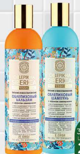
Шампунь; Бальзам NATURA SIBERICA облепиховый для ослабленных и повреждённых волос, 400 мл

209 90 14% экономия Цена по карте 179 90