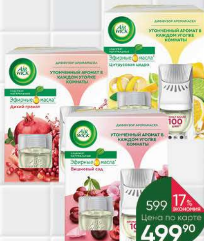
Диффузор аромасел AIR WICK со сменным флаконом Дикий гранат; Вишнёвый сад; Цитрусовая цедра, 130 г