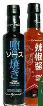
Соус SANBONSAI Терияки; Чили острый, 300 г