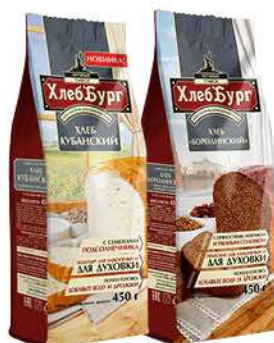
Смесь мучная ХЛЕББУРГ Хлеб Бородинский; Кубанский, 450 г