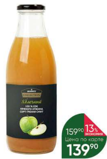
Сок MARKET COLLECTION из яблок сорта Грени Смит, 1 л

149 90 13% экономия Цена по карте 129 90