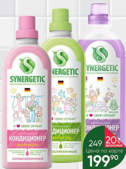
Кондиционер для белья SYNERGETIC в ассортименте, 1 л