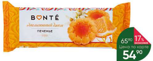
Печенье BONTE Апельсиновый джем сдобное, 100 г