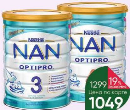
Напиток Напиток NESTLE Nan Optipro Детское молочко с пребиотиками №3 с 12 мес.; №4 с 18 мес., 800 г