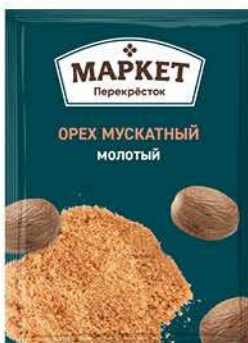
Специи МАРКЕТ ПЕРЕКРЁСТОК Орех мускатный молотый, 18 г