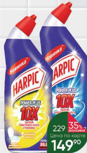
Средство для чистки унитаза HARPIC Power Plus original; лимонная свежесть, 450 мл