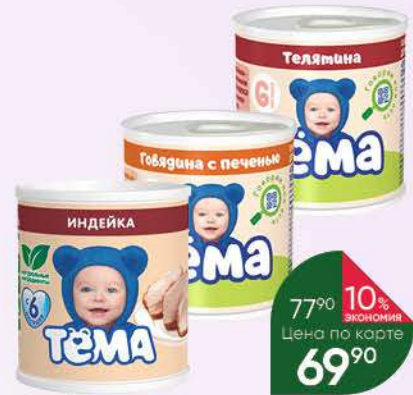
Пюре ТЕМА в ассортименте, 80-100 г