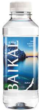
Вода БАЙКАЛ430 Байкальская питьевая глубинная негазированная, 0,45 л