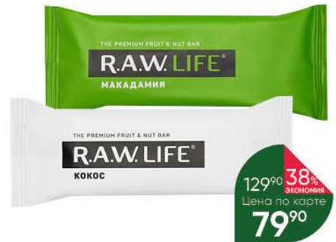
Батончик фруктово-ореховый R.A.W. Life кокос; макадамия, 47 г