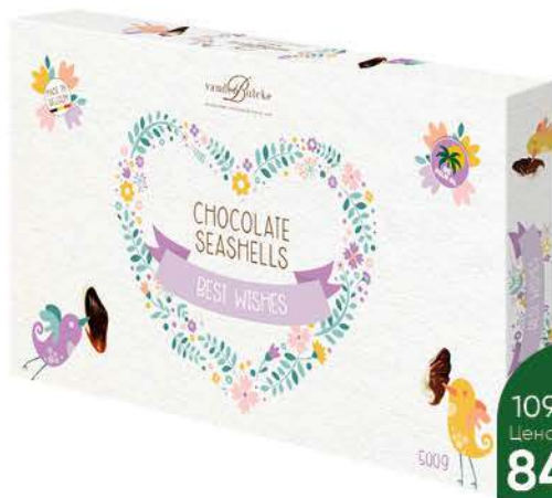
Конфеты VANDENBULCKE Морские ракушки, 500 г