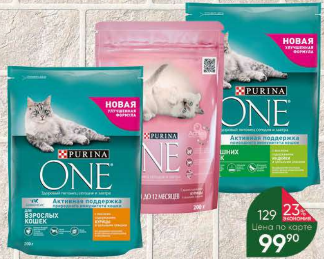
Корм для кошек PURINA One сухой в ассортименте, 180-200 г