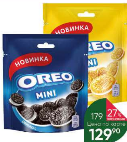
Печенье OREO Mini с какао и начинкой с ванильным вкусом; Mini Golden с начинкой с ванильным вкусом, 100 г