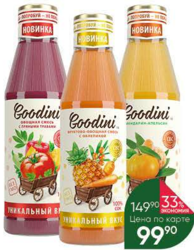
Сок GOODINI в ассортименте, 0,75 л