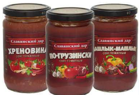
Соус томатный СЛАВЯНСКИЙ ДАР Хреновина; По-грузински; Шашлык-машлык, 360 г