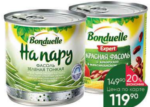
Фасоль BONDUELLE зелёная тонкая на пару, 295 г; Эксперт Красная с кукурузой в мексиканском соусе, 430 г

149 90 20% экономия Цена по карте 119 90