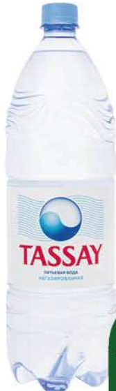
Вода питьевая TASSAY негазированная, 1,5 л