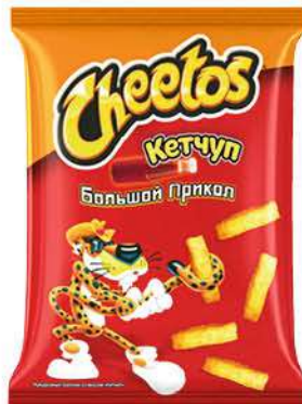
Кукурузные палочки СНЕЕТOS кетчуп, 85 г