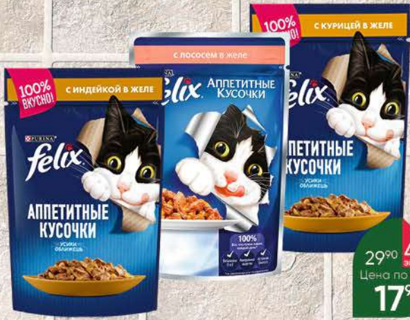
Корм для кошек PURINA Felix консервы в ассортименте, 48-85 г