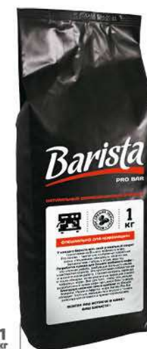
Кофе BARISTA Pro Bar в зёрнах, 1 кг