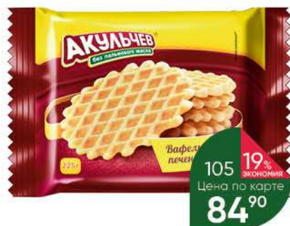
Печенье вафельное АКУЛЬЧЕВ рассыпчатое, 225 г