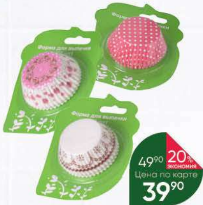
Форма для выпечки ZIB GROUP, 50 шт.