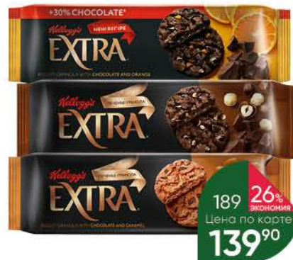
Печенье-гранола KELLOGG'S Extra шоколад и карамель; шоколад и фундук; шоколад и апельсин, 150 г