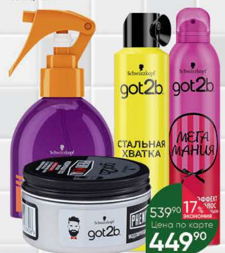
Средство для укладки волос GOT2B Моделирующая паста; Утюжок выпрямляющий термозащитный спрей; Лак для волос в ассортименте, 100-300 мл

499 90 16% экономия Цена по карте 419 90