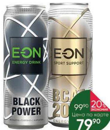
Энергетический напиток E-ON Black Power Original; BCAA 2000 Sport Support тонизирующий газированный, 0,45 л