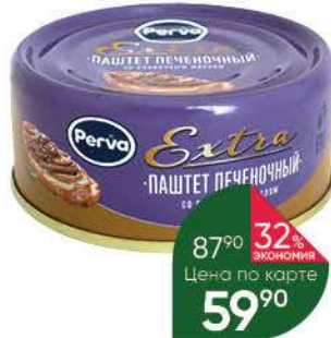
Паштет PERVA Extra индиюшной печени, 90 г