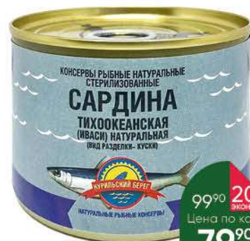
Сардина тихоокеанская КУРИЛЬСКИЙ БЕРЕГ Иваси натуральная, 250 г