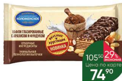
Вафли КОЛОМЕНСКОЕ с арахисом и фундуком, 160 г