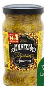
Горчица МАХЕЕВЪ зернистая, 190 г