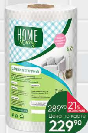
Салфетки HOME STORY протирачные, 100 шт.