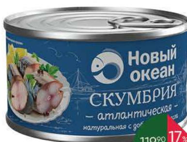
Скумбрия НОВЫЙ ОКЕАН натуральная с добавлением масла, 240 г

159 90 25% экономия Цена по карте 119 90