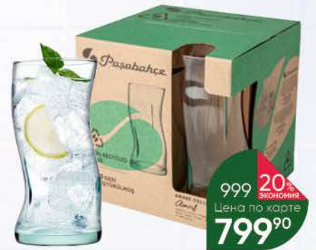
Стакан PASABAHCE Recycled Amorfi 440 мл, 4 шт.