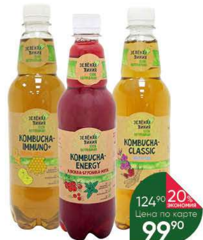
Напиток чайный ЗЕЛЁНАЯ ЛИНИЯ Kombucha в ассортименте, 0,555 л