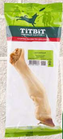
Лакомство ТИТВИТ баранья нога, 1 уп.