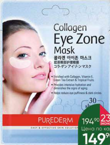
Маска PUREDERM для кожи вокруг глаз коллагеновая, 1 шт.

194 90 23% экономия Цена по карте 149 90