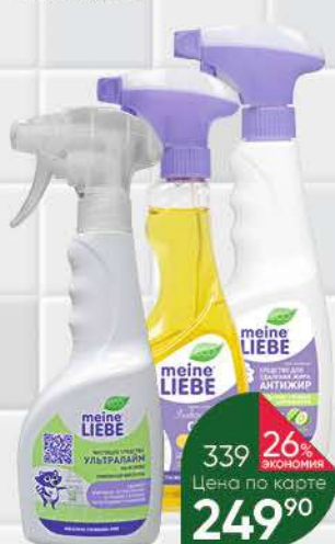
Средство чистящее MEINE LIEBE в ассортименте, 500 мл