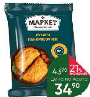
Сухари панировочные MARKET ПЕРЕКРЕСТОК классические, 150 г