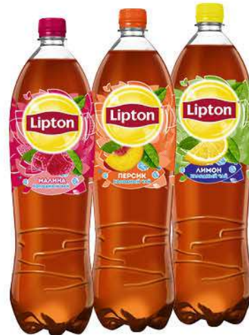
Холодный чай LIPTON в ассортименте, 1,5 л

159 90 19% экономия Цена по карте 129 90