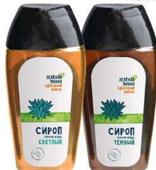
Сироп ЗЕЛЁНАЯ ЛИНИЯ голубой агавы светлый, тёмный, 240 г