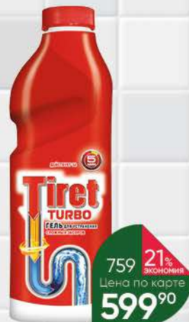
Гель TIRET Turbo для очистки канализационных труб, 1 л