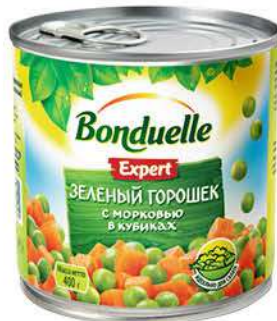
Горошек BONDUELLE Эксперт зелёный с морковью, 400 г