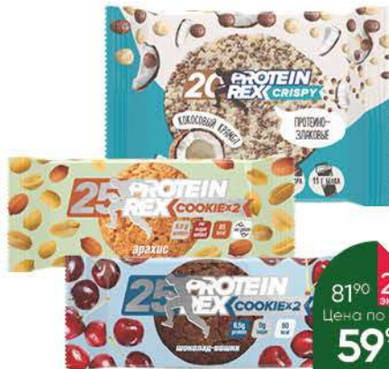
Батончик; Печенье PROTEIN REX в ассортименте, 50–60 г

Заранее сварите рыбный бульон. Коктейль из морепродуктов отварите в кипящей подсоленной воде. Рис промойте, обсушите. Репчатый лук почистите, измельчите. Пармезан для подачи натрите на тёрке. Лук обжарьте до прозрачности на смеси двух масел. Добавьте рис, обжарьте при постоянном помешивании 2–3 минуты. Введите вино. Помешивая, дождитесь выпаривания. Небольшими порциями влейте в рис рыбный бульон, регулярно перемешивайте крупу. Через 15 минут с начала приготовления выложите морепродукты, добавьте сливки, посолите и активно перемешайте. Готовьте 5–7 минут.