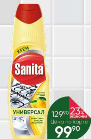
Крем чистящий SANITA Универсал Сила лимона, 600 г