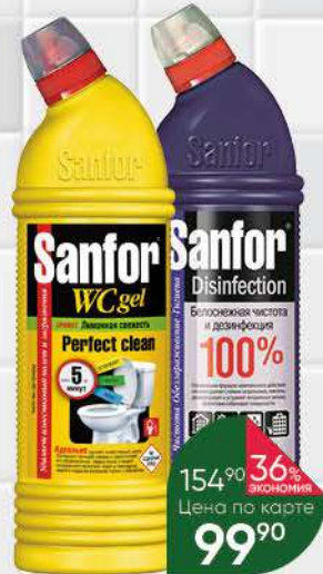
Средство чистящее SANFOR универсальное; для унитаза лимонная свежесть, 750 г