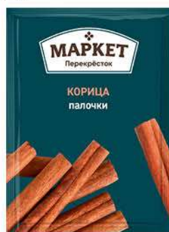
Специи МАРКЕТ ПЕРЕКРЁСТОК Корица палочки, 16 г