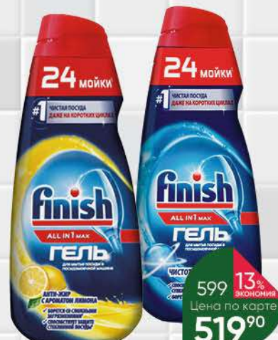
Гель FINISH для посудомоечных машин All in 1 max Лимон; Чистота до блеска, 600 мл