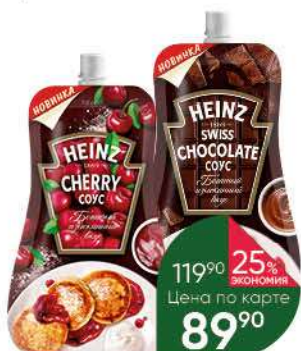
Соус HEINZ Cherry деликатесный вишнёвый; Swiss Chocolate десертный со швейцарским шоколадом, 230 г

129 90 19% экономия Цена по карте 104 90