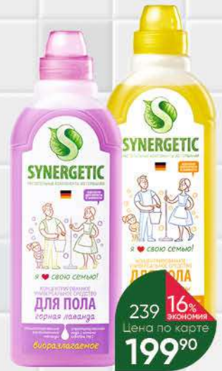
Средство для мытья поверхностей SYNERGETIC горная лаванда; полевые цветы биоразлагаемое, 0,75 л