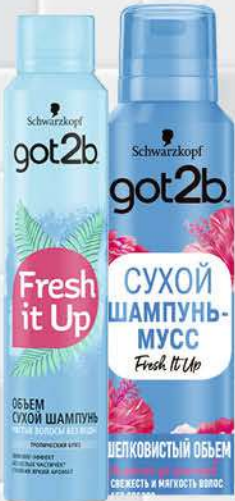
Сухой шампунь для волос GOT2B Fresh it Up тропический бриз; мусс шелковистый объём, 150-200 мл

359 90 25% экономия Цена по карте 269 90