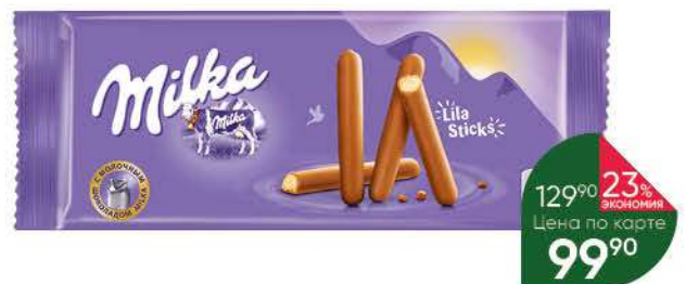
Палочки-печенье MILKA Lila Sticks покрытые молочным шоколадом, 112 г

Товар представлен не во всех супермаркетах «Перекрёсток».