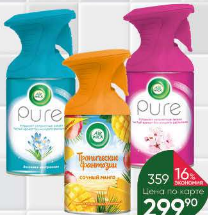
Освежитель воздуха AIR WICK Pure в ассортименте, 250 мл