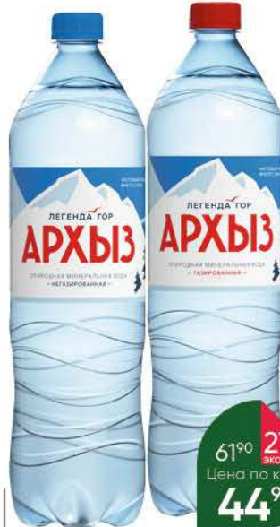
Вода АРХЫЗ Легенда гор газированная; негазированная, 1,5 л