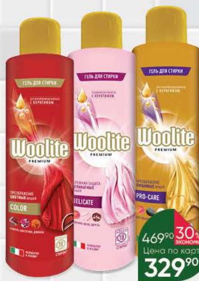
Гель для стирки WOOLITE Premium в ассортименте, 900 мл