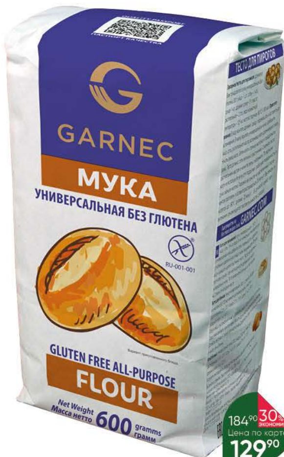
Мука GARNEC Универсальная без глютена, 600 г

184 90 30% ЭКОНОМИЯ Цена по карте 129 90