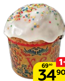
Кулич ВОСКРЕСНЫЙ (БКК), 100 г