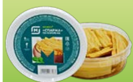
Спаржа МАГНИТ, по-корейски, 200 г