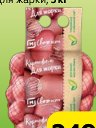
Картофель МАГНИТ СВЕЖЕСТЬ для жарки, 3 кг