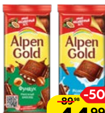
Шоколад ALPEN GOLD, в ассортименте*, 80 г/85 г/90 г