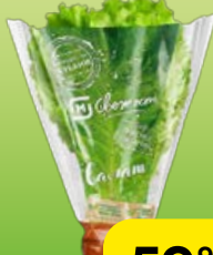
Салат листовой МАГНИТ СВЕЖЕСТЬ, в горшочке, 1 шт.