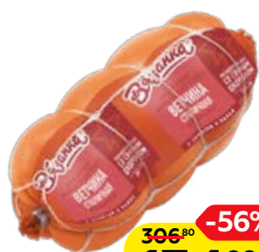
Ветчина ВЯЗАНКА, Столичная (Стародвор- ские колбасы), 500 г