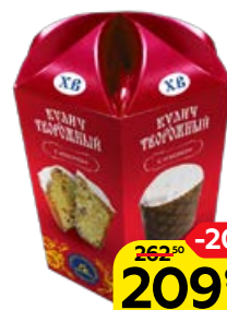
Кулич ТВОРОЖНЫЙ, 330 г